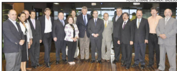
Prefeitos dos municípios que assinaram contrato com o Badesul