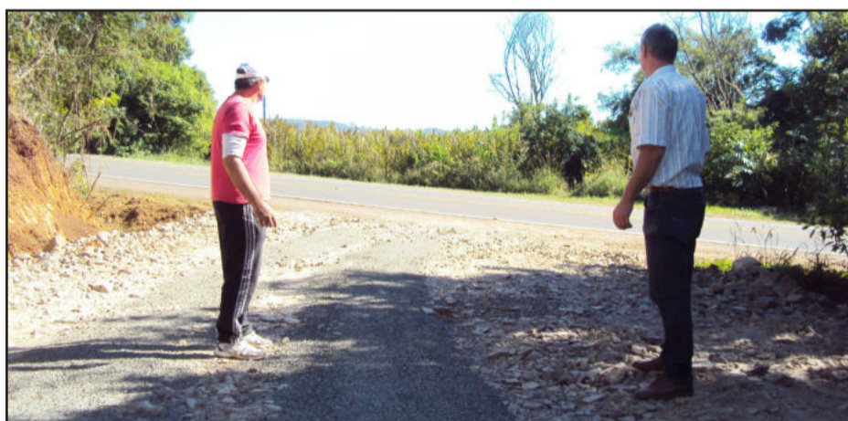
Nova estrada entre Paissandu e Berlim Fundos acessa à Rota do Sol

Na segunda-feira, dia 02, Marasca esteve com o governador Tarso Genro, em Taquari, oportunidade em que reforçou o pedido para construção da Escola Estadual e enalteceu o convite para que o Governador esteja presente no início da obra. "Falei em reservado com o Tarso e ele confirmou para os próximos dias o começo da construção da Escola Estadual e confirmou que virá ao Município para prestigiar o momento", destacou Marasca.