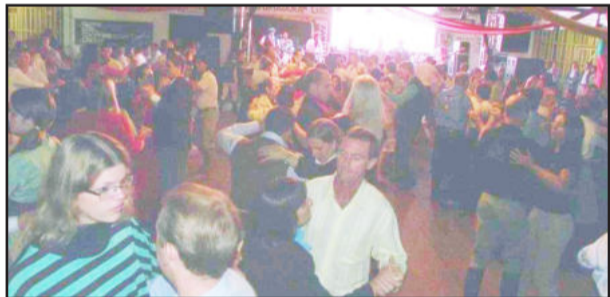
Grupo Os Monarcas animou o fandango