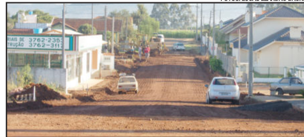
Rua Edvino Dickel, no Bairro Alesgut, recebe a terraplenagem e camada de brita