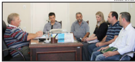
Executivos tiveram reunidos com prefeito para anunciar investimento de R$ 20 milhões

De acordo com o prefeito, a administração municipal pretende conceder todos os auxílios possíveis para beneficiar a empresa, dentre eles incentivos fiscais. A empresa precisa começar a produzir e se habilitar para receber. O retorno pode ser de até 50% do valor adicionado.