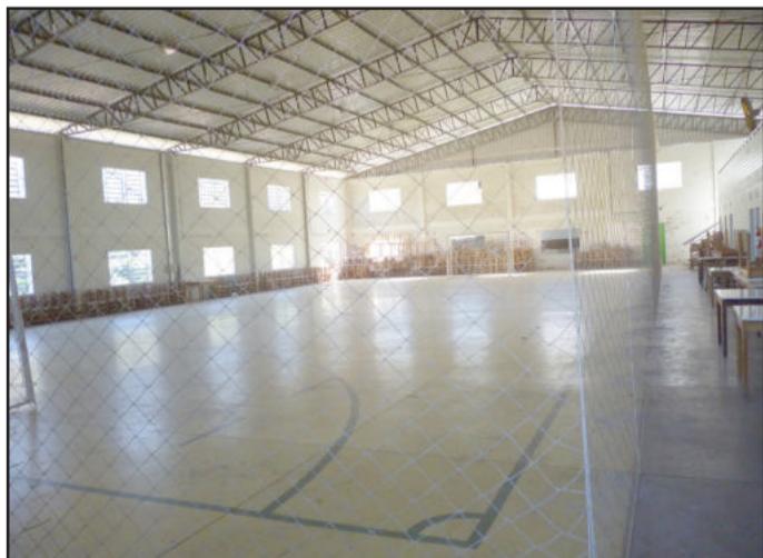
Na parte interna do ginásio, novas redes e outras melhorias foram realizadas