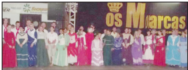
Mais uma turma de casais realizou formatura na sexta