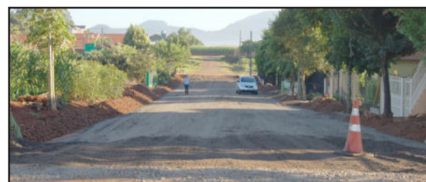
Rua Tancredo Neves já tem a primeira camada de brita

folha Popular Ligue (51) 3762-2440 e assine!