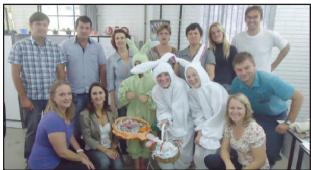
Coelhos da EMEF Leopoldo Klepker apareceram no Centro Administrativo