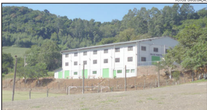
Limpeza da área deu novo visual e ampliou espaço de estacionamento na sede do Palmeiras

No ano de 2012, o Esporte Clube Palmeiras estará completando 50 anos. Está sendo preparada uma programação para o mês de agosto para festividades entre as quais confraternização de ex-jogadores, homenagem aos fundadores e baile.