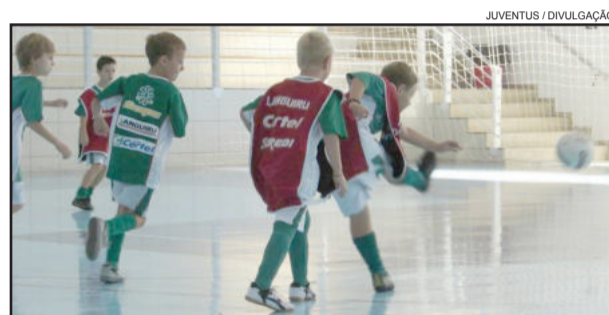
Ginásio da Associação da Água de Languiru passará a contar com treinos da AERC Juventus

A partir deste mês de abril, a AERC Juventus passa a treinar em novo local, dias e horários diferentes no Bairro Languiru. Através de uma parceria entre as entidades AERC Juventus e ASTF, abre-se esta nova possibilidade de treinamentos junto ao ginásio da Associação da Água de Languiru para os alunos de ambas as entidades esportivas e recreativas.