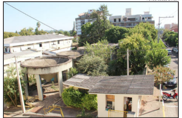
Área da futura sede do Fórum Trabalhista, localizada junto ao complexo da Ambev, no Centro

O terreno onde será construído o Fórum, foi doado pela Prefeitura, e tem cerca de 1.500m 2 e está localizado na Rua Pinheiro Machado, entre as transversais Coronel Flores e Borges de Medeiros, bairro Centro. A Vara do Trabalho de Estrela hoje funciona na Rua Coronel Müssnich, 36, jurisdicionando os municípios de