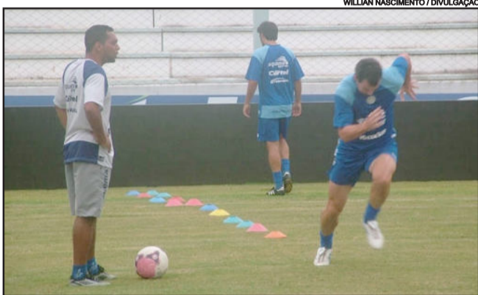
Lajeadense treinou firme e forte para encarar o Ypiranga

Domingo de Páscoa. O apoio do torcedor sempre foi essencial para o Alvi Azul em momentos decisivos. Para tanto, ingressos promocionais foram colocados à venda.