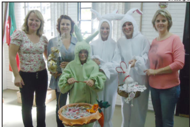
Coelhos da EMEF Leopoldo Klepker apareceram no Centro Administrativo

Na tarde desta segunda-feira, dia 2 de abril, uma turma de coelhos, da Escola Municipal Leopoldo Klepker, do Bairro Alesgut, apareceu no Centro Administrativo. Acompanhados dos professores, os alunos-coelhos visitaram a Secretaria de Educação, o gabinete do prefeito, o gabinete da primeira-dama e demais repartições do Centro Administrativo. Desejaram uma feliz e abençoada Páscoa.