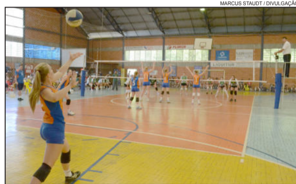
No saque inicial das competições da temporada 2012, Univates/Avates já garante o título de pentacampeã do Aberto de Estrela

As equipes Languiru/CML/Avates/Pref. Estrela acumulou quatro vitórias, nas três partidas da fase classificatória, resultados: 2x1 na Sogipa e 2x0 sobre Sinodal e o time de Veranópo-