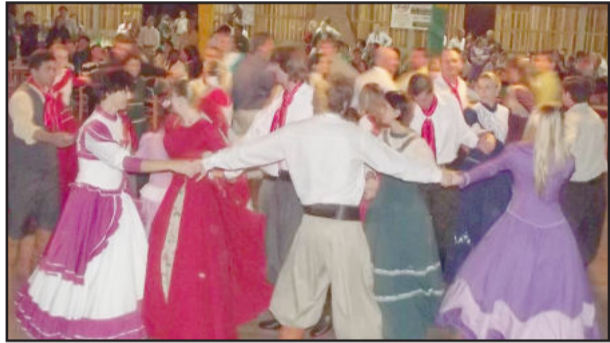
Fandango foi animado e atraiu peões e prendas para a pista