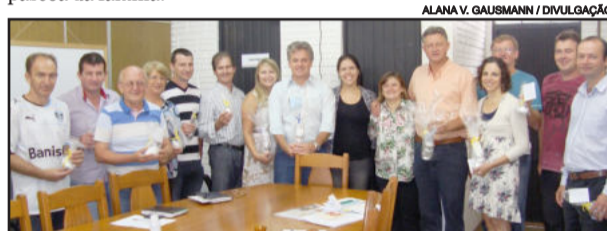
Secretários e prefeito receberam ovos e coelhos de chocolate produzidos nas oficinas do CRAS

Os ovos foram produzidos da seguinte forma: waffer de todos os sabores foram triturados e misturados ao chocolate derretido. Após o preparo, restou apenas dar forma ao chocolate e colocar a embalagem. Uma forma rápida, gostosa, criativa e econômica de garantir a páscoa da família.