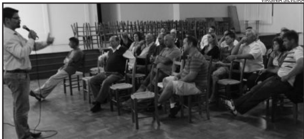
Audiências públicas definem prioridades das comunidades e bairros para o ano de 2013

Durante o ano, os representantes eleitos pelas comunidades e bairros acompanharão a elaboração da LDO 2013, defendendo as prioridades eleitas em audiência, trazendo as demandas das regiões e compreendendo o processo de elaboração da Lei. Veja a relação de prioridades e representantes de cada audiência no site oficial do Município ( www.carlosbarbosa.rs.gov.br ).