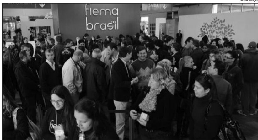
Fiema Brasil 2010 atraiu público de 22.000 pessoas

Ao superar todas as expectativas dos organizadores em público, o seminário Negócios e oportunidades de investimento no setor do Meio Ambiente no Brasil, realizado na embaixada do país em Roma, no dia 28 de fevereiro, deixou algumas certezas. A primeira delas é que o território brasileiro,