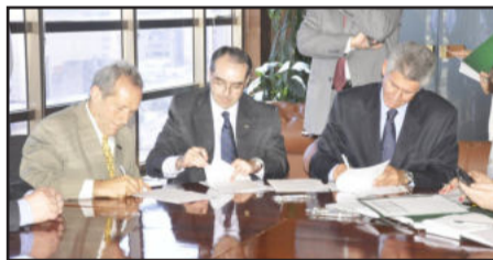
Prefeito Cirano Cisilotto firma contrato