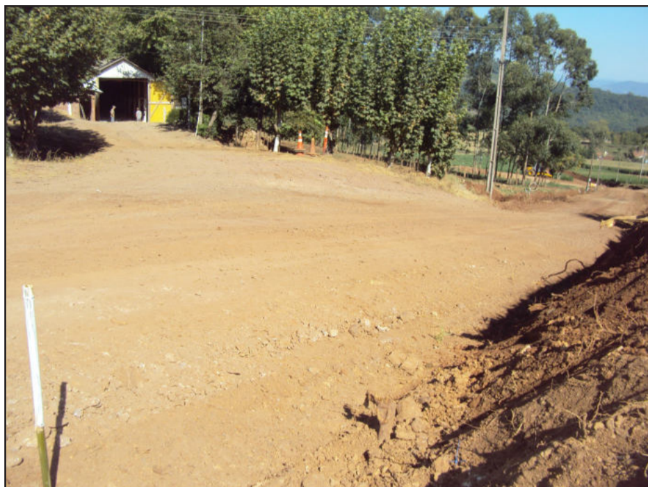
Asfalto da Linha Mólke está na fase de terraplanagem e limpeza. Investimento no interior é constante