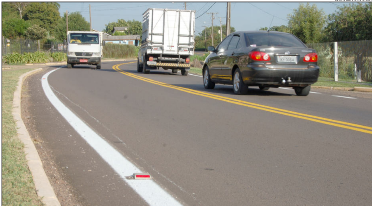
Melhorias na ERS-419 foram executadas pelo Daer, como a pintura da sinalização

A 11ª Superintendência Regional do Daer, com sede em Lajeado, realizou melhorias na ERS-419, rodovia que interliga Teutônia a Poço das Antas. A equipe de obras do Daer realizou a roçada das laterais da rodovia, facilitando a identi-