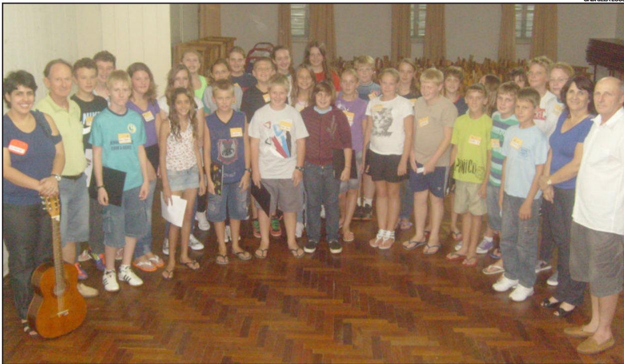
Uma parte do grupo ensaia às sextas-feiras