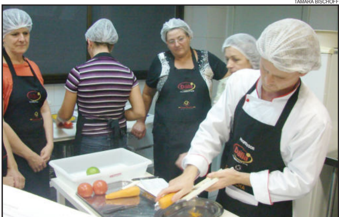
Aulas ensinam dez receitas de saladas

Inscrições podem ser efetuadas, até o dia 18 de abril, na Secretaria de Extensão e Pós-Graduação, sala 110 do Prédio 1, ou pelo site www.univates.br/cursosdeextensao . Mais informações podem ser obtidas pelo telefone (51) 3714-7000, ramal 5336, ou pelo e-mail gastronomia@univates.br .