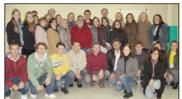
Participantes do curso

De 24 a 26 de maio a Câmara de Indústria e Comércio (CIC) promoveu o curso "O êxito através das vendas". Com a participação de 34 pessoas, a formação esteve dividida em duas questões-chaves, a parte humana (autoconhecimento, valores básicos para ser bem sucedido pessoal e profissionalmente) e a parte técnica (da abertura ao fechamento em vendas, técnicas de comunicação, as necessidades básicas das pessoas).