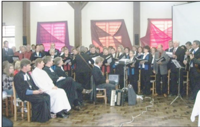
Coral da Paróquia animou o culto