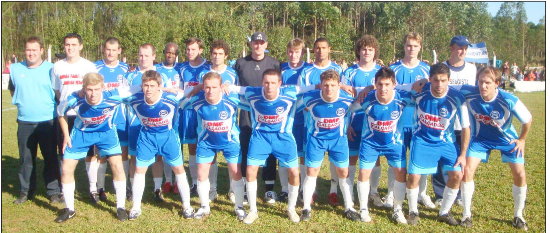
Equipe conquistou o título inédito no feriado de quinta-feira. Jogo no Loteamento 8 teve 5 gols e uma prorrogação com final tumultuado. Leia no caderno de esportes

Baile dos Namorados 11/06 2010 SEXTA-FEIRA Início: 22:30h