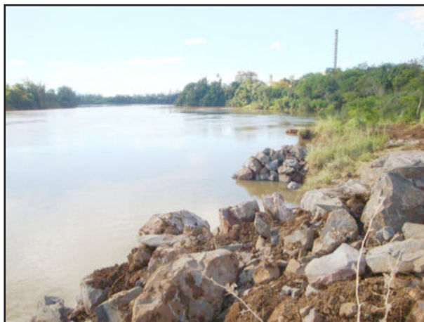
Obra deverá ser concluída até o final deste mês

1ª Ação - Construção de molhes (9m x 4m) de largura na porção plana superior, declividade média de 45° até o leito do rio. Volume