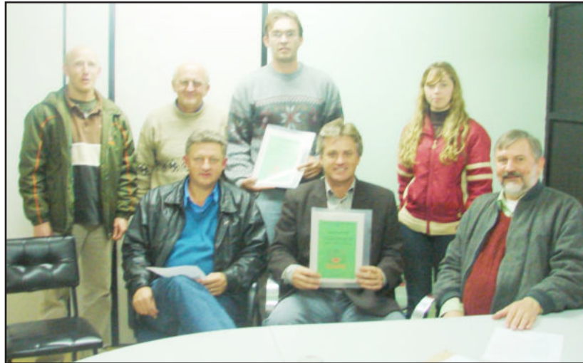
Capa e Prefeitura celebram renovação de convênio

Dados recentes publicados pela Agência Nacional de Vigilância Sanitária (Anvisa) mostram que mais de 64% das amostras de diversos produtos agrícolas analisados apresentaram elevados índices de contaminação por agrotóxicos, inclusive de alguns de uso não permitido. A agricultura orgânica surge como uma ótima alternativa para a amenização desse problema, pois fundamenta-se em princípios agroecológicos e de conservação de recursos naturais. O principal deles é o respeito à natureza.