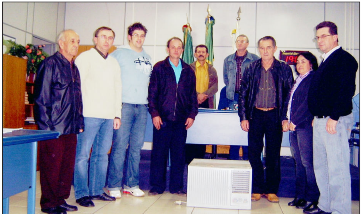
Vereadores doaram ar-condicionado para a Saúde

A Câmara de Vereadores de Paverama realizou sessão, nesta quarta-feira, dia 2, aprovando sete projetos de lei. Seis dos legisladores municipais utilizaram a tribuna. Entre os destaques está o início das obras de asfaltamento na localidade de Fazenda São José. Ainda foi destacado as possibilidades de acesso devido as obras, que são os seguintes trajetos: desvio pela localidade de Santana, passando por Posses e Canabarro; ou Linha Brasil, sentido Linha Germano, pelo asfalto se chega em Canabarro. Foi realizada também a doação de um ar-condicionado para a Secretaria de Saúde.