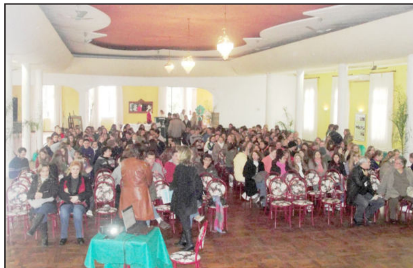
Biodiversidade Regional foi o tema de abertura do primeiro dia do evento