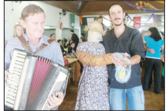
Muita animação no evento