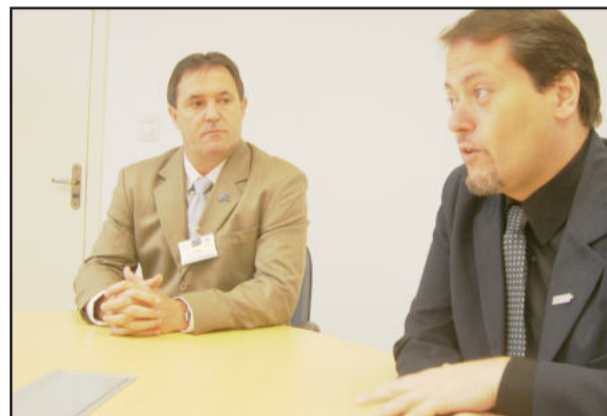
Callegaro: "A vinda de Bolzan traz mais credibilidade aos processos internos"