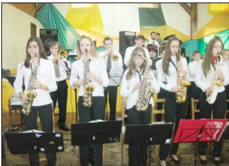
Orquestras de Picada Café e 25 de Julho