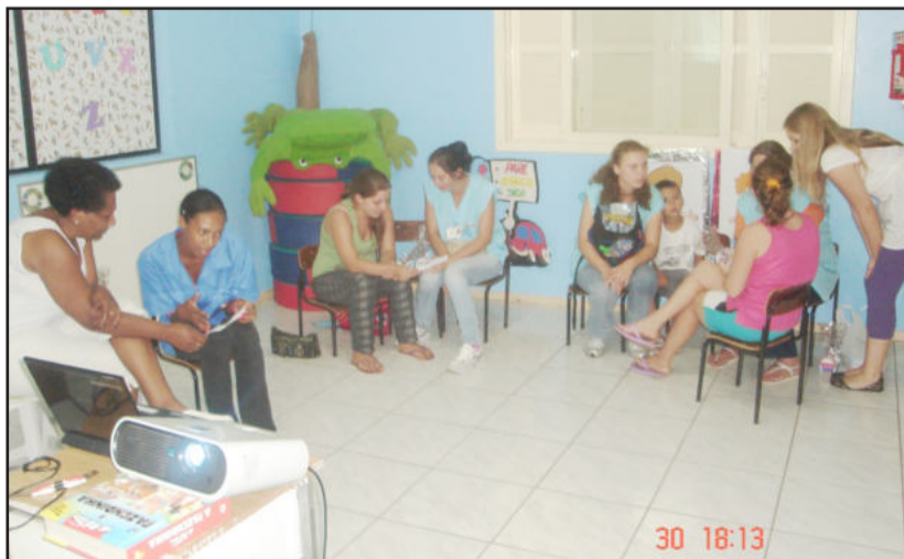
Projetos na Escola Cirandinha