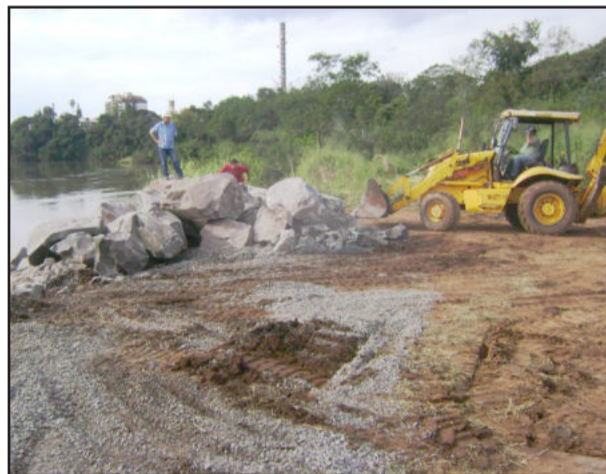
Pedras já estão sendo colocadas para formar molhe

Os objetivos do Parque Municipal da Lagoa são os seguintes: conservar a biodiversidade local; conservar os recursos hídricos através da proteção e recuperação da mata ciliar e através do tratamento do esgoto que chega à lagoa e ao Rio Taquari; preservar a área de mata existente; recuperar e conservar a área da margem do Rio Taquari que se encontra em estado erosivo crítico; tornar a área um refúgio para a fauna local, propiciando condições para que muitas espécies de animais possam se reproduzir; estabelecer atividades de pesquisa e monitoramento, principalmente relacionadas à recuperação de áreas degradadas, conhecimento que poderá ser usado para recuperação de outras áreas críticas na própria Bacia Hidrográfica do Rio Taquari; promover o desenvolvimento de atividades ligadas à educação ambiental.