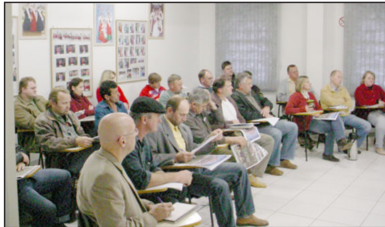
Secretários e vereadores assistiram explicações