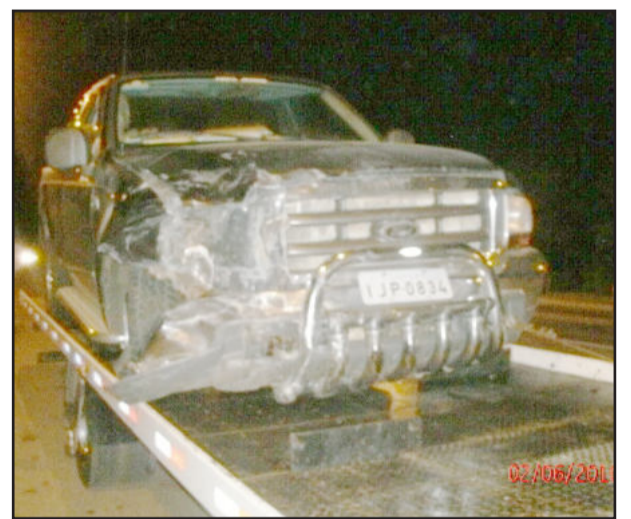
Colisão entre Uno e uma F-250 em Marques de Souza