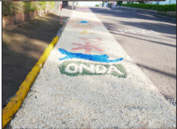
Tapetes: expressão de arte e fé