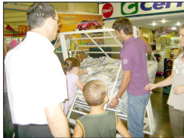
Sorteio na loja do Unicshopping