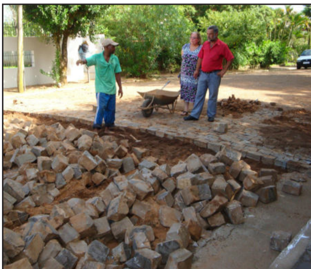
Visita à obra de conserto do calçamento com paralelepípedos na rua Pinheiro Machado, no Bairro Cristo Rei

A prefeita se mostrou extremamente satisfeita com o andamento dos trabalhos e aproveitou para parabenizar as equipes e servidores envolvidos nas obras, pela abnegação e excelente desempenho. Irene Terezinha Heim Veloso da Silveira assumiu o governo municipal na manhã do dia 04 de janeiro, sendo que a transmissão do cargo novamente ao prefeito Celso Brönstrup aconteceu na manhã desta quarta-feira.