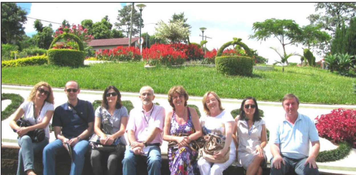
Avaliadores estiveram em Colinas na terça-feira