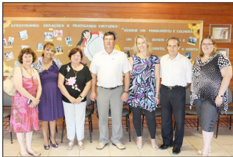
Representantes de Garibaldi no Projeto Florescer