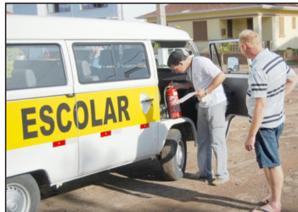
Vários itens são verificados