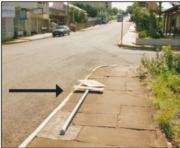
Placa derrubada no Bairro Languiru

A Secretaria Municipal de Obras, Viação e Transportes registrou mais um fato lamentável de vandalismo contra uma placa de sinalização de trânsito. No entroncamento das ruas 25 de Julho e João Lavrinenco, no Bairro Languiru, foi dobrada até o chão uma placa de trânsito de ferro que indica que a 100 metros tem uma lombada física (quebra-molas). Em outras oportunidades também houve situações do gênero, com as placas de ferro sendo dobradas até quebrarem.