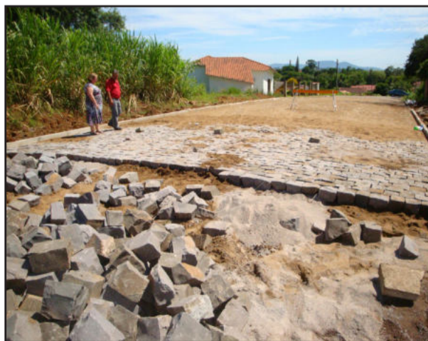
Visita à obra de construção do calçamento com paralelepípedos na rua Senador Lauro Müller, entre os bairros Oriental e das Indústrias