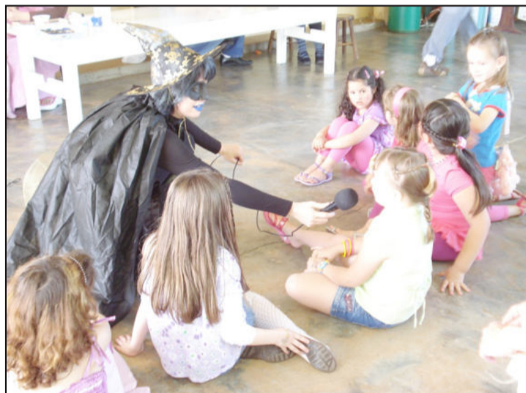
Ações em datas especiais marcaram atividades, como na Páscoa, quando foram doados ovos de chocolate

"Só temos a agradecer a todos que participaram com doações e aos voluntários que se engajaram nas diversas ações. Com certeza estas atitudes têm contribuído para um