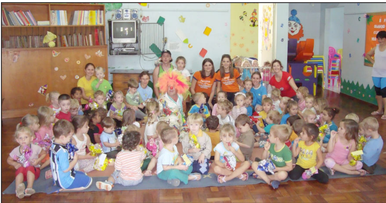
Voluntários têm se dedicado a inúmeras ações, principalmente para divertir o dia-a-dia das crianças nas creches

A Organização Não-Governamental (ONG) Parceiros Voluntários de Teutônia está divulgando seu relatório de ações organizadas em 2009, que fechou o ano com 14 novos voluntários cadastrados, totalizando 47 pessoas ativas e engajadas nas ações. As atividades beneficiaram mais de 800 pessoas de 16 organizações da sociedade civil.