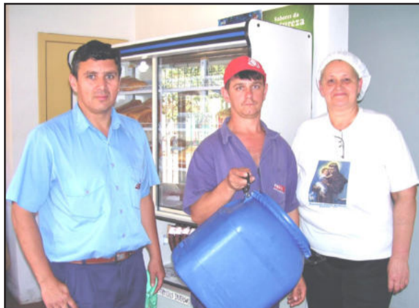
Projeto já recolheu mais de 600 litros de azeite

O óleo de fritura causa sérios danos ao meio ambiente, principalmente nos recursos hídricos, solo e provoca entupimentos nas redes coletoras de esgoto. Para evitar esses problemas, cada um pode dar sua