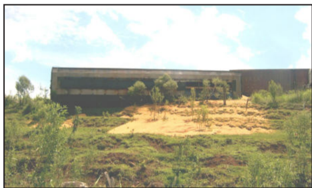
Vagão de trem de carga descarrila em Colinas

Uma grande quantidade do produto que era carregado no vagão, provavelmente milho, ficou espalhado no local. Em consequência disso, o trilho que corta Colinas ficou interrompido e o trânsito foi desviado para Teutônia. Os técnicos responsáveis pela empresa estiveram no local no final da tarde do mesmo dia.