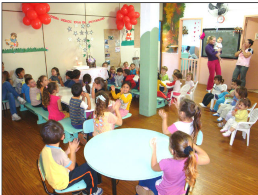
Emeis iniciam ano letivo dia 08 de fevereiro

Mais informações são possíveis pelos telefones (51) 3981-1014 ou (51) 3981-1015, ou diretamente na Smectur, cuja sede localiza-se no segundo piso do prédio da Prefeitura de Estrela.