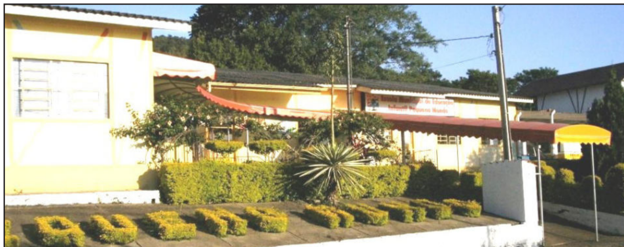
Escola Municipal de Educação Infantil Pequeno Mundo

"Desde já agradecemos aqueles pais que, mesmo trabalhando, colaboraram durante o mês de janeiro e permaneceram com seus filhos em casa aos cuidados de avós, tios ou outras pessoas, uma vez que a EMEI atendeu com um número reduzido de funcionárias", destaca da coordenação da escola.