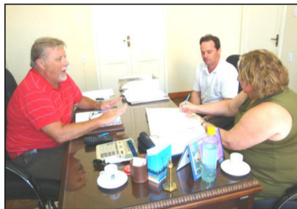
Vice-prefeita assinando a ata de transmissão

Para o prefeito as férias foram revigorantes e deram ainda mais ânimo para trabalhar com a comunidade estrelense. "Temos muito o que fazer e, neste ano vários projetos devem ser realizados", confirma.