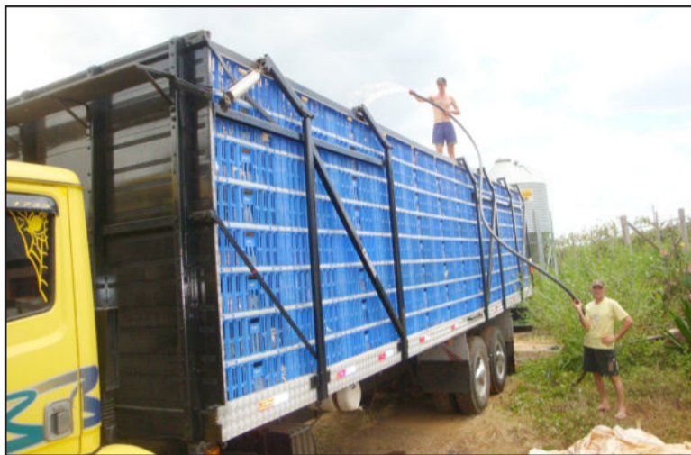
Antes da partida do caminhão, frangos recebem água para refrescar a viagem