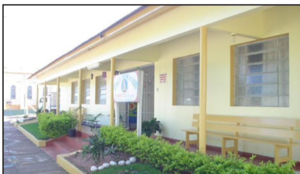
Emefs iniciam aulas em 24 de fevereiro