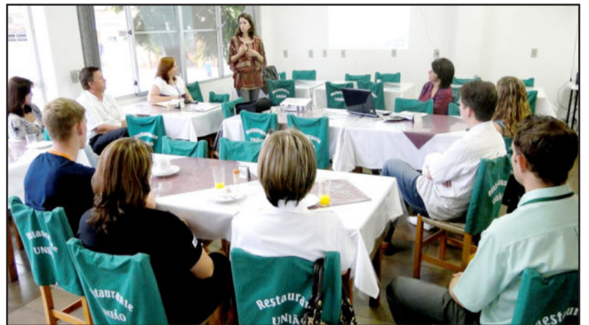
Grupo planeja ações para este ano

O projeto com a Rua 3 de Outubro terá, inicialmente, duração de um ano, com a culminância prevista para janeiro de 2011, e será baseado em quatro