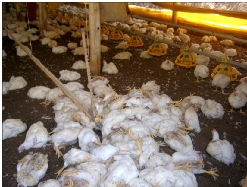
Frangos mortos dividiam espaço com os que conseguiram sobreviver