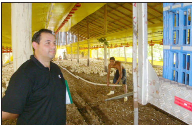
Anderson conferiu a situação

Os proprietários dos aviários que registraram mortes de frangos preferiram não falar em valores, no que diz respeito aos prejuízos financeiros. Contudo, destacaram que serão necessários vários lotes futuros para se amenizar as perdas atuais. Mais do que os prejuízos desta semana, a preocupação maior é quanto ao que vem pela frente. "Vamos melhorar nossas instalações, mas vamos ficar torcendo para que, pelo menos, a situação não piore", desabafou um avicultor, enquanto aves mortas de sua propriedade eram retiradas uma a uma do aviário.