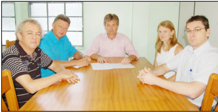
Equipe da Fazenda entrega resultados ao prefeito (c)