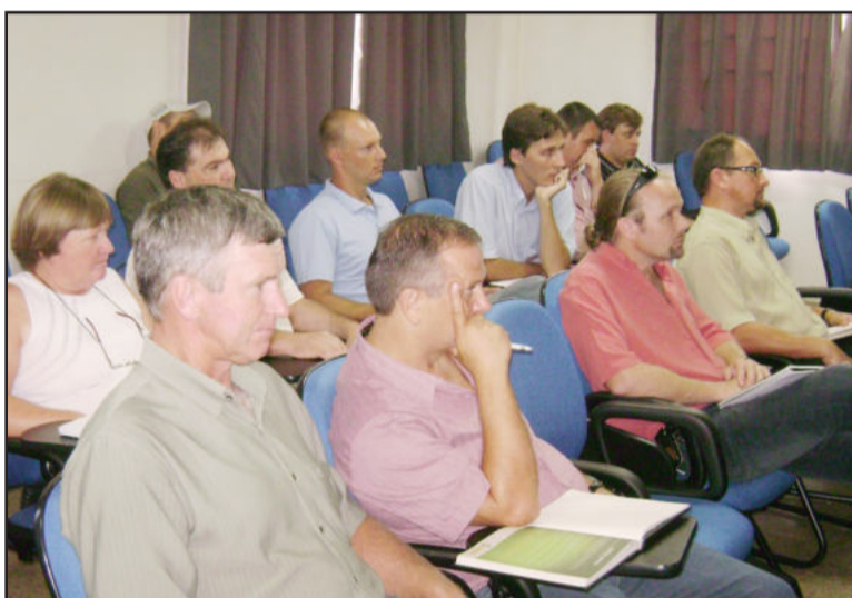
Representantes de prefeituras e sindicalistas

mais evoluídos do que em nossa região. Mas, também não podemos subestimar a nossa região que também possui muitos pontos positivos", afirmou.