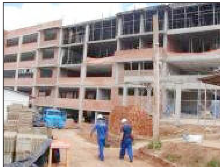
Prédio 13 está sendo finalizado

Outra novidade também para o início deste semestre é o novo curso de graduação em Engenharia Mecânica, que busca formar um profissional habilitado a trabalhar no desenvolvimento, projeto, construção e manutenção de máquinas e equipamentos. O Curso teoriza e pratica o desenvolvimento e a projeção de máquinas, equipamentos, veículos, sistemas de aquecimento e de refrigeração e ferramentas específicas da indústria mecânica.