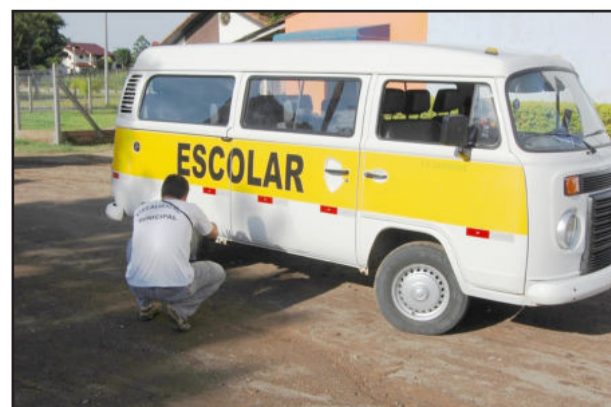
Vistoria continua semana que vem