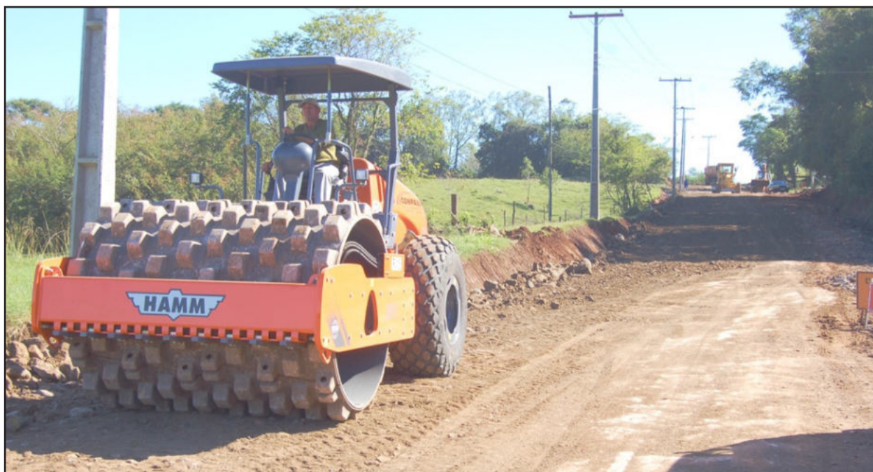
Máquinas trabalharam inclusive no feriado do Dia do Trabalho. Página 8