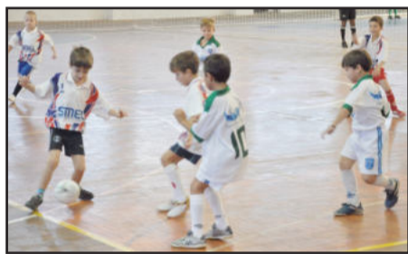
Campeonato Piá de Futsal de Lajeado tem média de 6,84 gols por partida