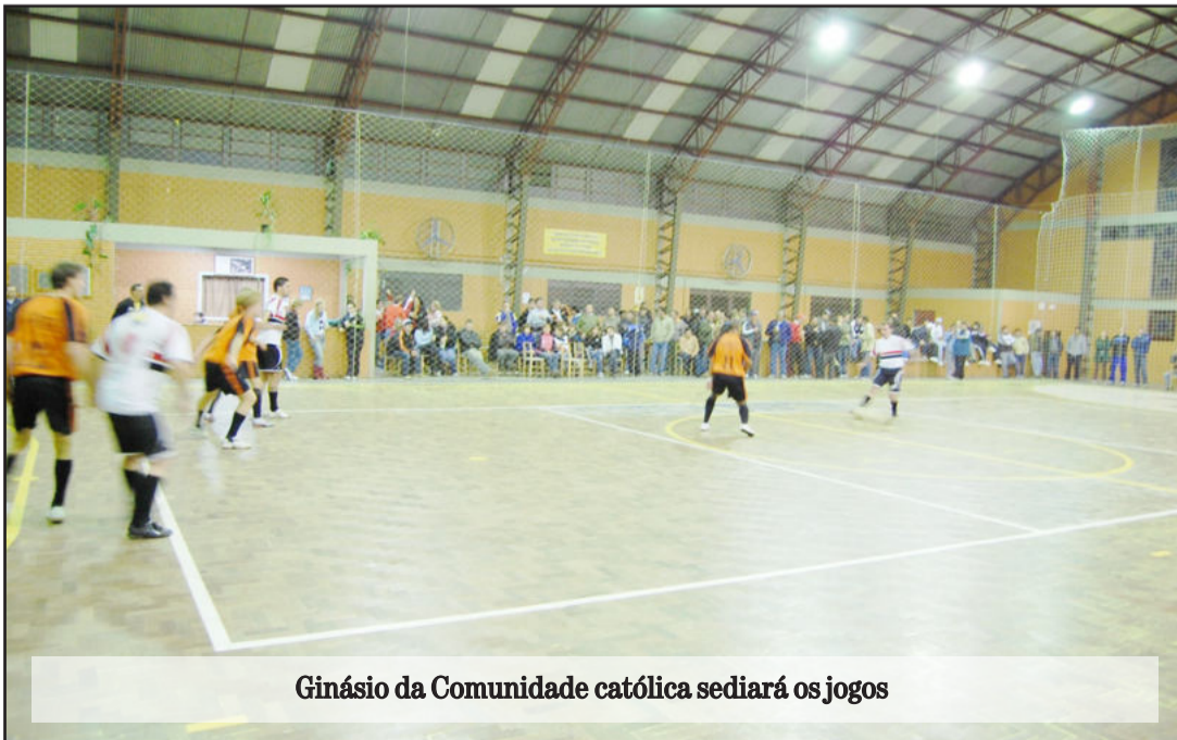
Ginásio da Comunidade católica sediará os jogos

As duas equipes estarão em quadra em Paverama nesta quinta-feira, dia 6, inaugurando placar eletrônico instalado no ginásio da Comunidade Católica. O equipamento foi adquirido e cedido pelo Grupo Popular de Comunicação para realização do campeonato. A partida preliminar será na categoria feminina entre a equipe local, 1 metro e 60, contra o Só Alegria, de Teutônia. Os organizadores estimam a presença de grande público para prestigiar a noite esportiva de Paverama.