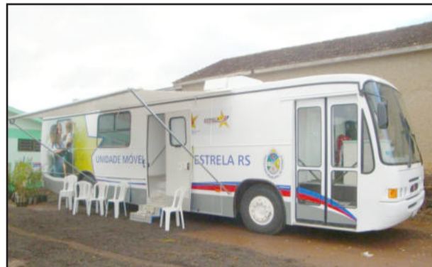
Unidade fará atendimento no interior do município de segunda a sexta-feira