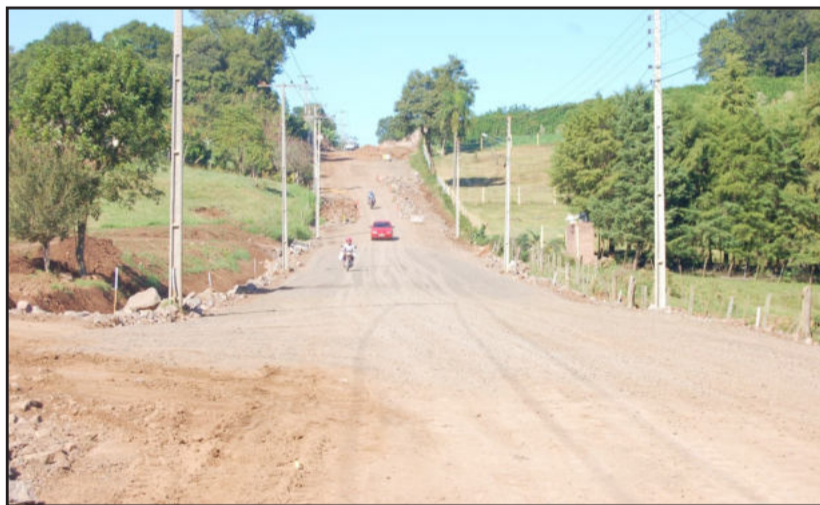
Estrada Velha terá 10 metros de largura, sendo 7 metros de pista de rolamento

A obra é fruto de um convênio entre a Prefeitura de Teutônia e o Departamento Autônomo de Estradas de Rodagem (Daer), órgão ligado ao governo do Estado. O convênio foi celebrado no dia 21 de dezembro de 2009, em solenidade realizada nos Jardins do Palácio Piratini, em Porto Alegre, com a presença da governadora Yeda Crusius e do diretor-geral do Daer, engenheiro Vicente Paulo Matos de Britto Pereira.