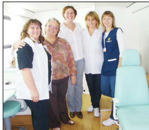
Equipe da Unidade Móvel de Saúde