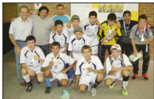
Los Hermanos campeão Infantil

No domingo passado, dia 02 de maio, a Secretaria Municipal de Esportes e Lazer (SMEL) de Garibaldi realizou as finais do Torneio de Futsal para as Categorias de Base. A competição iniciou no dia 18 de abril, estendendo-se pelos dias 25 de abril e 02 de maio. Os vencedores em cada categoria foram os seguintes: