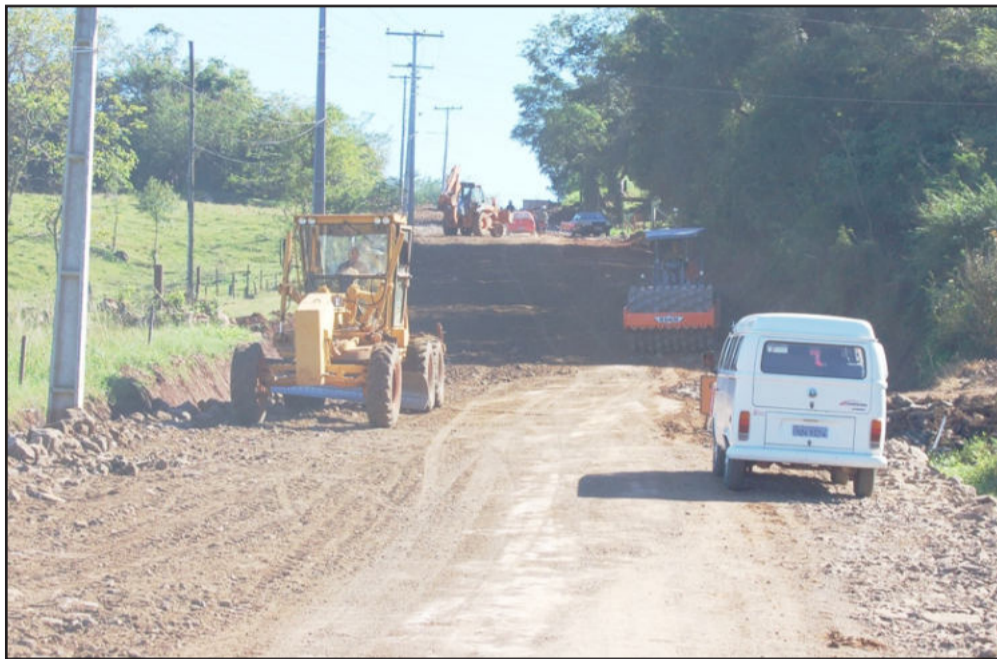
Máquinas trabalharam para aproveitar o tempo bom de sábado

O tempo bom registrado no sábado, 1º de maio, feriado do Dia do Trabalho, levou a equipe de obras da Conpasul a campo durante toda a manhã para preparar a cancha e a posterior pavimentação de 1,7 Km da Estrada Velha entre os bairros Canabarro e Languiru. Uma motoniveladora espalhava o