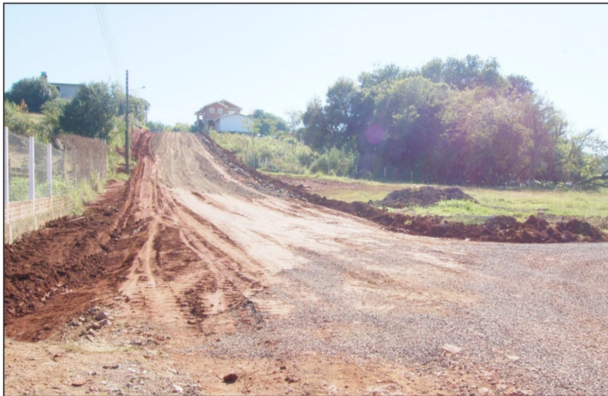
Abertura da Rua Reynaldo Affonso Augustin, em Canabarro