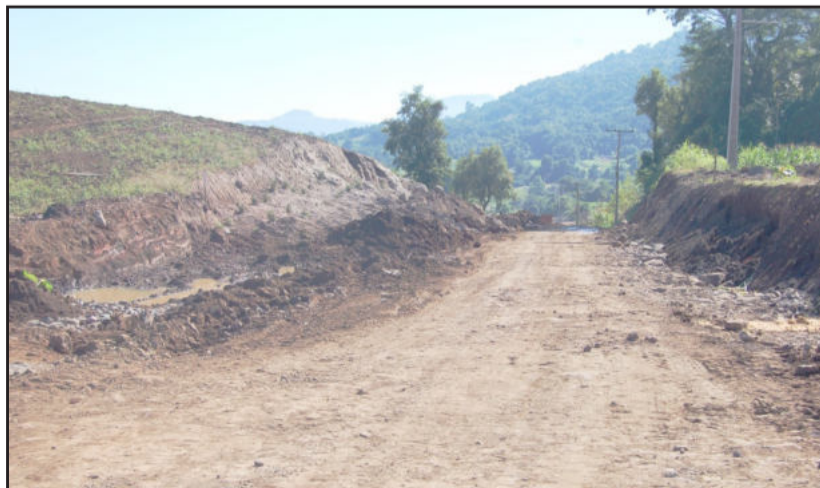
Empresa diminuiu topo nas imediações do acesso ao Restaurante do Matinho