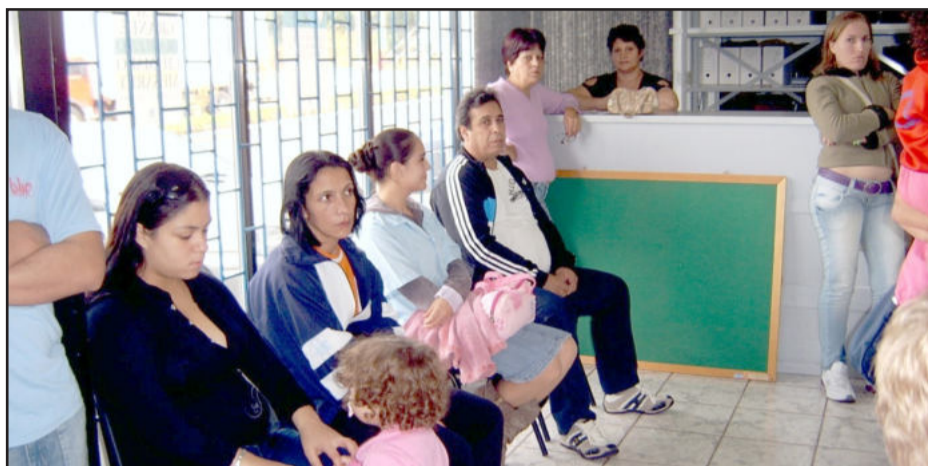
Dependências do cartório de Teutônia ficou lotado