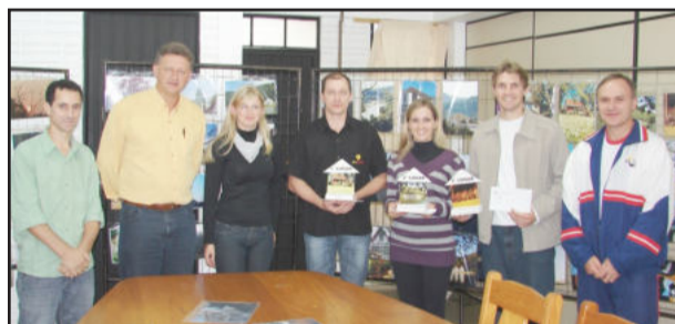
Vencedores do concurso de 2009 com a comissão organizadora e dos jurados

As fotografias inscritas serão devolvidas aos participantes, após o período da exposição no Centro Cívico do Centro Administrativo Municipal, e os CD's com as imagens digitalizadas passarão a integrar o acervo da Secretaria de Cultura, Turismo, Esporte e Lazer de Teutônia.