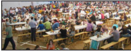
Comerciários participaram da festa, promoção do SEC