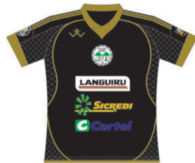
Camiseta Preta ASTF

Na noite de ontem houve treino no ginásio do Juventude, da Berlim/Westfália, numa aproximação com a comunidade local que aderiu