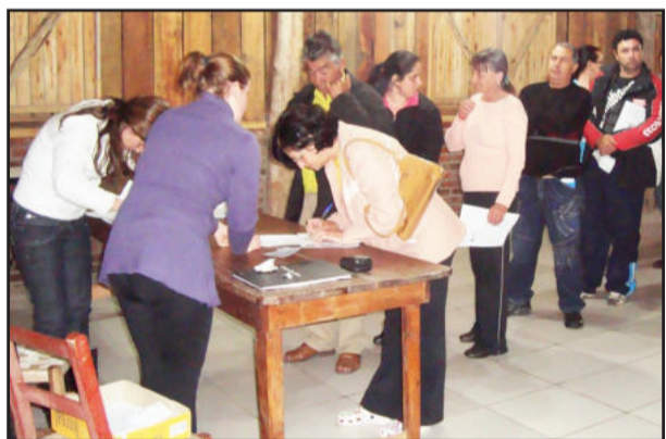
Produtores rurais retiraram cheque de incentivo

Além de apresentar o trabalho das secretarias, o Bate-Papo também ouviu a comunidade. Ela participou oferecendo sugestões para a administração de investimentos e melhorias em diversas áreas.