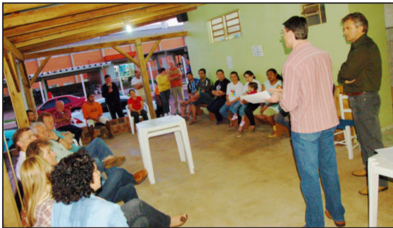
Audiência pública das ruas Hatto Brönstrup e Arnaldo Krug

> Rua Osvaldo Dienstmann - Quadra entre as ruas