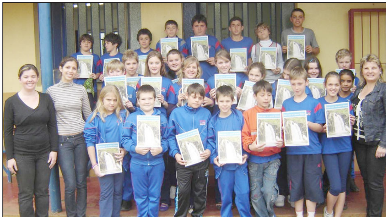
Alunos com as cartilhas

Dando sequência à Semana Municipal da Água, nos dias 04 e 05 de outubro, as Escolas Municipais (biblioteca, professores e alunos das 4ª séries) receberam a Cartilha "Água que te quero Limpa", elaborado e impresso em parceria com o Comitê de Gerenciamento da Bacia Hidrográfica do Taquari-Antas, Sala Verde Manoel Ribeiro Pontes Filho e Univates. O material poderá ser utilizado como subsídio na construção de conhecimentos, sendo uma alternativa para sensibilizar os jovens sobre a importância do uso racional da água.