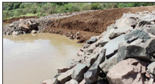
Local pronto para instalação da parede Krainer, técnica de Bioengenharia de Solos com objetivo de conter erosão