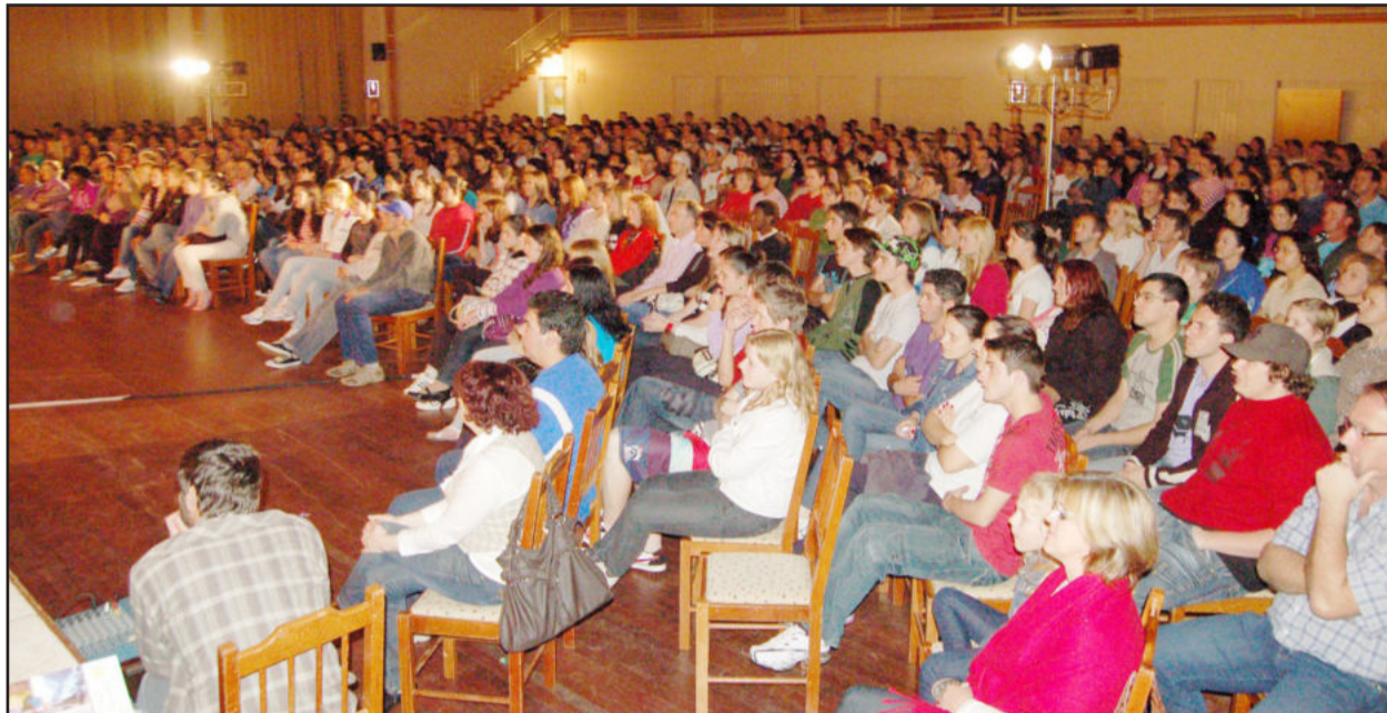
Público de 650 pessoas assistiu a encenação teatral

Diferentes emoções e sentimentos afloraram nos jovens e adultos que assistiram, na noite de quinta-feira, dia 30, a peça teatral “Exército de Sonhos”, da Fundação Thiago de Moraes Gonzaga, promotora do projeto Vida Urgente. A encenação trouxe cerca de 650 pessoas até a Associação Pró-Desenvolvimento de Languiru (Sociedade de Água), e todos ficaram atentos e participativos durante os cerca de 50 minutos de encenação.