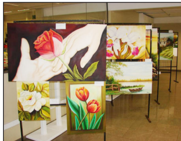
Flores e belas paisagens em tela fascinaram apreciadores das obras