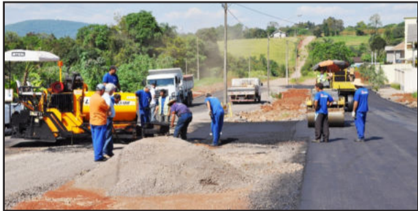
Obras iniciaram nesta semana