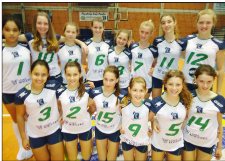
Equipe de Lajeado venceu tudo no sábado