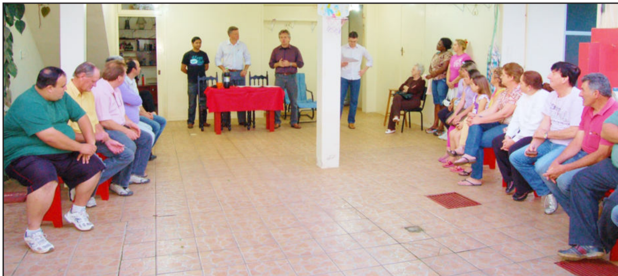
Audiência pública das ruas Evaldo Schaeffer, Osvaldo Dienstmann e Otterno Schaeffer