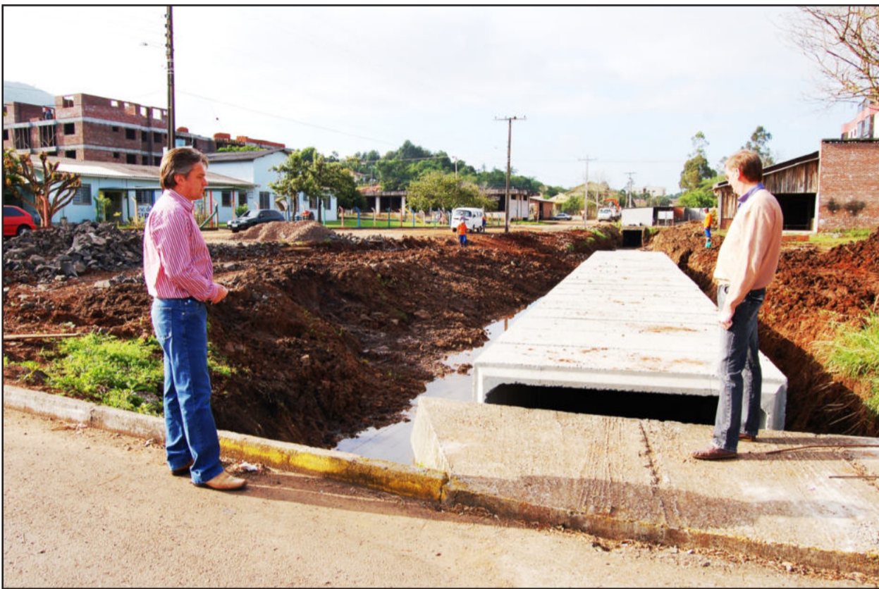
Obra de construção da galeria no Bairro Languiru

Administração municipal investe em saneamento básico com execução da obra