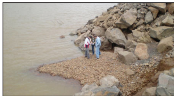
Análise do projeto in loco, observando o acúmulo de materiais por efeito da primeira râmprola instalada