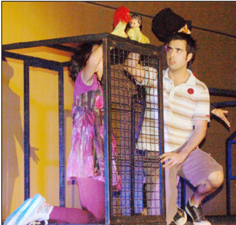
Uma das cenas de Exército dos Sonhos