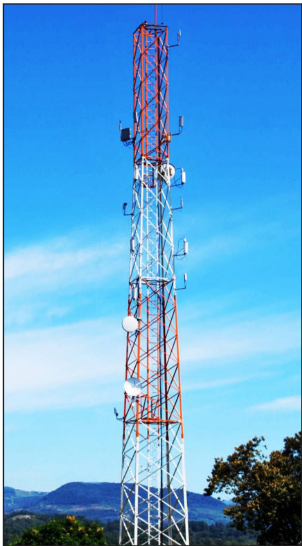
Moradores da área urbana contam com sinal da internet

Não há dúvidas de que a internet é uma indispensável ferramenta de trabalho. E, para ampliar o número de pessoas contempladas pelo mundo virtual, a Cooperativa Regional de Desenvolvimento Teutônia (Certel) ativou sua rede para distribuição de sinal para o Município de Boqueirão do Leão, através do provedor CertelNET. Desta forma, agora os moradores da área urbana do município podem conectar-se com a tecnologia oferecida pela cooperativa, com velocidades que variam de 150 kbps a 2 Mbps.