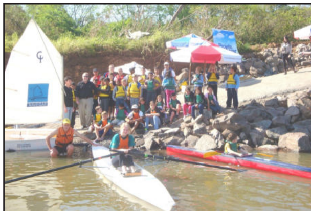
Rampa de acesso ao rio Taquari

O Projeto Navegar orienta, educa, forma e conscientiza as crianças e adolescentes, no turno oposto ao escolar. Atualmente, 140 alunos são atendidos pelo Projeto Navegar, pelos professores e/ou instrutores. As crianças aprendem modalidades como vela, remo e canoagem. Mais informações pelo 3981-1067.