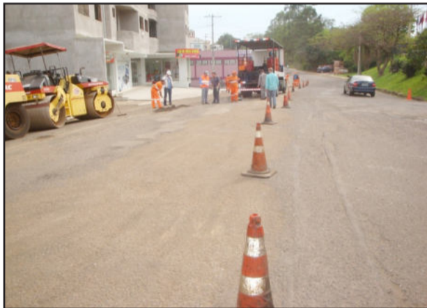
Melhoria na Rua Max Henrique Erichsen