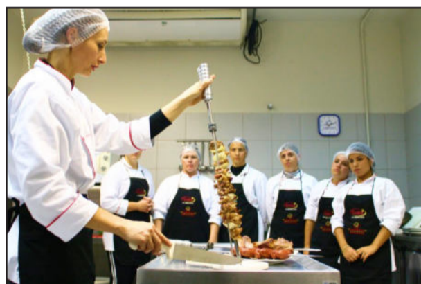
Preparação do churrasco tradicional pelas alunas será um dos conteúdos

Estão abertas as inscrições para a segunda edição do Curso de Churrasco para Mulheres, que será realizado, nos dias 28 de outubro e 4 e 11 de novembro, na Univates. A atividade visa a realizar visita a açougue para a escolha das carnes, elaborar o churrasco e desenvolver técnicas de bem-servir.