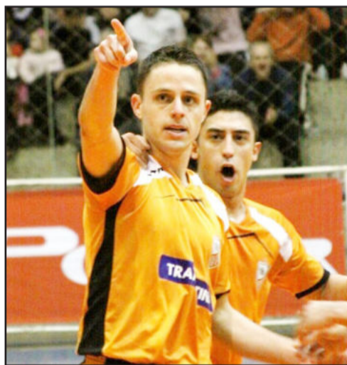
ACBF, de Rodrigo, está nas semifinais da Liga Futsal 2010

Classificado, o clube de Carlos Barbosa espera pelo vencedor do confronto entre Krona/Joinville, Joinville/SC, e Malwee/Cimed, Jaraguá do Sul/SC, que se enfrentam amanhã, sexta-feira, dia 8, na Arena Jaraguá, em Santa Catarina.