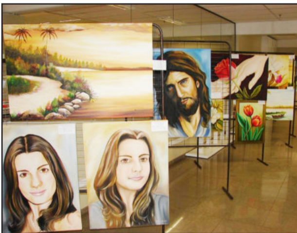
Telas expostas retratavam os mais variados temas

Os interessados em participar de uma das várias oficinas oferecidas pelo Centro Cultural 25 de Julho devem entrar em contato pelo telefone (51) 3762-1033 de segunda a sexta-feira das 7h30min às 11h30min e das 13h às 17h ou se dirigir até o Centro Cultural, junto à Rua Major Bandeira, 675, Bairro Languiru.