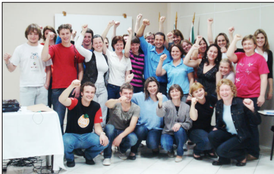
Formação contou com a participação de 27 pessoas

O conteúdo programático destacou postura ética profissional, situações tradicionais e não tradicionais (o que fazer), compreendendo o cliente, técnicas para ser eficaz em situações desagradáveis, maneiras de administrar situações difíceis, reclamações inesperadas e conflito com clientes.