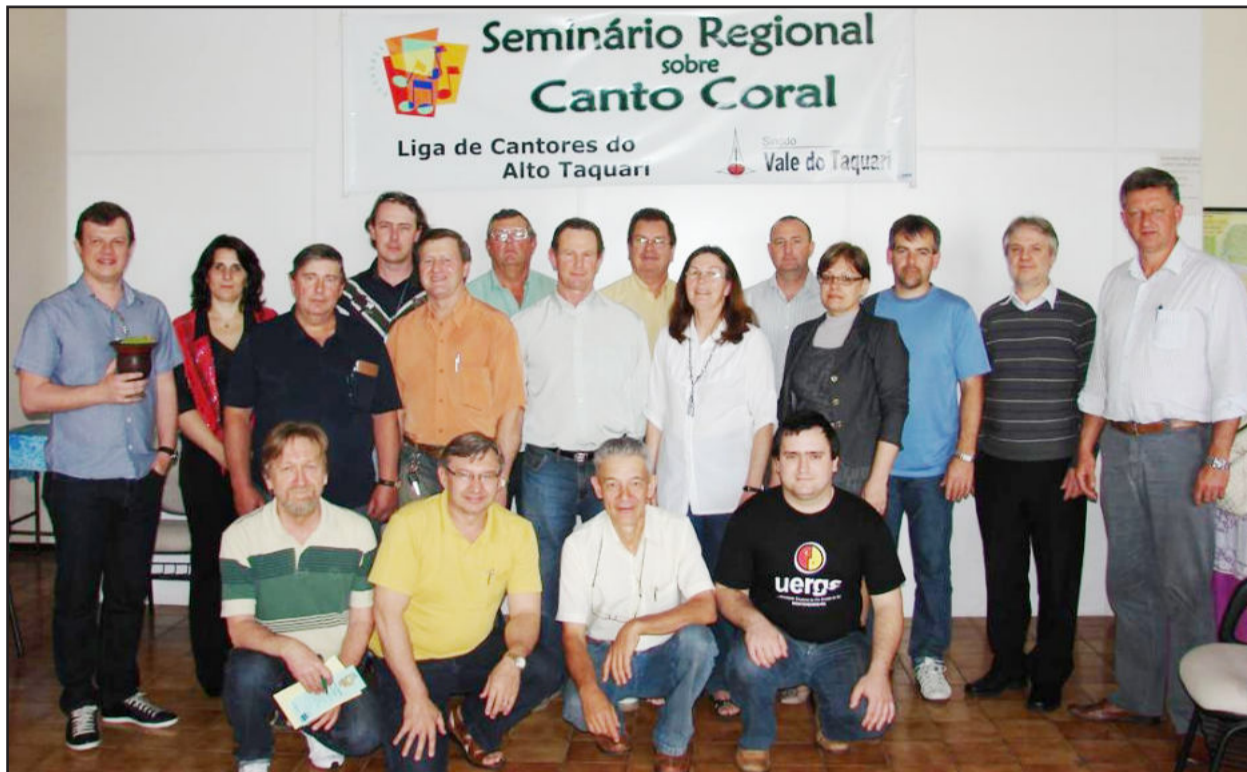
Seminário aconteceu na sede do Sínodo Vale do Taquari