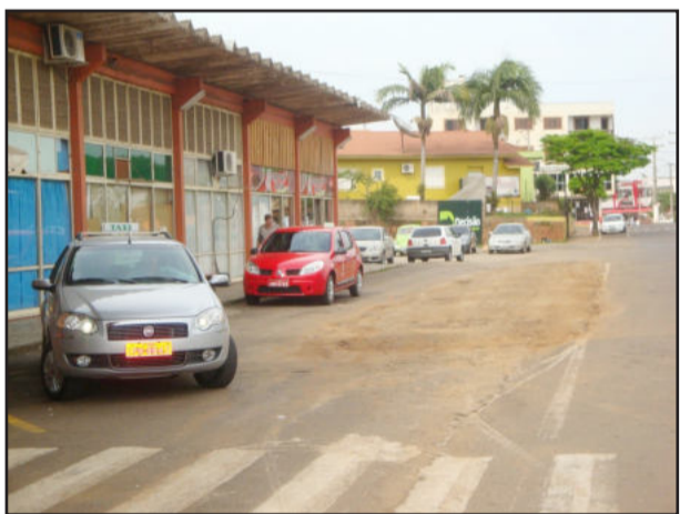
Avenida Rio Branco, defronte à Estação Rodoviária, ganha espaço com deslocamento do ponto de táxi