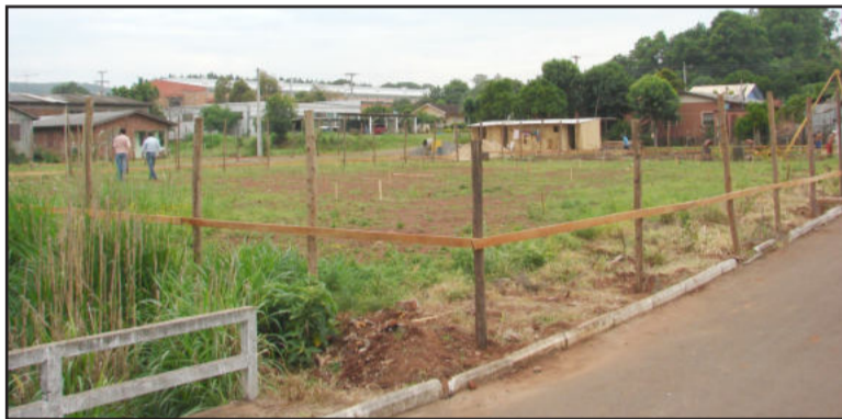
Início da obra de construção da creche Mundo Encantado