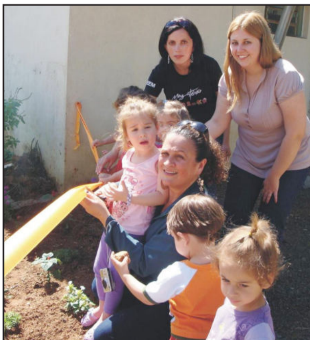
Alunos aprendem sobre a importância do cuidado com as flores

A culminância do projeto aconteceu no dia 28 de outubro, quando houve a inauguração dos canteiros feitos pela turma do Maternal A1, que sensibilizaram os coleguinhos a participarem deste Projeto de Empreendimento e a fazerem a sua parte para a preservação do Meio Ambiente. Houve também uma confraternização com comes e bebes entre as turmas envolvidas, a direção e a supervisão escolar.