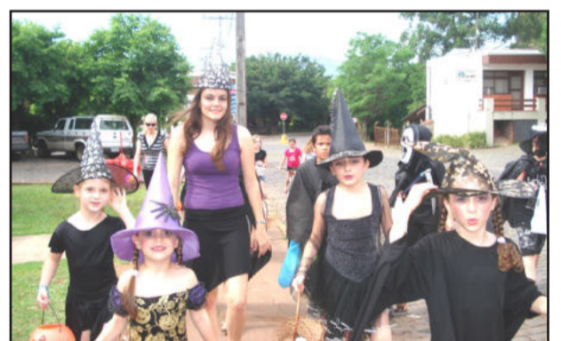
Crianças pedindo doces pela rua