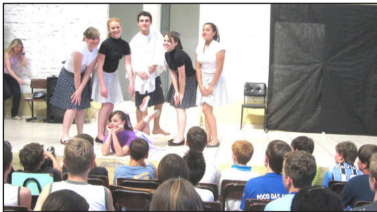
Apresentações artísticas ocorreram durante a feira