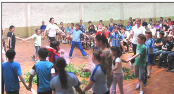
Atividades de integração e recreação