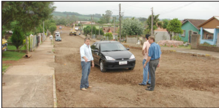
Obras de pavimentação na Vila Popular

cípio, porque a parte federal era de R$ 700 mil. A equipe técnica da administração conseguiu a liberação de mais R$ 250 mil de recursos federais.