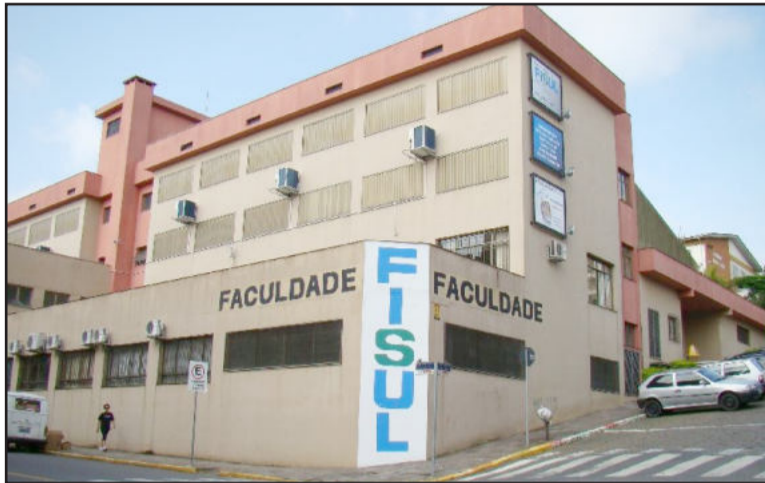
Fisul sediará sessão do Legislativo

Projeto 120 - Autoriza firmar convênio e repassar auxílio financeiro de R$ 2,5 mil ao Aeroclube, para equipar a