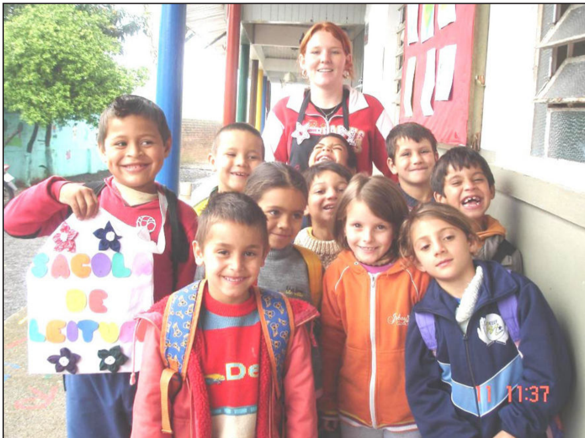
Crianças levam para casa conhecimento através da Sacola da Leitura

Através do "Projeto Ler é Tudo de Bom", os alunos do Centro Municipal de Atendimento Integrado - Cemai II, localizado no Bairro Moinhos, estão contagiando as famílias.