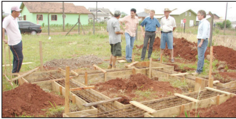
Início da construção da caixa d'água no Loteamento 8

A estimativa era iniciar a obra mais cedo neste ano, porém o orçamento original da obra ficou totalmente defasado e ultrapassado, o que exigiria uma contrapartida elevada do Muni-