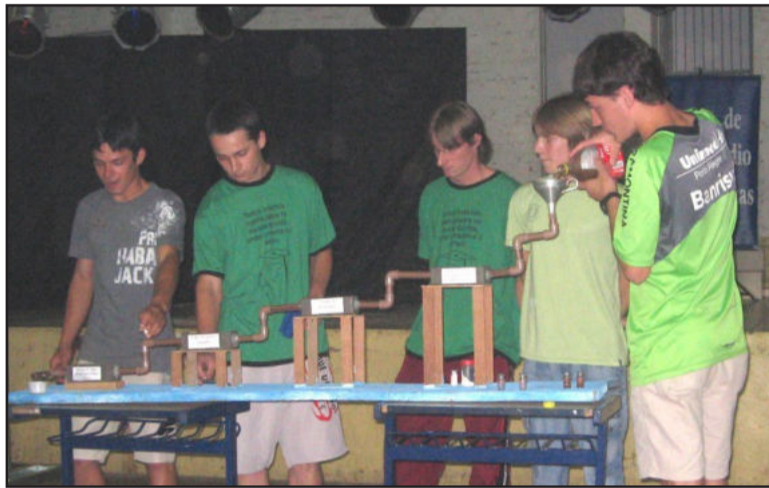
Pesquisas e estudos científicos também foram apresentados

4. Especial é esta Escola, Pois podemos falar com certeza Que aqui há tranquilidade E também muita beleza.