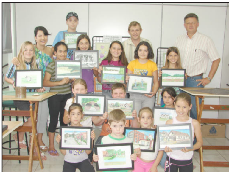
Alunos exibem quadros sobre Teutônia