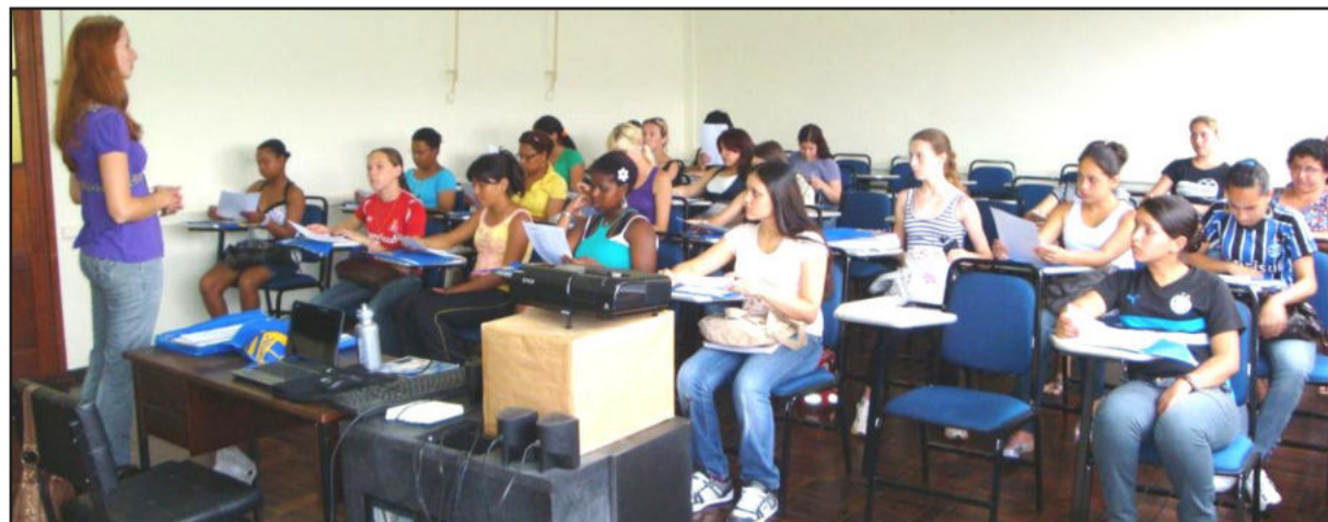
Curso iniciou na última terça-feira