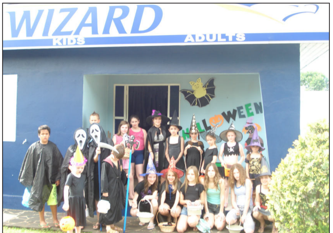
Crianças em frente à Escola Wizard

lescentes e adultos, amigos e professores. Com música, decorações, comidas e bebidas e muitos sustos, todos que participaram da festa se divertiram e puderam vivenciar um pouco da cultura norte-americana num espírito de descontração.