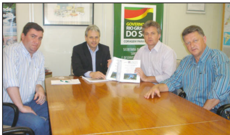
Reunião com o secretário estadual de Saneamento Marcos Alba