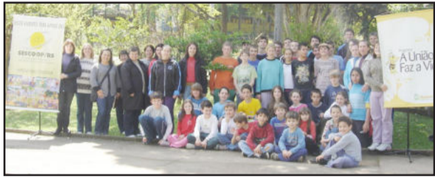
Alunos e professores envolvidos no projeto

A Secretaria de Educação, Cultura, Desporto e Turismo de Poço das Antas promove hoje a Manhã Cultural. O evento, a ser realizado no ginásio municipal de Esportes, contará com a participação de toda comunidade escolar. Na oportunidade as escolas apresentarão atividades desenvolvidas ao longo deste ano por meio do programa A União Faz a Vida, realizado pela Sicredi Ouro Branco em parceria da administração municipal, apoio das cooperativas Languiru e Certel e assessoria pedagógica da Univates.