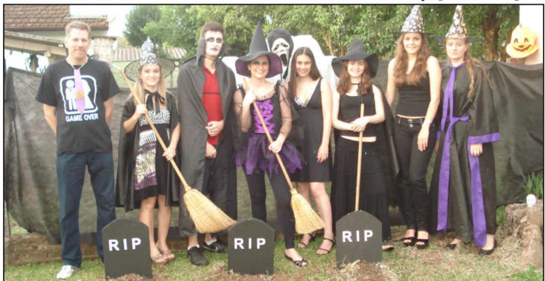
Professores e funcionários no espírito de Halloween