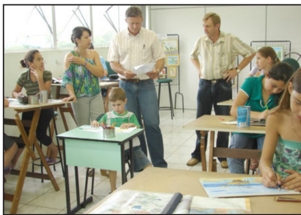
Alunos em ação nas aulas no Centro Cultural 25 de Julho