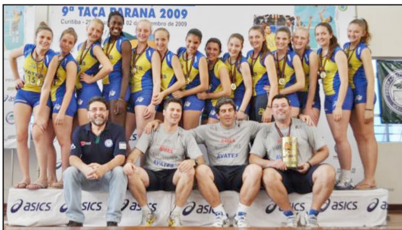
Equipe infanto-juvenil trouxe para Estrela mais um título nacional