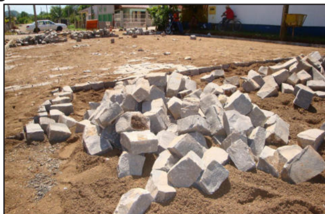
Recuperação de calçamentos em Estrela