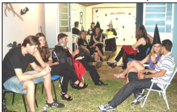
A festa dos adultos ocorreu à noite