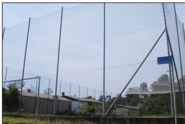
Tela protege quadra de esportes