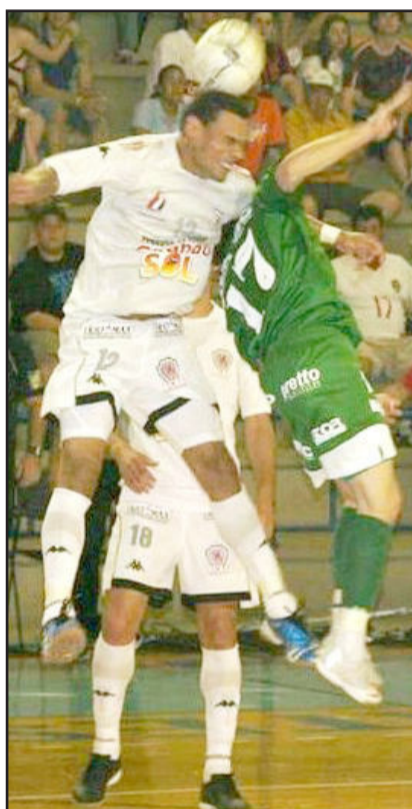
Jogo promete disposição

A Rádio Popular FM (96,9) estará em Venâncio Aires, no Parque do Chimmarrão, para transmitir ao vivo, em todas as emoções, o confronto de volta da fase de quartas-de-final entre ASSOEVA e ALAF.