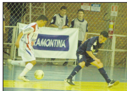
AGEL perdeu em casa