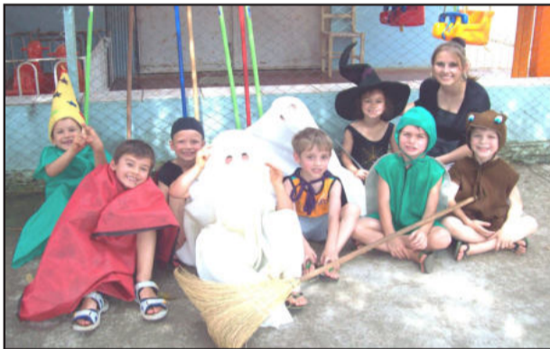
Crianças vestidas conforme temática do dia