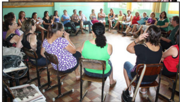
Oficinas foram realizadas na semana passada