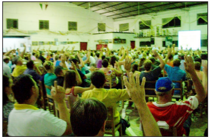
Em Westfália, mais 260 associados participaram da Pré-assembleia

O processo assemblear da cooperativa começou no dia 31 de janeiro e culmina com a assembleia geral, no dia 5 de março, em Teutônia. Todos os associados das unidades podem comparecer ao evento. “Quanto maior a participação dos sócios, mais forte será o Sicredi e