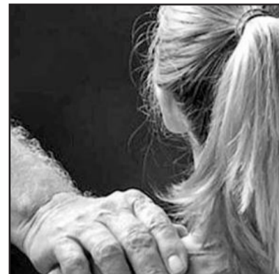
Menores confirmam relação sexual com pedófilo

Rastreamentos feitos pela Polícia mostram que jovens de classe média, com idade entre 17 e 24 anos, são considerados os principais produtores de imagens de crianças violentadas. Suas vítimas, na grande maioria dos casos, são menores de sua própria família. Os compradores dessa produção tem um perfil diferente. Normalmente são solteiros, tem pouco mais de 40