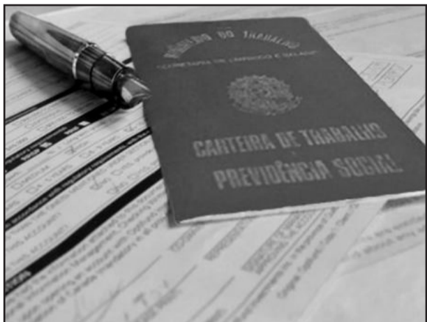
Renda do trabalhador é a maior desde 2003

Já o rendimento teve queda de 0,7% em dezembro ante novembro e encerrou o ano a R$ 1.515,10. Na comparação com dezembro de 2009, houve crescimento de 5,9%.