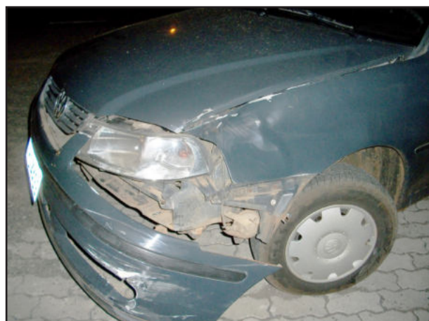
Gol teve danos na dianteira