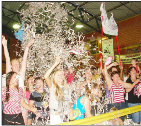
Torcida de Keli vibrou muito com o resultado final