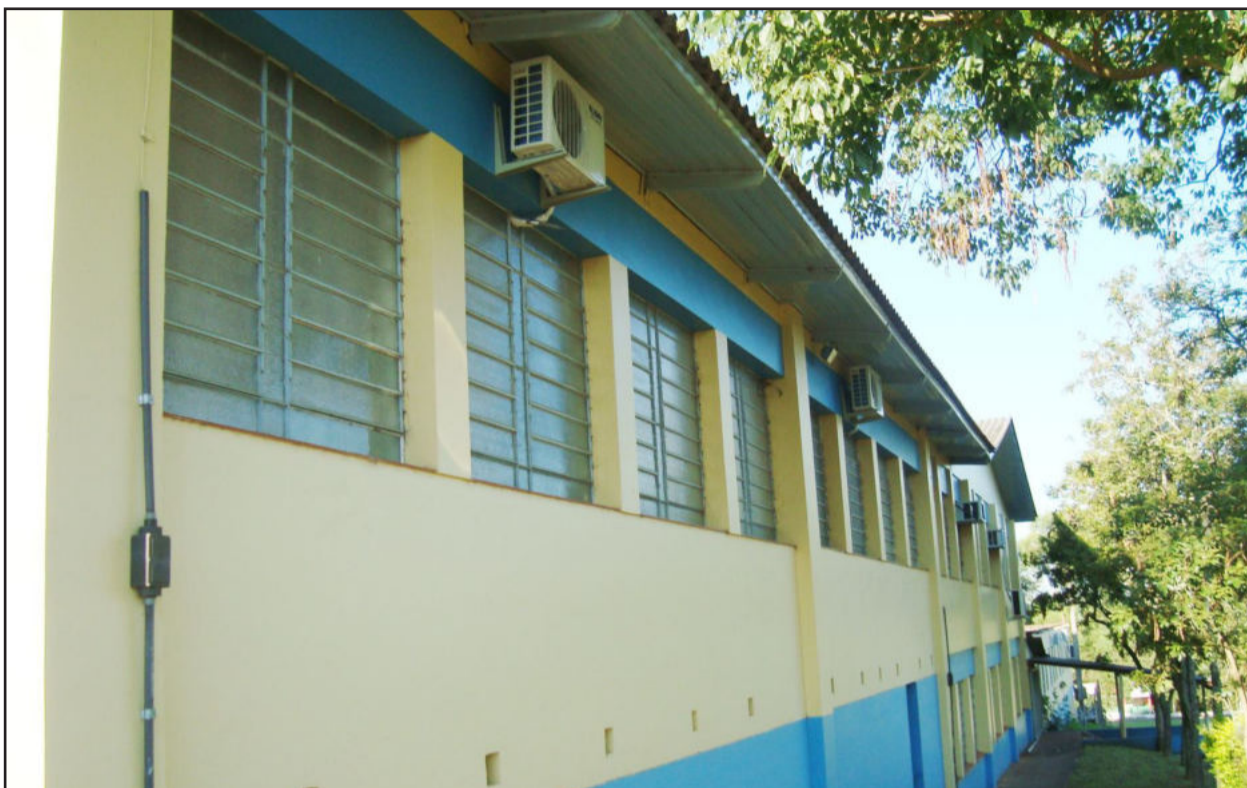
Icecg instalou ar condicionados nas salas de aula e climatizou ambientes

O Instituto de Educação Ceceista General Canabarro (Icecg), já vive a expectativa da volta às aulas, mas o educandário aproveita o restante do período de recesso escolar para se preparar para oferecer aos alunos um ambiente favorável e confortável para o aprendizado. Muitas novidades serão apresentadas. A climatização de salas de aula é apenas uma delas.