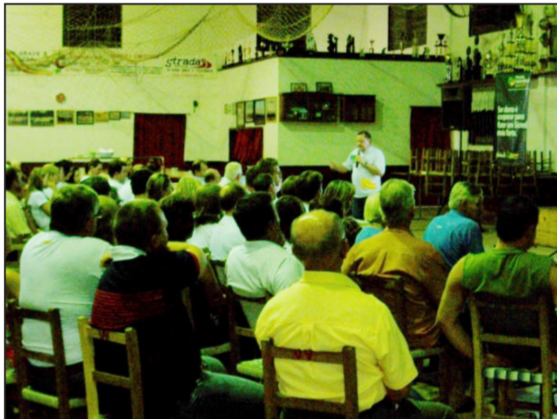
Pré-assembleias apresentam os resultados da cooperativa para os associados

Em nível nacional, o Sicredi é formado por 119 cooperativas de crédito em 11 estados brasileiros, sendo 1.150 pontos de atendimento e 1,755 milhões de associados.