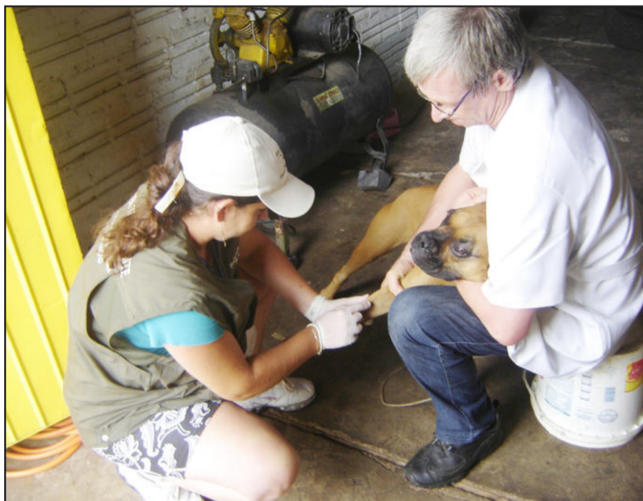
Equipe da Sema coletará sangue de 100 caninos do Bairro Moinhos