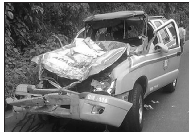
Viatura na qual o sargento se acidentou