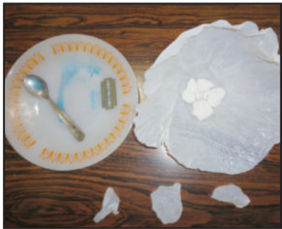
Com o uso de reagente específico, policiais constataram tratar-se de cocaína

Após um levantamento, foi constatada a veracidade do caso e a movimentação no local. Os policiais resolveram cumprir o mandado de busca no dia 31. Durante os trabalhos, fecharam a residência do suspeito e, acompanhado do mesmo, iniciaram as buscas. No instante em que um policial encontrou 14,5 gramas de cocaína, o suspeito fugiu, pulou uma janela de 2,5 metros de altura e correu para o mato, situado junto a Via Láctea. Apesar das diligências, não foi mais encontrado.