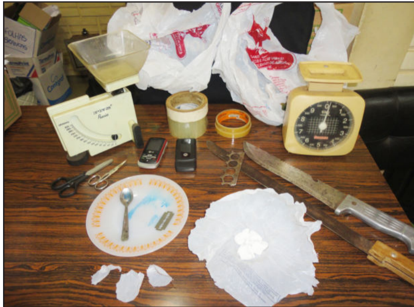
Polícia Civil apreendeu cocaína e material para o tráfico na casa de um suspeito na Vila Esperança

Na casa do suspeito os policiais civis também apreenderam balanças de precisão, fitas, plásticos, armas e produtos de procedência ilícita. O filho do suspeito, de 5 anos, permaneceu na casa e foi entregue aos cuidados de parentes.