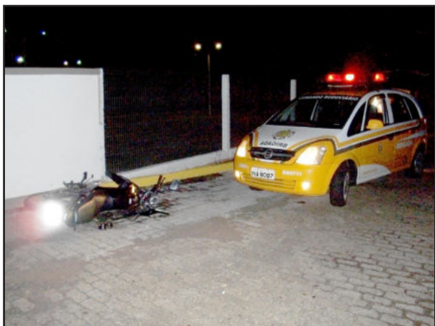
Polícia Rodoviária Estadual atendeu o acidente