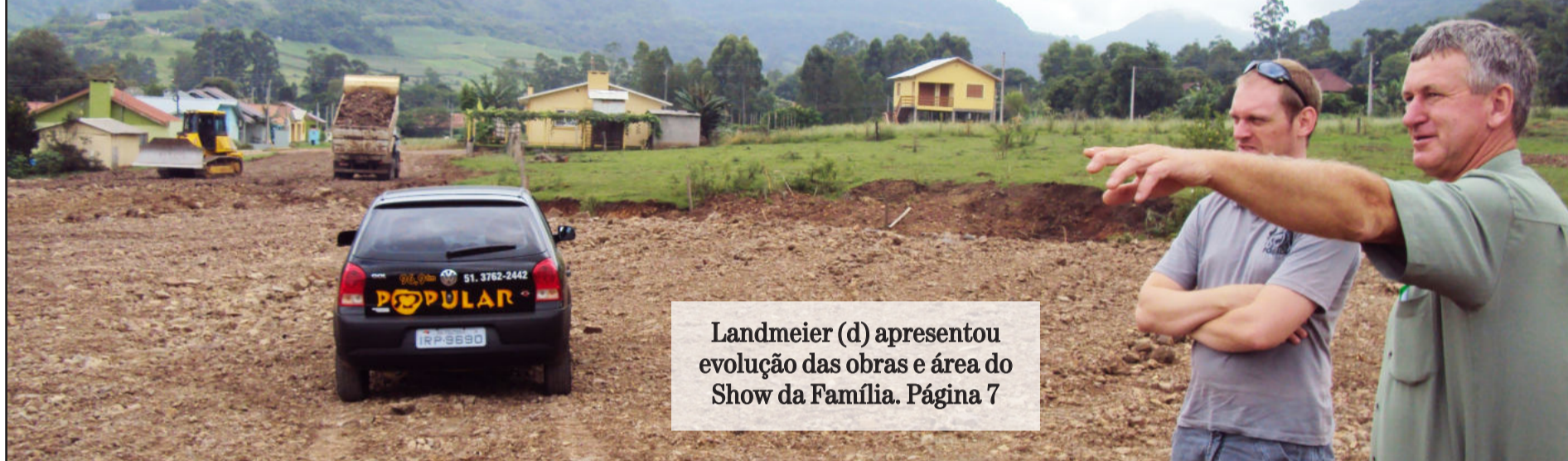
Landmeier (d) apresentou evolução das obras e área do Show da Família. Página 7