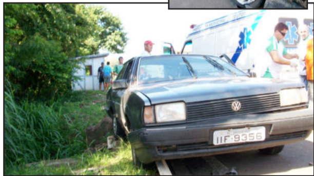
Condutor e caroneiro sendo socorridos pelo SAMU