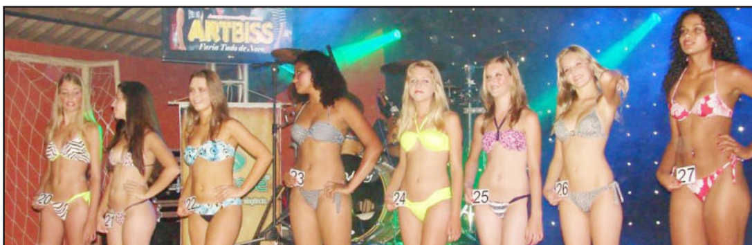
Candidatas que concorreram ao título de Garota Verão de Teutônia