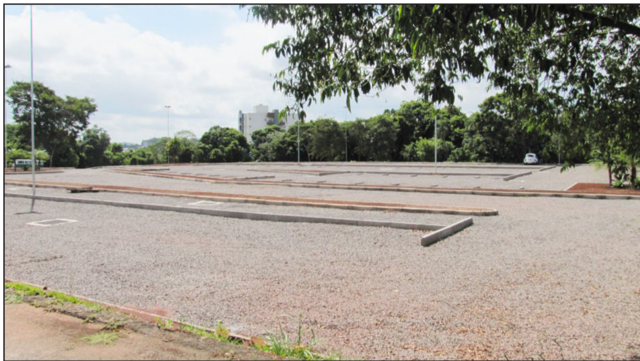
Estacionamento ao lado do Prédio contará com 571 novas vagas

Infraestrutura e projetos beneficiam comunidade acadêmica