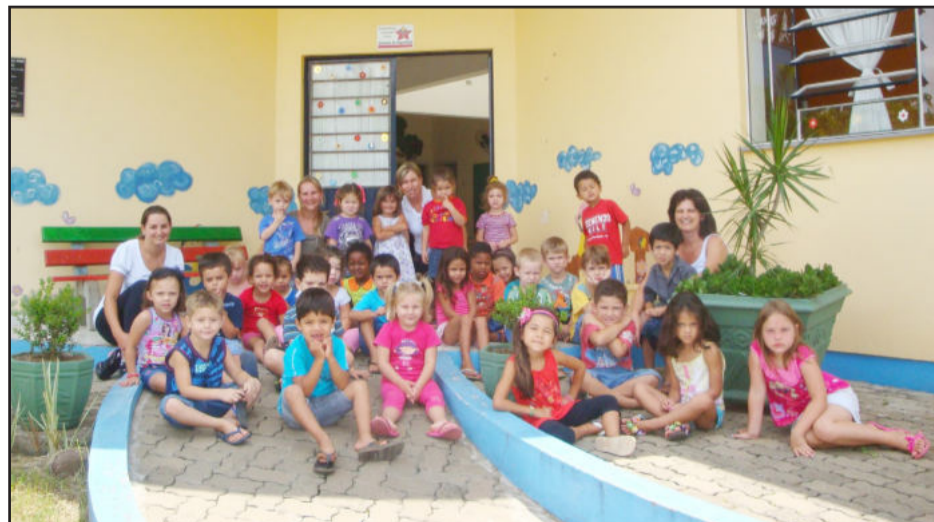
Crianças voltaram às Emeis em Estrela

Na Emei Arco Iris as crianças retornam nesta quarta-feira, dia 9, pois a escola está passando por reformas. Já as Escolas Municipais de Ensino Fundamental retornam suas atividades no dia 21 de fevereiro, quando mais de 1,8 mil crianças devem iniciar o ano letivo.