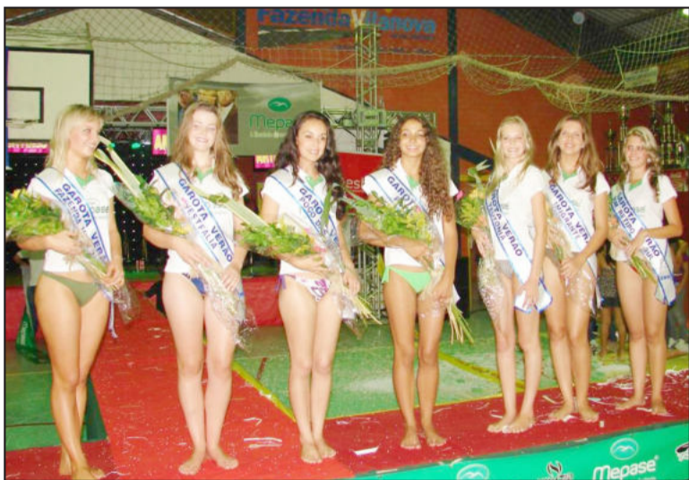
Candidatas escolhidas que disputarão a Etapa Regional do Garota Verão