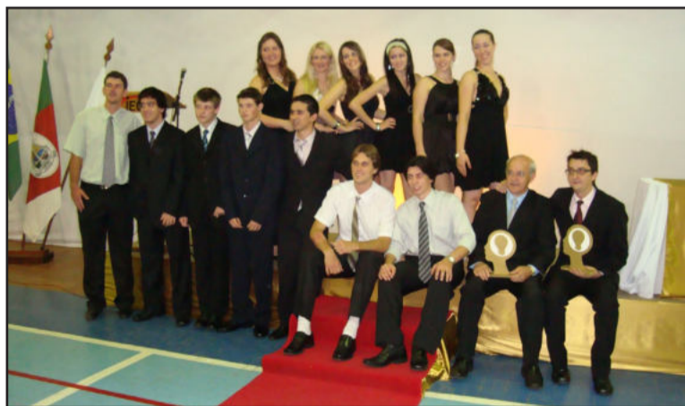
Integrantes do Grêmio Estudantil 2009

Neste ano duas chapas inscreveram-se para disputar o pleito, que acontecerá no dia 15 de abril. Alunos a partir da quinta série do Ensino Fundamental, até o terceiro ano do Ensino Médio, além dos estudantes dos Cursos Técnicos, votarão para definir o grupo que irá comandar o Gecáh em 2010. As duas chapas estão com diversas propostas. Além de dar sequência ao excelente trabalho da direção do Grêmio no ano de 2009, como a segunda edição do Garoto e Garota Ieceg e a segunda edição do Prêmio Melhores do Ano, eventos que ganharam grande destaque no ano passado, novas propostas também surgiram. Trocar os últimos quadros negros ainda existentes por quadros brancos nas salas de aula e incentivar práticas sociais entre os alunos, como doação de roupas e alimentos, foram propostas que surgiram entre os presidenciáveis. As propostas