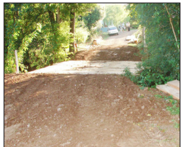
Melhoria de ponte para agricultor

Na zona rural, atenção especial para a recuperação das estradas municipais às vésperas da chegada dos meses mais chuvosos. Um dos trechos recém recuperados foi a estrada que liga Linha Ribeiro a Linha Wink, passando pelo chamado "Morro de Areia". A construção de pequenos pontilhões de madeira é outra atividade desenvolvida, o que permite facilidade nos acessos às propriedades rurais e o consequente escoamento da produção primária.