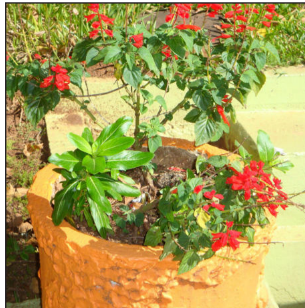
Vasos com flores também costumam atrair mosquitos transmissores da dengue

O calendário de recolhimento terá sequência em maio. No dia 07 de maio será nos bairros Auxiliadora e Alto da Bronze. No dia 14 de maio será nos bairros Cristo Rei e Chacrinha. E, no dia 21 de maio, será no bairro São José e no distrito de Costão. Os organizadores do mutirão explicam que sugestões, denúncias e reclamações podem ser efetuadas pelo telefone (51) 3981-1044.