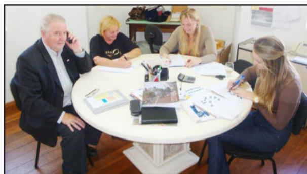
Parte da equipe do Centro Bertholdo Gausmann

de Estrela. Às 20 horas, ocorre a abertura oficial, com saudações e relatos. Às 20h30min, acontece a entrega da premiação do 9º Concurso Fotográfico de Estrela. Às 20h45min acontecem os pronunciamentos. Por fim, às 21 horas, ocorre confraternização e show de Conrado Vier e Marcelo Fortes. Mais informações pelo telefone (51) 3981-1122.