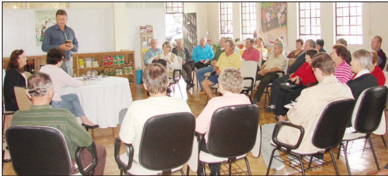
Reunião dos presidentes e regentes de coros de Teutônia

Teutônia, Cidade que Canta e Encanta, é a Capital Nacional do Canto Coral