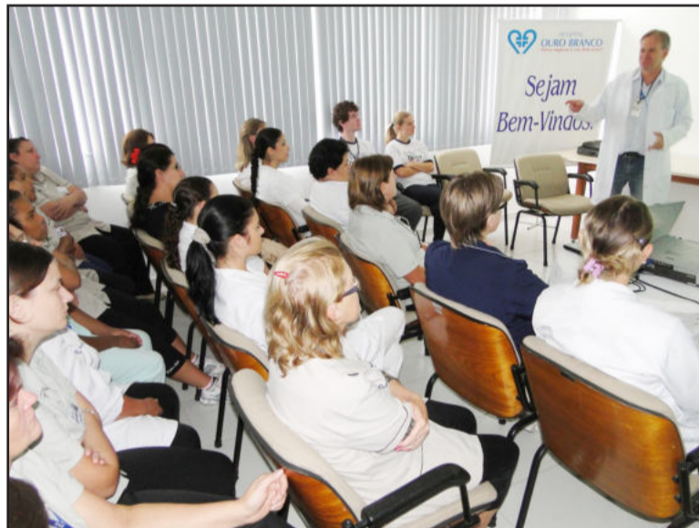
Treinamentos envolvem todo quadro de colaboradores da casa de saúde

po no hospital e precisamos zelar por este patrimônio e ambiente. Certamente as orientações são importantes para a vida de cada um, que tem o dever de levar as informações abordadas aqui para a educação continuada em suas casas", destacou.