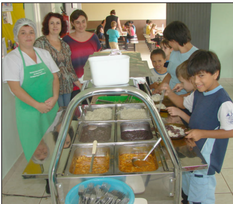
Novos equipamentos garantem qualidade à merenda oferecida aos estudantes