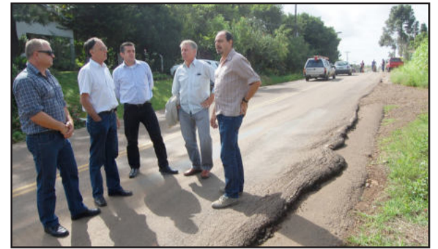
Equipe avalia estado da rodovia