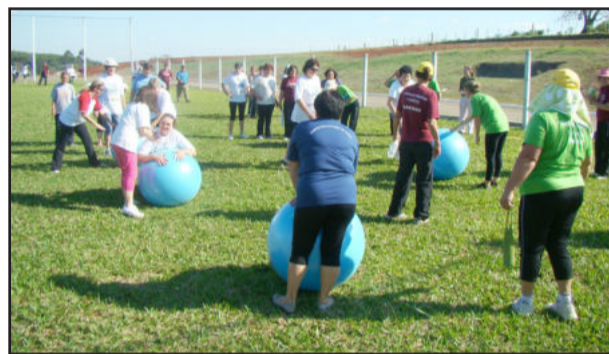
Mais de 200 pessoas participam

Sete comunidades de Fazenda Vilanova realizam as atividades de ginástica e caminhadas orientadas, do Projeto Esporte em Ação. Mais de 200 pessoas participam das aulas iniciadas no mês de fevereiro para a temporada 2010. Sob orientação técnica especializada os grupos trabalharam inicialmente as readaptações dos participantes na solta aos exercícios.