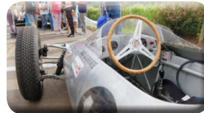
Subida de Montanha traz aficionados pelo automobilismo de alta velocidade à estrada que leva à Lagoa da Harmonia

Em 2009 e 2010 houve a inserção de mais uma prova, com a realização de provas de automobilismo, só que em formato de Subida de Montanha, com carros antigos e modernos procurando percorrer o trajeto em menor tempo possível no sentido contrário dos skates.