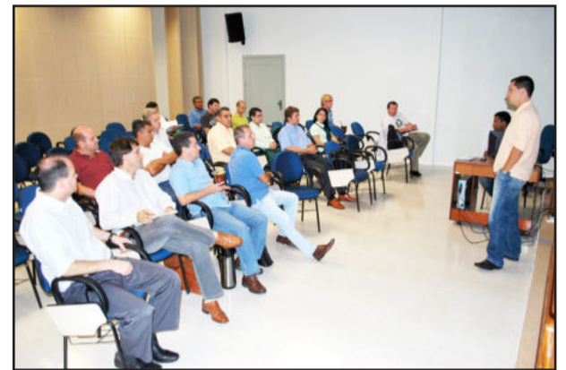
Reuniões atendem às novas exigências tecnológicas e normativas

Nos dias 23 e 24 de março, no auditório da Certel, em Teutônia, realizou-se o primeiro encontro do ano das Comissões de Padronização da Distribuição da Federação das Cooperativas de Energia, Telefonia e Desenvolvimento Rural do Rio Grande do Sul (Fecoergs).