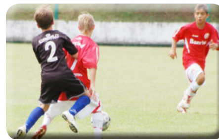
Copa Adidas Teutônia é a maior competição para categorias de base promovida no Brasil

Outra competição que merece destaque em Teutônia é a Copa Adidas, considerado em 2009 o maior torneio para categorias de base do Brasil. Durante uma semana, cerca de 3 mil atletas, dirigentes, técnicos e pais vêm de diferentes regiões do País, de várias cidades gaúchas e de países vizinhos para competir em Teutônia. A administração municipal apoia o evento com o custeio de parte da cota de arbitragem, organiza o alojamento das delegações, estrutura a logística de funcionamento e coloca uma equipe de colaboradores à disposição para dar suporte aos organizadores da Planeta Bola Eventos Esportivos.