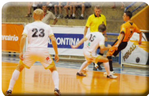
Teutônia Futsal leva o nome da cidade para vários recantos do Estado