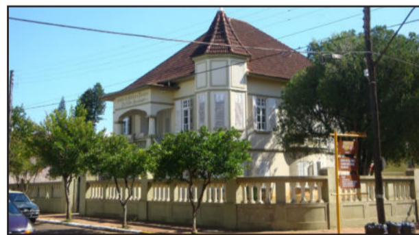
Prédio do Centro de Cultura e Turismo