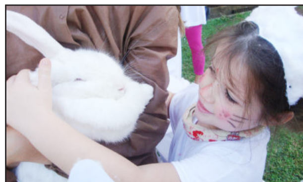
Caça ao ninho agitou a criançada

Diversas atividades, como brincadeiras ao ar livre, teatro, canções, contação de histórias, observação de coelhos e caça ao ninho, encantaram os alunos.