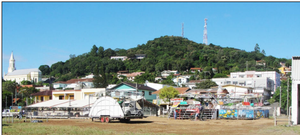
Parque recebe últimos ajustes para abertura de hoje à noite

Desde a semana passada equipes de montagem estão trabalhando no parque poliesportivo municipal afim de levantar as estruturas que irão abrigar a Expocruzeiro 2010 e 4ª Festa do aipim, que ocorrem de hoje até domingo, dia 11. A abertura oficial ocorre hoje, a partir das 18h, com ingresso grátis.