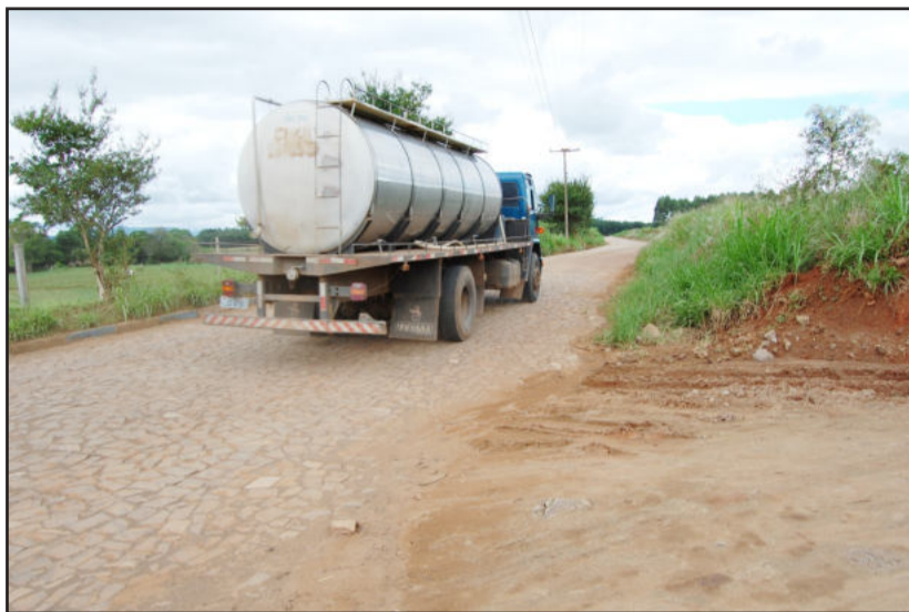
Asfalto ligará Paverama com Teutônia

O trecho a ser asfaltado inicia no Bairro Cidade Baixa e vai até a Fazenda São José. Serão asfaltados 4.174,50 metros. Segundo projeto do Setor de Engenharia da administração municipal, a obra está orçada em R$ 2.538.457,25. Os recursos compreendem uma parceria entre o Município, que participa com 40% do investimento, em forma de contrapartida, e o governo do Estado que será responsável pelos outros 60% do valor do empreendimento. O Departamento Autônomo de Estradas de Rodagem (Daer) repre-