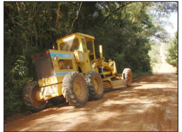
Recuperação da estrada de Linha Ribeiro e Morro de Areia

As equipes da Secretaria de Obras de Teutônia trabalham para realizar melhorias em vários pontos do Município, tanto na zona urbana quanto na zona rural. Com a utilização de massa asfáltica quente, um grupo desenvolveu uma operação tapa-buracos em trechos asfálticos e capeamentos na parte urbana, além de promover a implantação de faixas de segurança em ruas com paralelepípedo.