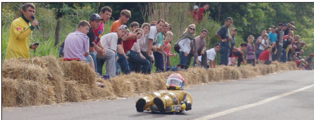
Malarrara Pró-Teutônia é um evento internacional de modalidades radicais que agitam Teutônia em outubro

A exemplo do que já ocorreu em 2009, neste ano de 2010 a administração municipal também investe em equipes de competição que representam e difundem o nome da cidade pelo Rio Grande do Sul. A Prefeitura de Teutônia contribui com uma subvenção mensal de R$ 4 mil para a Associação Teutoniense de Futsal (ASTF), a Teutônia Futsal, que disputa a final da Copa dos Vales de Futsal e que participará da 2ª Divisão do Gaúcho de Futsal. No total são R$ 32 mil de auxílio, repassados mensalmente, de abril a novembro.