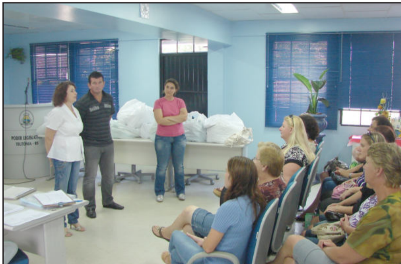
Administração municipal entregou novos equipamentos às cozinhas das escolas