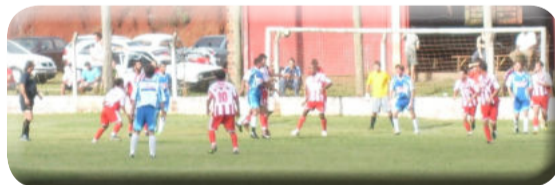
Campeonato Municipal de Teutônia recebe incentivo para a arbitragem de 5 equipes

O governo municipal também concederá, em 2010, subvenção de R$ 10 mil à Liga Teutoniense de Futebol Amador (LTFA). O valor destina-se a viabilizar a realização do Campeonato Municipal de Futebol de Campo, através do pagamento da arbitragem e para a premiação dos vencedores. A competição tem 5 clubes de Teutônia envolvidos na disputa: Esperança de Languiru, Atlético Gaúcho do Loteamento 8, Avante de Boa Vista Fundos, Juventude de Vila Cuba/Linha Frank e União de Linha Germano.