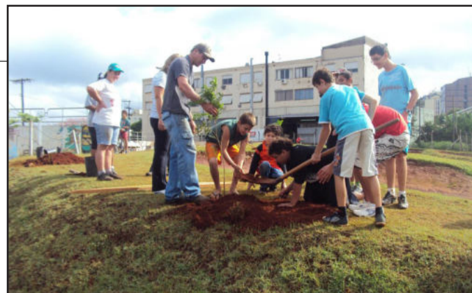
Alunos da Escolinha de Bicicross arborizam área de treino