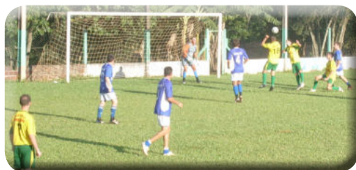
Copa Amadora de Teutônia tem incentivo de arbitragem para 11 clubes

A administração também está autorizada a conceder um auxílio no valor total de R$ 15 mil à Associação Regional de Árbitros (ARA). O recurso destina-se ao custeio da arbitragem para a Copa Amadora de Teutônia, competição que envolve 11 clubes amadores da cidade: Bangu de Posses, Canabarense de Canabarro, Flamengo de Linha Germano, Alto Taquari de São Jacó, Ribeirense de Linha Ribeiro, Lawi de Linha Wink, Ouro Verde do Bairro Alesgut, Cruzeiro do Bairro Languiru, Boa Vista do Bairro Boa Vista, Gaúcho do Bairro Teutônia e Fluminense de Linha Harmonia.