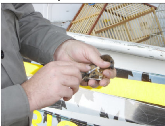
Azulão fêmea ferido