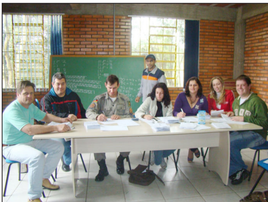
Contagem dos votos em Fazenda Vilanova

Sexto lugar - equipamentos hospitalares para o Hospital Bruno Born de Lajeado e o Hospital Ouro Branco de Teutônia - 17.750.