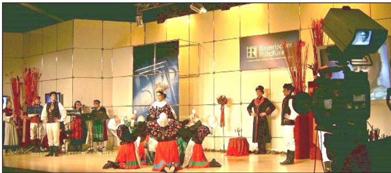
Grupo alemão fará apresentação em Estrela

A Noite de Folclore é uma organização da Soges e Grupos Folclóricos de Estrela-IECLB. Mais informações pelo telefone (51) 3712.1120.