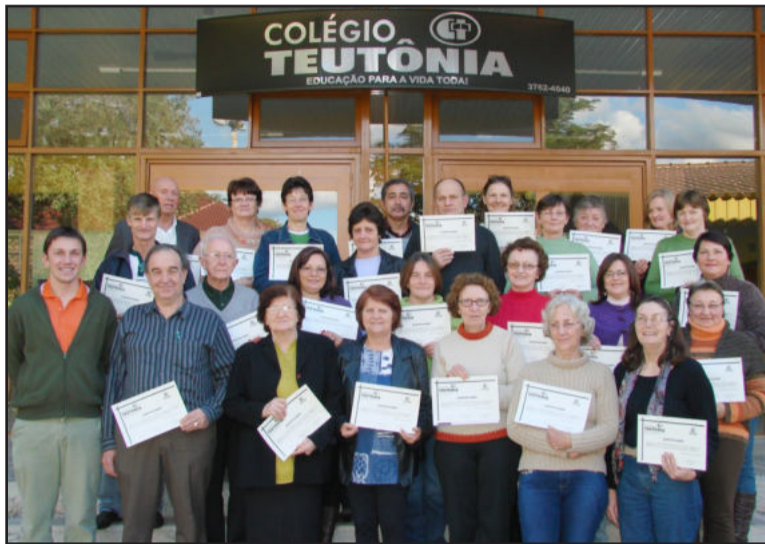
Turma do primeiro semestre com os certificados

“Todo conteúdo é ensinado de forma gradativa e dinâmica, em um ritmo especial, para que possa ser bem assimilado pelo aluno. O principal objetivo é integrar os