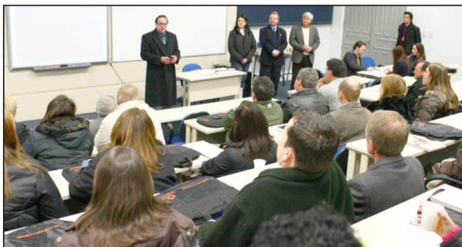
Vice-presidente da Unimed deu as boas-vindas

O MBA será ministrado na Univates e também no Hotel Charrua, em Santa Cruz do Sul. Haverá aulas quinzenais, nas sextas-feiras e sábados, até maio de 2011. A primeira turma, composta por 33 profissionais da Unimed VTRP e da Unimed VTRP, deve concluir o curso este ano.