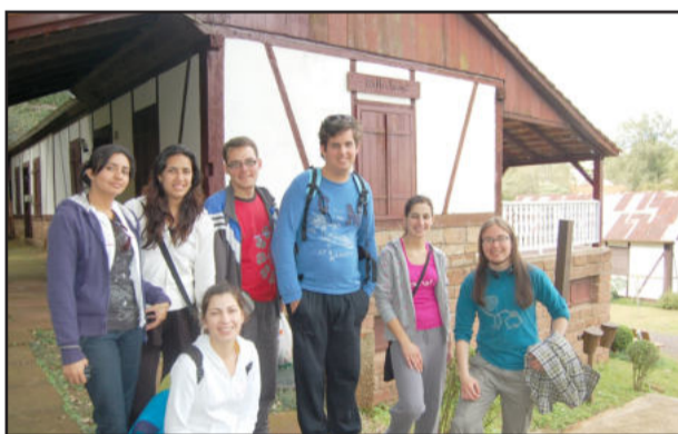
Grupo no Parque Histórico

Um grupo de alunos vindos da Colômbia e de Portugal para intercâmbio de estudos na Univates de Lajeado aproveitou a semana para conhecer diversos pontos turísticos da cidade. Eles estão instalados há duas semanas em moradias de famílias lajeadenses e neste período já foram conhecer o Jardim Botânico, o Parque Professor Theobaldo Dick, o Rio Taquari e o Parque Histórico,