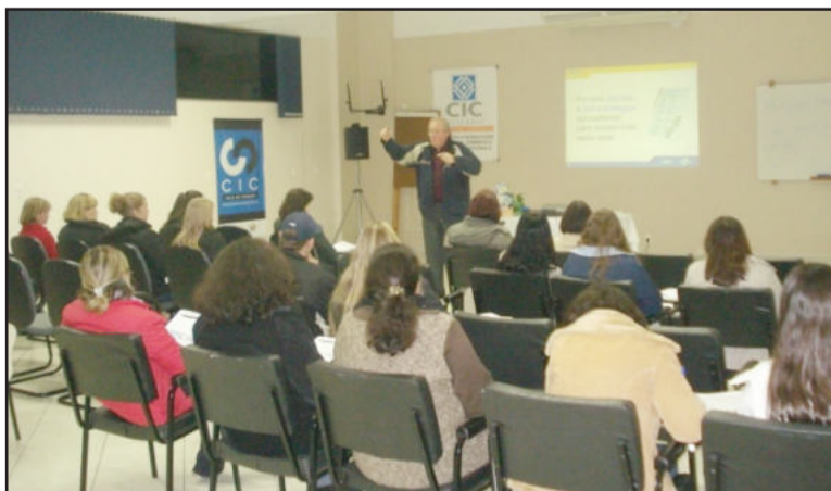
Evento gratuito reuniu 25 pessoas

Com o objetivo de preparar os comerciantes para o Dia dos Pais, apresentando conceitos e ferramentas que auxiliem no desenvolvimento de estratégias de venda, a Câmara de Indústria e Comércio (CIC) e o Sebrae promoveram a palestra "Preparando sua loja para o Dia dos Pais". O evento, gratuito, reuniu 25 pessoas no auditório da CIC. A gestão e a emoção foram focos do evento, que devem caminhar lado a lado o ano inteiro. Estabelecer estratégias, planejar, envolver a equipe, estabelecer metas, aproveitar datas comemorativas como o Dia dos Pais foram os principais temas abordados na palestra. A cada ano o Dia dos Pais torna-se uma das datas mais importantes para o comércio varejista no país.