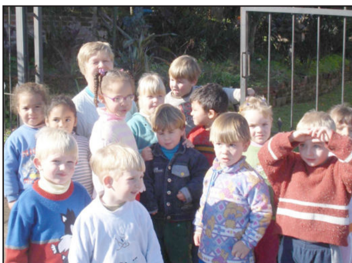
Crianças foram às ruas entregar lembranças

Nos dias que antecederam esta data especial, os alunos trabalharam em sala de aula sobre os avós de cada um, observando fotos e realizando entrevistas, resgatando assim brincadeiras e cantigas. “Com certeza, este foi um momento inesquecível para todos nós”, disseram as professoras.