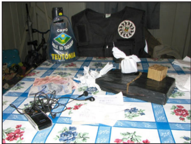
Houve apreensão de drogas

A primeira detenção foi realizada no mês de agosto do ano passado. Os criminosos tiveram a prisão preventiva decretada e foram encaminhados para os presídios de Lajeado, Montenegro, Central e São Leopoldo. O inquérito policial desta operação possui cerca de 435 páginas, com fotos e demais documentações para o processo criminal dos suspeitos. "A Polícia Civil e a Polícia Militar vão continuar intensificando a combate ao tráfico de entorpecentes", finalizou Mallmann.