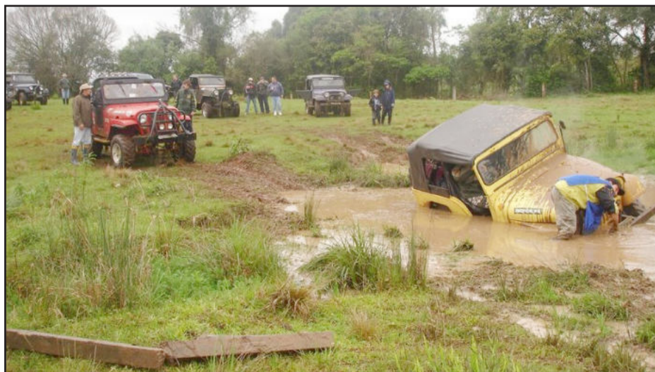
Obstáculos fazem parte das trilhas dos jipeiros