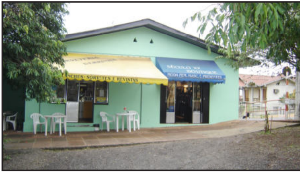
Agente Sicredi no Bairro Teutônia

A comunidade do Bairro Teutônia passará a contar, a partir da próxima segunda-feira, dia 10, com um terceiro Agente Credenciado Sicredi. A Loja Século XX passará a atuar como empresa autorizada para a arrecadação de contas de água, luz, telefone e boletos em nome da Sicredi Ouro Branco. Além dela, a loja Raio de Sol - Rede Mundi, localizada no Bairro Canabarro, e a loja Rivin, no Bairro Languiru, também atuam desta forma em Teutônia.