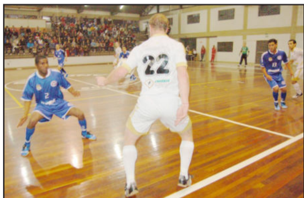
Depois do empate em casa, ASTF joga em Alvorada

Na noite deste sábado, dia 8, a Associação Teutoniense de Futsal (ASTF) faz seu penúltimo jogo da fase classificatória do Gauchão de Futsal da 2ª Divisão. A partida será em Alvorada, diante do Real Academia, que é terceira colocada da Chave A, com 13 pontos. A ASTF está em quarto, com 11 pontos. Uma vitória fora de casa pode representar a terceira colocação ou até mesmo a vice-liderança, além de carimbar a classificação antecipada.