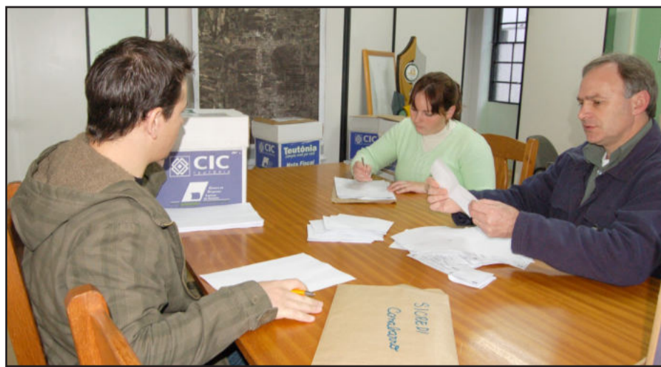
Apuração dos votos manuais em Teutônia

A Consulta Popular também superou todas as expectativas em Fazenda Vilanova. No total, 901 eleitores, que correspondem a 32,98% do eleitorado, cumpriram com sua cidadania e depositaram seus votos nas