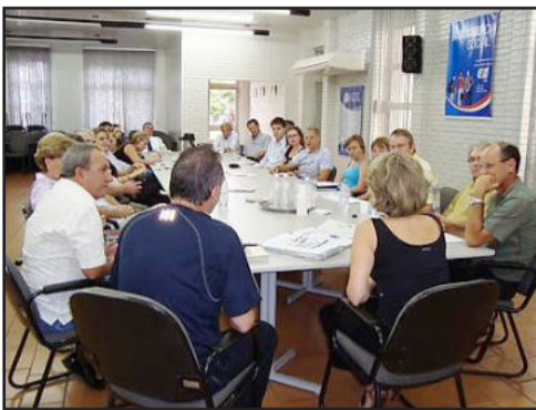
Comissão da Construmóbil na expectativa de grande evento

Em 2008 o volume de negócios na feira alcançou R$ 14,72 milhões, um crescimento de 22,6% em relação ao ano anterior. Do total de público de 30 mil visitantes, 75% eram de Lajeado e 25% de outros municípios do estado.