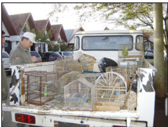
Gaiolas e pássaros foram recolhidos

Em uma ação de combate ao crime ambiental na tarde desta quinta-feira, dia 6, resultante do trabalho da Polícia Civil de Teutônia, foram apreendidas gaiolas, equipamentos para caça de aves e 21 pássaros silvestres, em Teutônia. O Batalhão da Patrulha Ambiental da Brigada Militar acompanhou as buscas, que ocorreu em uma casa no Bairro Teutônia. Os agentes encontraram um pássaro ferido pela instalação de uma anilha de identificação falsa. Conforme os servidores, no local eram criados papagaios, cardeais, canários-da-terra, trinca-ferros, sargentos, azulões, periquitos, pintassilgos, entre outros pássaros. Como o criador não possuía registro das aves, nem autorização para mantê-las em cativeiro, deverá pagar multa mínima de R$ 500,00 por espécime. Se algum dos pássaros integrar lista de extinção a multa poderá chegar a R$ 5 mil por unidade.