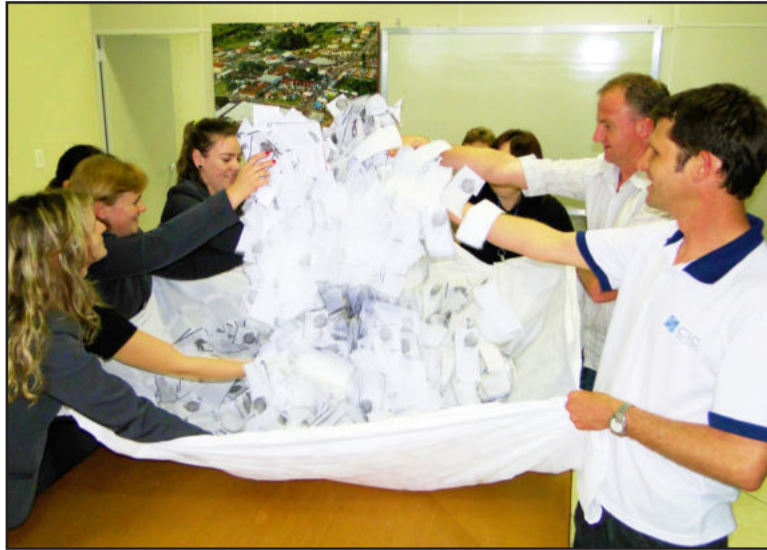
Sorteio foi realizado nesta quinta-feira

A Campanha Natal de Prêmios Teutônia teve início no dia 1º de setembro e se estende até o dia 26 de dezembro. Conta com a participação de 165 empresas, que já retiraram 165,2 mil cautelas. O próximo sorteio, que distribui mais um televisor LCD 32 polegadas e dois vale-compras no valor de R$ 200,00 cada, ocorre no dia 11 de novembro. Em dezembro serão dois sorteios, o primeiro no dia 9, quando serão distribuídos um televisor LCD 32 polegadas, um notebook e dois vale-compras no valor de R$ 200,00 cada. Já no dia 29 de dezembro ocorre o sorteio de um automóvel zero quilômetro, uma viagem de quatro dias para Natal, Capital do Rio Grande do Norte, com direito a um acompanhante, e quatro