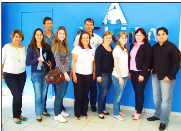
Colaboradores da CIC Teutônia com equipe da Acigra

Para o dia 29 de outubro a entidade estuda visita técnica à coirmã Associação Comercial e Industrial de Santa Cruz do Sul. A meta da entidade é realizar visitas do gênero pelo menos duas vezes ao ano.