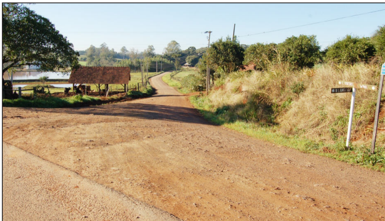
Estrada liga Linha Ribeiro com a Linha Wink

A décima-quarta ação do programa “Teutônia 29 Anos, 29 Ações”, encabeçado pela Administração Municipal, foi anunciada nesta semana pelo prefeito Renato Airton Altmann, pelo vice-prefeito Ariberto Magedanz e secretários municipais. É a primeira etapa da obra de pavimentação da Estrada Geral de Linha Ribeiro, que interliga o Bairro Canabarro a Linha Wink, encurtando a distância com Estrela.