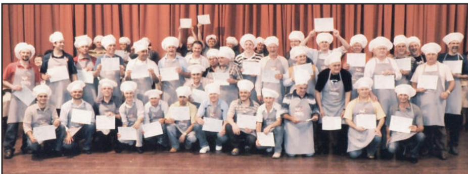
Gourmets preparam pratos de forma voluntária

O Lar do Idoso Opa Haus e Escola de Educação Infantil Cirandinha, através do Clube de Mães Lar da Amizade, agradecem pela colaboração dos gourmets e voluntários que contribuem para que este evento se realize.