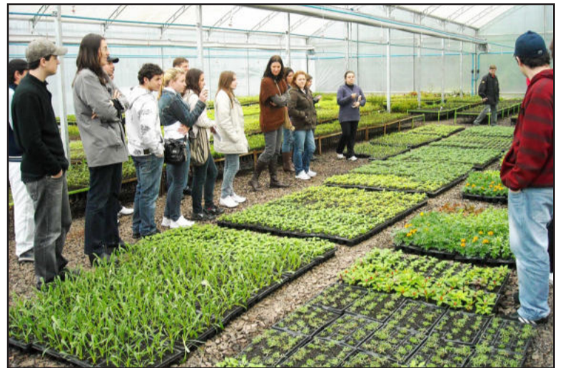
Visita ao viveiro de mudas da Certel

O grupo fará um trabalho no Arroio Jacarezinho, em Encantado, com mutirão de limpeza e plantio de mudas doadas pela cooperativa. “A Certel ficou na cabeça dos acadêmicos como uma empresa preocupada com o meio ambiente”, acrescenta a professora.