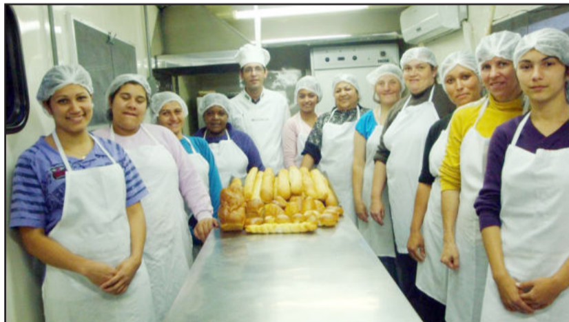
Turma que participou do curso