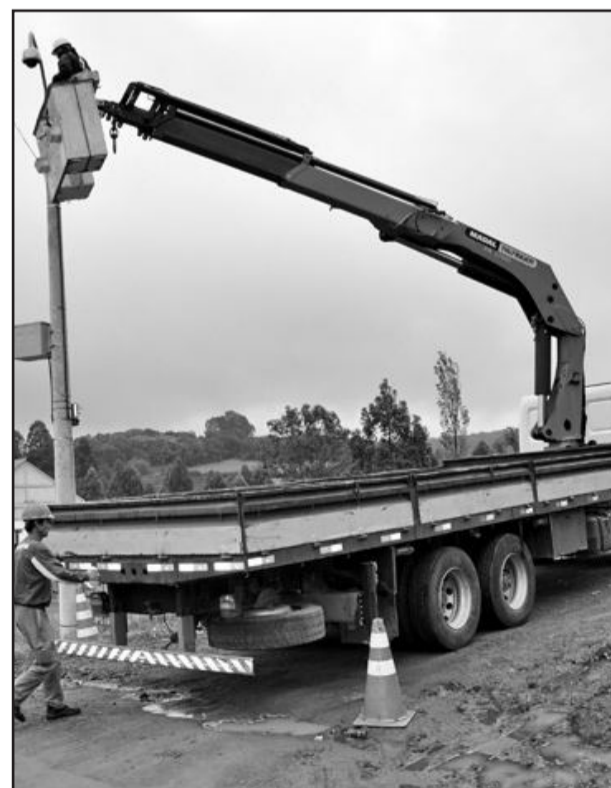
Começa a instalação das câmeras