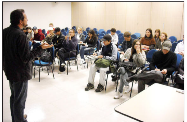
Turma foi recepcionada no auditório da Certel