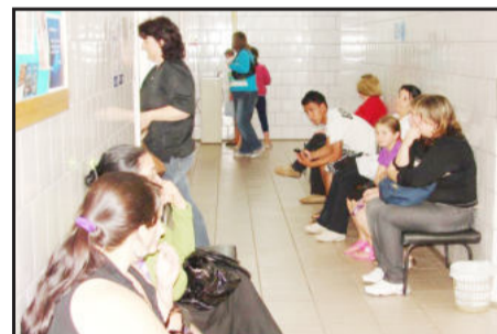
Procura por atendimento é elevada