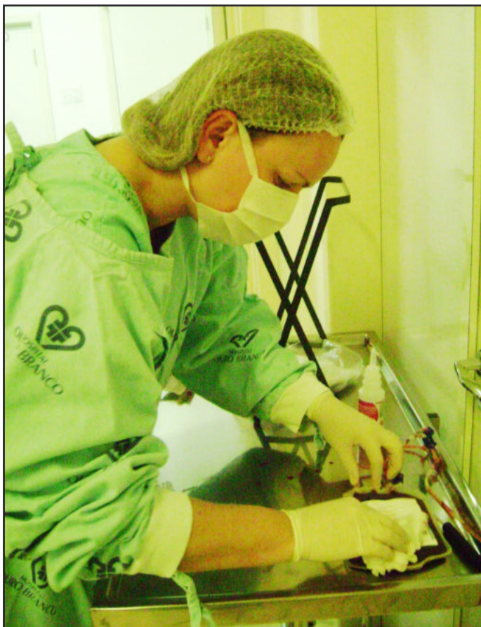
Enfermeira do HemoCord realiza coleta de células-tronco do cordão umbilical

O material coletado será congelado e guardado no HemoCord - Banco de Células-Tronco de Cordão Umbilical, em Porto Alegre. A coleta foi realizada por enfermeira contratada pela empresa da capital, que atende as regiões do Vale do Taquari e Rio Pardo.