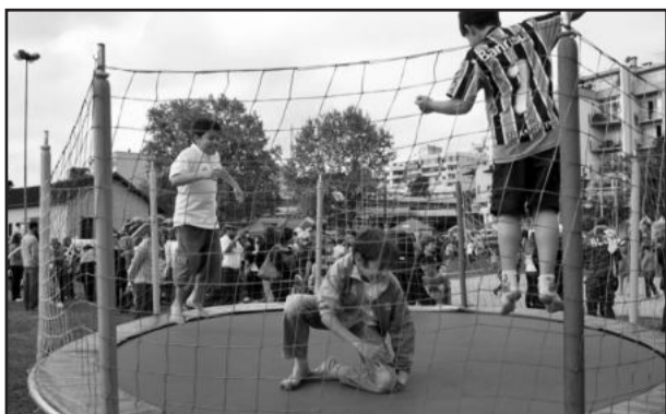
Dia da Criança terá atividades no parque

Na terça-feira, dia 12 de outubro, Dia da Criança, diversas atividades esperam pelos pequenos no Parque da Estação em Carlos Barbosa. A partir das 14 horas, haverá palhaços, pernas de pau, esculturas em balões, personagens-sombra, salão de beleza infantil, brinquedos infláveis, brincadeiras e muita animação para comemorar a data.