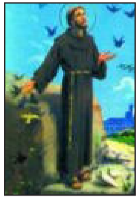
4 de Outubro - São Francisco de Assis e a Ecologia 5 de Outubro - Dia das Aves