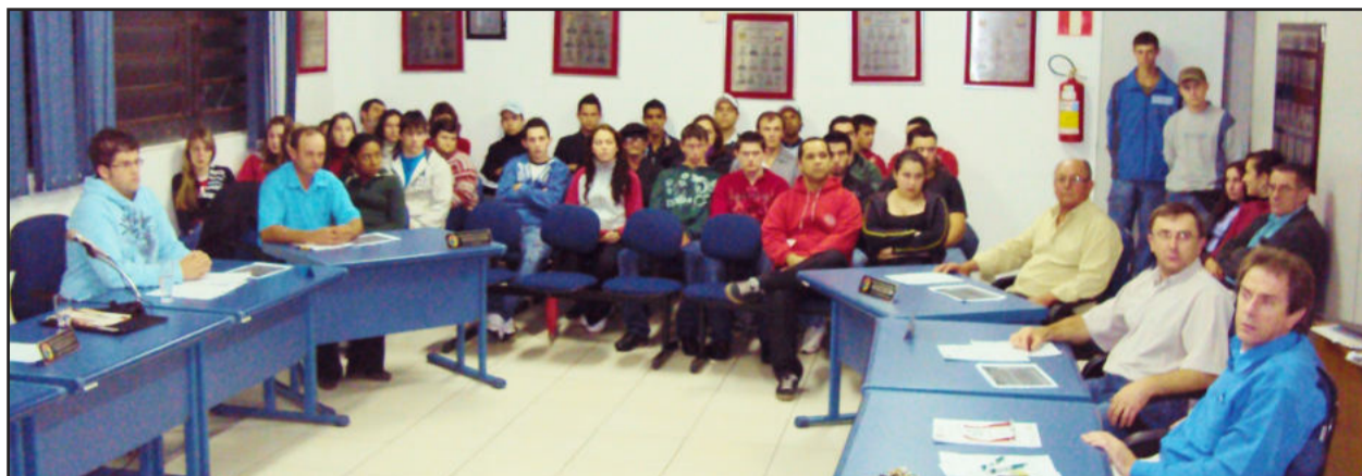
Estudantes do terceiro ano da escola estadual de Paverama lotaram o plenário