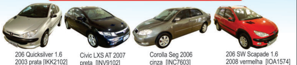
206 Quicksilver 1.6 2003 prata [IKK2102]

Quer vender seu carro? A Cia do Carro vende pra você.