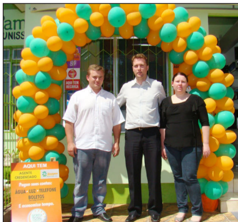
Momento da inauguração do novo Agente Credenciado Sicredi

No S & S Centro de Formação Profissional os associados e toda a comunidade poderão efetuar o pagamento de contas de água, luz, telefone, guias da Previdência Social (GPS) e boletos com rapidez e facilidade em horário comercial. Além disso, os Agentes Credenciados agora também recebem pagamento de boletos do Sicredi já vencidos. O estabelecimento está localizado na Rua Major Bandeira, 514, Bairro Alesgut. O telefone é (51) 3762-2178.