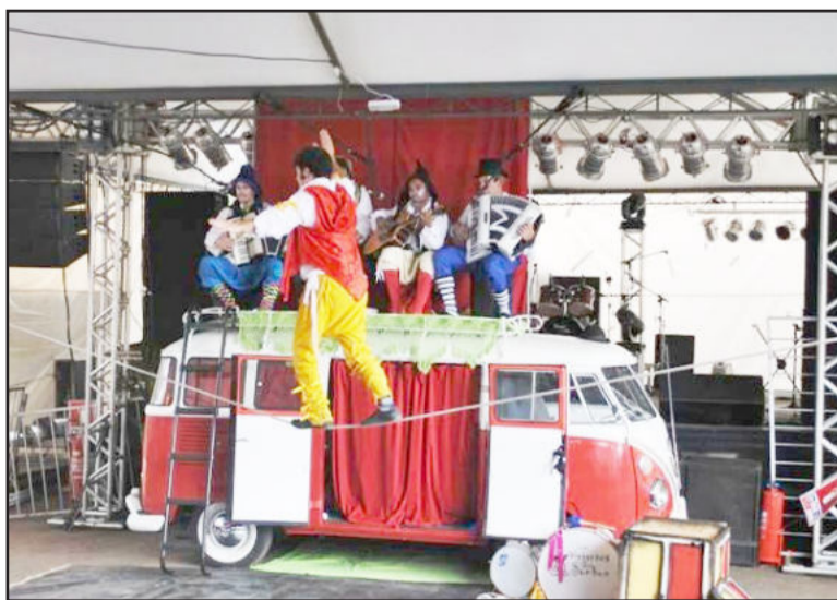
La Bombita será apresentada hoje

Com duração de uma hora, a peça "La Kombita" conta a história de cinco artistas vindos de um tempo indefinido. Eles viajam com sua máquina do tempo - que é uma Kombi ano 1971, acordando em praças e lugares inspiradores. Com um misto de teatro, música, arte circense e um visual que lembra os hippies da década de 70 e saltimbancos da idade média,