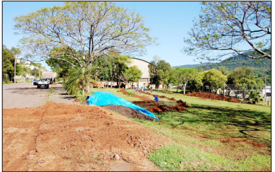
Praça está sendo readequada ao lazer comunitário