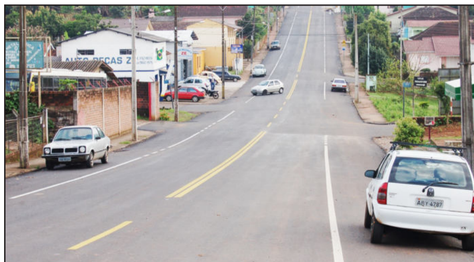
Rua Carlos Arnt ficou com visual moderno e muito bonita após capeamento. Ainda está em construção a nova calçada