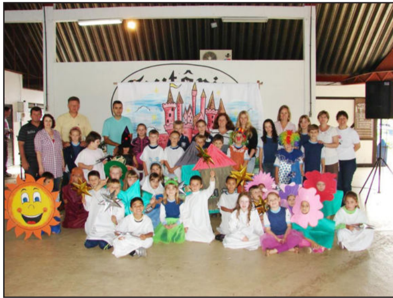
Escola Professor Alfredo Schneider representou o tema Esperança

Na próxima segunda-feira, dia 13, as escolas municipais 24 de Maio e Teobaldo Closs, ambas do Bairro Canabarro, realizarão apresentações enfocando o tema Alegria. Já no dia 20 de dezembro, as escolas de Educação Infantil representarão o tema Vida em suas apresentações. Todas ocorrem no Centro Cívico Municipal do Centro Administrativo.