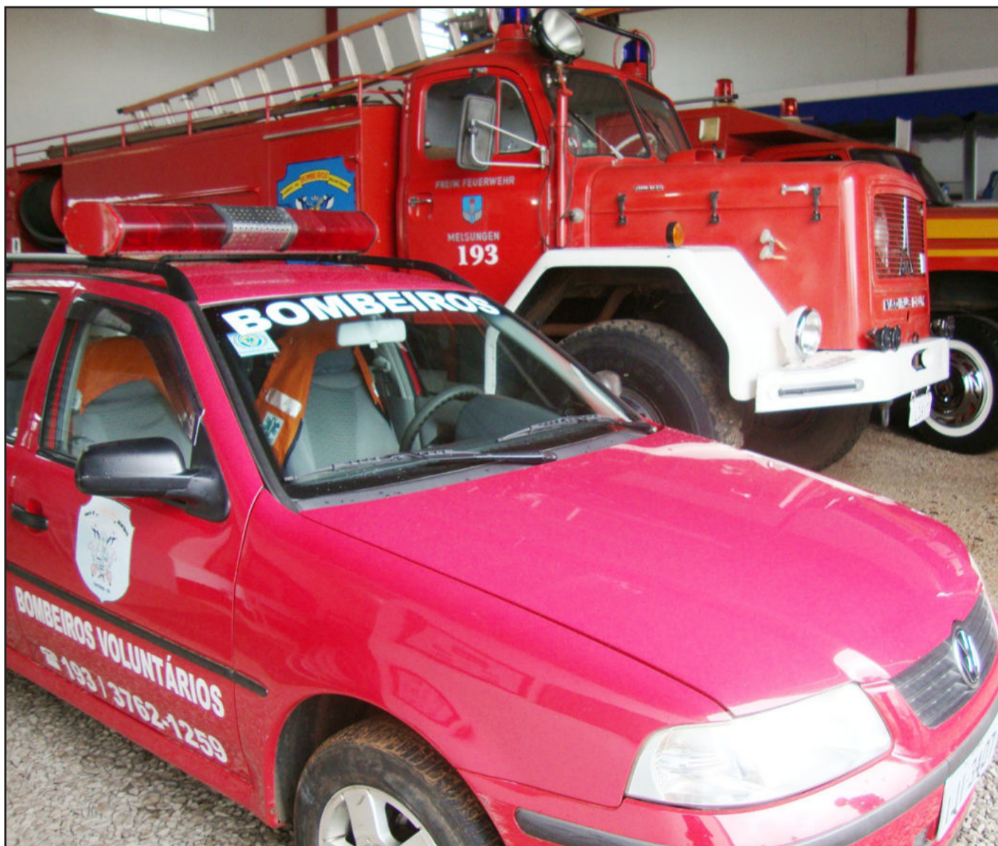
Bombeiros Voluntários de Teutônia

Há oito anos prestando serviços à comunidade