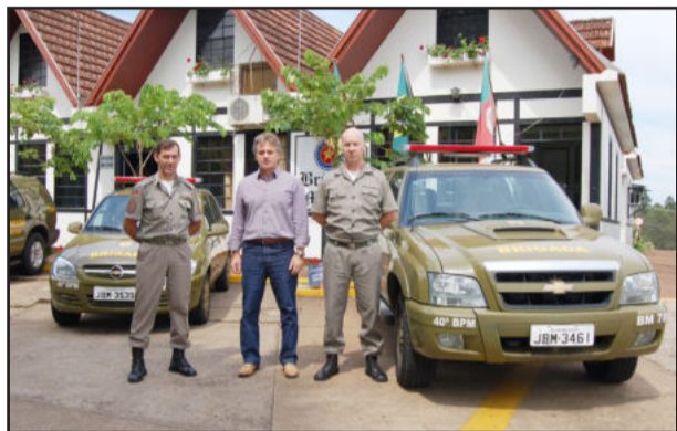
Novas viaturas para a Brigada Militar de Teutônia

A 2ª Companhia do 40º Batalhão da Brigada Militar, localizada em Teutônia, foi contemplada com duas novas viaturas para reforçar a atuação da corporação. São uma camioneta S-10 Rodeio e um carro Prisma, ambos zero quilômetro, para realizar o policiamento normal na cidade e no interior. Os veículos foram entregues pelo governo do Estado, chegaram há alguns dias em Teutônia e, após os desembarços, entram em operação.