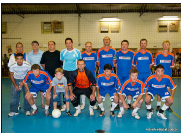
Pillar Mat. Const/ Bebidas Canabarro, campeão no Veterano