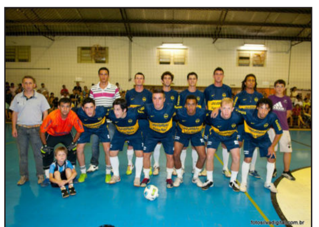
Universal Tintas, vice-campeão no Força Livre