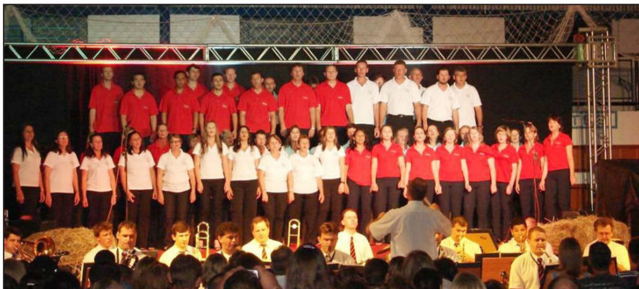
Grande Coral encantou com suas belas interpretações natalinas

Nesta semana têm continuidade os espetáculos natalinos 2010 sob o tema Janelas do Amor, que na segunda-feira à noite, dia 06, brindou a comunidade do Bairro Languiru com um show inesquecível junto à Comunidade Evangélica Martin Luther. Assim como nas apresentações anteriores, novamente a sincronia entre os atores teutonienses, dançarinos, grande coral e a Orquestra Municipal, que se intercalaram durante o show, foi perfeita. O público que foi prestigiar o grande show novamente teve uma recepção calorosa, com música executada pelos alunos do Conjunto Instrumental do Centro Cultural 25 de Julho.