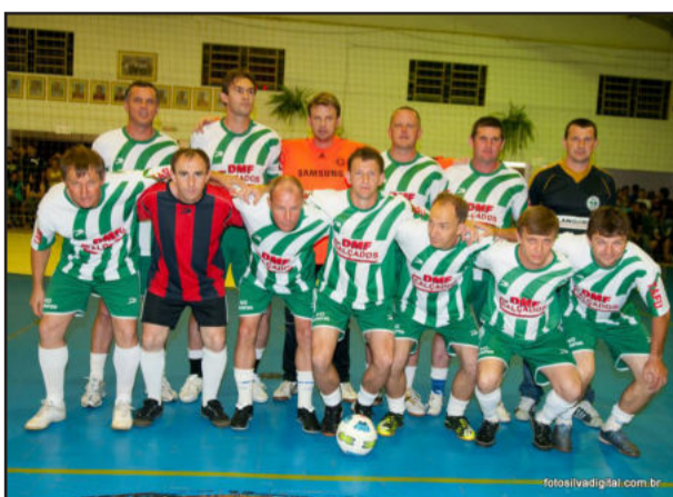
Tá Lentos/DMF, vice-campeão no Veterano