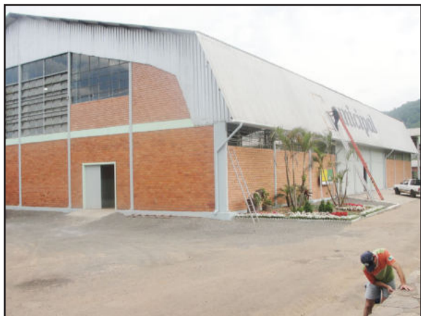
Equipe da Secretaria Municipal de Obras trabalha na finalização da obra que será entregue dia 10 de dezembro

Para marcar a inauguração, a quadra recebe a final do 7º Campeonato Municipal de Futsal. Às 20 horas, ocorre a final da categoria Feminino entre as equipes Só Fúlia e Monstras S/A. Às 21 horas, Fleishbier e São Pedro do Maratá disputam a final do Veterano e, às 22 horas, inicia a decisão do Força Livre com o confronto entre São Pedro do Maratá e Kekambas. Um total de 21 equipes disputaram o campeonato, que iniciou no dia 17 de setembro e teve rodadas sempre às sextas-feiras no ginásio de São Pedro do Maratá, culminando com a inauguração do Ginásio do Parque nesta sexta.