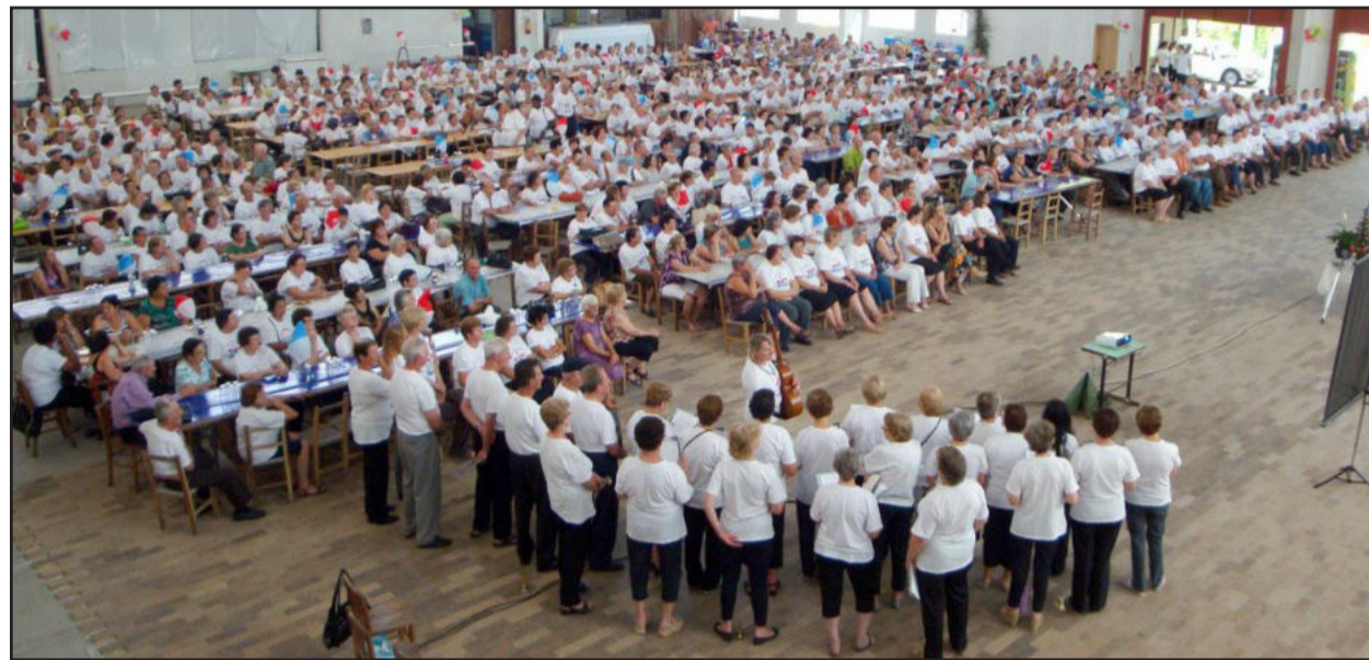
Mais de 900 idosos participaram do encontro

Mais de 900 idosos do Grupo de Apoio e Convivência do Idoso Estrelense e do Projeto Vida Saudável participaram durante esta quarta-feira, dia 8, do Encontro Anual de Integração de Natal, promovido pela Prefeitura, por meio das secretarias municipais de Saúde e Assistência Social e Esportes e Lazer, no Centro Comunitário Cristo