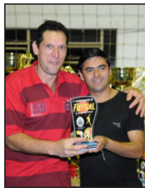
Gringo (e), da Pillar/ Bebidas Canabarro, representou a equipe com a defesa menos vazada no Veterano