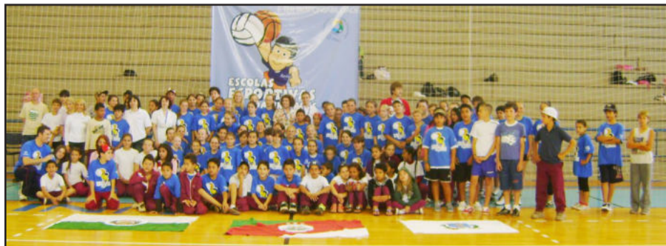
Criançada divertiu-se com atividades esportivas no Complexo da Univates