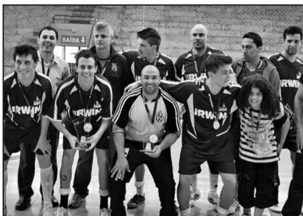
Meninos de Ouro são os vencedores do 1º Campeonato dos Trabalhadores