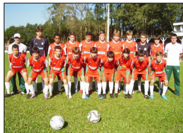
Juventus perdeu a primeira semifinal

ni (Meninos de Ouro - 12 gols) e o goleiro menos vazado foi Aldori de Quevedo (Meninos de Ouro - sofreu 3 gols). Ambos foram premiados com troféus.