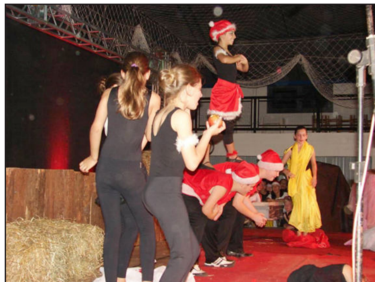
Grupo Danças & Ritmos do Cemef durante a apresentação