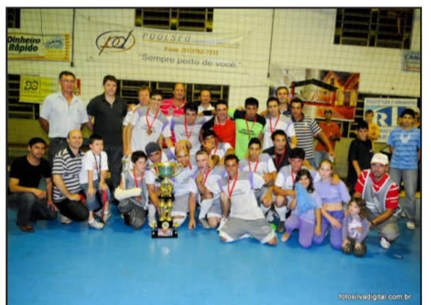
Baixada do Sapo, campeão no Força Livre