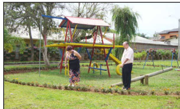
Prefeito e primeira-dama acompanharam trabalhos de melhorias no parque

Na última semana o Parque 13 de Abril passou por uma verdadeira revitalização. Nos dois parques de diversão que funcionam no local foram feitos reparos de rotina, e também foram pintados os brinquedos, deixando o ambiente ainda mais bonito para que as crianças possam brincar a vontade e se divertir com segurança.