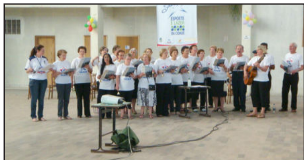
Coral do Gracie fundado em 2009

A programação iniciou às 9h30min, com recepção; teve culto ecumênico; apresentação do Coral do Gracie; apresentação das atividades do Gracie e pronunciamentos; almoço. À tarde, apresentações artísticas e baile de integração.