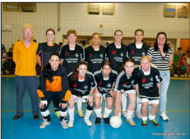
Eletrodiesel Hirt/ Frutas Marmantini, campeã no Feminino