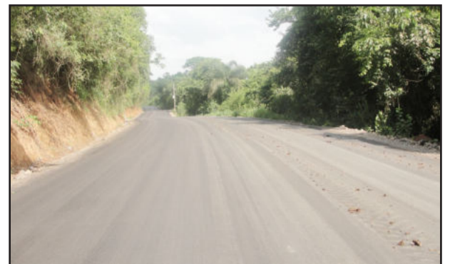
Estrada Vitória/Santos Reis já conta com o primeiro quilômetro de asfalto

A ligação asfáltica entre os municípios de Maratá e Montenegro, pelas localidades de Vitória e Santos Reis, um dos principais sonhos da comunidade marataense desde a emancipação, em 1993, agora já é realidade. A Encopave, empreiteira responsável pelas obras, concluiu ontem o asfaltamento do primeiro quilômetro desta via, partindo da Rua Miguel Schneider em direção à localidade de Vitória.