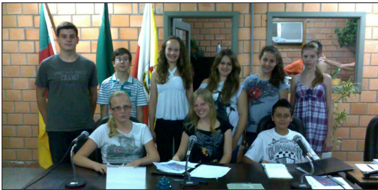
Vereadores mirins realizaram último encontro nesta semana