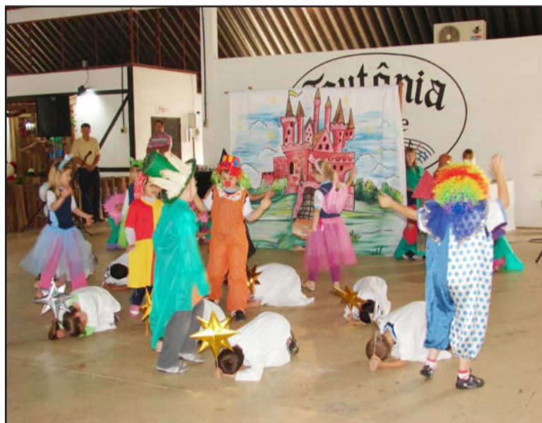
Apresentações são realizadas no Centro Cívico Municipal