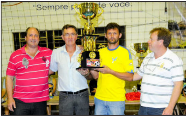
Amigos do Nenê/Giba Bar foi o campeão da disciplina no Força Livre