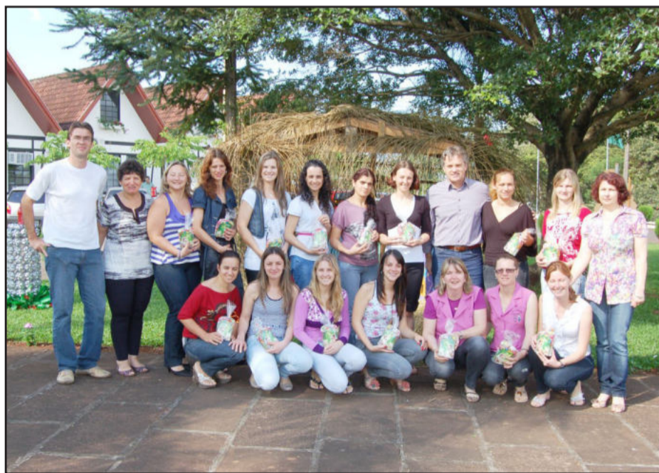
Encerramento do ano com as escolas de Educação Infantil