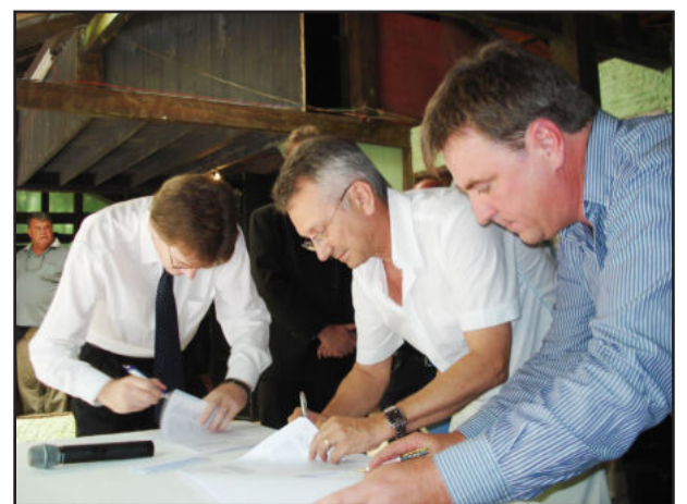
Asfalto se tornou realidade 11 meses após assinatura do convênio, ocorrida com festa em 14 de janeiro deste ano

Nesta terça-feira, dia 07, o prefeito esteve reunindo em Brasília com o diretor de Infraestrutura Turística do Ministério do Turismo, Roberto Bortolotto, acompanhado do senador Sérgio Zambiasi (PTB) e do deputado estadual eleito Ronaldo Santine (PTB). "Tivemos a garantia da continuidade da liberação de recursos para Maratá", revelou. Reidel solicitou também a liberação de recursos para o trajeto Transcitrus 2 (etapa Pinheiro Machado - Poço das Antas), o que foi prontamente atendido. A retomada das obras neste trajeto deve ocorrer logo no retorno do prefeito de Brasília, quando a empreiteira será comunicada.