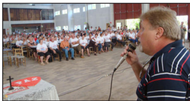
Celso enfatizou que idosos devem ter saúde