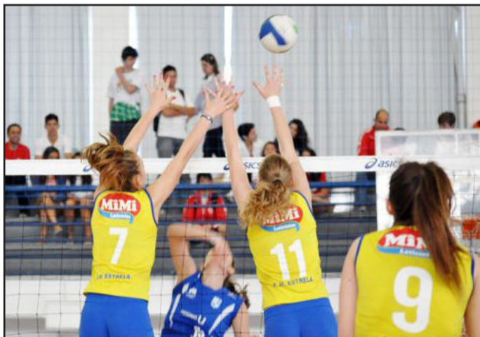
Meninas de Estrela vão mostrar seu talento em Goiânia na busca de mais um título

O técnico Vacho, um dos avaliadores, ficou muito satisfeito