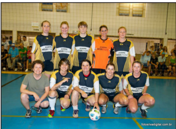
Academia Mega Sports, vice-campeã no Feminino