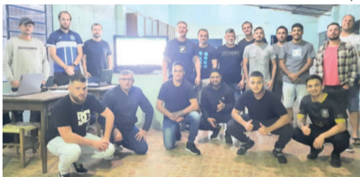
Reunião técnica explanou dúvidas e organizou os detalhes finais da competição