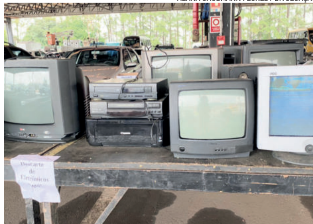
Meia carga de lixo eletrônico foi recolhida no evento