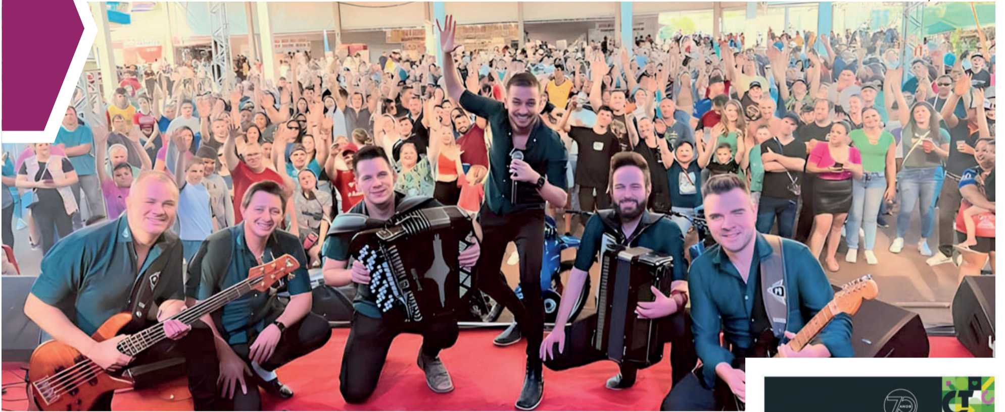
Show da Família trouxe seis bandas ao palco da Trilha do Carvão