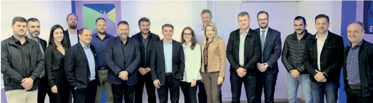
Secretário Nacional de Comunicação do Governo Federal (c) esteve na E-log na segunda-feira (7/8)