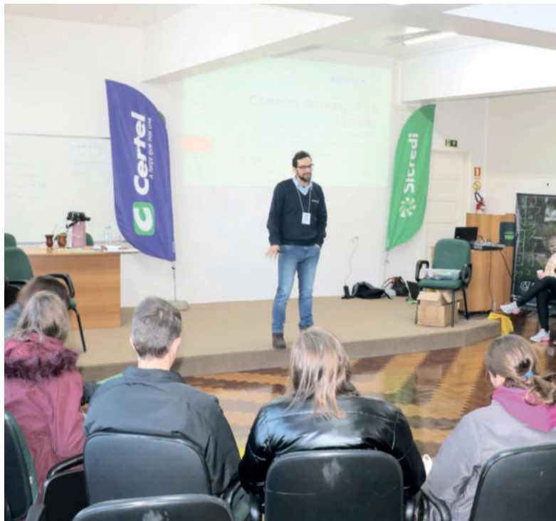
Encontros buscam trabalhar com os jovens a sucessão rural

As inscrições podem ser feitas até hoje, quarta-feira (9/8), por meio do link disponível no QR Code abaixo.