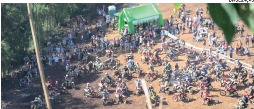
Evento se tornou o maior do país

O Município de Poço das Antas oportuniza aos cidadãos cadastrados no programa Nota Fiscal Gaúcha e que informarem seu número de CPF nos documentos fiscais de compras efetuadas no Município, a participação em sorteios mensais de prêmios no valor de R$ 200,00, sendo dois contemplados por mês. O valor é patrocinado pela Administração Municipal. Cadastre-se agora mesmo e participe você também dos sorteios municipais e estaduais. Acesse www.notafiscalgaucha.rs.gov.br e exija o CPF nas notas fiscais. Para os contribuintes cadastrados no NFG ainda têm prêmios patrocinados pela Secretaria Estadual da Fazenda (SEFAZ) RS, como sorteios aleatórios e da Receita Certa. Acesse o site e fique por dentro!