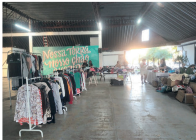
Na Feira, ONGs puderam realizar brechó e vendas para arrecadar fundos