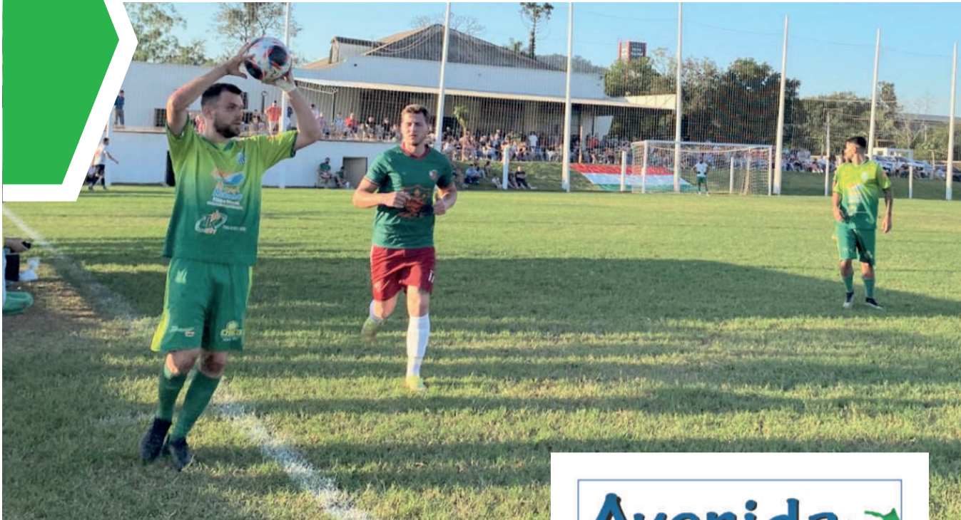
Em Teutônia, Canabarrense e Juventude de Taquari ficaram no 1 a 1