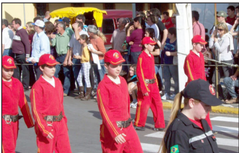
Bombeiros Voluntários Mirins de Garibaldi