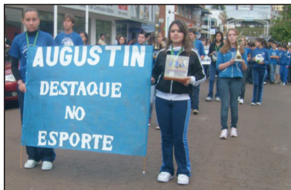
Conquistas no esporte foram enfatizadas