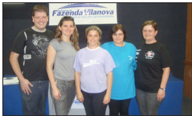
Diretoria assume por dois anos