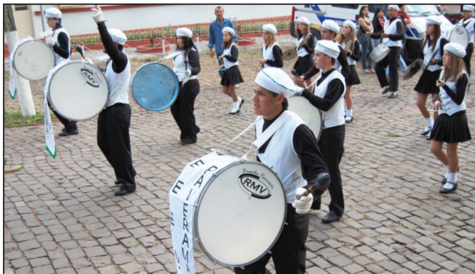
Banda marcial cadenciou o desfile

Os artigos assinados são de inteira responsabilidade de seus autores e não traduzem necessariamente a opinião do jornal nem a do editor.