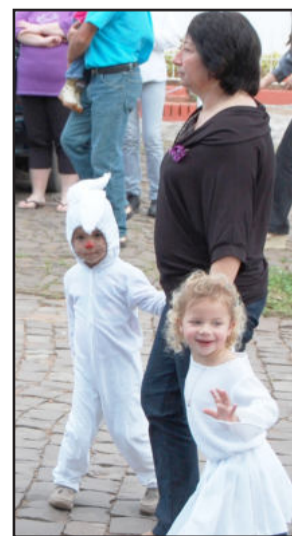
"Coelhinho da Páscoa"