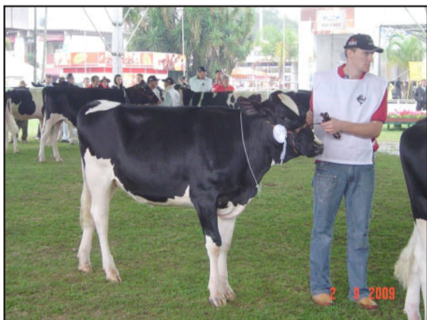
Novilha leiloadada na Expointer

Quatro produtores de Westfália expuseram 10 animais na Expointer 2009. Participaram a Granja Rutz, a Granja Feldmann, a Granja Brockmann e a Granja Trapp e Osterkamp. A exposição serviu para troca de experiência entre os produtores, e por mais que o objetivo não fosse