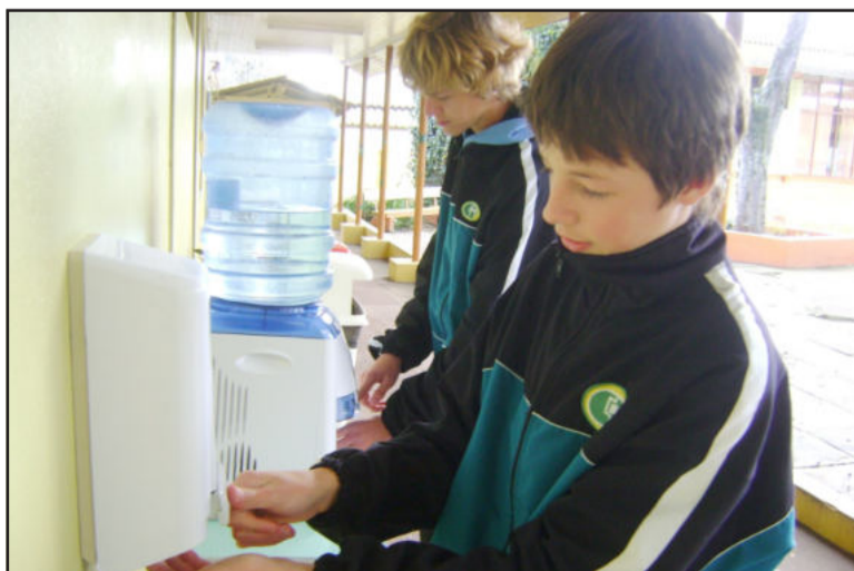
Água em bombonas e álcool à disposição dos alunos

Neste período de alerta em função da nova gripe, toda comunidade escolar também teve a oportunidade de participar de palestras com o médico Luís Mattiello sobre medidas preventivas contra o vírus, além de cuidados especiais tomados pela escola. Os alunos são orientados a realizarem a higienização das mãos com água e sabão, janelas e portas de todos os ambientes da escola permanecem abertas, as salas de aula receberam frascos de álcool gel, os bebedouros foram substituídos por bombonas de água potável nos corredores dos dife-