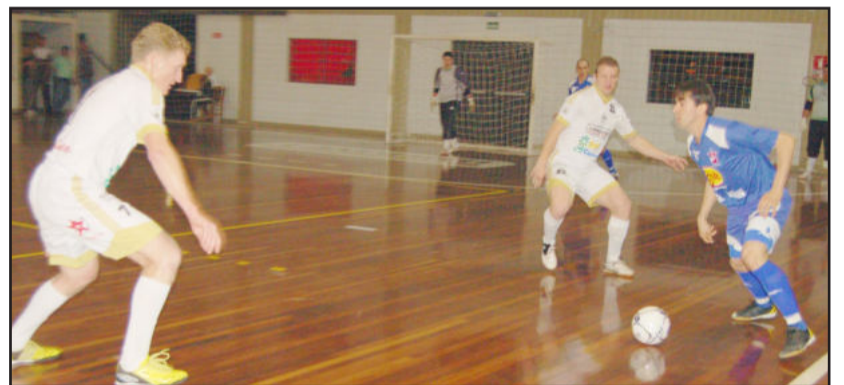
Marcação forte da ASTF foi um dos diferenciais

A torcida jogou bastante ao lado da equipe na noite de sábado, dia 5, e incentivou os jogadores em vários momentos, principalmente quando a situação complicou. Para o próximo sábado, dia 12, a diretoria e a comissão técnica esperam a presença de um público ainda superior para empurrar à equipe à segunda vitória.