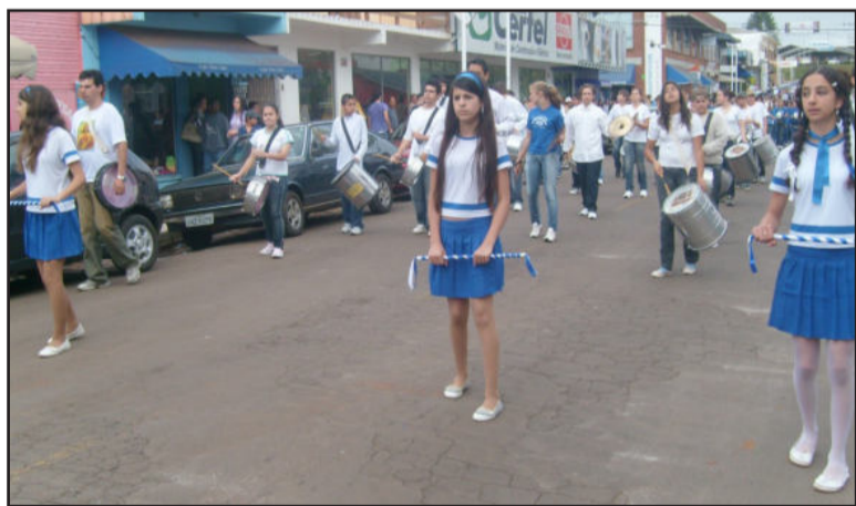
Banda marcial da escola conduziu o ritmo