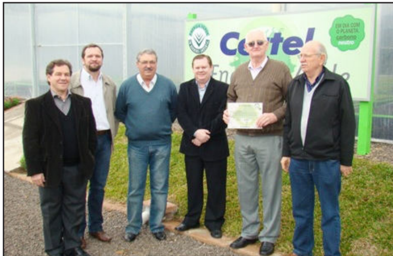
Recebimento do Selo de Carbono Neutro