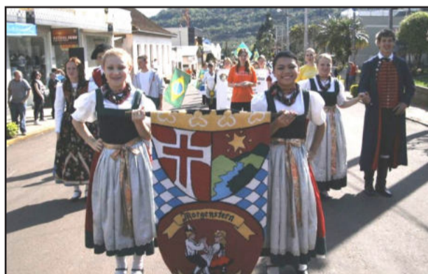
Grupo de danças Morgenstern