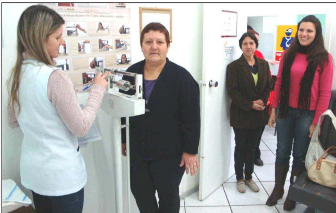
Semanalmente é efetuado o monitoramento do peso de cada usuário