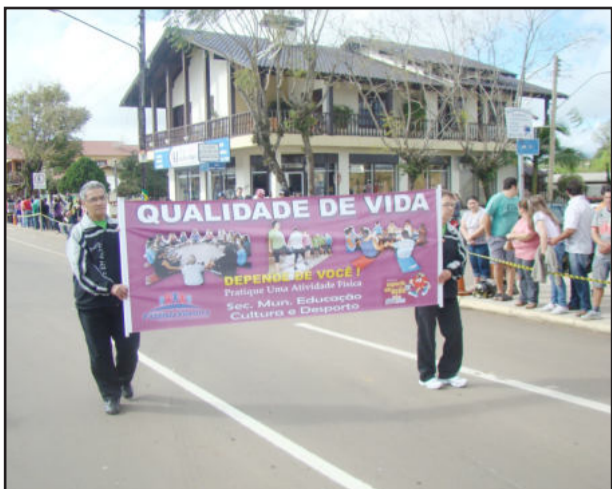
Tema do desfile foi "Qualidade de Vida"