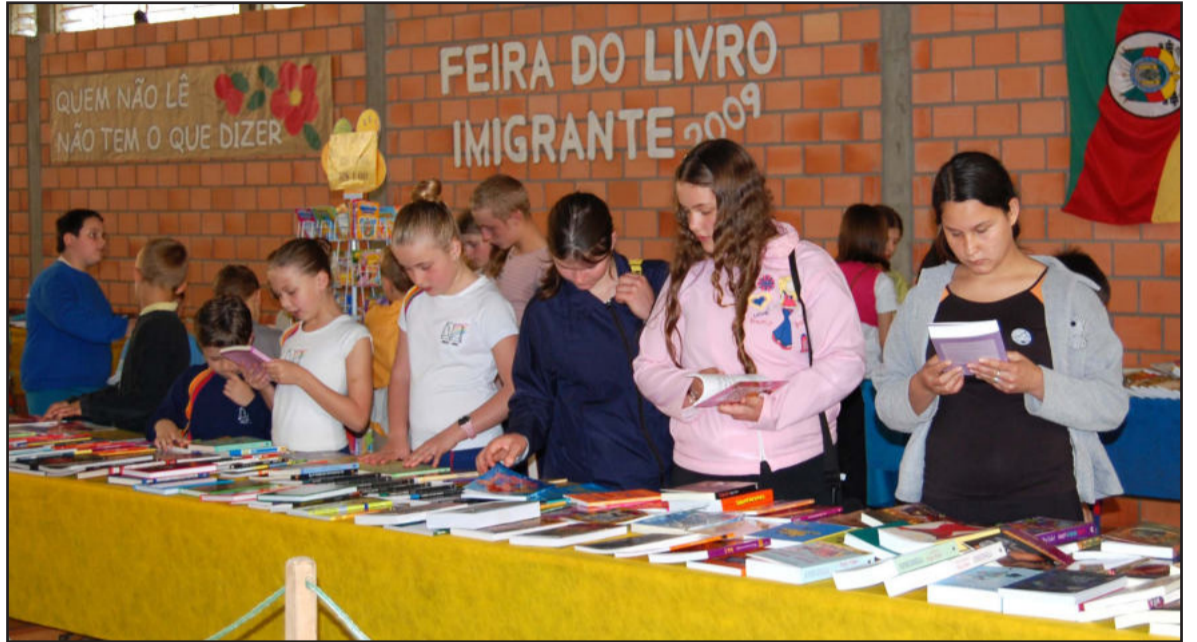
Feira do Livro atraiu atenção de alunos

A Prefeitura de Imigrante, por intermédio da Secretaria Municipal de Educação, promoveu, na sexta-feira e no sábado, a tradicional Feira do Livro e Sessão Cívica em homenagem à Pátria.