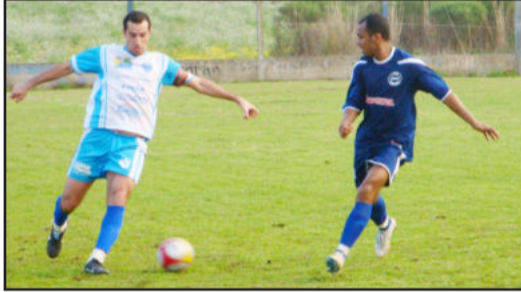
Jogo de alto nível teve muitas faltas e cartões