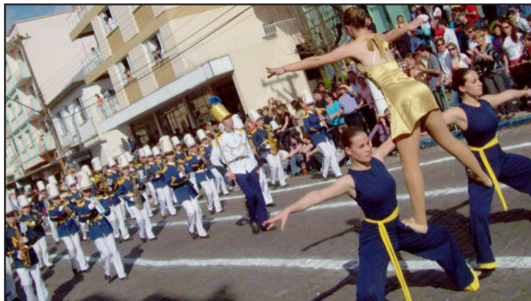
Banda do Instituto de Educação Irmã Branca

Mais de 3,8 mil pessoas participam do desfile cívico de Carlos Barbosa na manhã desta segunda-feira, dia 7. Eram alunos de escolas do Município, entidades esportivas, grupos culturais, associações étnicas, CTGs e piquetes. Também participaram a Banda Marcial do Centro Educativo Crescer e a Banda Musical Professor Danilo Chisini, do