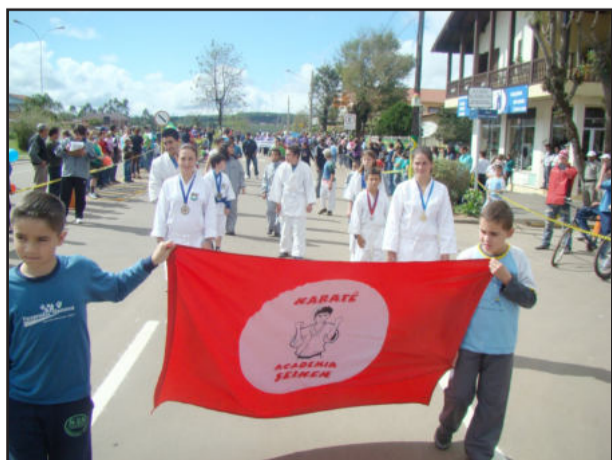
Academia de Karatê

Instituto Estadual de Educação Professora Irmã Teofânia, de Garibaldi. Os pelotões seguiram pela Rua Rio Branco, a partir da Rua XV Novembro, até o calçadão, onde seguiam pela Rua Buarque de Macedo em direção ao Centro Administrativo Municipal, local de encerramento do desfile, que teve a participação de 45 entidades.