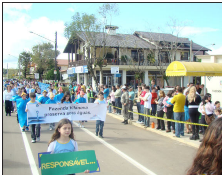
Comunidade assistiu ao desfile das entidades

No compasso da batida marcial das bandas Municipal de Fazenda Vilanova, composta por alunos da Escola Edgar da Rosa Cardoso, e da Escola Anita Ferreira de Mo-