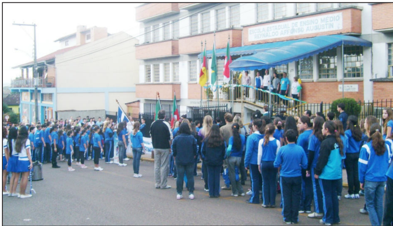
Defronte à escola, momento cívico com o Hino Nacional

Na manhã de sábado, dia 5 de setembro, foi realizado o desfile cívico da Escola Estadual de Ensino Médio Reynaldo Affonso Augustin, do Bairro Canabarro. A programação iniciou às 9 horas, na Rua Capitão Schneider, em frente a Calçados Piccadilly. Professores, alunos uniformizados e a Banda Marcial da escola enfeitaram as ruas Capitão Schneider e Dom Pedro II, com o colorido das bandeiras e faixas, homenageando o Brasil e emocionando o público que assistiu. Após o desfile, houve momento cívico defronte à escola.