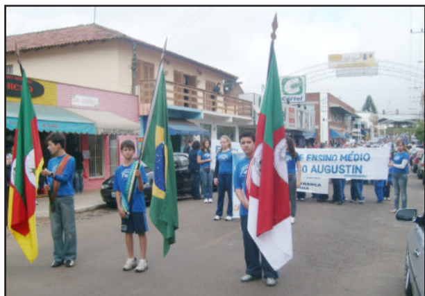
Desfile dos alunos começou na Rua Capitão Schneider