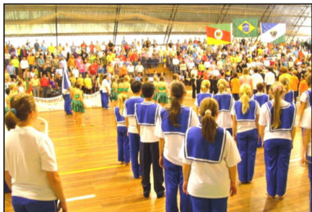
Alunos em ação na sessão cívica