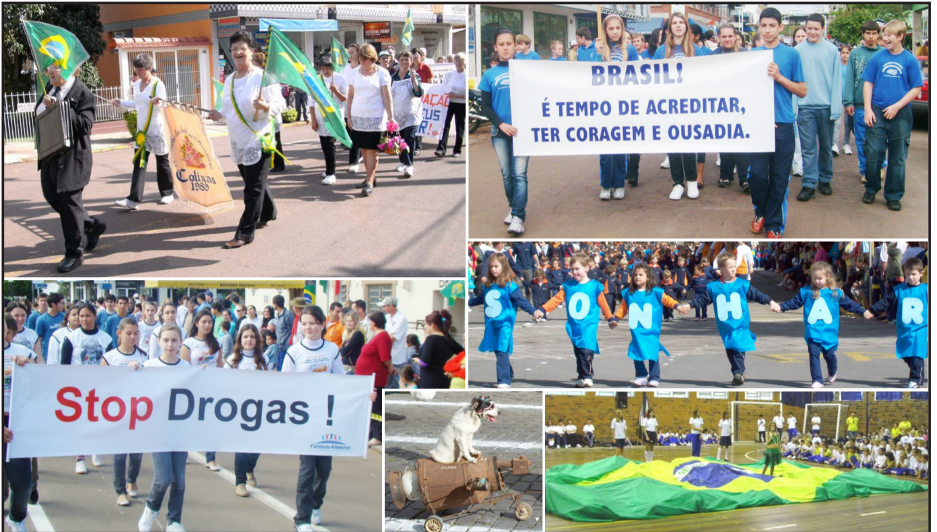
Entidades aproveitaram os desfiles para levar mensagens às ruas

Os desfiles cívicos alusivos à Independência do Brasil em Fazenda Vilanova, Paverama, Teutônia, Garibaldi, Carlos Barbosa e Colinas contaram com a participação de estudantes e entidades das comunidades. Páginas 6, 7, 13 e 15