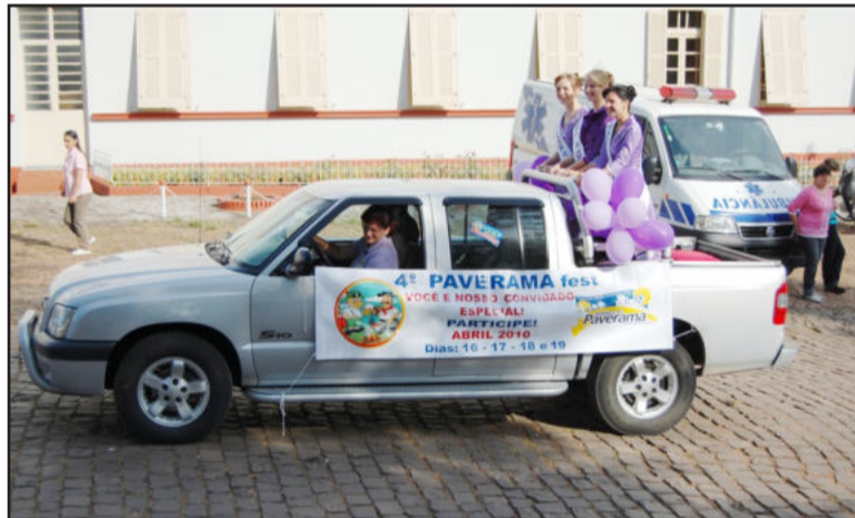
Soberanas da Paveramafest abrem o desfile

Após o desfile, parte do público se dirigiu ao CTG Estân-