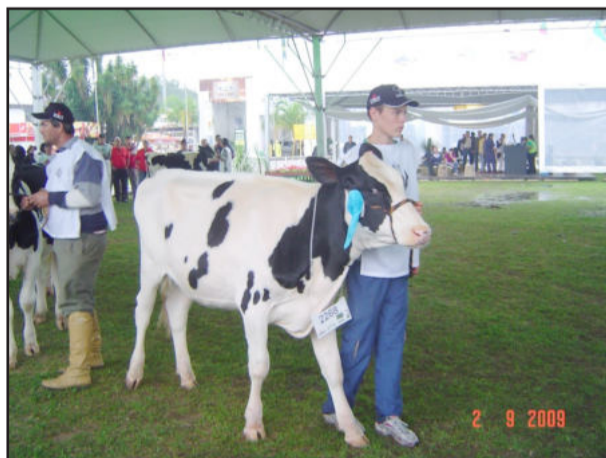
Novilha premiada na Expointer

comercializar animais, a Granja Brockmann participou do leilão, onde vendeu uma terneira de 14 meses.