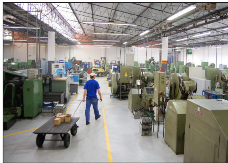
Produção da Metalúrgica Hassmann

com grande satisfação a conquista de uma nova certificação, a tão esperada ISO 14001: 2004 (Sistema de Gestão Ambiental), com o objetivo de eliminar e/ou reduzir os impactos ambientais causados por sua atividade. "A cada dia estamos