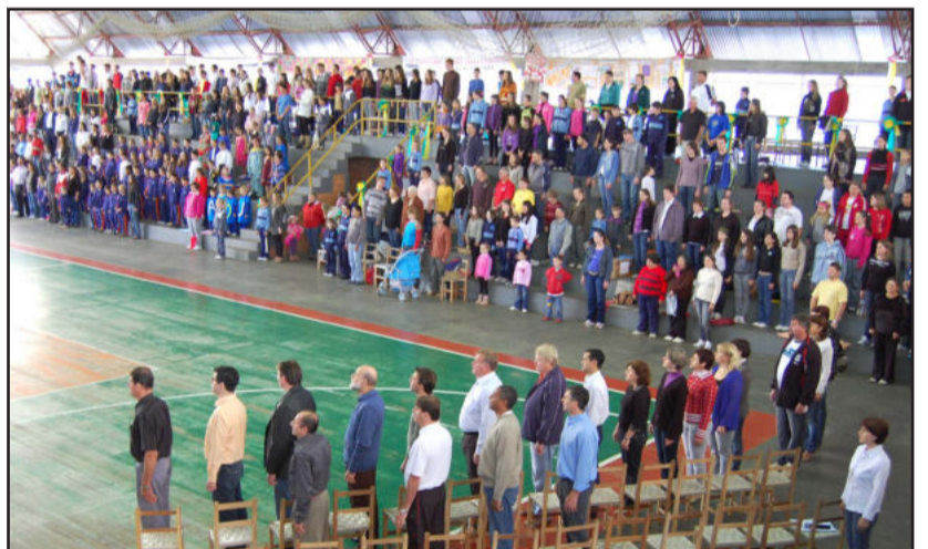
Autoridades e bom público prestigiaram a Sessão Cívica

nicipal de Imigrante encerrou o evento realizado no ginásio esportivo municipal, e que foi prestigiado de forma significativa por autoridades, empresários e representantes de várias entidades, alunos, professores e funcionários, familiares e pais de alunos, e a comunidade em geral.