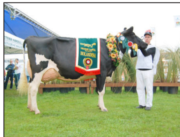
Grande Campeã Expointer

A Granja Tang voltou para Farroupilha consagrada com o prêmio de Grande Campeã da Raça Holandesa e Exceleite Pista, na Expointer 2009. A honraria conquistada pelos produtores associados da Cooperativa Santa Clara é concedida pela Gadolando aos melhores expositores de três competições reconhecidas pela entidade. Lembrada pela qualidade dos animais de seu rebanho leiteiro, a Santa Clara, representada pela Granja Tang, esteve entre os participantes da 32ª edição da Expointer, no período de 29 de agosto a 6