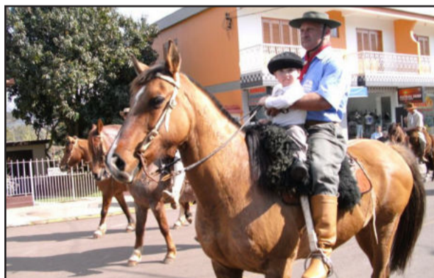
CTG trouxe a cavalaria para o desfile