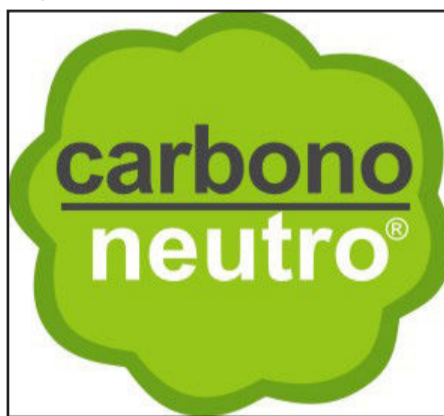
Selo Carbono Neutro

Além do plantio de árvores para a neutralização da emissão de gases de efeito estufa na atmosfera - atividade essencial para a neutralização do gás carbônico gerado nas atividades de rotina da cooperativa - a Sicredi Ouro Branco também desenvolve outras ações ambientais, como o melhor aproveitamento do papel nas impressões (utilizando frente e verso e reduzindo as quantidades utilizadas), economia no consumo de água e energia elétrica, utilização de papel reciclado para os materiais de expediente e de divulgação e envio para reciclagem de toda a sobra ou descarte de papéis. Anualmente, na Semana do Meio Ambiente, comemorada no início do mês de junho, a cooperativa também distribui mudas de árvores nativas aos associados nas suas 14 unidades de atendimento e aos alunos das escolas que integram o programa de educação cooperativa A União Faz a Vida, propagando assim, para milhares de pessoas, a preocupação em preservar o meio ambiente. Além disso, observa a regularidade com as leis ambientais na implantação de projetos financiados a seus associados.