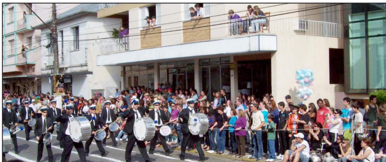
Aeroclube de Garibaldi