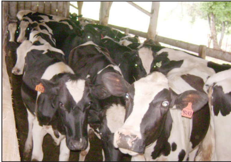
Novilhas são de alto padrão genético

Atenta a novas oportunidades e com o objetivo de ter o controle sobre a genética dos animais, a Cooperativa Languiru entendeu como um salto de qualidade voltar a ter uma equipe de inseminação artificial própria. Desde a sua implantação, em setembro de 2008, o Programa de Inseminação Artificial Languiru já duplicou o número de inseminações, tendo realizado em torno de 12 mil até agora. Atualmente, seis profissionais compõem a equipe de inseminação