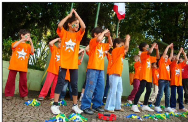
Crianças realizaram apresentação

Os Cemais atendem alunos no turno inverso ao escolar, através de atividades pedagógicas e oficinas de artesanato, hora do conto, informática, educação física, música, horta e canto coral. Os Centros estão inseridos em quatro bairros: Cemai Centro (Centro); Cemais Moinhos (Bairro Moinhos); Cemai Loteamento (Loteamento Popular III) e Cemai Oriental (Bairro Oriental).