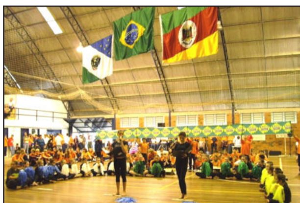
Apresentações no ginásio municipal