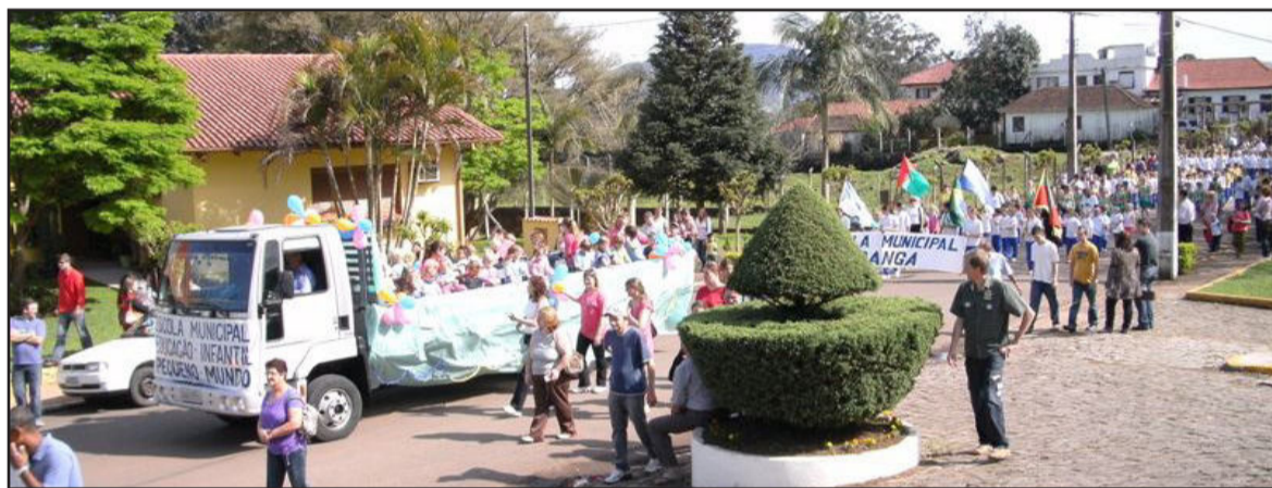
Desfile de rua comunitário é tradicional no Município