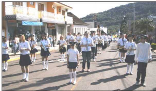
Banda deu ritmo à marcha

cana da Independência, com diversas tarefas de integração, de acordo com a profissão ou entidade representada, com sorteio de prêmios entre os apostadores. As crianças puderam divertir-se com os brinquedos infláveis.