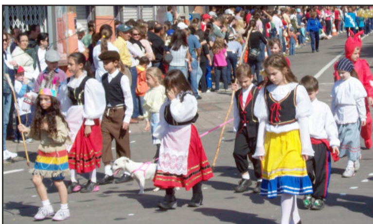
Escola Carlos Barbosa destacou etnias

Instituto Estadual de Educação Professora Irmã Teofânia, de Garibaldi. Os pelotões seguiram pela Rua Rio Branco, a partir da Rua XV Novembro, até o calçadão, onde seguiam pela Rua Buarque de Macedo em direção ao Centro Administrativo Municipal, local de encerramento do desfile, que teve a participação de 45 entidades.