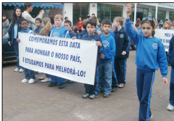
Faixas pediram mudanças