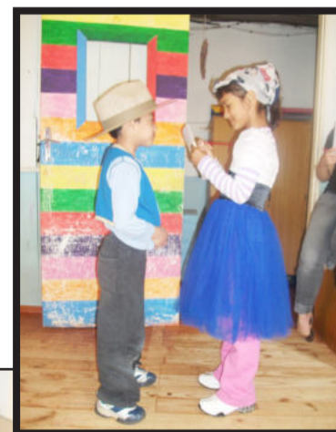
Apresentações dos alunos