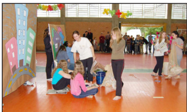
Escola 25 de Maio chamou atenção para o meio ambiente