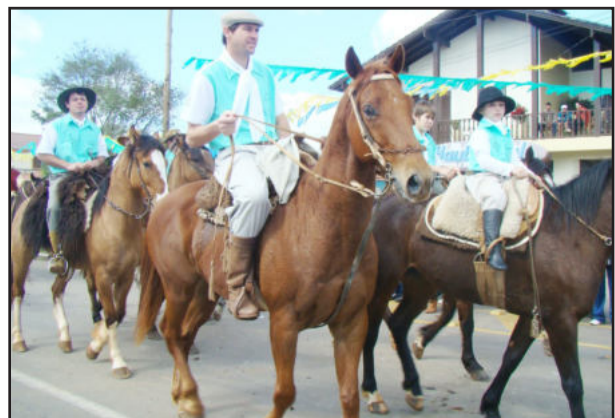
Mais de 150 cavalarianos participaram do desfile