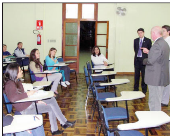
Gestão Empresarial já iniciou na La Salle

Outros cursos de extensão estão iniciando e a Faculdade está oferecendo as últimas vagas para as áreas de Protocolo e Cerimonial e Informática Intermediária. Os cursos são de curta duração e com preços acessíveis. As inscrições podem ser feitas pelo site www.unilasalle.edu.br/estrela ou na secretaria da Faculdade. Informações pelo telefone 3720.2732. Protocolo e Cerimonial iniciou nesta segunda-feira, dia 3, e vai até 8 de outubro. Os encontros ocorrem a partir das 19 horas, com carga horária de 20 horas. Informática Intermediária começa no dia 14, com encontros nas terças-feiras, a partir das 18h45min. O curso tem carga horária de 30 horas, e vai até o dia 21 de dezembro.