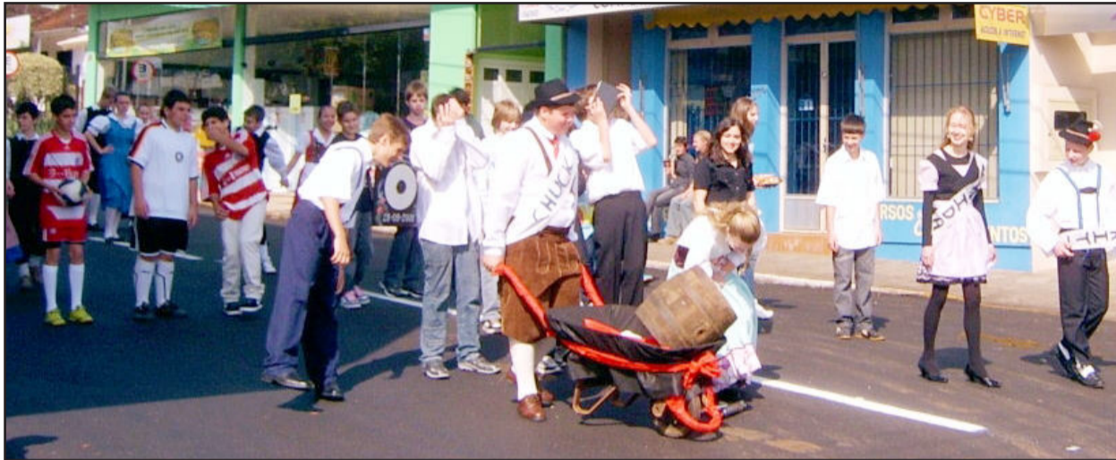
Casais de diversas etnias

“Diferentes Culturas, Diferentes Expressões”. Foi com este tema que a Escola Estadual Gomes Freire Andrade fez o seu desfile em homenagem à Pátria, nesta terça-feira, dia 7 de setembro, na Rua Três de Outubro, no Bairro Languiru. O objetivo da escola foi mostrar os diferentes países que influenciaram na cultura brasileira, como também retratar um pouco da história e os feitos importantes que cada um deles fizeram e continuam a realizar no nosso país.