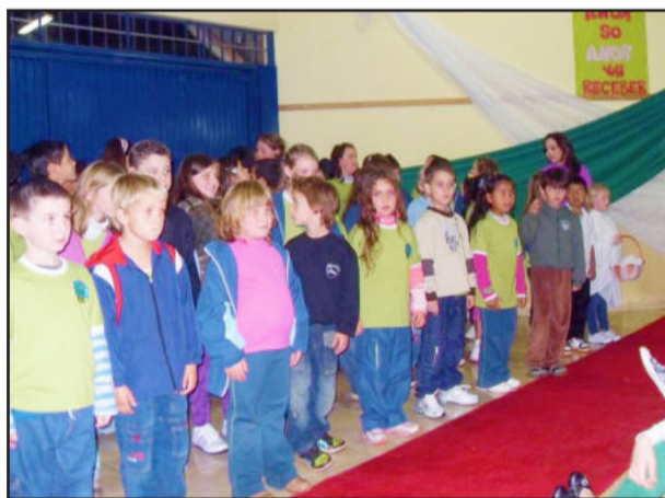
Alunos participaram dos festejos dos 6 anos da Emef Pinheiros

A Escola Pinheiros iniciou suas atividades em 2004 com apenas 15 alunos, distribuídos de 1ª a 4ª séries. Atualmente, atende 170 alunos, da Educação Infantil ao Ensino Fundamental, e conta com uma equipe de profissionais qualificados e comprometidos, responsáveis pelo sucesso que a Escola tem alcançado.