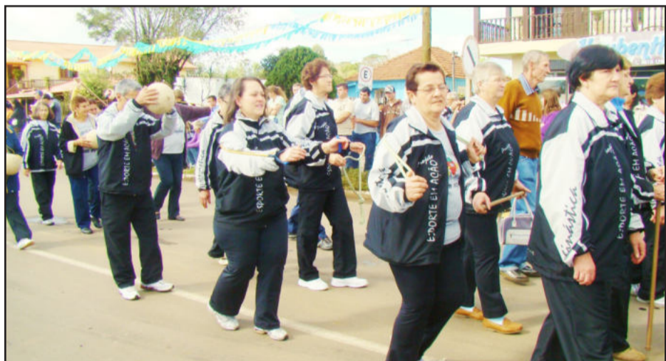
Grupos de ginástica e caminhada orientada do projeto Esporte em Ação