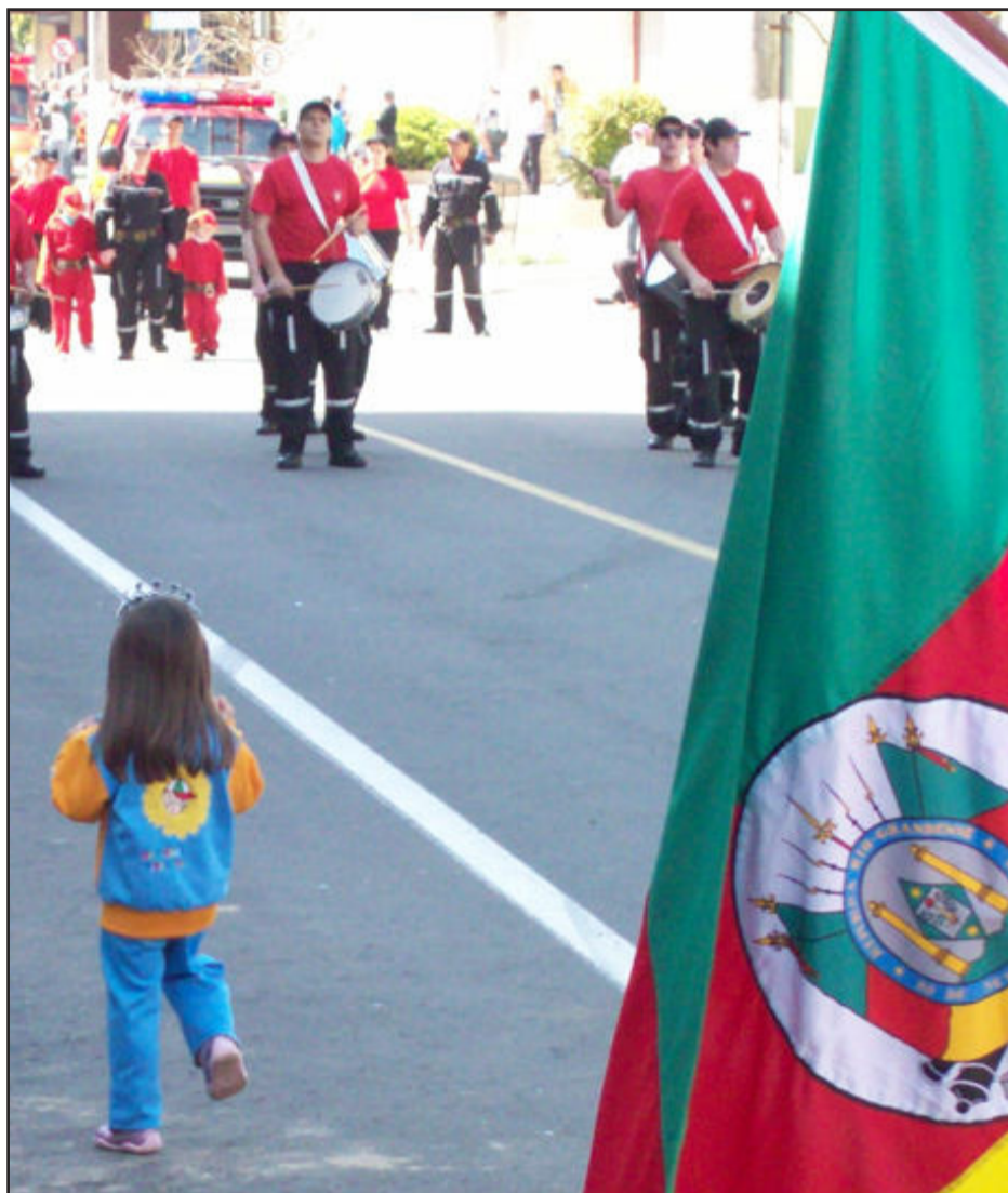
Em Garibaldi, menina acompanha cadência do desfile dos Bombeiros Voluntários