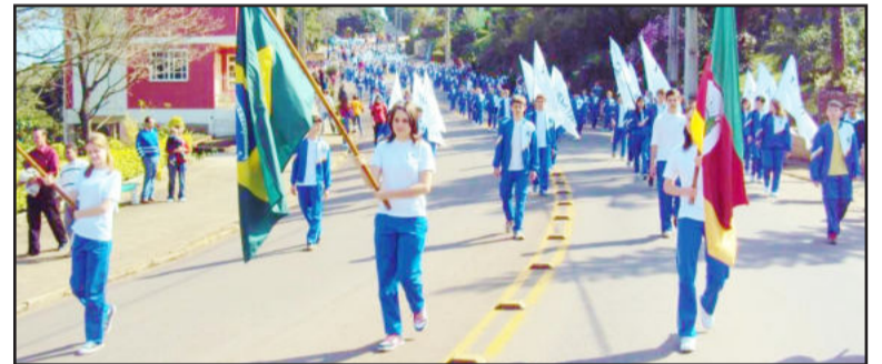
Escola Municipal Ipiranga tomando as ruas de Colinas