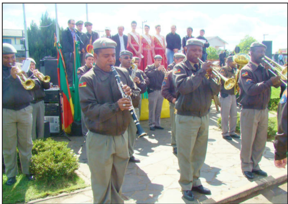
Banda da Brigada Militar de Porto Alegre também se apresentou