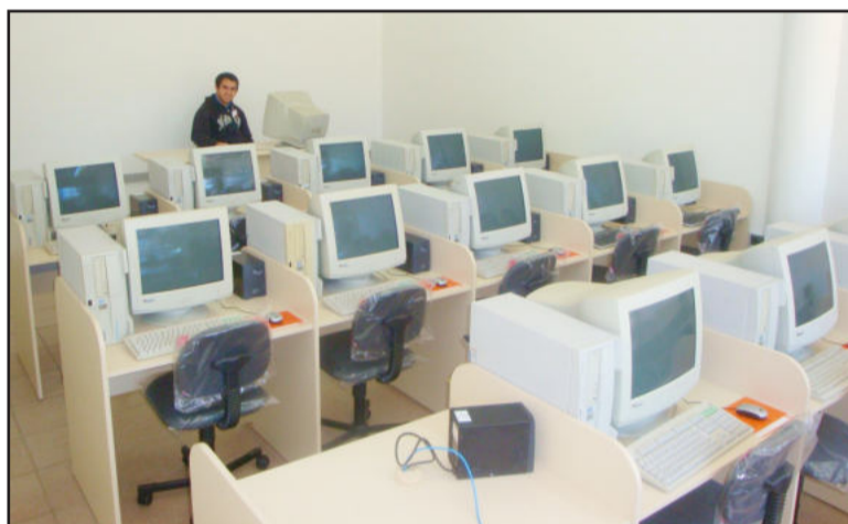
Vinte computadores estarão à disposição da comunidade