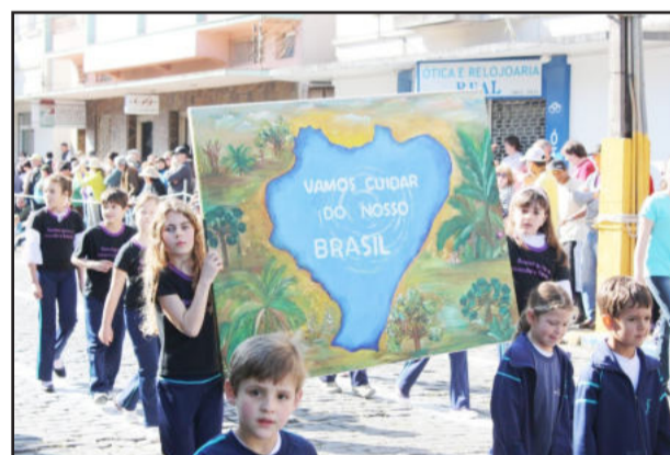
Pedidos pela preservação do planeta