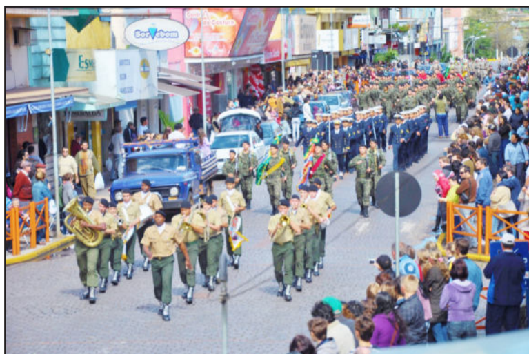
Desfile Cívico lotou a Rua Júlio de Castilhos de Lajeado

Mais atenta ainda ficou a população quando ocorria