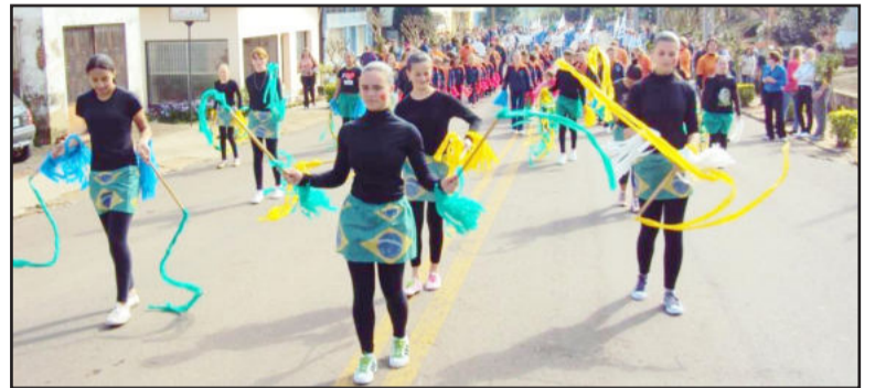
Jovens da Escola Estadual de Colinas desfilando e dançando

Após foi servido almoço e à tarde a integração prosseguiu. Para os admiradores da dança, a Banda Porto Novo, formada por jovens colinenses, animou a festa. Para os jovens, diversas brincadeiras foram realizadas. Já as crianças puderam usufruir de uma atração especial, os brinquedos infláveis.