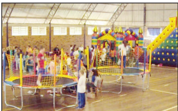
Brinquedos infláveis foram atração para as crianças