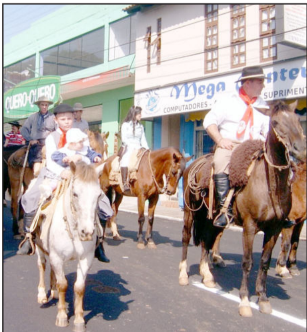
Crianças também participaram dos desfiles dos cavalarianos

Na parte da tarde, prosseguiu a gincana do educandário, que teve início no mês de agosto, com o cumprimento de diversas tarefas. Além da escolha da Garota Integração, que também faz parte da gincana promovida pela escola, na qual 60% da nota da candidata vinha da venda de votos e 40% do desfile feito no dia. O dia de atividades foi finalizado com uma reunião-dançante.