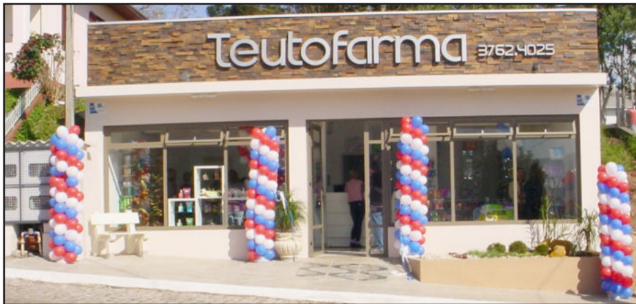
Nova loja da TeutoFarma no Bairro Teutônia

A TeutoFarma trabalha com uma vasta linha de medicamentos tradicionais, similares e genéricos. Além disso dispõe de perfumaria, cosméticos, chás e fraldas. A TeutoFarma conta também de convênios com a Famit, PratiCard,