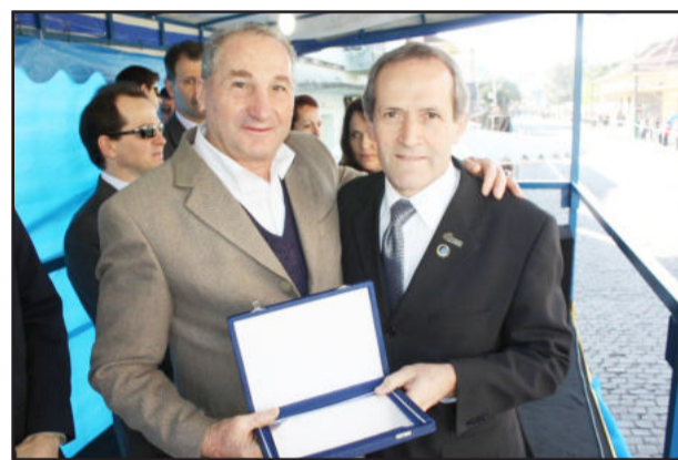
Homenagem ao Sindicato dos Trabalhadores Rurais