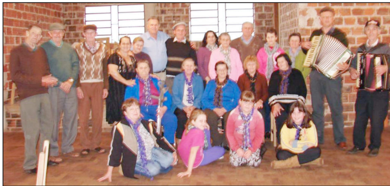
Encontro aconteceu em Linha Harmonia Alta