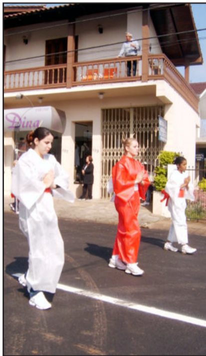
Os japoneses foram lembrados também através das gueixas