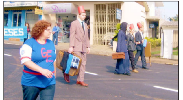
Turcos com seus dons para negócios