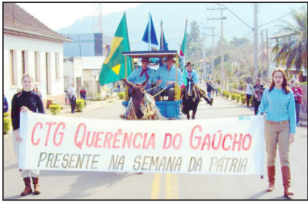
Admiradores da cultura gaúcha durante o desfile