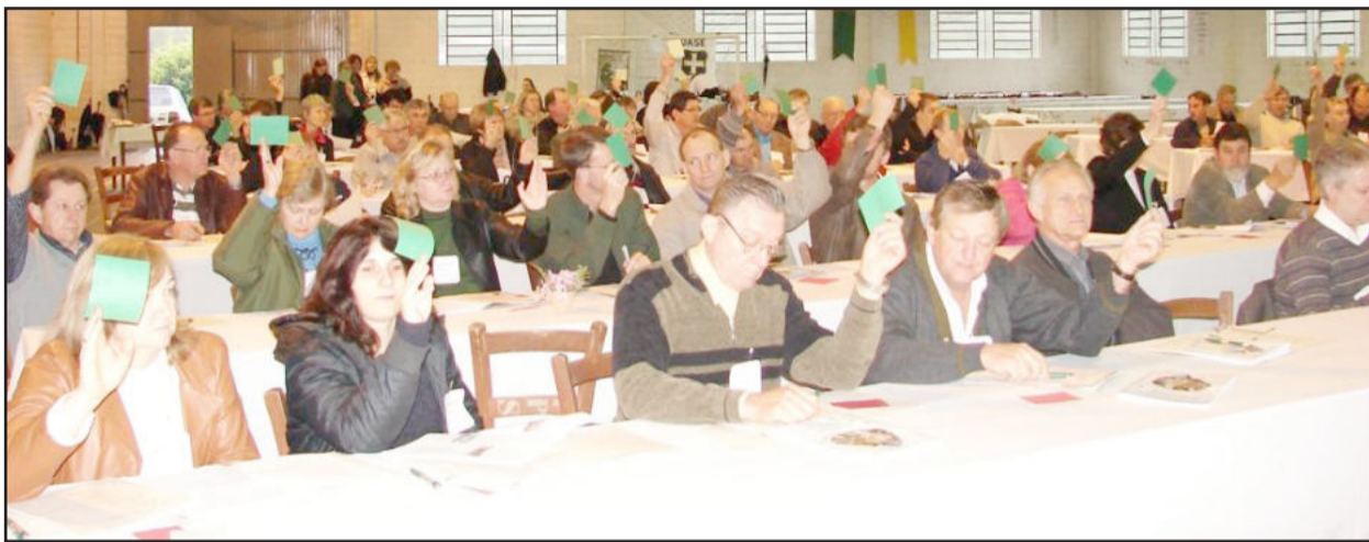
Criação da Comunidade Evangélica de Confissão Luterana em Santa Clara do Sul foi aprovada na Assembleia

D urante este sábado, dia 4 de setembro, ocorreu, junto à Comunidade Evangélica Luz de Pontes Filho, Teutônia, a 16ª Assembleia Sinodal do Sínodo Vale do Taquari, que reuniu os delegados e as delegadas das 58 comunidades, os conselheiros e as conselheiras sinodais, pastores, pastoras, catequistas, diáconas, convidados e direção da IECLB.