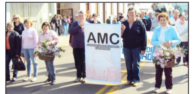
Mulheres de Colinas lembraram das flores no desfile