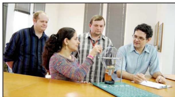
Quinto sorteio foi realizado na sexta-feira

gramas de Incentivo à Arrecadação, estão beneficiando com prêmios, tanto o produtor rural como as pessoas da cidade. É um projeto que merece elogios à Administração e também à população, pela expressiva participação", salientou o vereador.