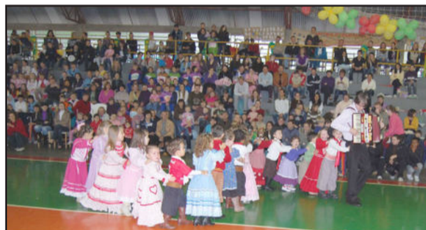
Escola Pequeno Mundo relembrou a música gaúcha