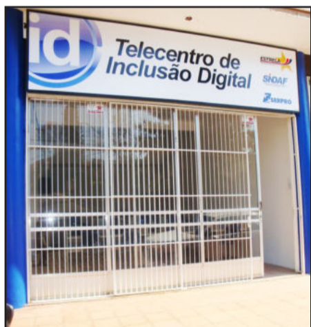
Prédio onde funcionará o Telecentro

O Telecentro do bairro Imigrantes será inaugurado no dia 14 de setembro. A solenidade acontecerá às 10 horas, com a presença de autoridades e a comunidade, na sede do telecentro, no bairro Imigrantes. Mais informações e orientações pelo telefone (51) 3981-1167, com Geisa.