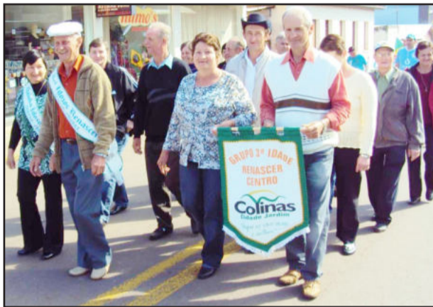
Terceira Idade também desfilou