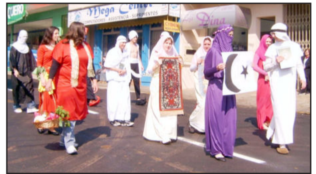
Árabes com seus principais produtos