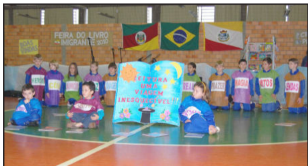
Escola Ernesto Alves fez homenagem à leitura