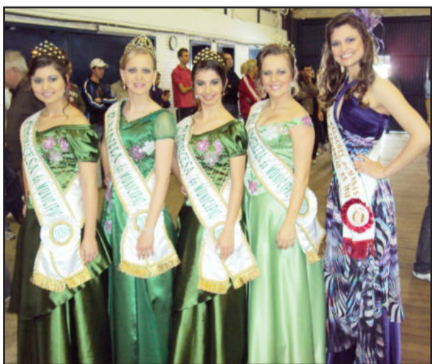
Soberanas de Colinas e Destaque Relações Humanas RS