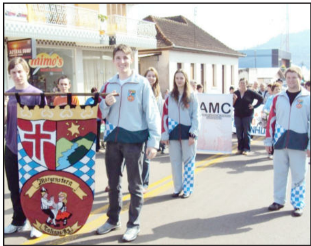
Grupo de Danças participando do desfile