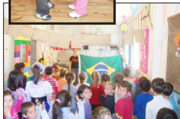
Sete de setembro foi comemorado na escola