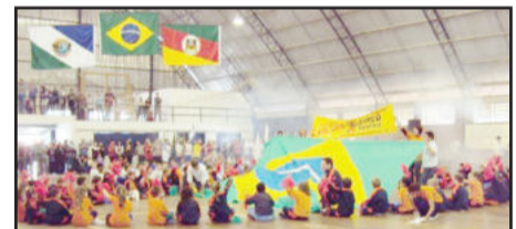
Apresentações foram dentro do ginásio municipal