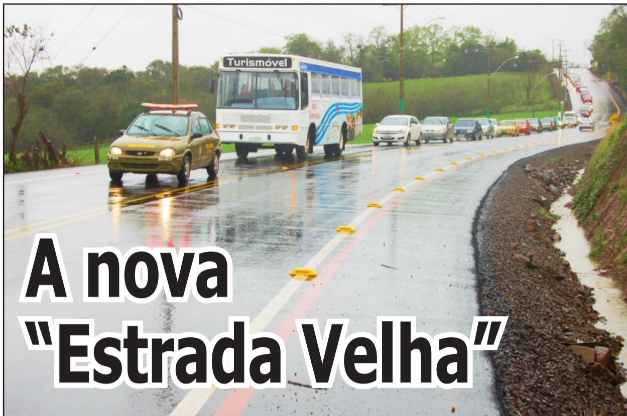
Carreata marcou a inauguração oficial da pavimentação da Estrada Velha