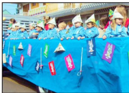
Crianças da Escola de Educação Infantil encantaram