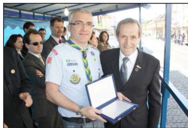
Homenagem ao Grupo Escoteiro