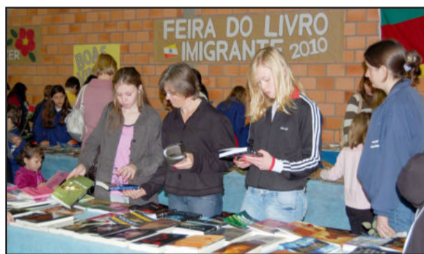
Uma bela Feira do Livro para todas as idades