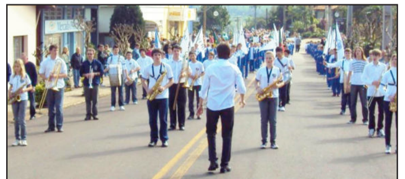
Banda ditou o ritmo do desfile