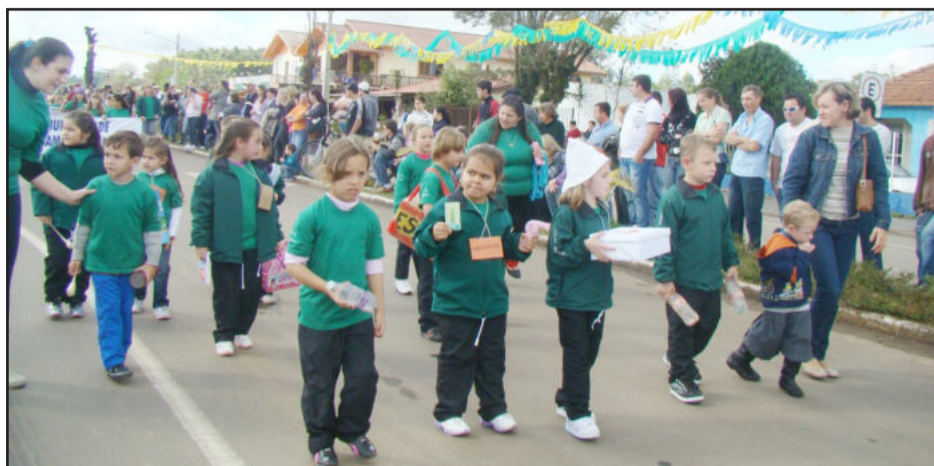
Pequenos da Escola Rui Barbosa mostraram a importância do trabalho

Também participaram do desfile a Banda da Brigada Militar de Porto Alegre, o Pelotão do 40º Batalhão da Polícia Militar, e diversos carros, máquinas e caminhões da Prefeitura de Fazenda Vilanova. Por último, CTGs e piquetes do Município e de fora dele, desfilaram com mais de 150 cavalarianos.