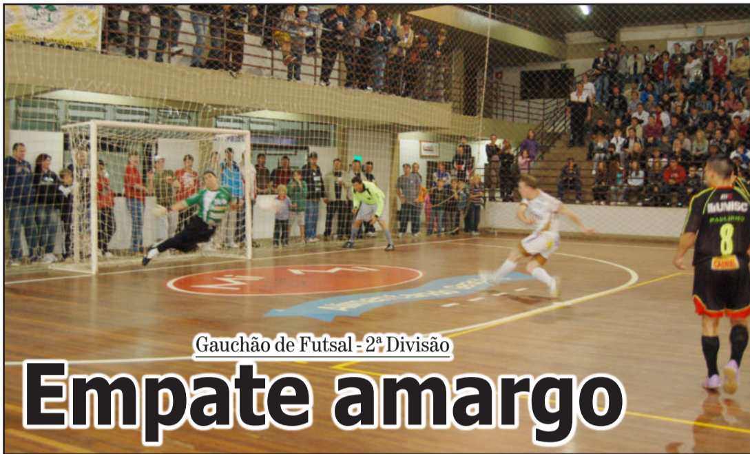
Gauchão de Futsal - 2ª Divisão