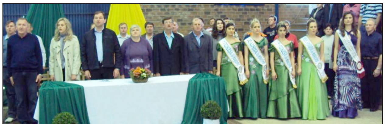
Solenidade cívica oficial no ginásio municipal de Colinas