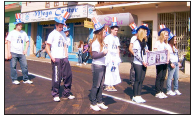
Influência americana também foi mostrada