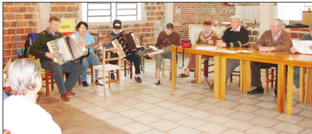
Cantos e mensagens integram atividades dos encontros semanais promovidos pelo Departamento da Melhor