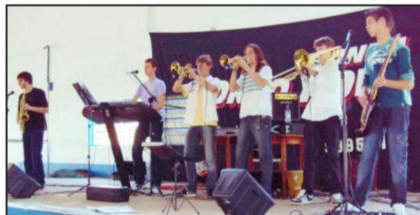
Valorização dos talentos locais: Banda Porto Novo