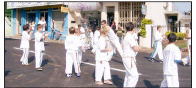
Grupo de capoeira do Cemef