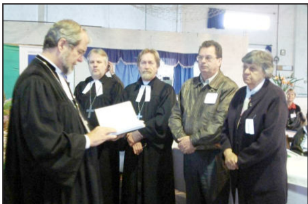
Ato de investidura dos novos eleitos na Assembleia