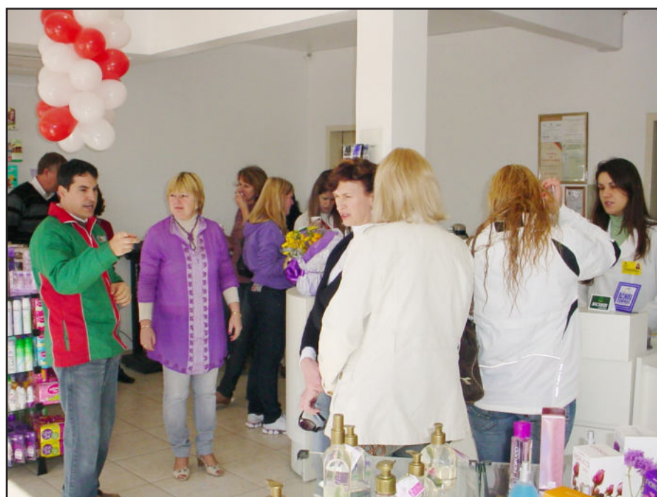
Clientes prestigiando a inauguração