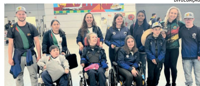
Jogos finalizam a etapa classificatória e definem os cruzamentos da próxima fase