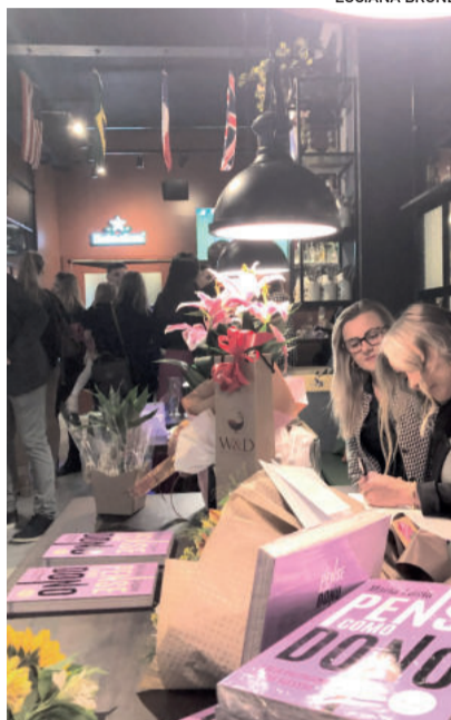
Livro foi lançado em evento no Folk Gastropub

Familiares, amigos e lideranças da comunidade marcaram presença na noite, que transcorreu com um momento de fala da escritora, sessão de autógrafos, coquetel e venda dos livros. A autora anunciou que todo valor arrecadado com a venda no lançamento e nos primeiros 30 dias de venda será revertido para o Vale do Taquari. "Pensei em cancelar o lançamento, mas desistir não é uma opção e foi assim que decidi fazer esta ação social. Penso que a gente precisa contribuir para um mundo melhor e esta será minha forma de ajudar,