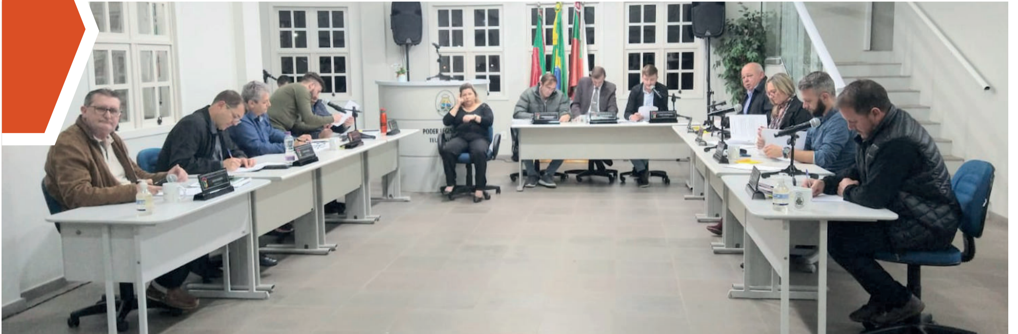
Sessão ocorreu na terça-feira (12/9)