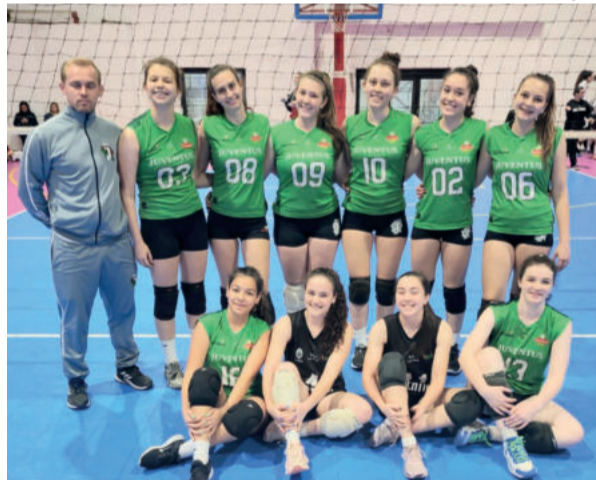
Infante enfrenta as equipes Ginástica de Novo Hamburgo e Recreio da Juventude de Caxias do Sul