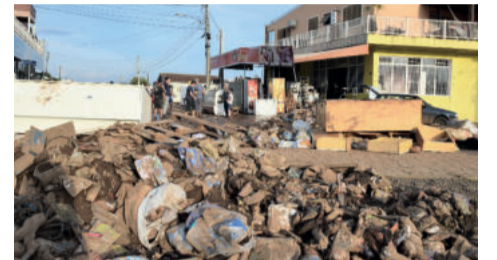
Em Estrela, os entulhos recolhidos estão sendo levados para uma área provisória no Porto

pois o foco foi dado à região central da cidade. A destinação é um terreno no interior da cidade preparado especialmente pra esses fins, longe de nascentes e fora do alcance do rio em possíveis novas cheias.