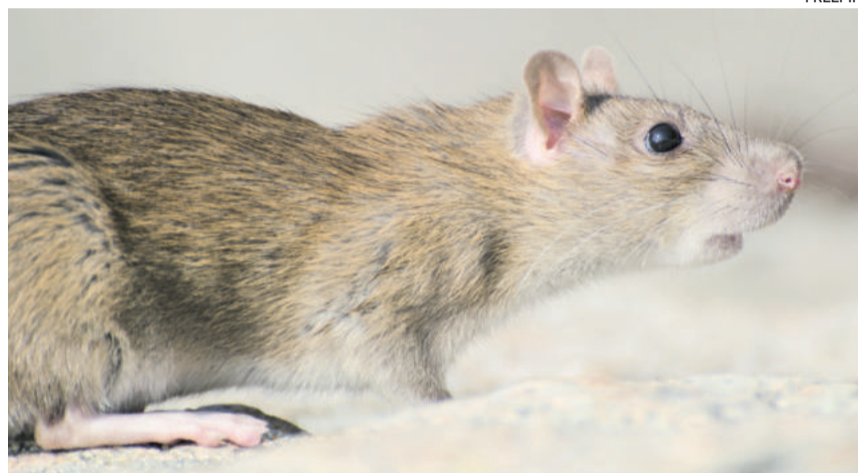
A doença infecciosa febril aguda é transmitida a partir da exposição direta ou indireta à urina de animais – principalmente ratos