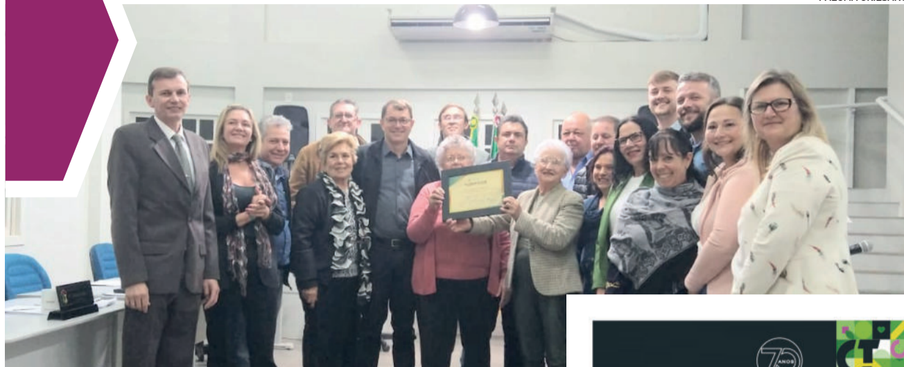
Homenagem foi entregue nesta terça-feira (12/9)