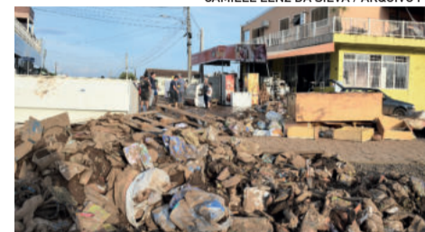
Em Estrela, os entulhos recolhidos estão sendo levados para uma área provisória no Porto

pois o foco foi dado à região central da cidade. A destinação é um terreno no interior da cidade preparado especialmente pra esses fins, longe de nascentes e fora do alcance do rio em possíveis novas cheias.