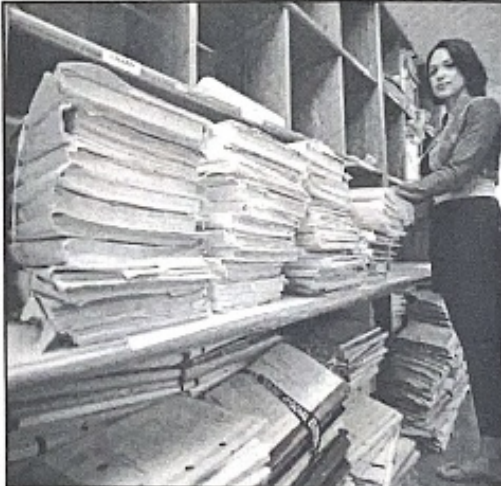
Volume de processos no TSE é enorme