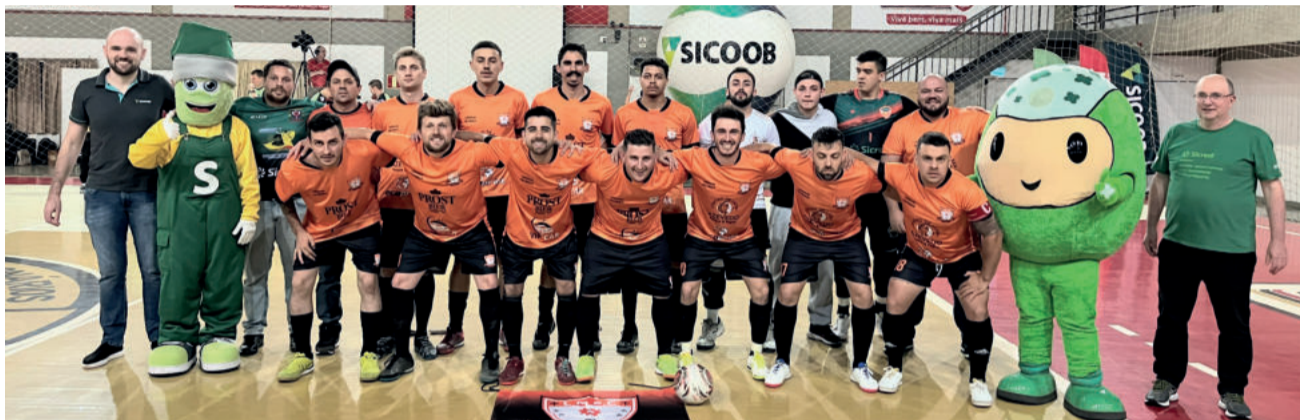
Laranja Mecânica sentiu o prazer de ser o primeiro finalista