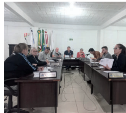
Sessão da Câmara ocorreu nesta quarta-feira (25/10)