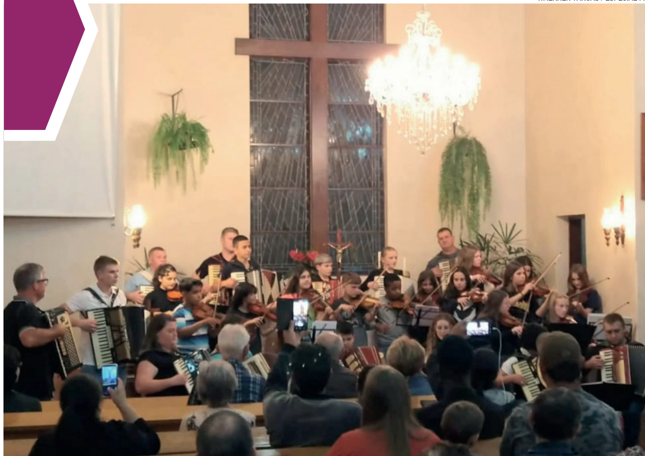
Oficinas de violino, violoncelo e acordeon encerraram o primeiro ciclo de recitais