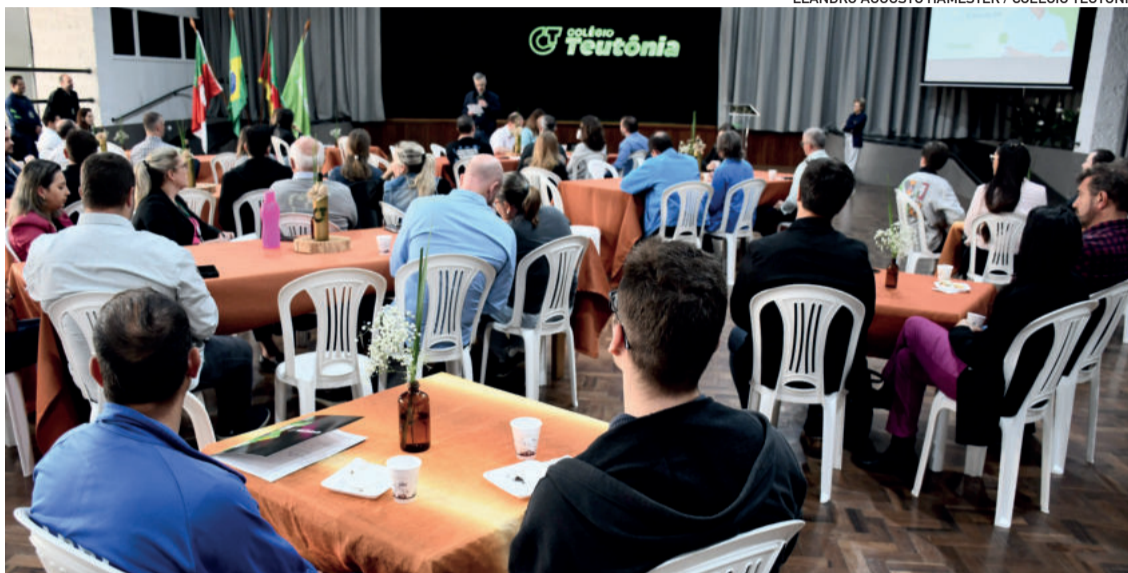
Participaram cerca de 60 representantes dos setores público e privado do Vale