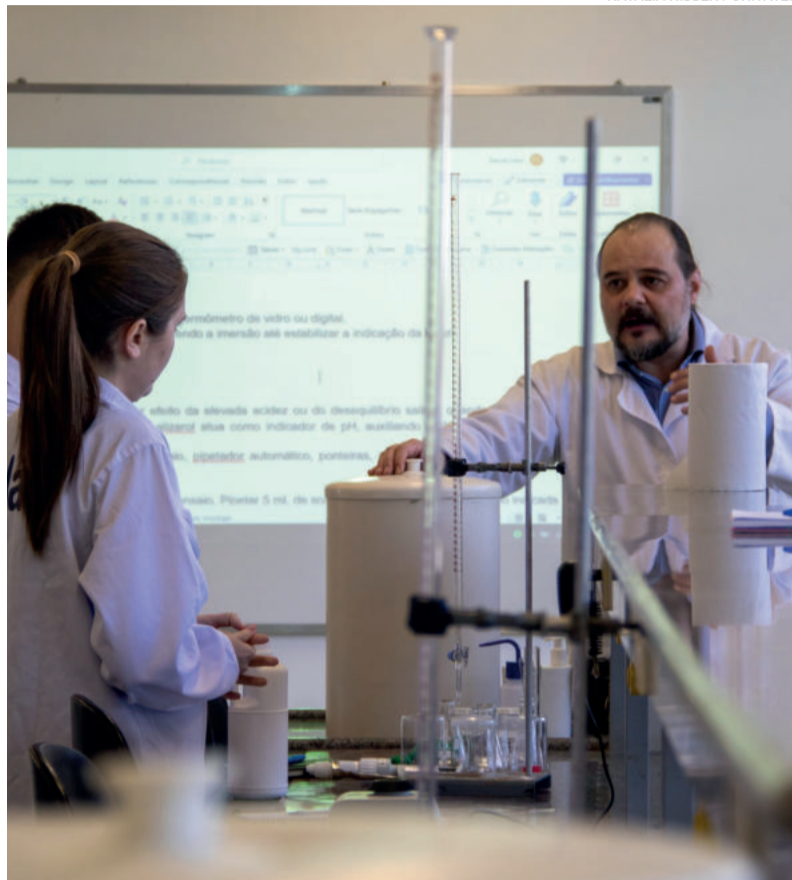
NATÁLIA NISSEN / UNIVATES

O Sindilat/RS e a Univates lançaram a 2ª edição do Programa de Formação em Qualidade do Leite: Formação de Laboratoristas, visando melhorar a qualidade do leite tanto no setor da indústria quanto nas fazendas. Podem participar da formação profissionais da área agropecuária, estudantes em campos relacionados e laboratoristas que desejem aprimorar seus conhecimentos. O curso será realizado de 27 a 30 de novembro, com aulas virtuais e presenciais para prática. Inscrições podem ser realizadas até 5 de novembro ao valor de R$ 650 para associados Sindilat/RS e R$ 900 para os demais interessados.