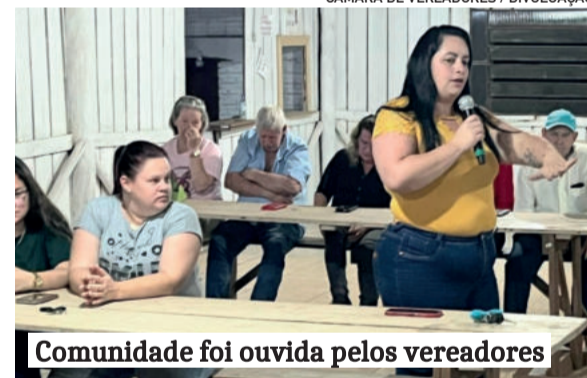
Comunidade foi ouvida pelos vereadores