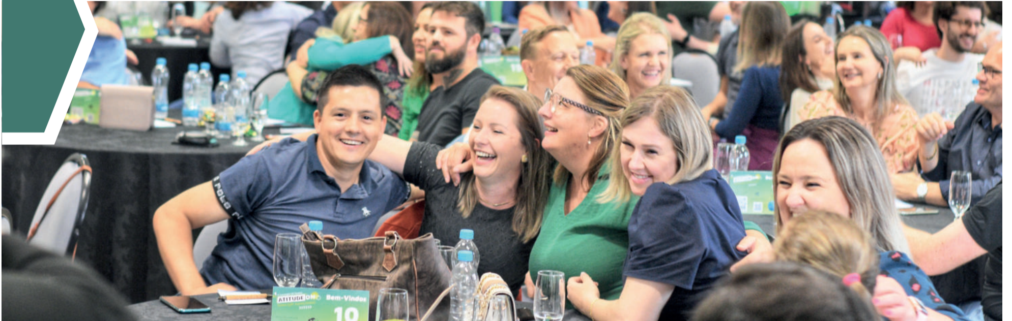
Público presente se divertiu com os palestrantes