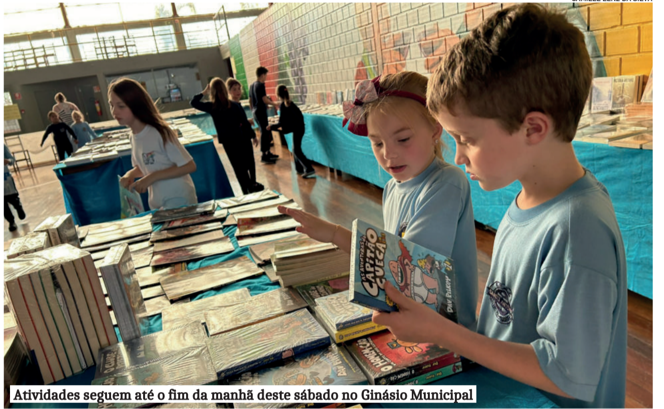
Atividades seguem até o fim da manhã deste sábado no Ginásio Municipal