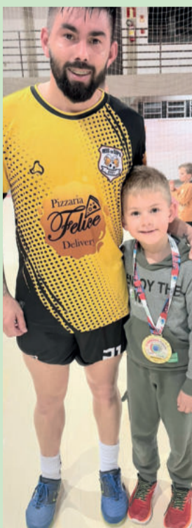
Japa, do Reis da Copa