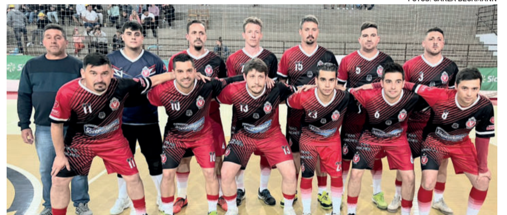
AJP/Divirada/Fazenda Vilanova buscou o empate e a vaga nos pênaltis