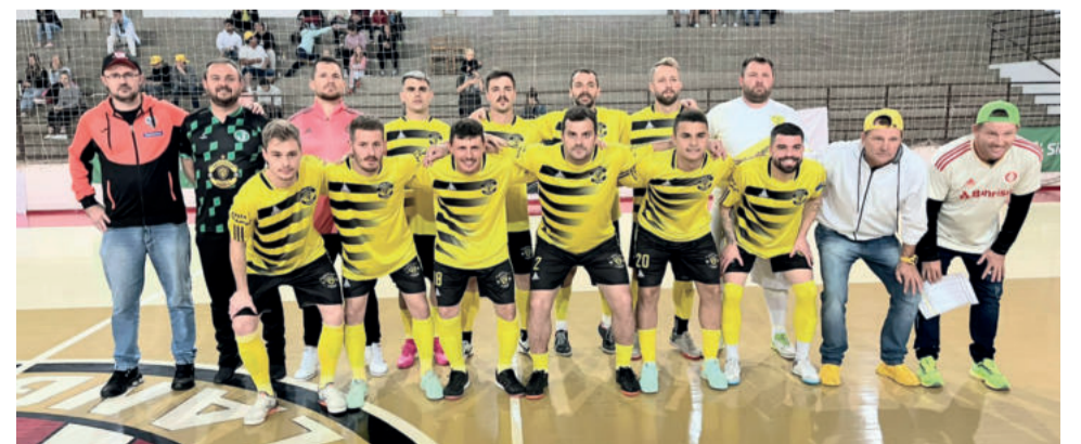
Amigos do Gemeii/Sangue Frio/Garibaldi confirmou a vaga no tempo