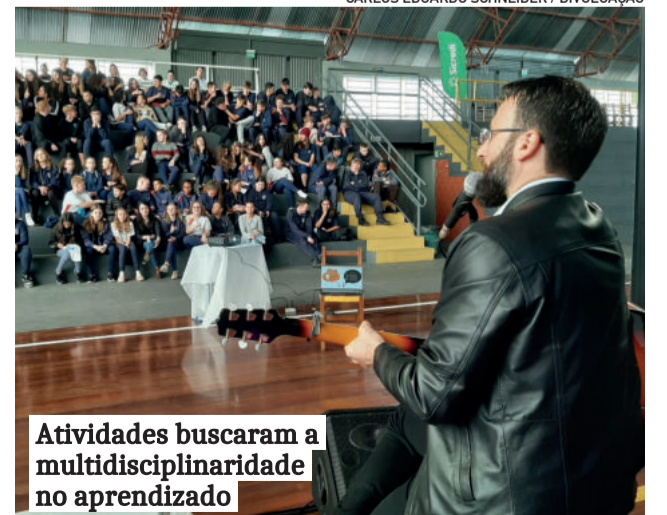
Atividades buscaram a multidisciplinaridade no aprendizado