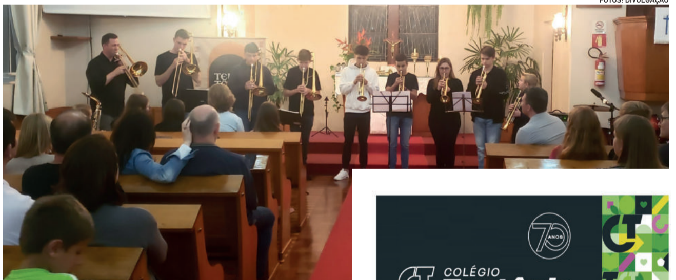
Apresentações foram acompanhadas por familiares e comunidade