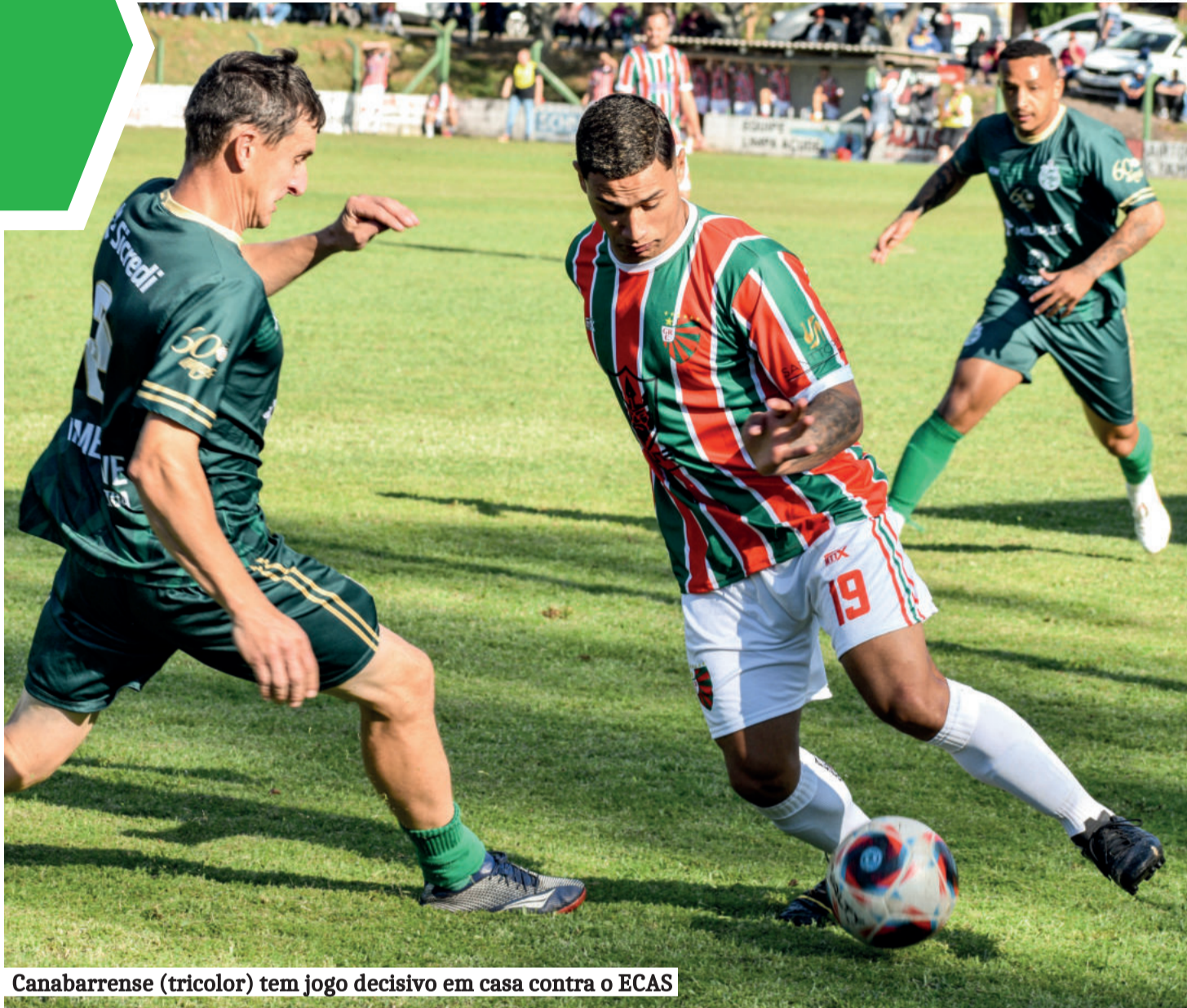
Canabarense (tricolor) tem jogo decisivo em casa contra o ECAS