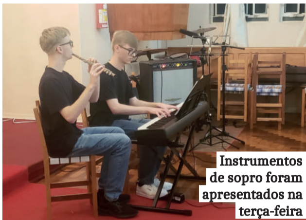
Instrumentos de sopro foram apresentados na terça-feira

Ela considera que, com apenas um ano de vida, mais de 200 alunos atingidos e o impacto na comunidade teutoniense, “o Projeto Teutônia Cultural na minha opinião se configura um dos principais projetos da América Latina”.