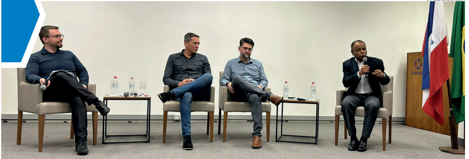
Evento recebeu gestores das empresas Mercur e Excelsior Alimentos