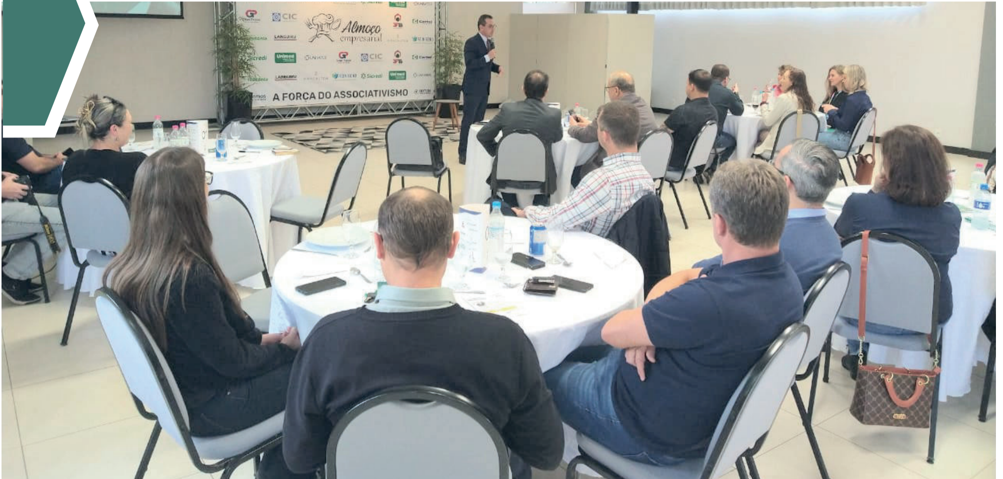
Almoço Empresarial encerrou a programação da Semana do Empreendedor