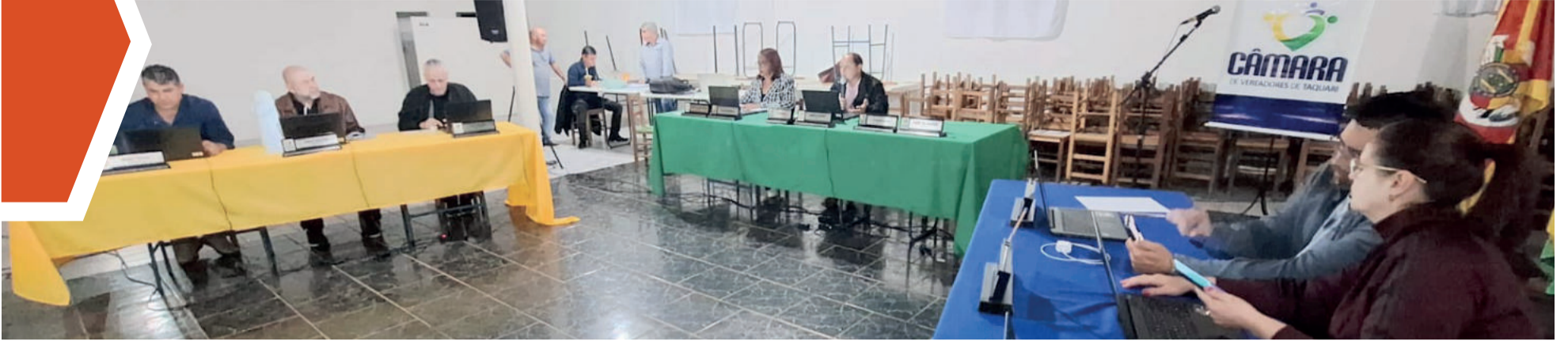
Projeto leva as sessões até as comunidades