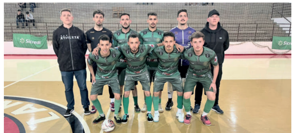
Celtic/Teutônia virou o placar em 7 segundos e está na próxima fase