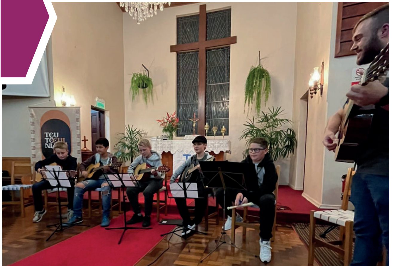
A turma de violão mostrou sua música na segunda-feira