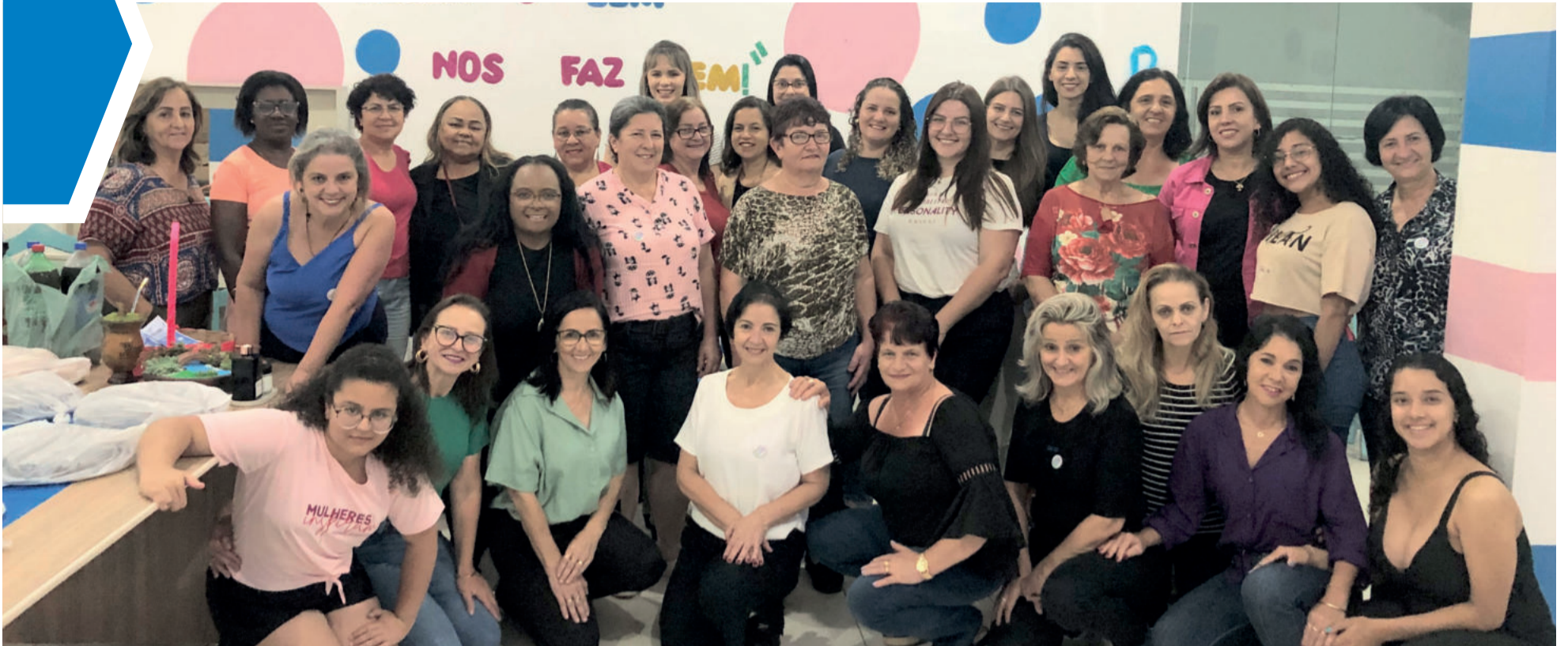
Mais de 30 mulheres participam do grupo

FAZENDA VILANOVA ▶ COMUNICAÇÃO E ENCORAJAMENTO