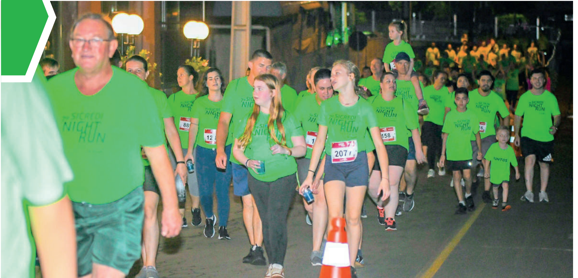
Oitava edição já tem data: 9 de novembro de 2024