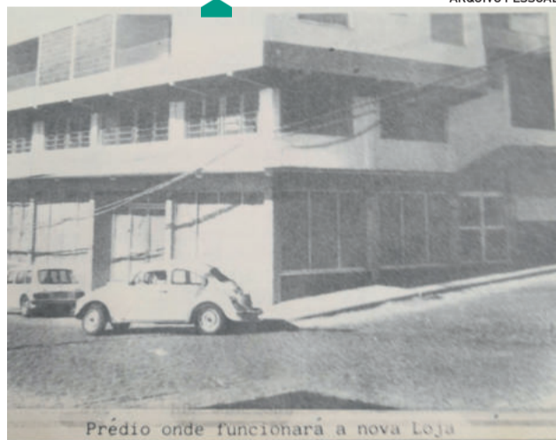
Prédio onde funcionará a nova Loja