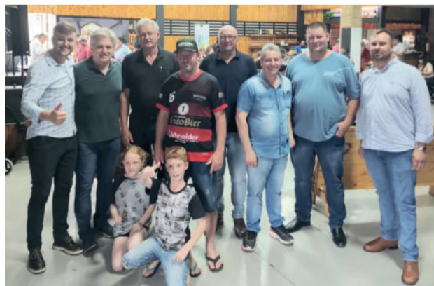
Líderes de outros partidos políticos também prestigiaram o encontro