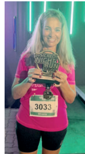
Silvania começou a correr com 58 anos e coleciona medalhas e troféus

que me ajuda muito a buscar um tempo melhor nas competições”, relata.