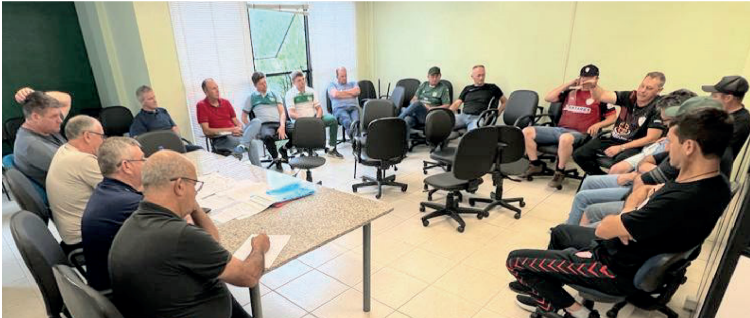
Reunião com semifinalistas foi realizada no feriado