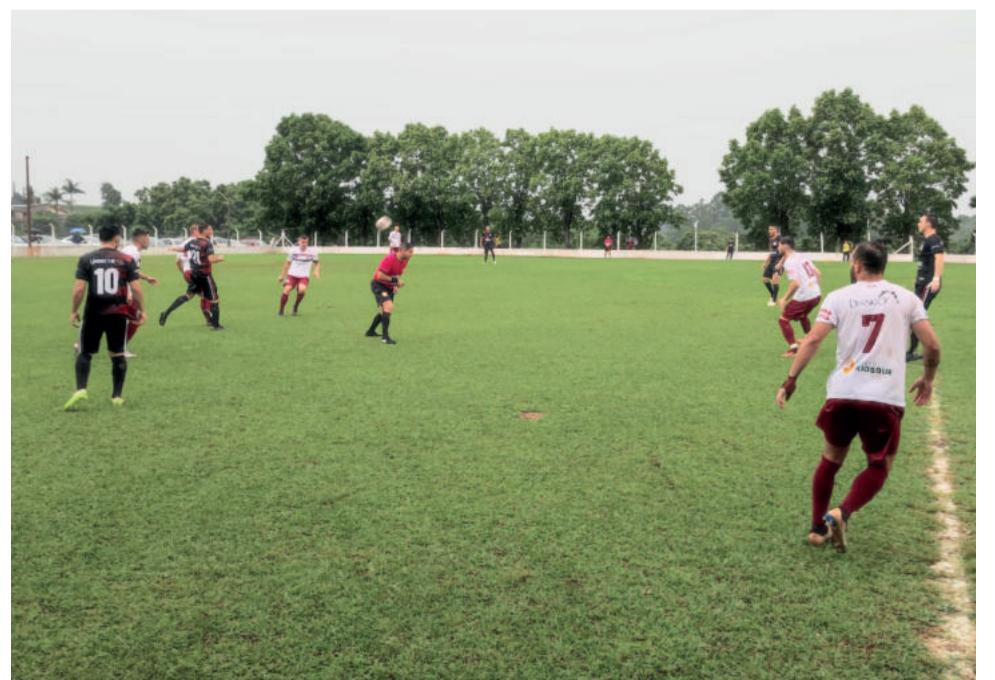
Fluminense (branco) surpreendeu o Estudantes após tomar goleada