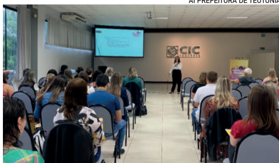
Etapa faz parte da formação obrigatória dos novos agentes

O Comdica, por determinação do Conselho Nacional dos Direitos da Criança e do Adolescente, está à frente da adequação à lei federal nº 13.431/2017, que fala sobre a Escuta Especializada e Depoimento Especial de crianças e adolescentes vítimas ou testemunhas de violência. O objetivo é ouvi-los de forma adequada, visando prevenir a ocorrência de revitimização. A capacitação busca garantir que a lei seja compreendida para que seja implementado o protocolo de escuta especializada no município. Ao fim do curso será formado o Comitê Gestor, composto pelos setores envolvidos na proteção da criança ou adolescente vítima ou testemunha de violência.