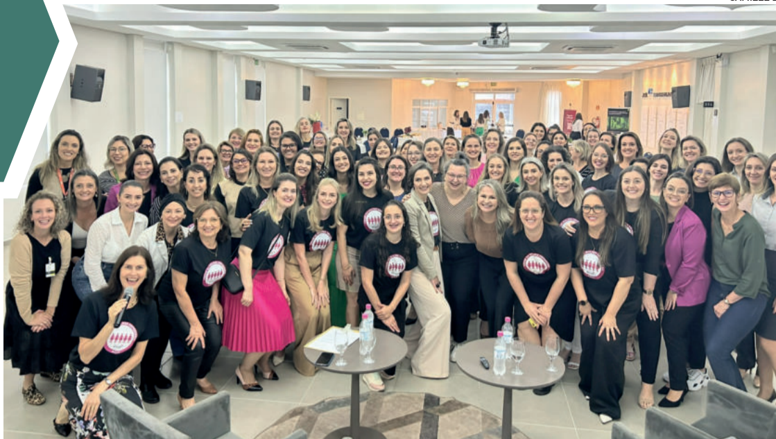
Cerca de 80 pessoas participaram do encontro