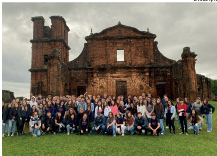
Acompanharam os alunos a diretora e seis professores

Por fim, visitaram as ruínas de São Miguel, conhecendo as histórias dos povos guaranis. A viagem encerrou com o famoso espetáculo Som e Luzes, no qual os alunos conhecem mais sobre figuras como o cacique Sepé Tiaraju, general Gomes Freire de Andrade e o guarani Nicolau Languiru.