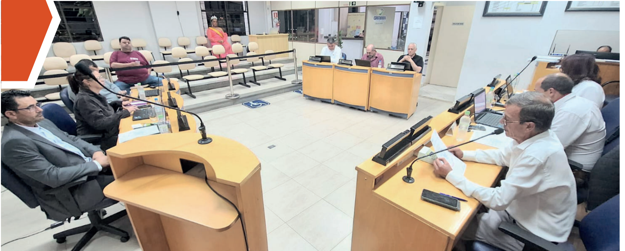
Vereadores se reuniram em sessão na terça-feira (21/11)