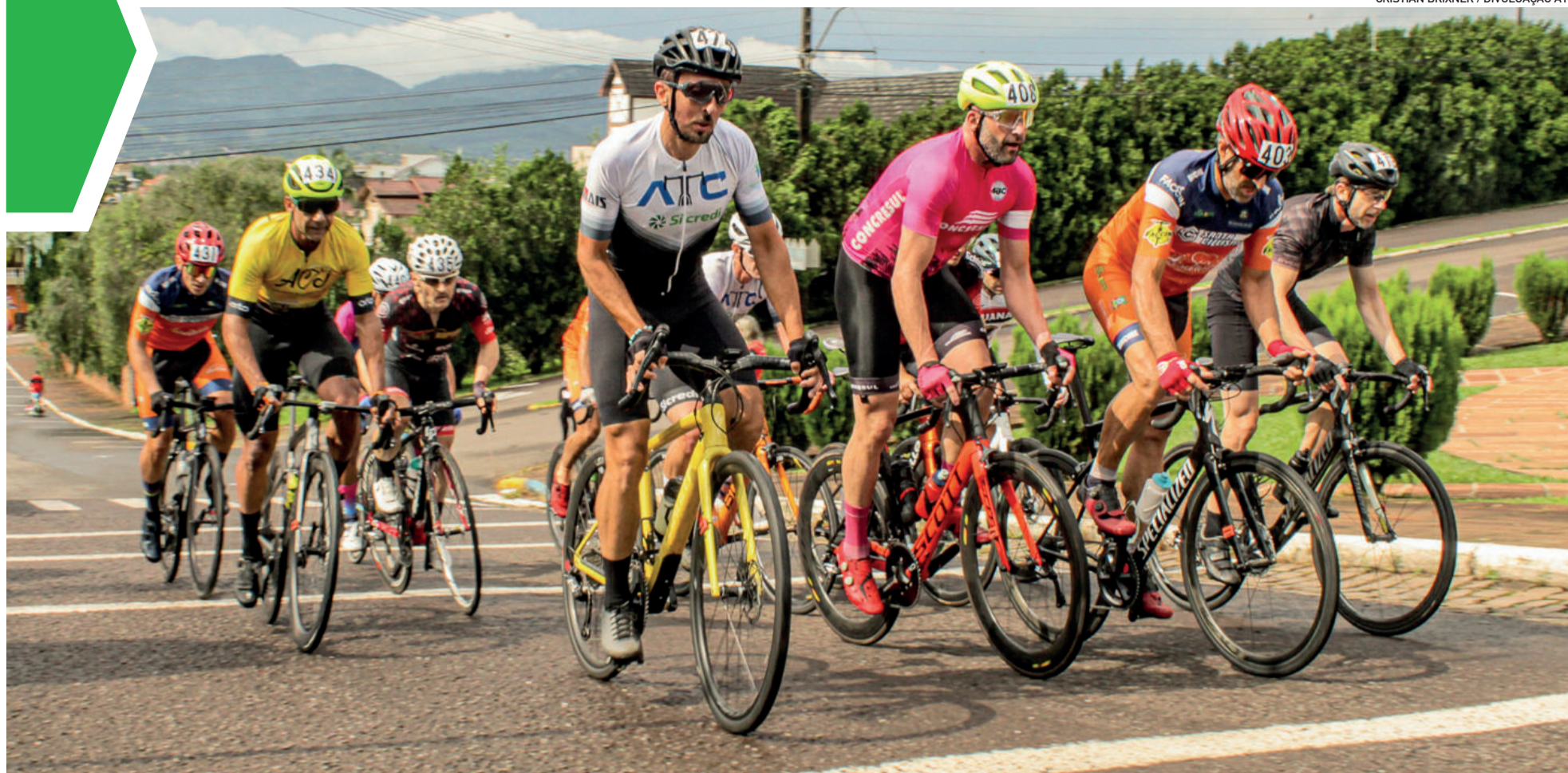
Troféu Teutônia Ciclismo marcou a última etapa do ano do Campeonato Gaúcho da modalidade