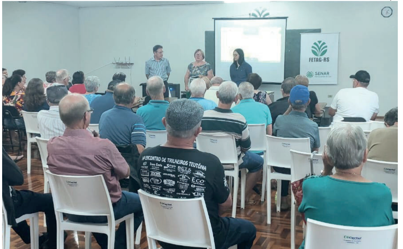
Encontro com a entidade sindical ocorreu na quarta-feira (22/11)