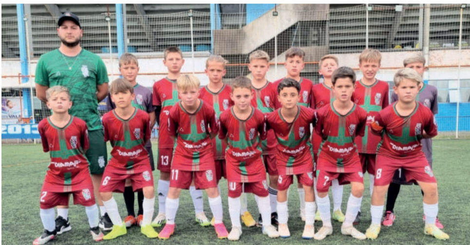
Juventus (Sub-11) se classificou em segundo lugar e enfrenta a categoria Sub-10