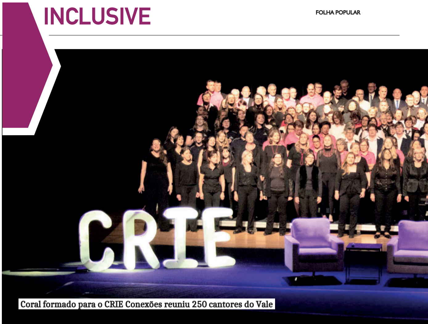
Coral formado para o CRIE Conexões reuniu 250 cantores do Vale

Mas, há mulheres empoderadas, protagonistas de sua vida, que cuidam dos outros, de si mesmas e são profissionais reconhecidas? Existem. As que eu conheço e admiro, são mulheres autênticas! E não são poucas! Não se dobram a humilhações, mas também não precisam de vitrine a todo instante