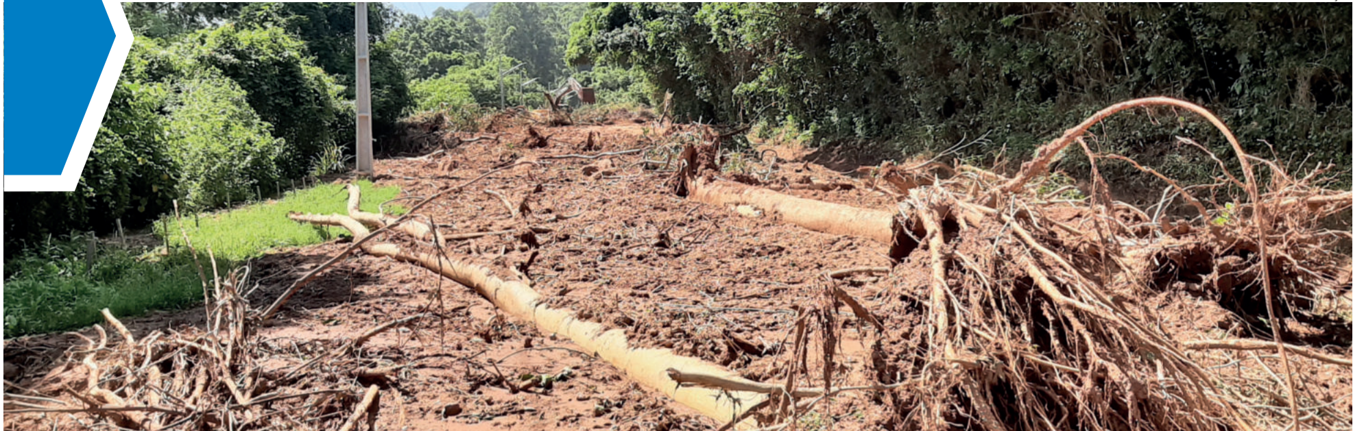
Deslizamento de terra em Linha Berlim é um dos pontos mais críticos