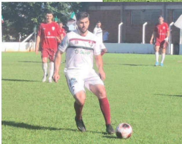
Serrano e Fluminense se reencontram neste domingo, em Encantado