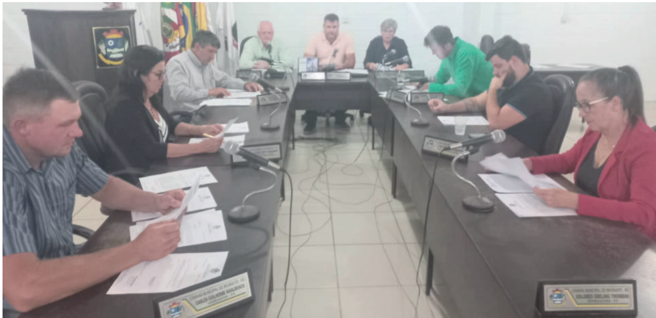
Vereadores se reuniram na quarta-feira (22/11)

Projeto de Lei nº 079/2023, autoriza o poder executivo a desonerar o encargo sobre o imóvel matriculado sob nº 10.208, o qual foi doado para a empresa Simonaggio Imigrante LTDA., em decorrência da Lei Municipal nº 1369/2007, na forma de incentivo econômico. As próximas sessões serão no dia 6 e 20 de dezembro, às 19h30.