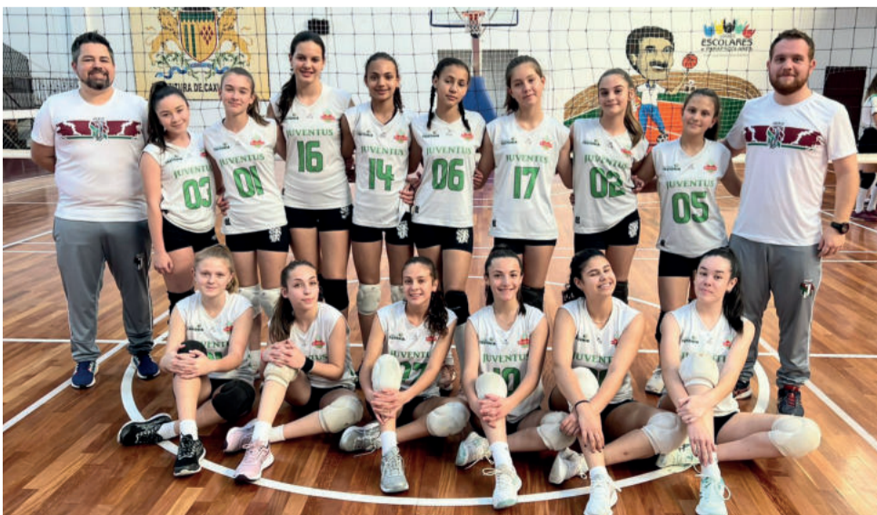
Mirim disputa 3ª rodada do Estadual em Santa Maria