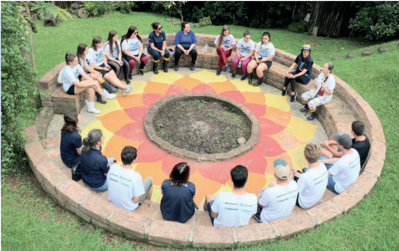
Jovens visitaram espaço Pedra D'Mim, em Marques de Souza