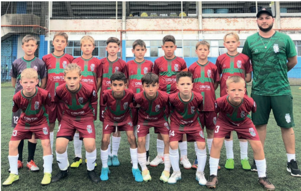
Juventus Teutônia (Sub-10) busca uma vaga na semifinal