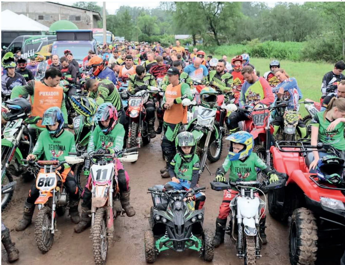
18º Encontro Trilheiros de Teutônia teve a presença de 500 pilotos