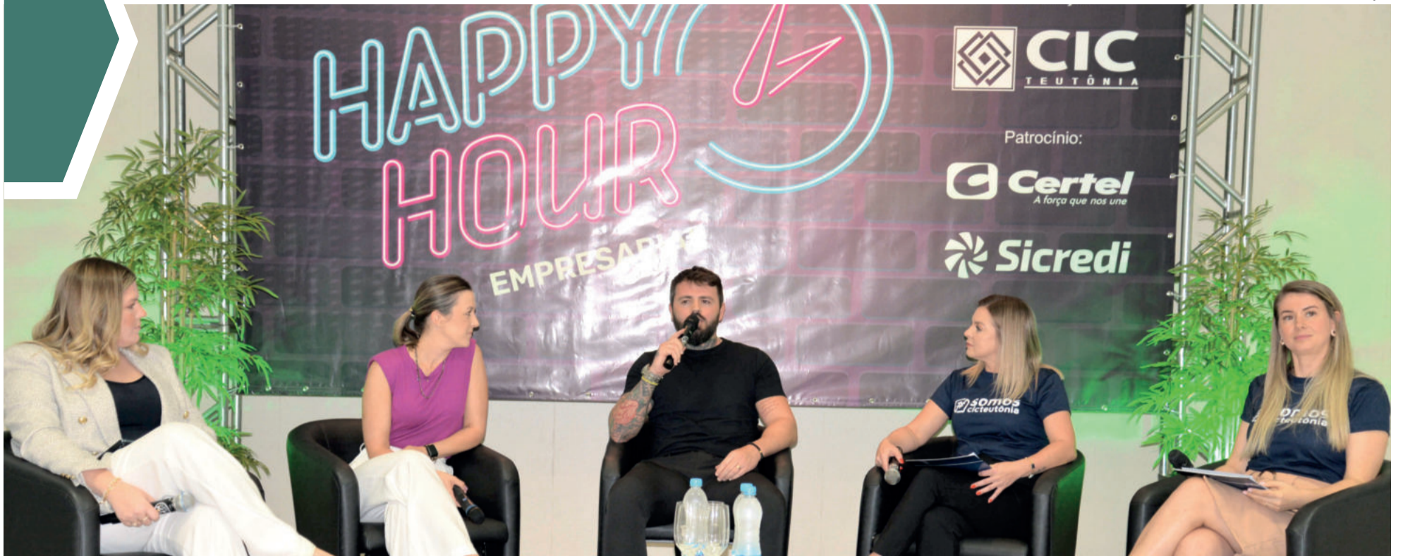
“Qual o DNA da sua empresa e como isso impulsiona os seus negócios” pautou a apresentação dos cases de empreendedorismo local.