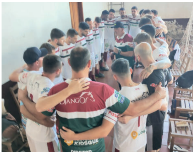
Fluminense se remobiliza para o jogo de volta