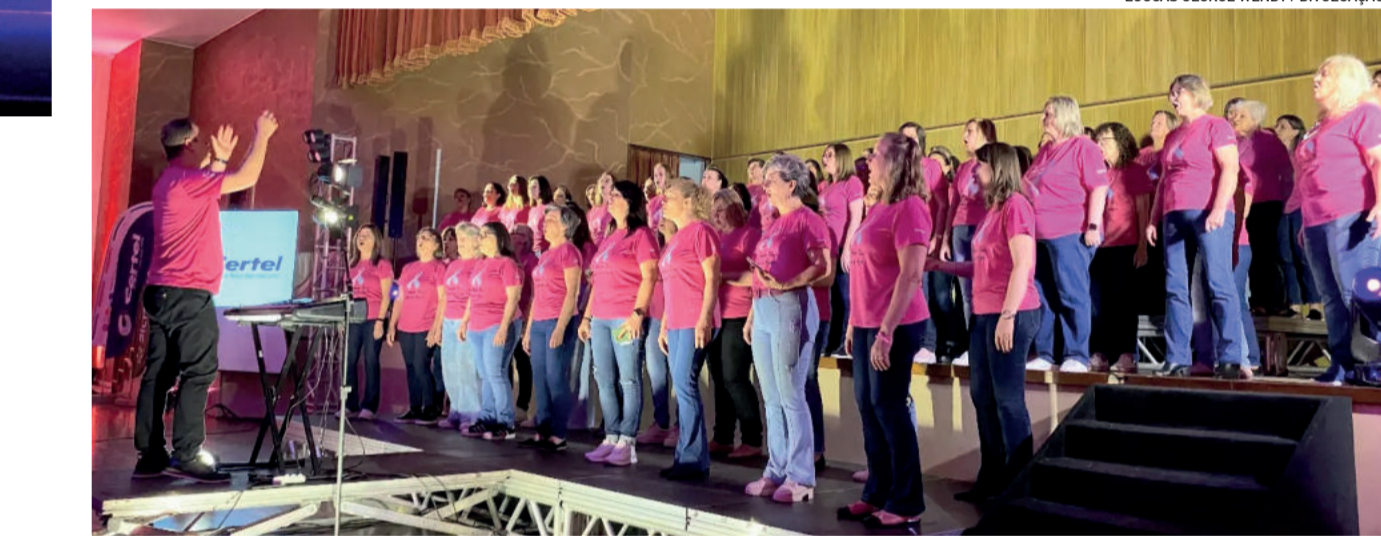
No Cantando o Outubro Rosa, 85 mulheres deram voz às canções