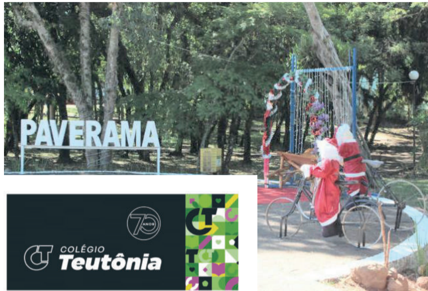
Programação ocorre na Praça 13 de Abril

As atrações artísticas e culturais iniciam às 18h, com o projeto de canto do CRAS. Em seguida, às 18h15 apresenta-se o CTG Estância do Siqueira, e às 18h30 o Coral Familiar de Morro Azul. Às 19h, é a vez do Projeto Musical da Paróquia Nossa Senhor do Rosário. A partir das 20h, sobem ao palco as bandas convidadas, em sequência: Banda Território Neutro, Banda Geração Atual e Banda La Paloma.