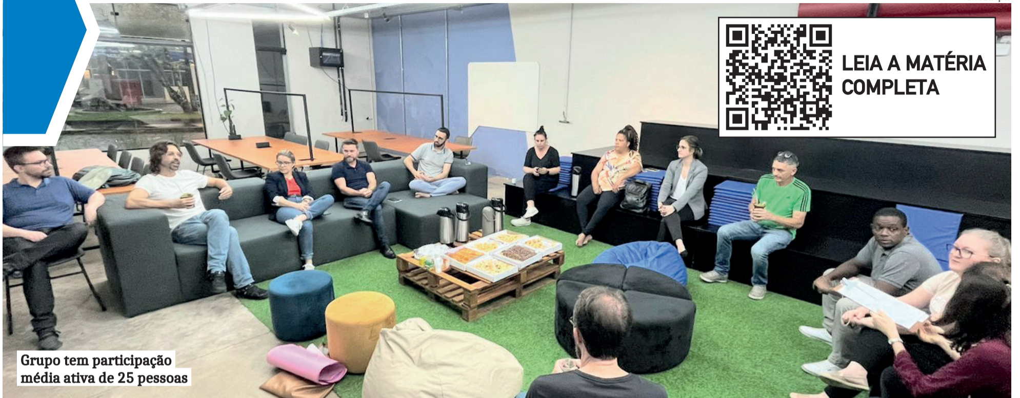
Grupo tem participação média ativa de 25 pessoas