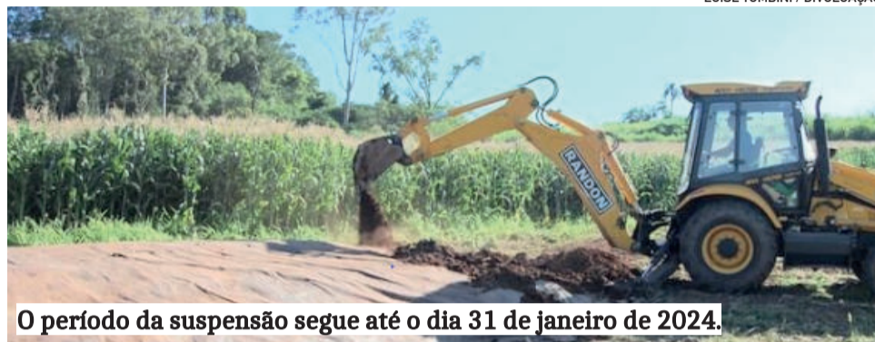
O período da suspensão segue até o dia 31 de janeiro de 2024.

Excluem-se os serviços de fechamento de silagens, previamente agendadas e dentro do cronograma da secretaria, o serviço de enterro de animais e situações emergenciais que possam acarretar prejuízo irreversível ou que coloquem a segurança de terceiros em risco. Mais informações podem ser obtidas junto à pasta ou pelos telefones (51) 3754-1092 e (51) 98188-0283, em horário de expediente.