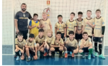
Equipe Teutônia Futsal – 2014