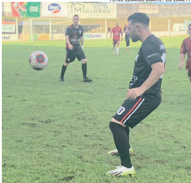
Dimi (10) foi expulso após ser substituído no domingo e estará fora da decisão