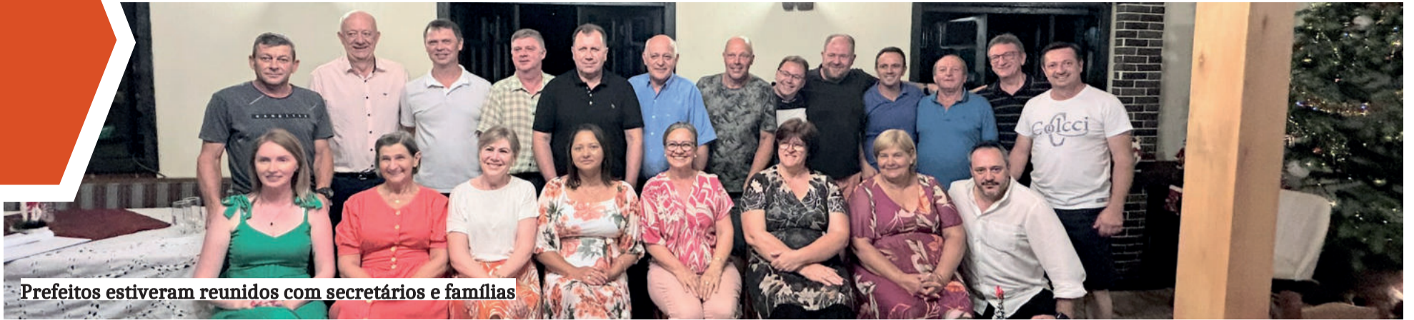
Prefeitos estiveram reunidos com secretários e famílias