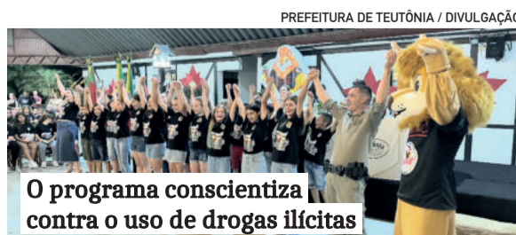
O programa conscientiza contra o uso de drogas ilícitas

A Associação de Abastecimento de Água Westfália comunica que estará em recesso no período de 23 de dezembro a 1º de janeiro de 2024. O atendimento na sede da Associação retornará no dia 2 de janeiro. Para casos de urgência e emergência, os telefones de plantão são: (51) 9 9875-9198, (51) 9 9731-3340 ou (51) 9 9724-8952.