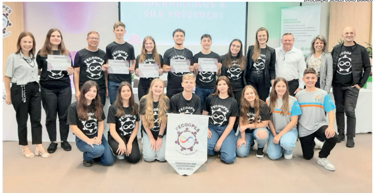
Na foto, o jovem segura a bandeira da federação (c)