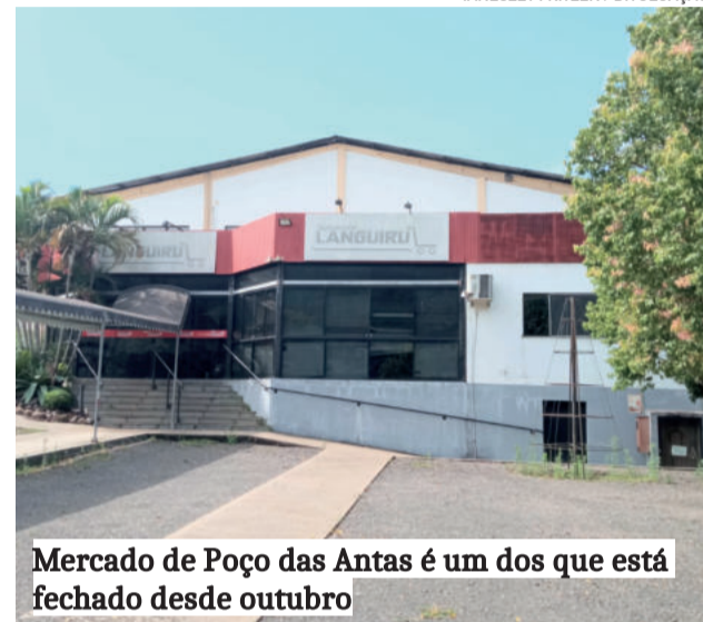
Mercado de Poço das Antas é um dos que está fechado desde outubro