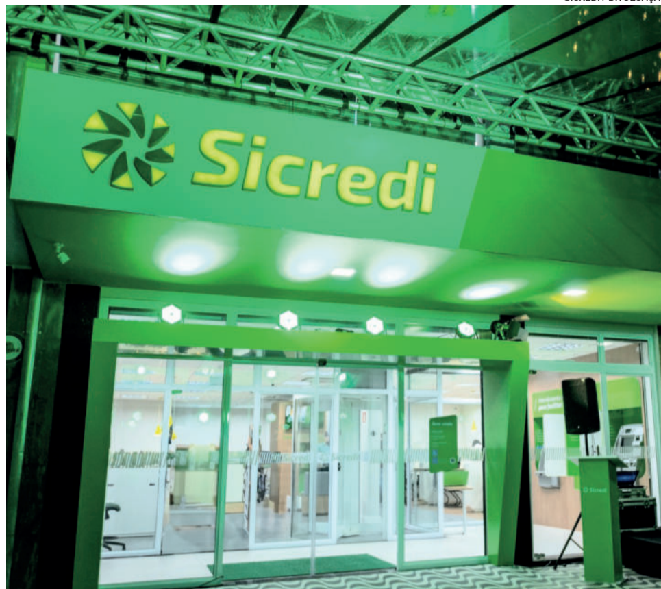
Nova agência fica na cidade de Timóteo

Não é só um cartão com muitas facilidades. É ter com quem contar.