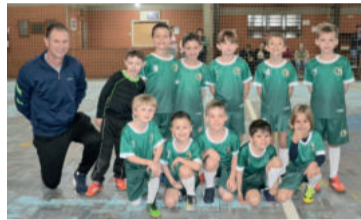
Equipe Colégio Teutônia – 2016