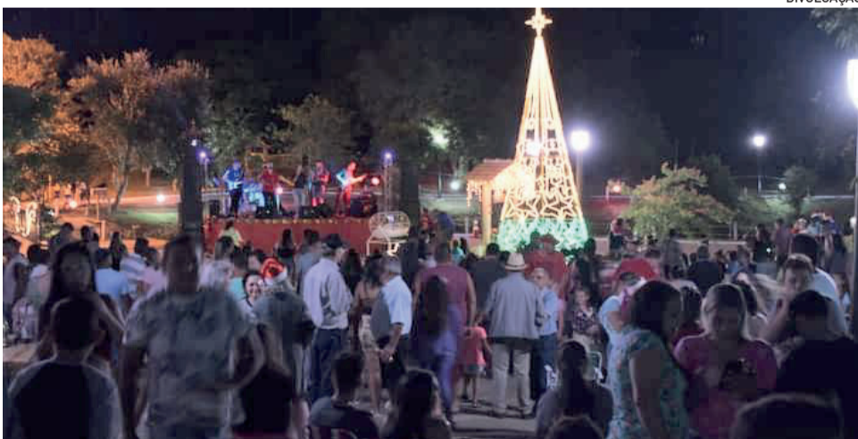
Natal Mais Brilhante no Parque terá diversas atrações