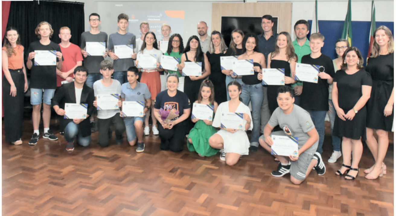
Turma de formandos recebeu seus certificados