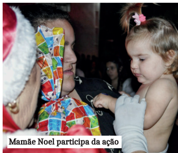
Mamãe Noel participa da ação