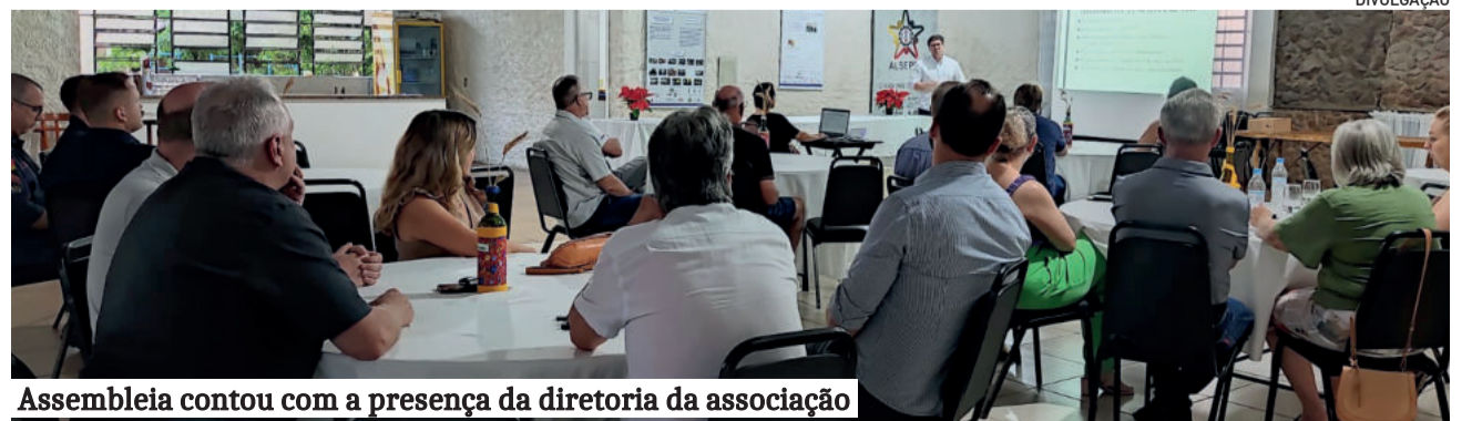
Assembleia contou com a presença da diretoria da associação