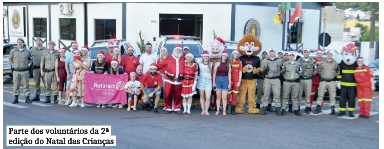
Parte dos voluntários da 2ª edição do Natal das Crianças

Doações de brinquedos e doces são recebidos na sede da Brigada Militar até as 18h deste sábado (23/12).