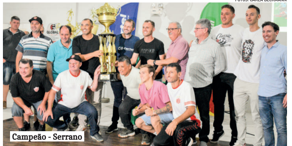
Campeão - Serrano