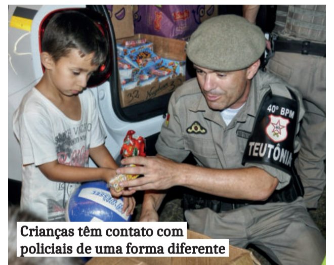
Crianças têm contato com policiais de uma forma diferente