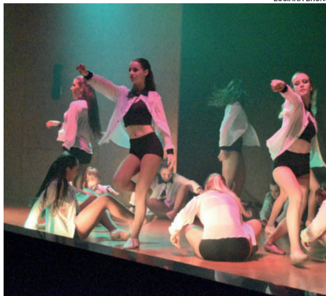
Apresentações aconteceram no auditório da Sicredi Ouro Branco