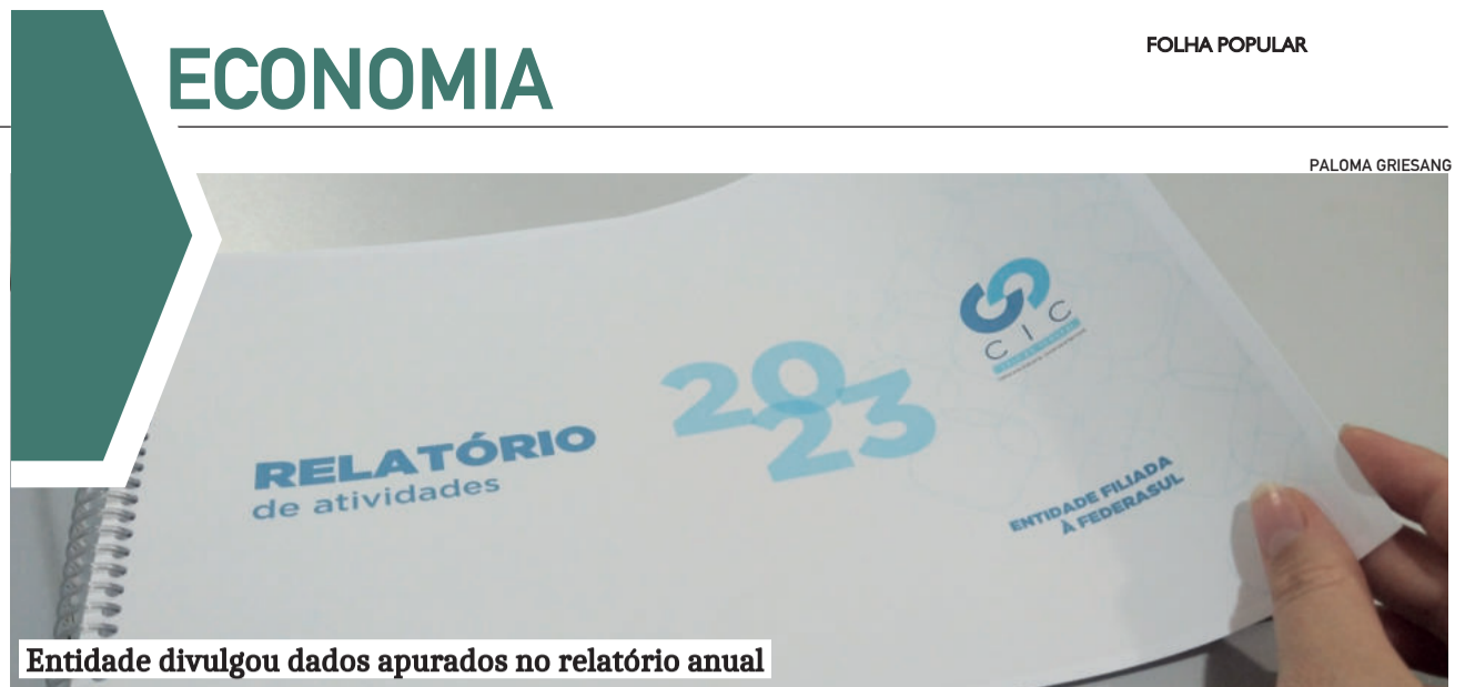
Entidade divulgou dados apurados no relatório anual