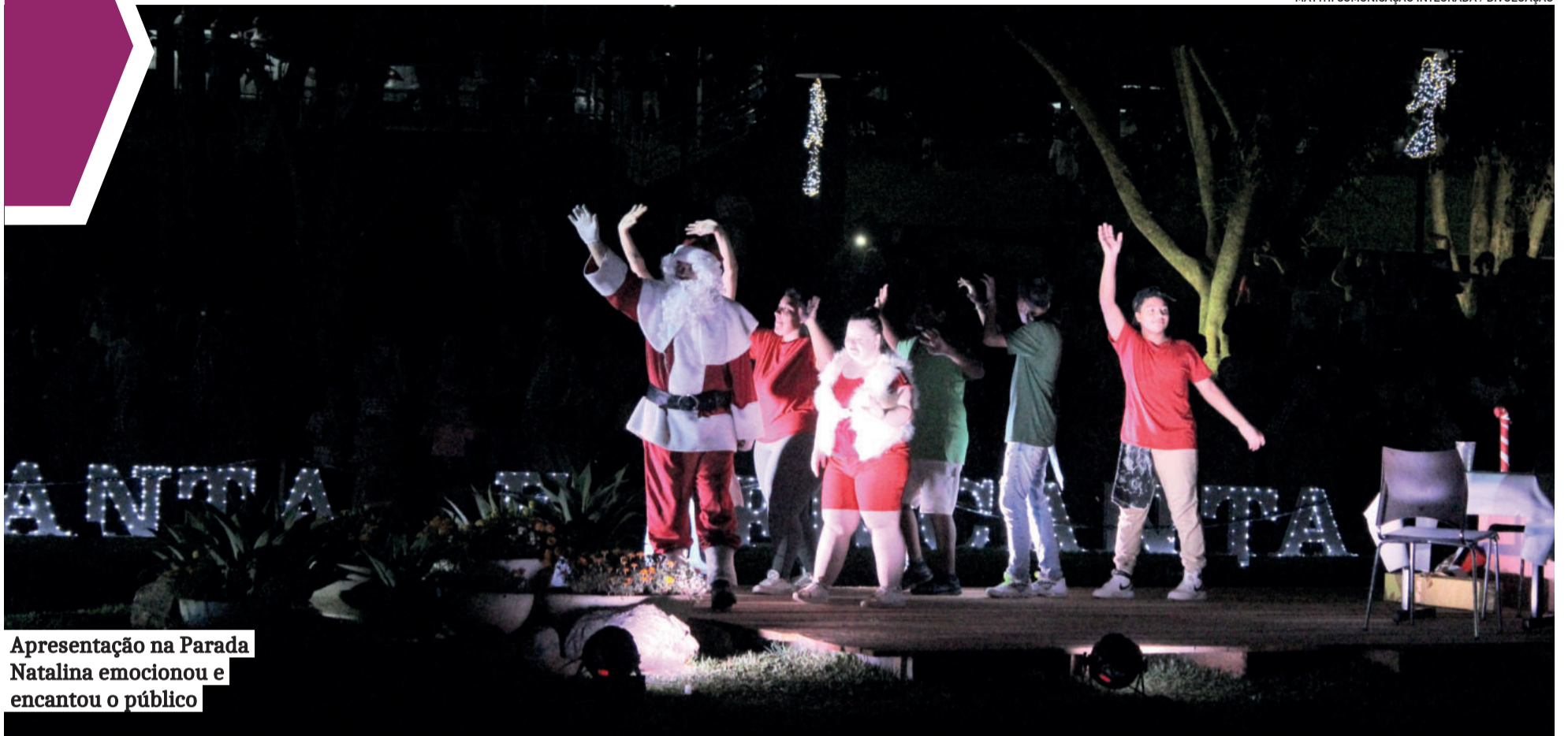
Apresentação na Parada Natalina emocionou e encantou o público