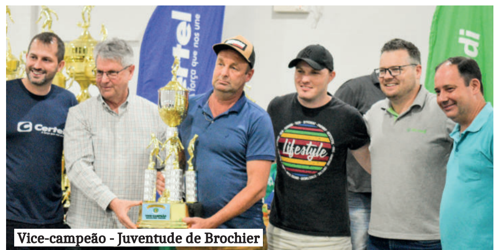
Vice-campeão - Juventude de Brochier