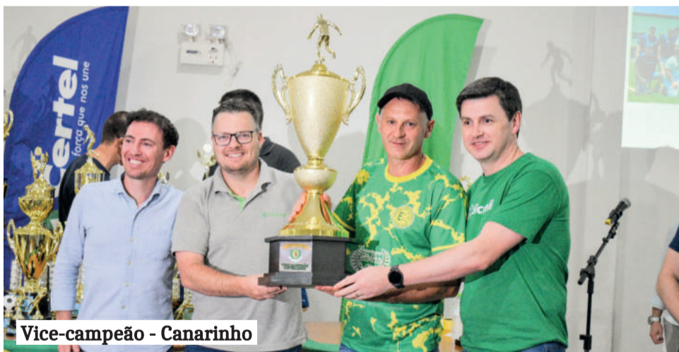
Vice-campeão - Canarinho