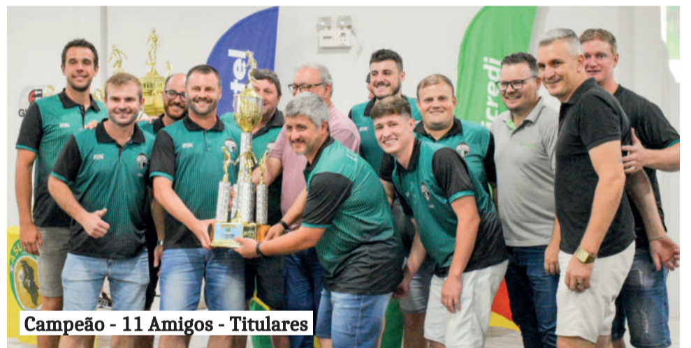
Campeão - 11 Amigos - Titulares