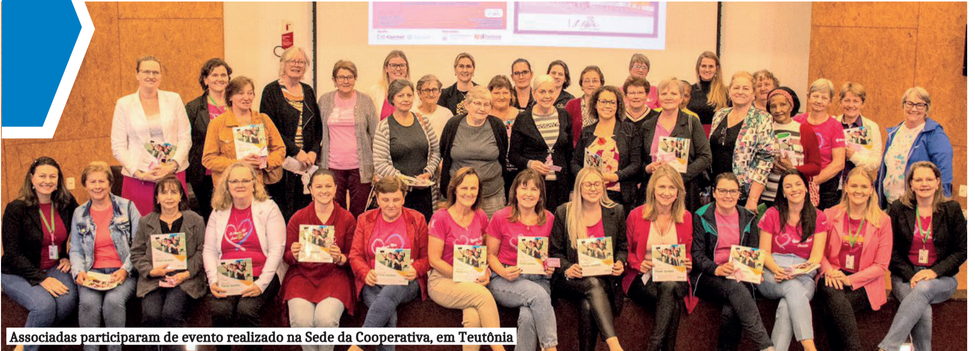
Associadas participaram de evento realizado na Sede da Cooperativa, em Teutônia