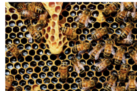
Pelo menos 5 mil criadores de abelhas sem ferrão são do Vale do Taquari