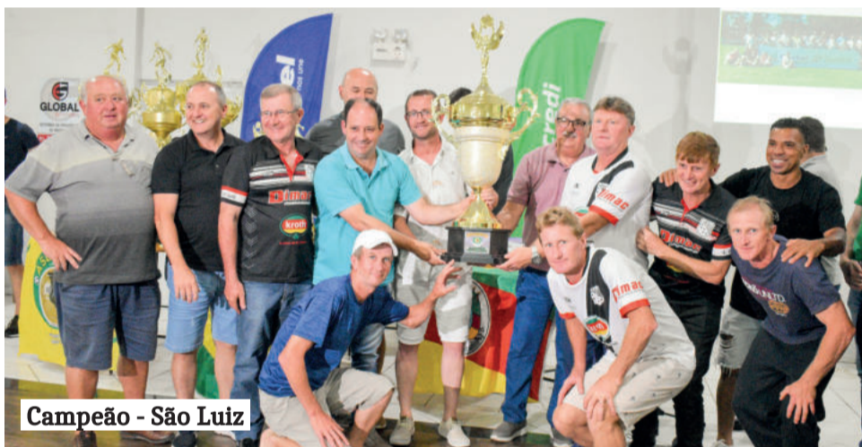
Campeão - São Luiz