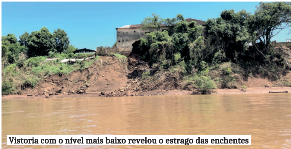
Vistoria com o nível mais baixo revelou o estrago das enchentes