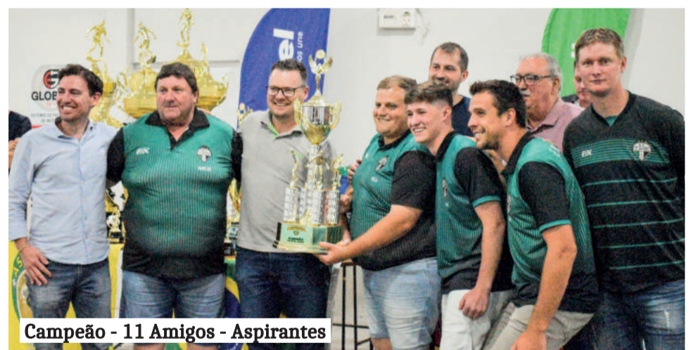
Campeão - 11 Amigos - Aspirantes