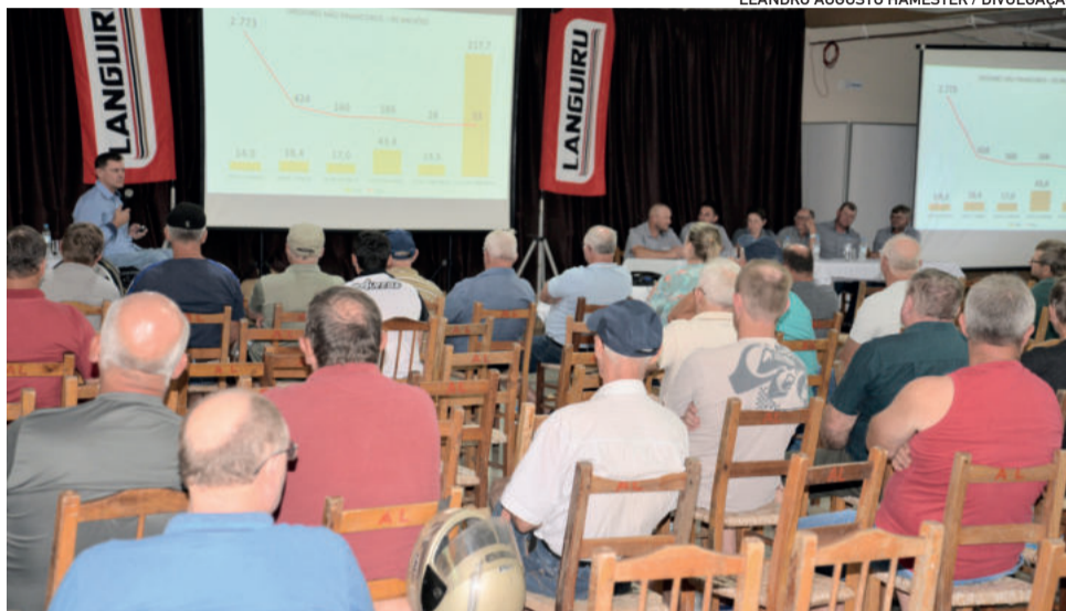
Assembleia reuniu 135 pessoas, das quais 102 associados votantes

A parceria prevê que, já em janeiro de 2024, essa empresa passe a abater