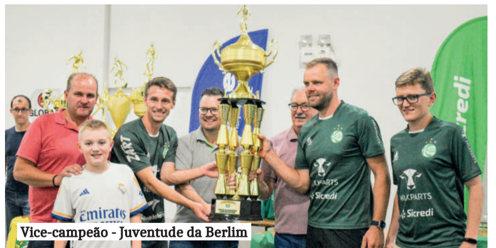
Vice-campeão - Juventude da Berlim