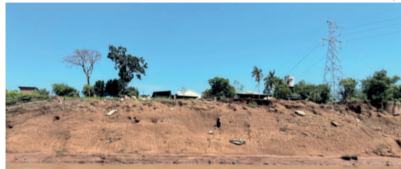
Cenário em algumas regiões é preocupante

com a baixa das águas, foi possível fazer uma avaliação mais detalhada dos estragos, que antes estavam submersos. Durante a vistoria, foi possível verificar danos nas margens do rio, como queda de árvores e desbarrancamentos e o acúmulo de sedimentos como areia, terra e cascalhos no leito do rio, provocando a formação de ilhas e a grande quantidade de lixo e entulhos.