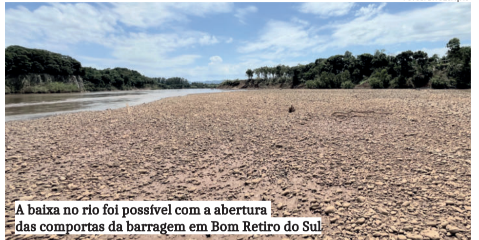
A baixa no rio foi possível com a abertura das comportas da barragem em Bom Retiro do Sul