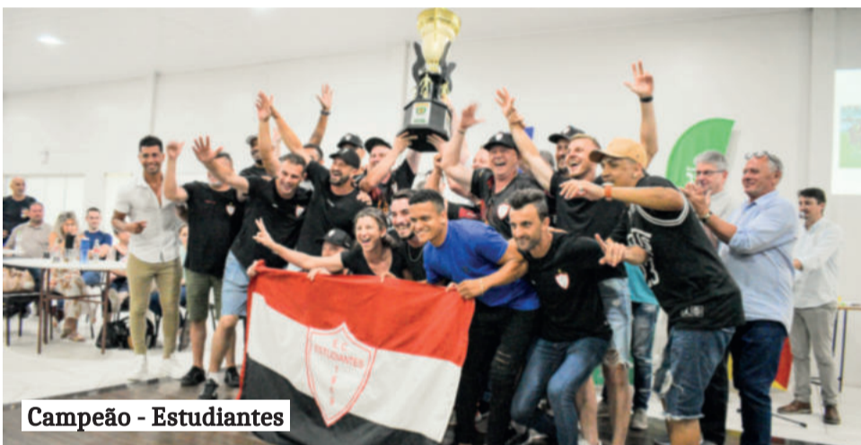
Campeão - Estudantes