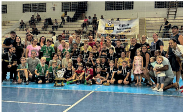
Elenco, comissão técnica e pais comemoraram a conquista em casa