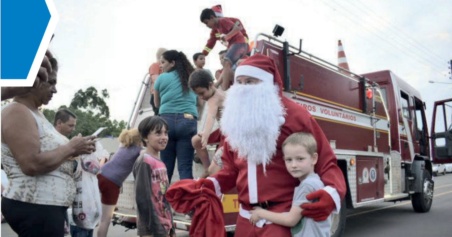
Doações de doces para as crianças podem ser feitas até hoje (9/12)