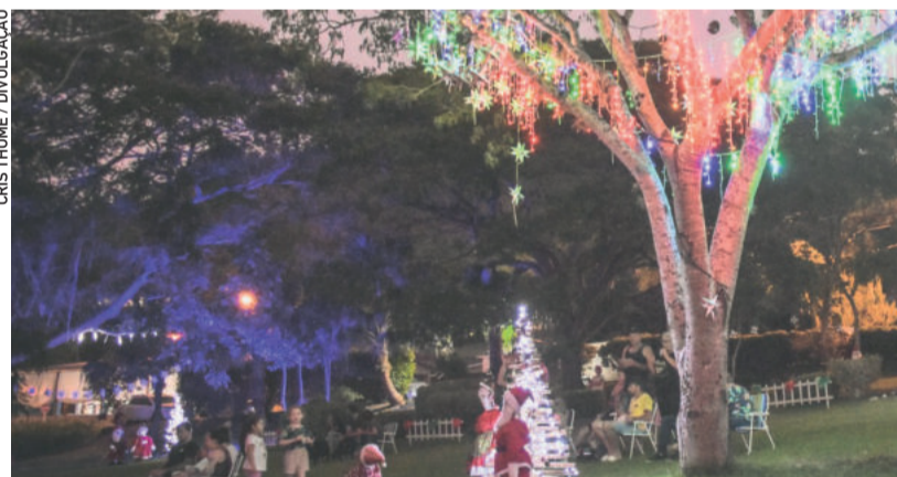
Programação acontece na Praça Municipal