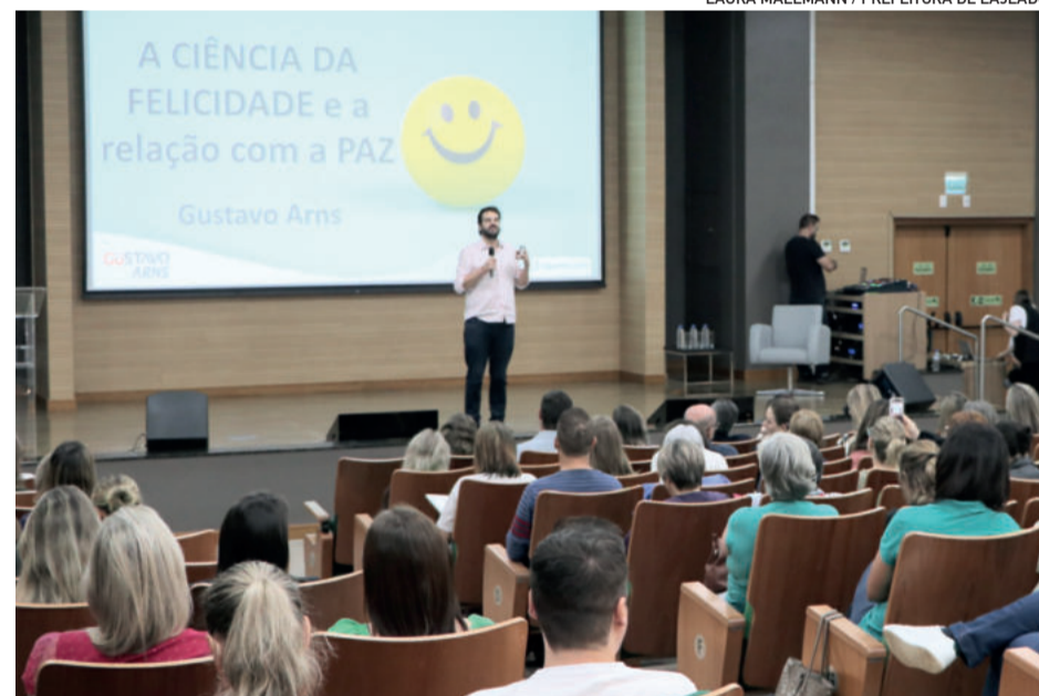
Programa impactou mais de 20 mil pessoas em quatro anos