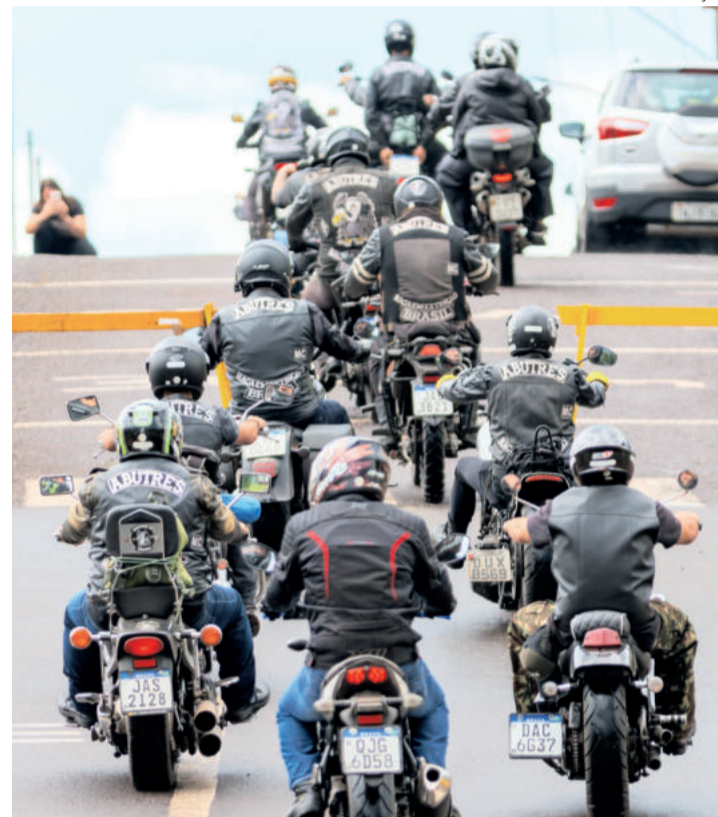
Lançamento apresentará mais de 15 atrações da 5ª Teutônia Moto Fest, um dos maiores encontros de motociclistas do estado