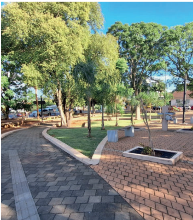
Programação ocorre na Praça da Comunidade Evangélica