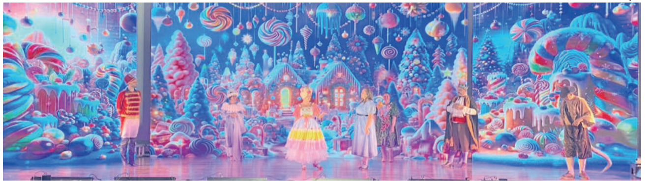
Painéis de LED formam o cenário do espetáculo