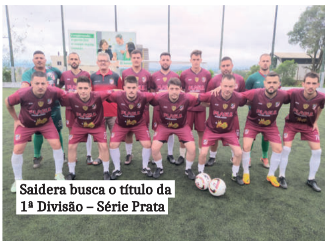
Saidera busca o título da 1ª Divisão – Série Prata

A partir das 13h, pela 2ª Divisão – Série Prata, o Tsunami FA enfrenta o BUD FC. Na sequência, às 14h10, pela 1ª Divisão – Série Prata, o Galácticos FC encara a equipe teutoniense, Saidera. No terceiro jogo, 15h20, pela 2ª Divisão – Série Ouro, o Kneucus PFC enfrenta o Sokanelinhas. Na última partida, às 16h30, pelo título máximo – 1ª Divisão – Série Ouro, o time teutoniense, Brocadores disputa a taça contra o Só Resenha.