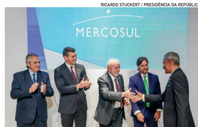
Assinatura ocorreu na 63ª Cúpula do Mercosul