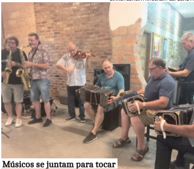
Músicos se juntam para tocar

O secretário da Cultura, Desporto e Turismo, Charles Porsche, falou da tradição deste encontro, criado em 1994, para celebrar a alegria que a