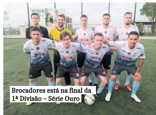
Brocadores está na final da 1ª Divisão – Série Ouro