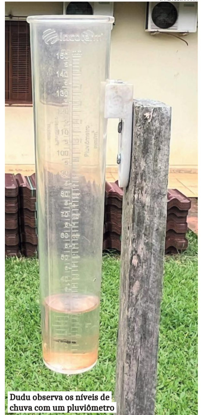
Dudu observa os níveis de chuva com um pluviômetro

Outro observador é o morador de Poço das Antas, Tarcísio Herbert, que coleta dados há mais de 18 anos. Em 2023 choveu 2.870mm no município, 930mm a mais que o ano anterior. O dia mais quente do ano em Poço das Antas foi 17 de dezembro (39.7°C). O dia mais frio foi registrado em 28 de agosto (0.2°C).