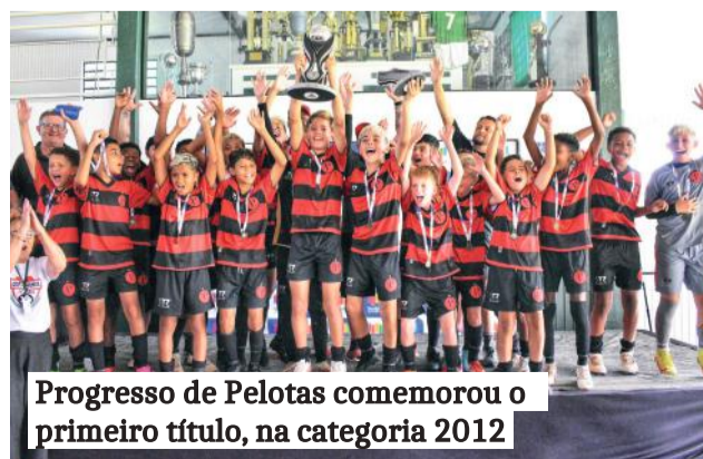
Progresso de Pelotas comemorou o primeiro título, na categoria 2012