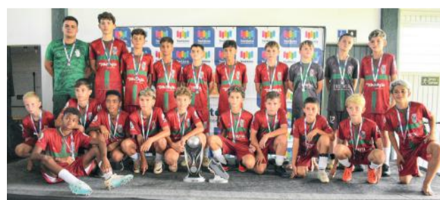
Juventus foi vice-campeã na categoria 2011