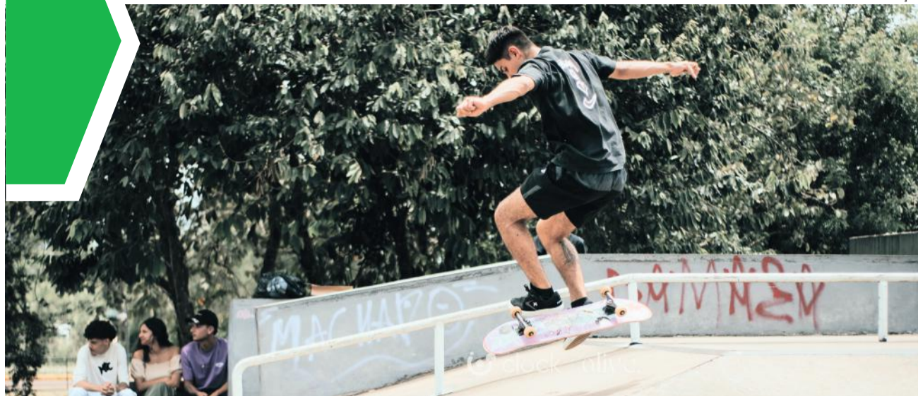
Vinte atletas participaram da competição