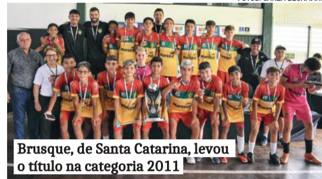
Brusque, de Santa Catarina, levou o título na categoria 2011