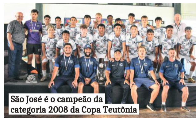
São José é o campeão da categoria 2008 da Copa Teutônia

EC São José venceu o UJC pelo placar de 1 a 0 e ergueu a taça de campeão pela categoria 2008 (Sub-16 anos). O primeiro tempo foi de pouca criação ofensiva das duas equipes, sem chances claras de gols. A segunda etapa foi mais movimentada pela equipe do São José, que marcou o único gol da partida aos 25min. O zagueiro Firme recebeu passe dentro da área e chutou no canto para abrir o placar.