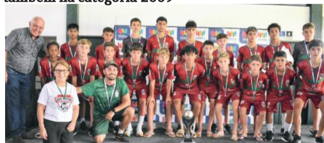
Juventus é vice-campeã na categoria 2010