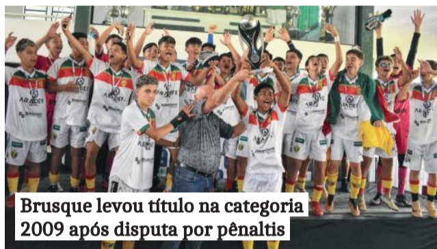
Brusque levou título na categoria 2009 após disputa por pênaltis