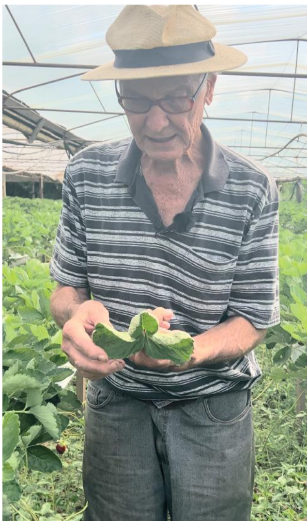
Olvides lamenta perdas