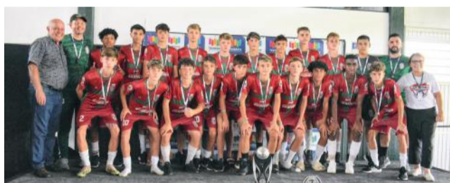
Juventus terminou vice-campeã também na categoria 2009