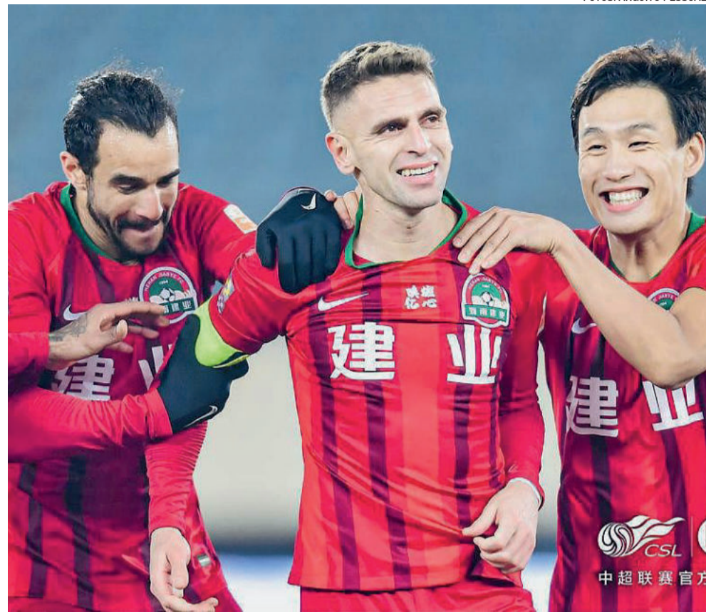
Atleta tem respeito e admiração dos colegas