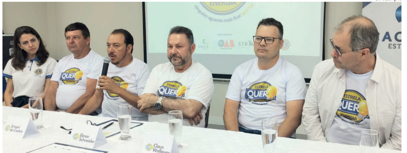
Movimento une Poderes Executivo e Legislativo de Estrela, OAB Seccional Estrela, Promotoria de Justiça de Estrela, CIC Vale do Taquari, Cacis, STR de Estrela, Lions Clube e Rotary Club