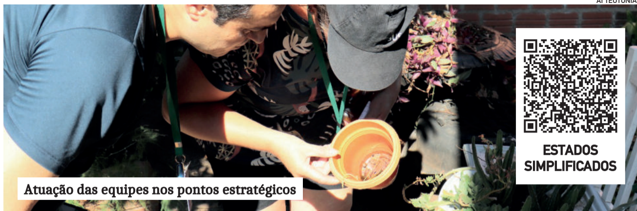
Atuação das equipes nos pontos estratégicos