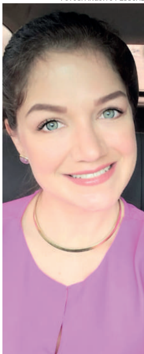
Em 2024, segue o acompanhamento