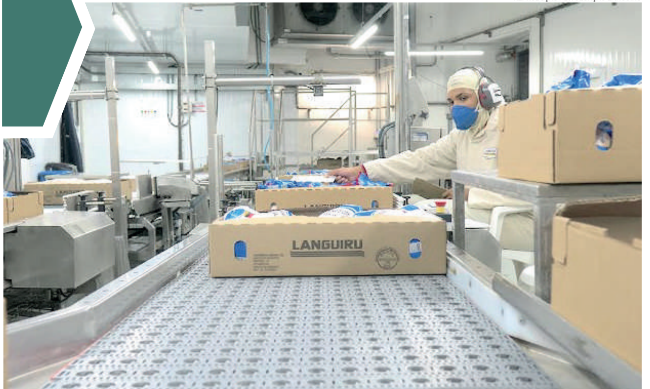
Parcelas de janeiro e fevereiro devidas a ex-funcionários estão atrasadas