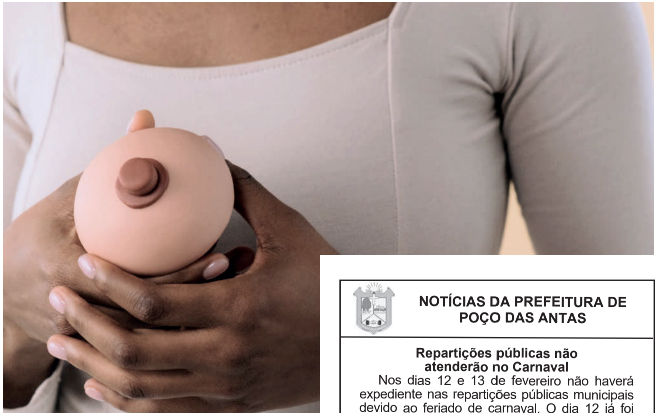
Câncer de mama atinge 10% da população mundial