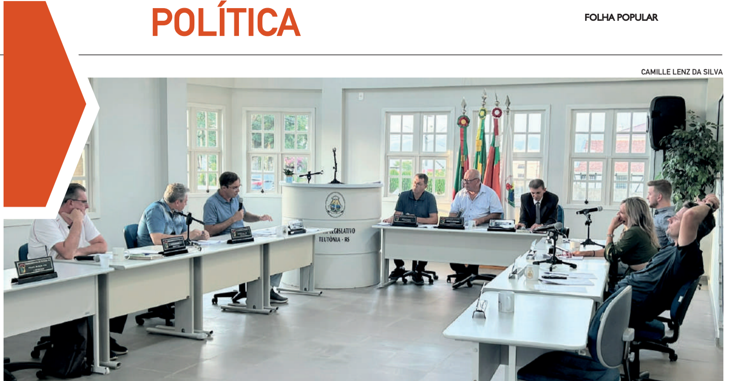
Criação de cargos e contratações emergenciais e efetivas pautaram as discussões

Como não somos previdentes, tampouco poupamos o ambiente natural, parafraseio a musiquinha do antigo Bamerindus: “O tempo passa, tempo voa e a solução vira promessa numa boa”.