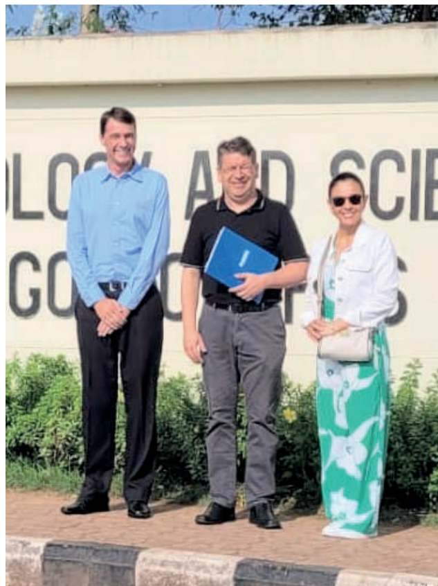
Próxima missão de estudos ocorrerá em outubro em Pequim, na China

A próxima missão de estudos ficou agendada para outubro, em Pequim, na China. Também devem ocorrer publicações conjuntas dos quatro grupos de pesquisa envolvidos.