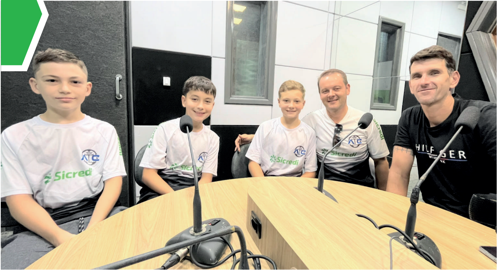
Pais e filhos estiveram no Bola na Trave dessa quarta-feira (7/2)