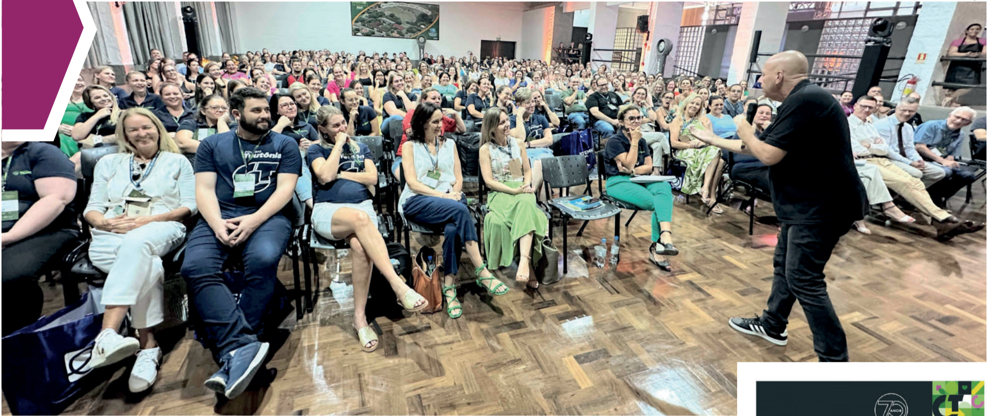
Evento reuniu mais de 400 profissionais da Educação em dois dias

TEUTÔNIA ► CONGRESSO INTERNACIONAL DE EDUCAÇÃO DO CT