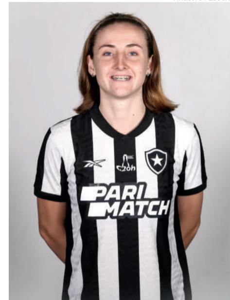
Teutoniense atua como zagueira e volante