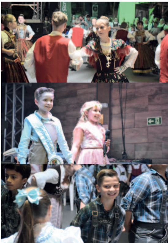
Participação das crianças encantou o público