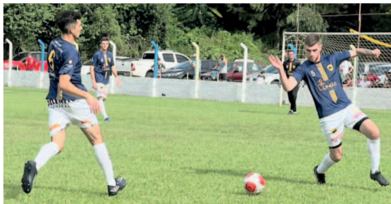
União (azul) superou o União Sombras Dossul na estreia