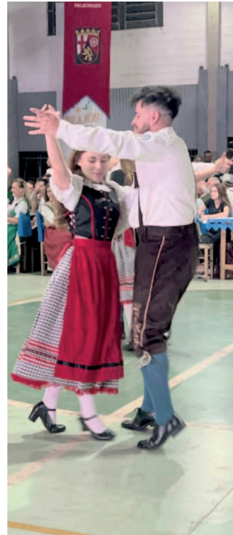
Cinco categorias do Grupo de Danças Folclóricas Alemãs de Estrela fizeram apresentações