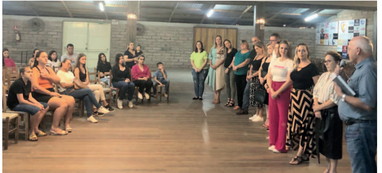
Apresentação do projeto para as famílias ocorreu na sexta-feira