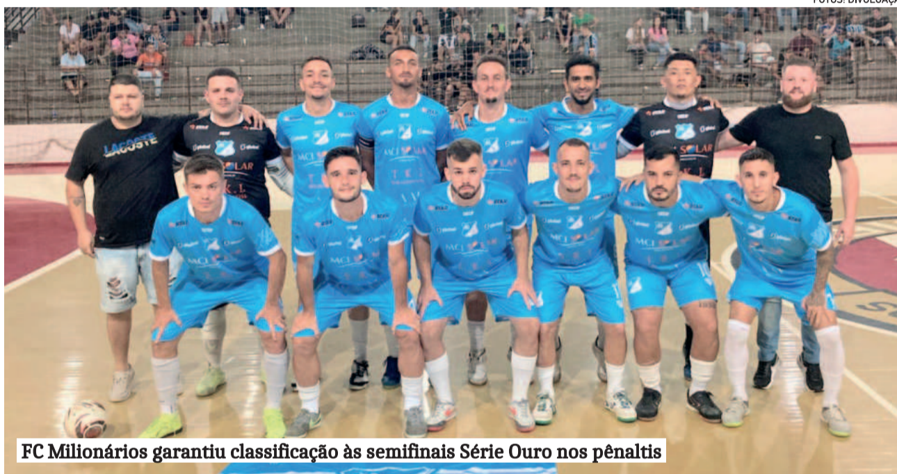
FC Milionários garantiu classificação às semifinais Série Ouro nos pênaltis