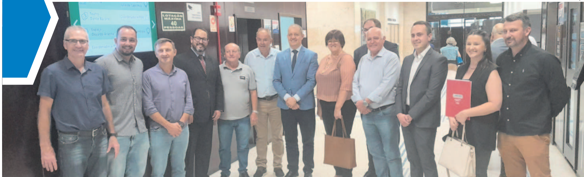
Prefeitos e lideranças com o deputado Edilson Brum (c) no plenário

REGIÃO ► COMPRA DO FRIGORÍFICO DE SUÍNOS DA LANGUIRU PELA SEARA