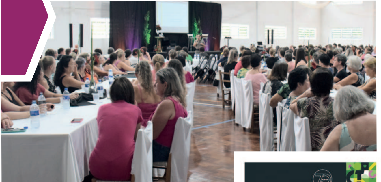
Centenas de mulheres participaram do evento no sábado (9/3)