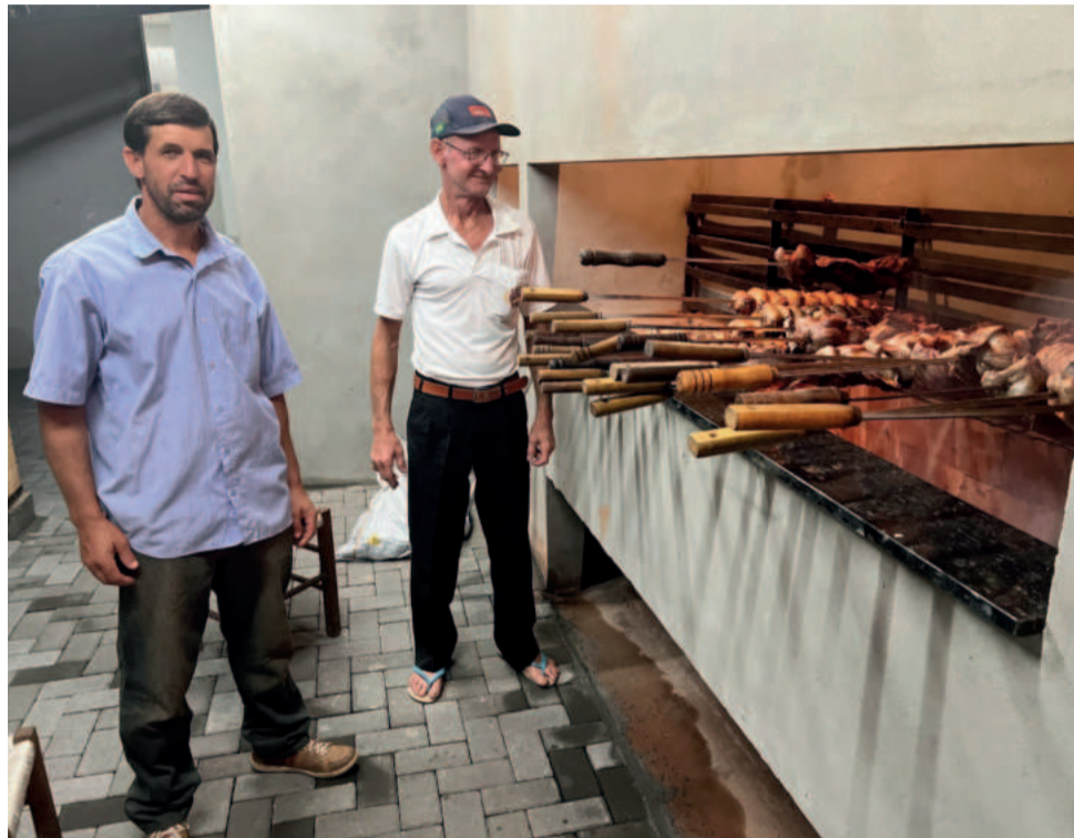
Churrasqueira recebeu melhorias e ampliação