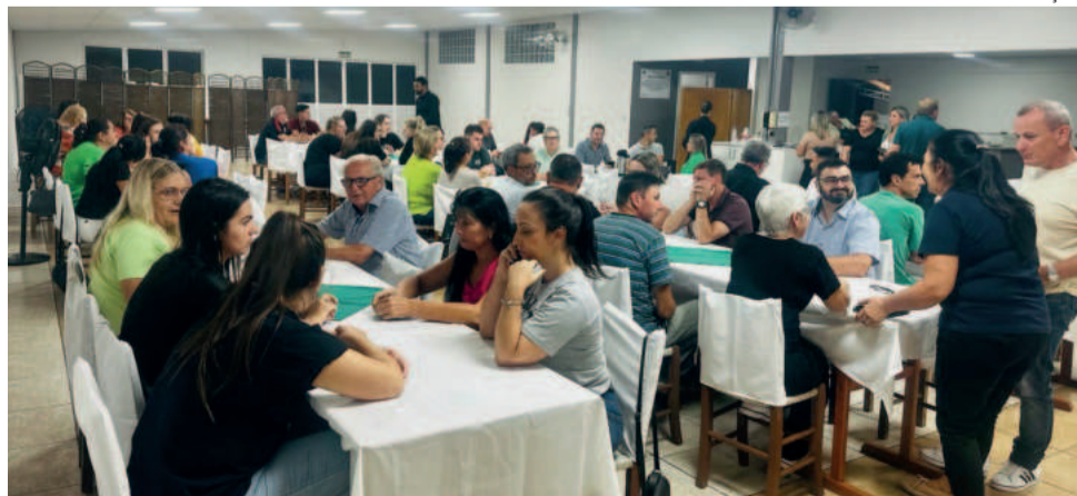
Salão Social foi inaugurado após a assembleia