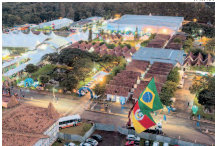
Expectativa é que a feira seja a maior de todas as edições

No evento de lançamento, são esperados 150 convidados que saberão, em primeira mão, as atrações dos seis dias de festa, que ocorrerá entre 28 de maio e 2 de junho. Os organizadores garantem que a festa é para toda a família e para todas as idades.