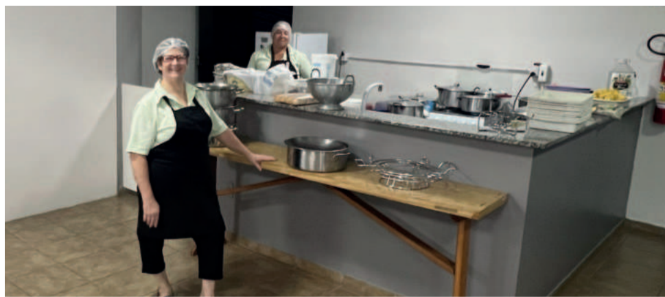
Área interna também teve mudança de leiaute

As novidades foram apresentadas após a assembleia geral extraordinária do dia 5 de março, quando se definiu a incorporação do Sindicato Calçadista de Santa Clara do Sul pelo Siticalte. O salão social é um espaço utilizado para eventos do sindicato, mas também serve para locações prioritariamente para sócios da entidade sindical.