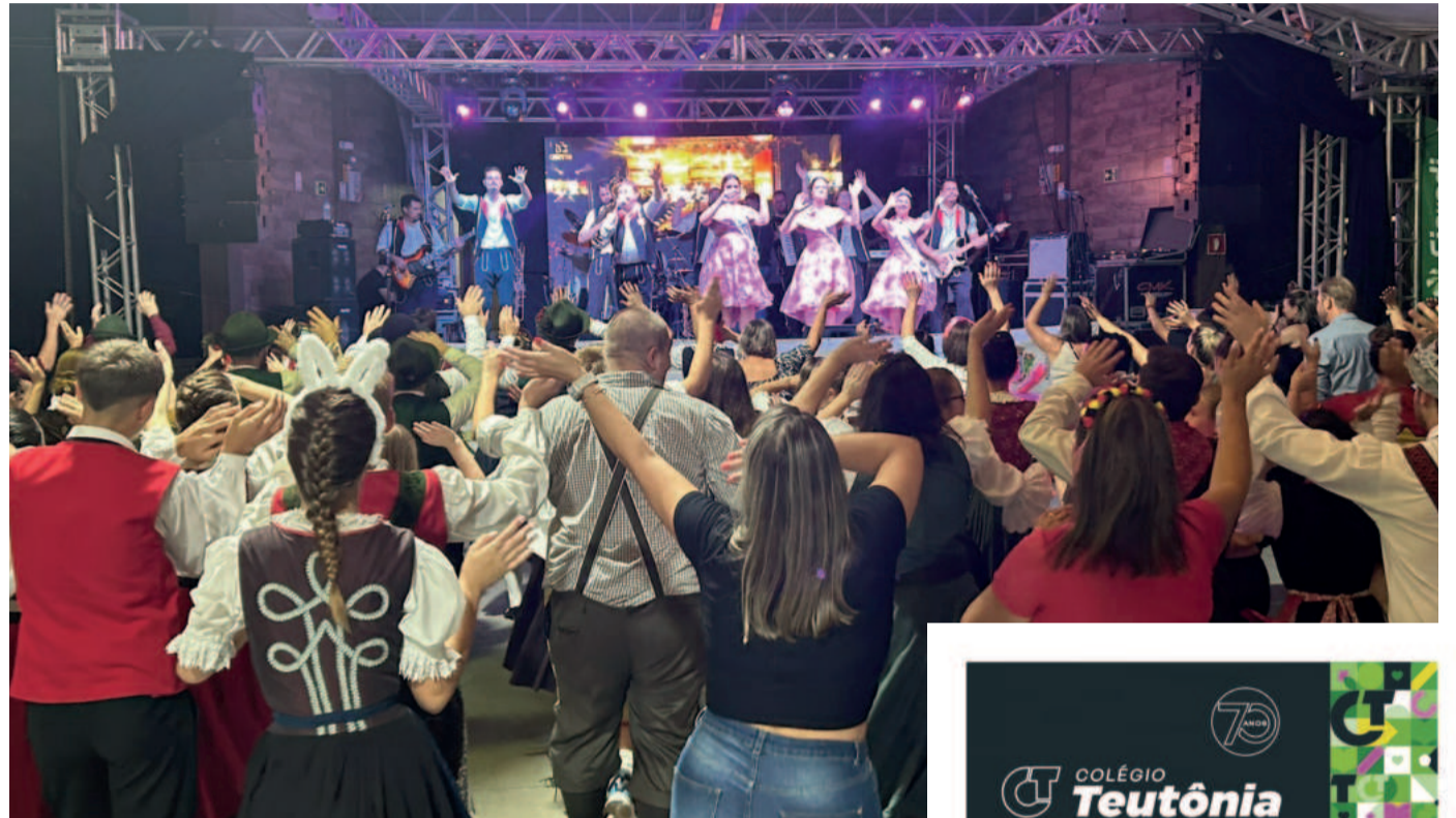
Bandas fizeram a alegria dos presentes