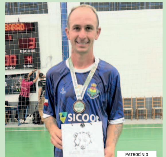
Tego, da seleção de Barão