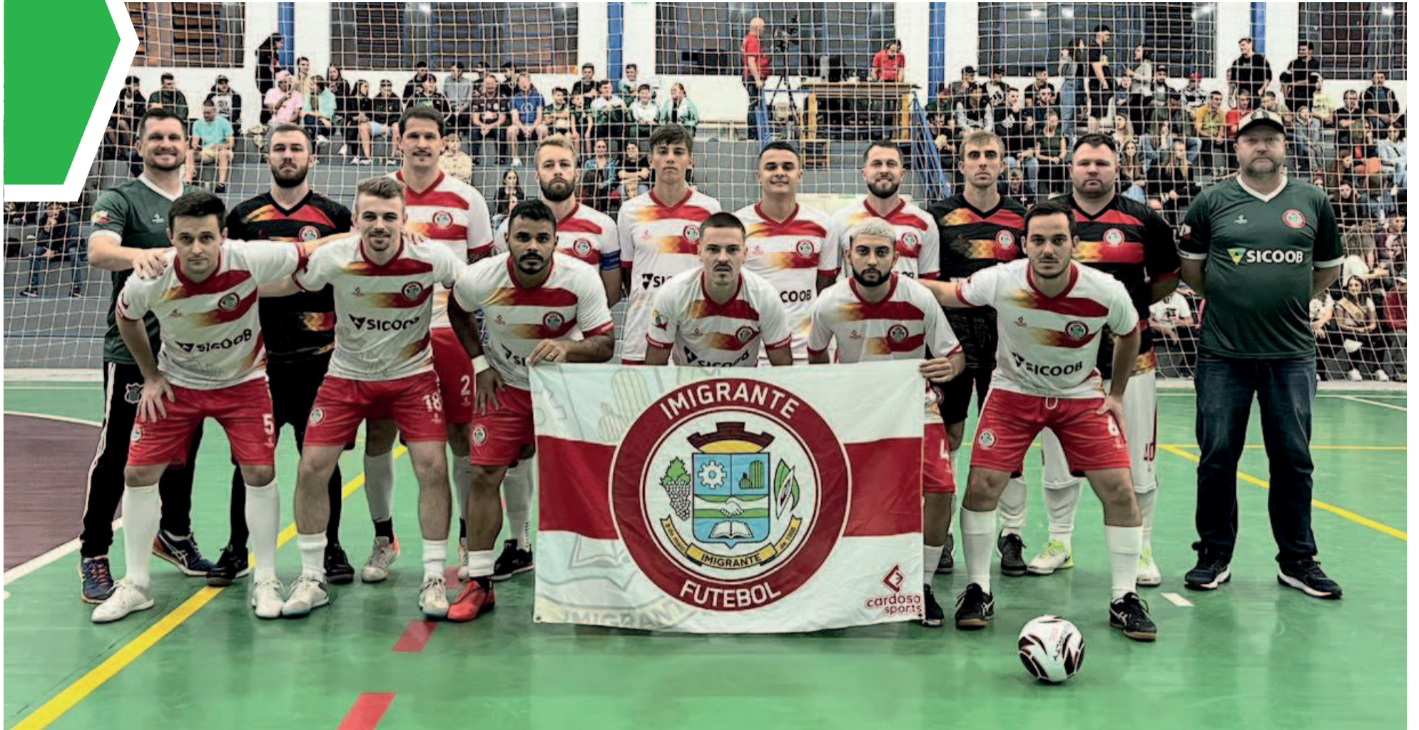
Seleção de Imigrante teve mais "sorte" fora de sua cidade