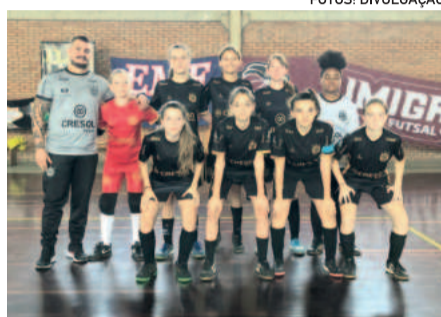
Elenco Sub-15 venceu a Escola da Duda por 3 a 0