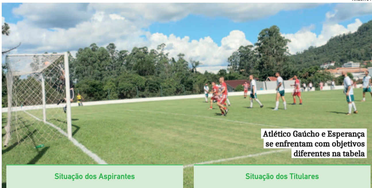
Atlético Gaúcho e Esperança se enfrentam com objetivos diferentes na tabela

Enquanto isso, os dois clubes classificados na Chave B se enfrentam para melhorarem as campanhas e aguardarem seus adversários. Juventude da Berlim e União da Germano poderão ter, inclusive, vantagem nas partidas semifinais por conta das campanhas.