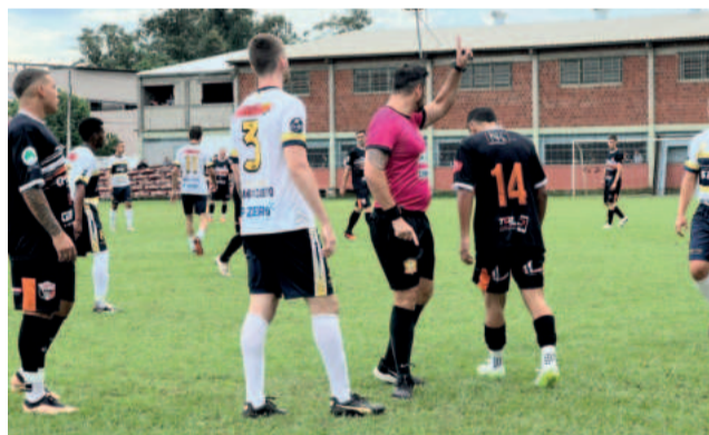
Arbitragem tem mantido rigor com a disciplina e clubes têm colaborado