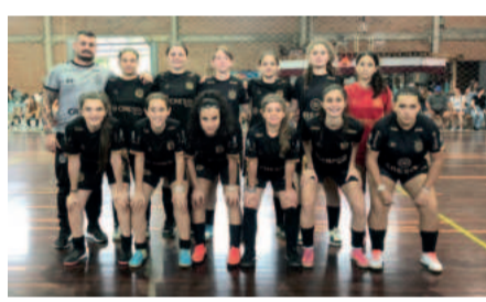
Time Sub-17 levou a melhor sobre o CT Imigrante