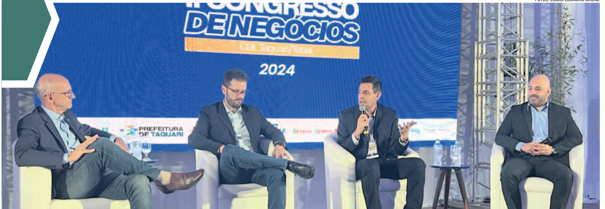
Painel de negócios debateu temas relevantes para os empreendedores

TAQUARI / TABAÍ ▶ 2º CONGRESSO DE NEGÓCIOS