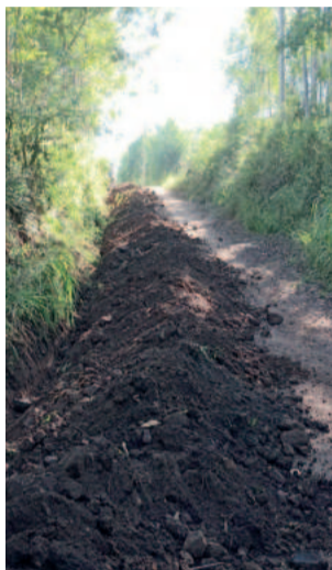
Serão construídos mais de 1.400 metros de rede de água potável