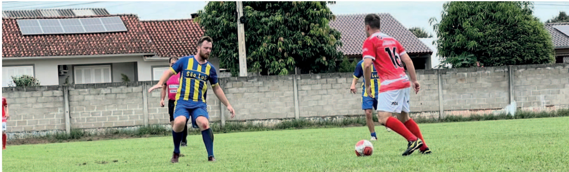
São Luís (azul) tenta manter a liderança e Arroio do Ouro se reabilitar na tabela