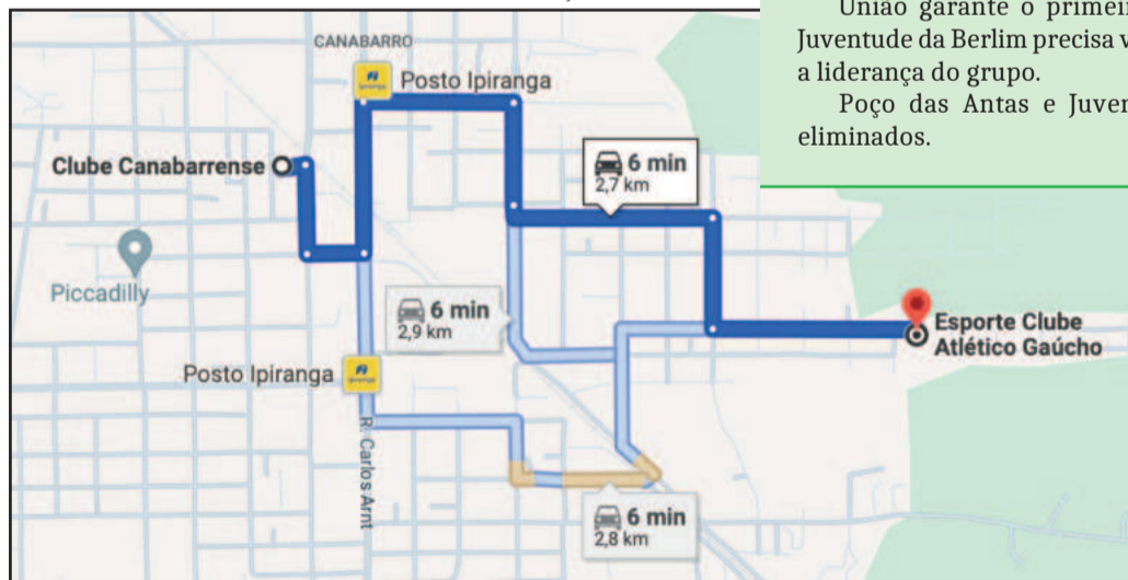
Campos dos jogos decisivos ficam no Bairro Canabarro