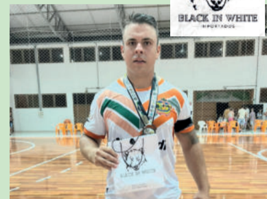
Beicho, de Harmonia