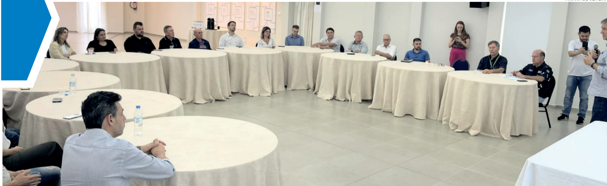
Lideranças de Lajeado, Acil, CIC-VT e da ANTT se reuniram para discutir soluções