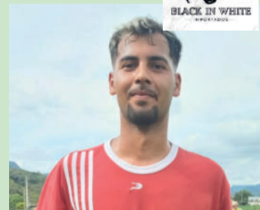
Dody, do União da Germano