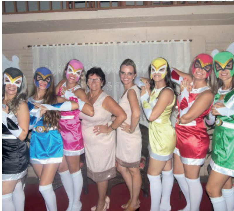
Baile das Luluzinhas é opção para quem gosta de agito