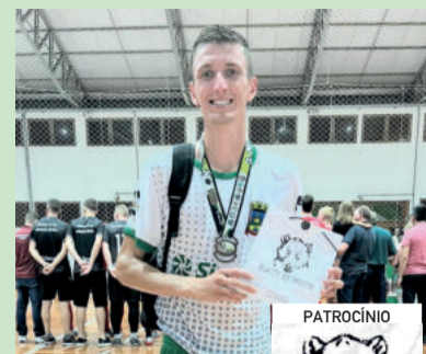
Veba, de Pareci Novo