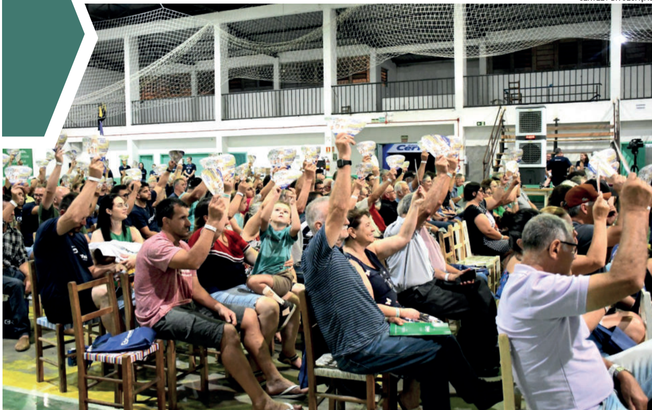
Certel realiza assembleias microrregionais desde o dia 28 de fevereiro