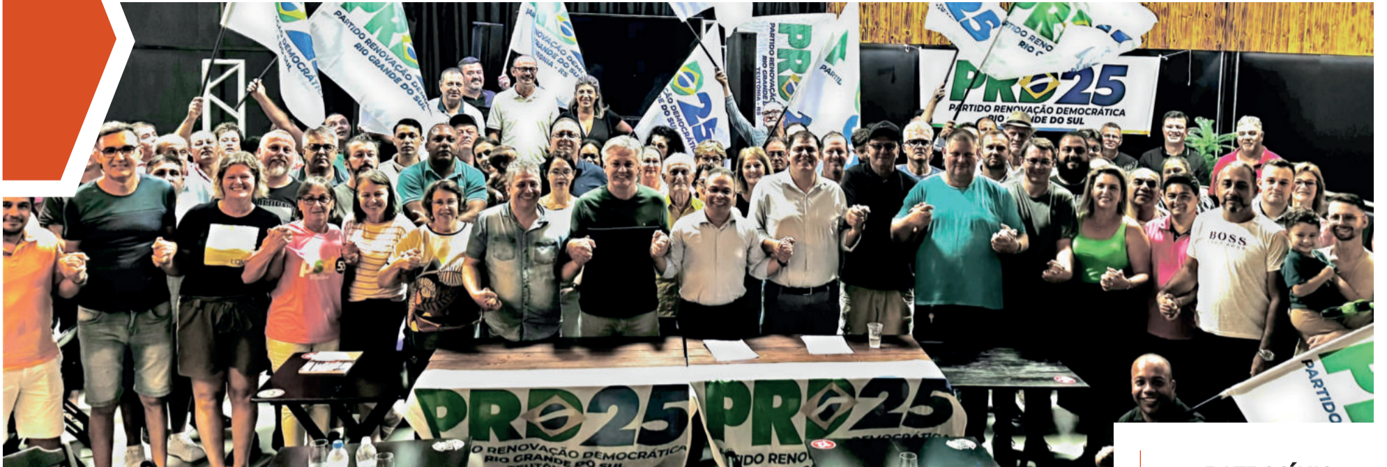
PRD realizou encontro na sexta-feira para formalizar constituição