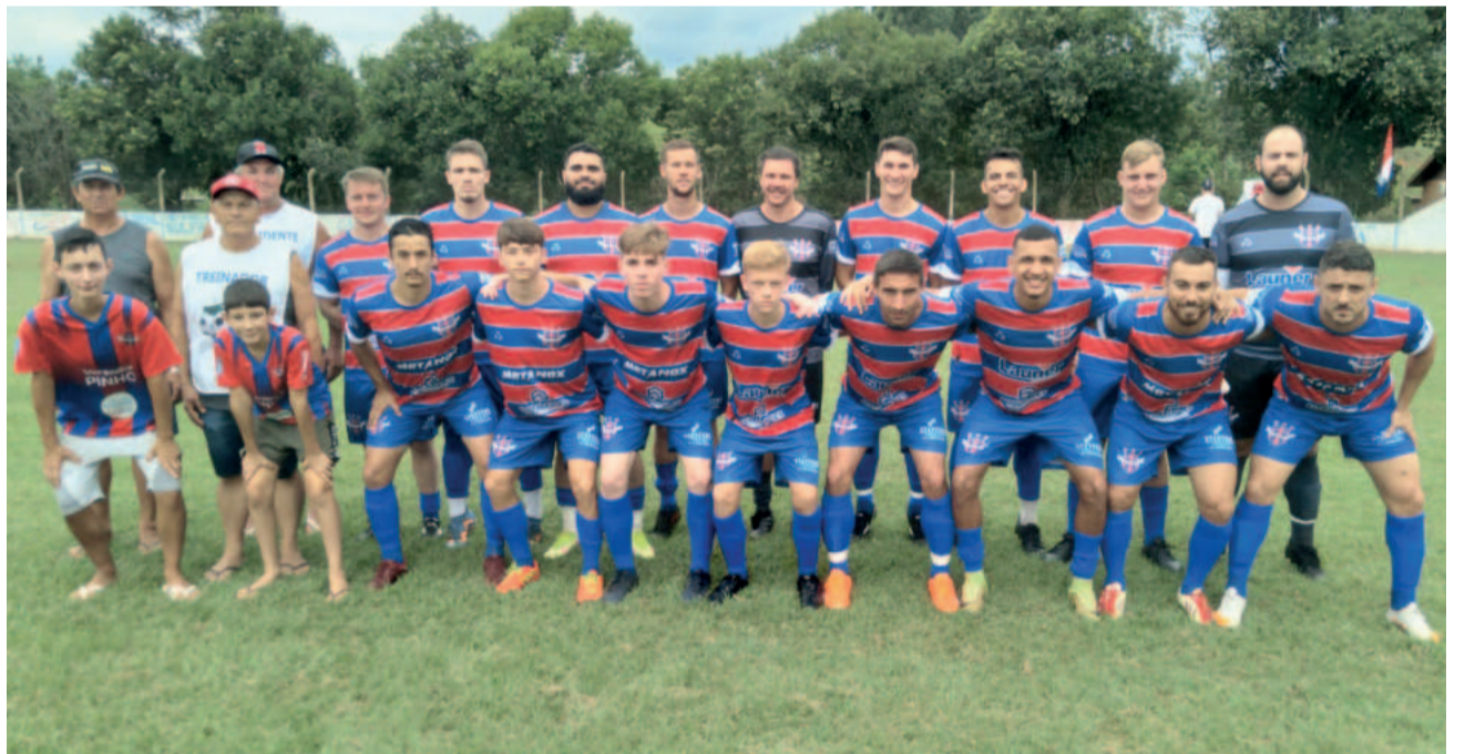
Atual campeão Aimoré foi bastante reformulado para esta edição