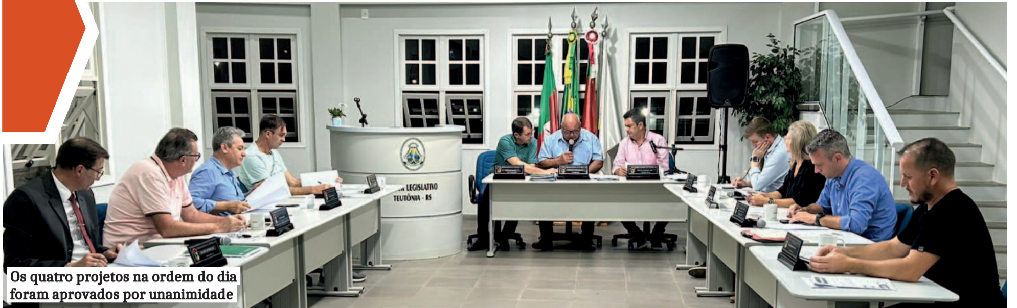
Os quatro projetos na ordem do dia foram aprovados por unanimidade