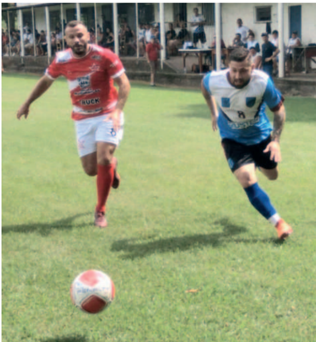
Arroio do Ouro (vermelho) estreou com goleada