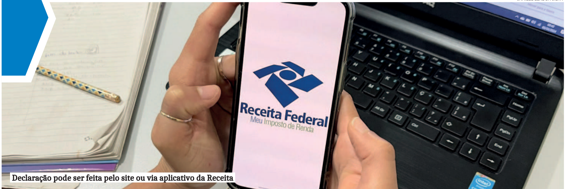
Declaração pode ser feita pelo site ou via aplicativo da Receita