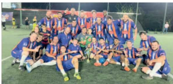
Knecus, campeão da Série Prata da Copa de Verão da Soges