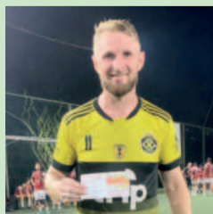
Fritz, do Xtotz, foi o craque da final Ouro