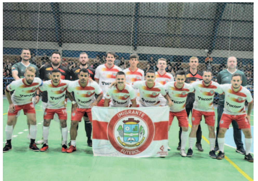
Imigrante reformulou elenco e apostas nos jovens