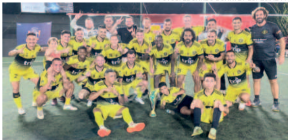
Xtotz United, campeão da Série Ouro da Copa de Verão da Soges