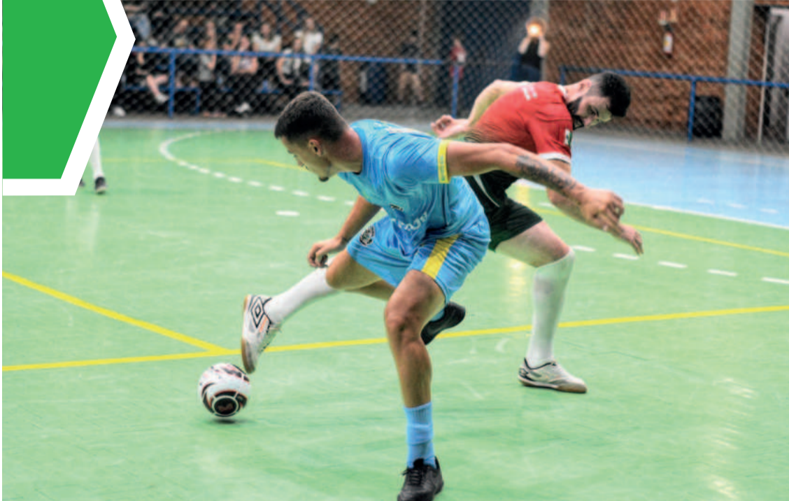
Jogos tiveram gols até os últimos segundos de jogo