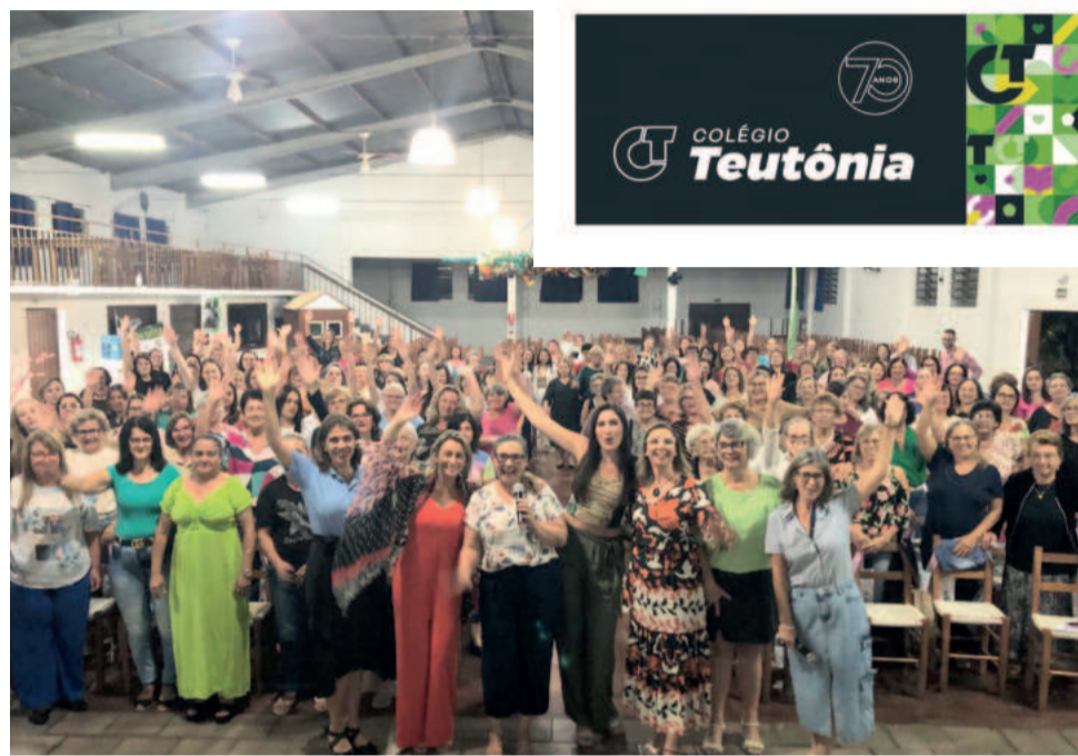
Mais de 160 mulheres participaram do Mulheres Conect@das