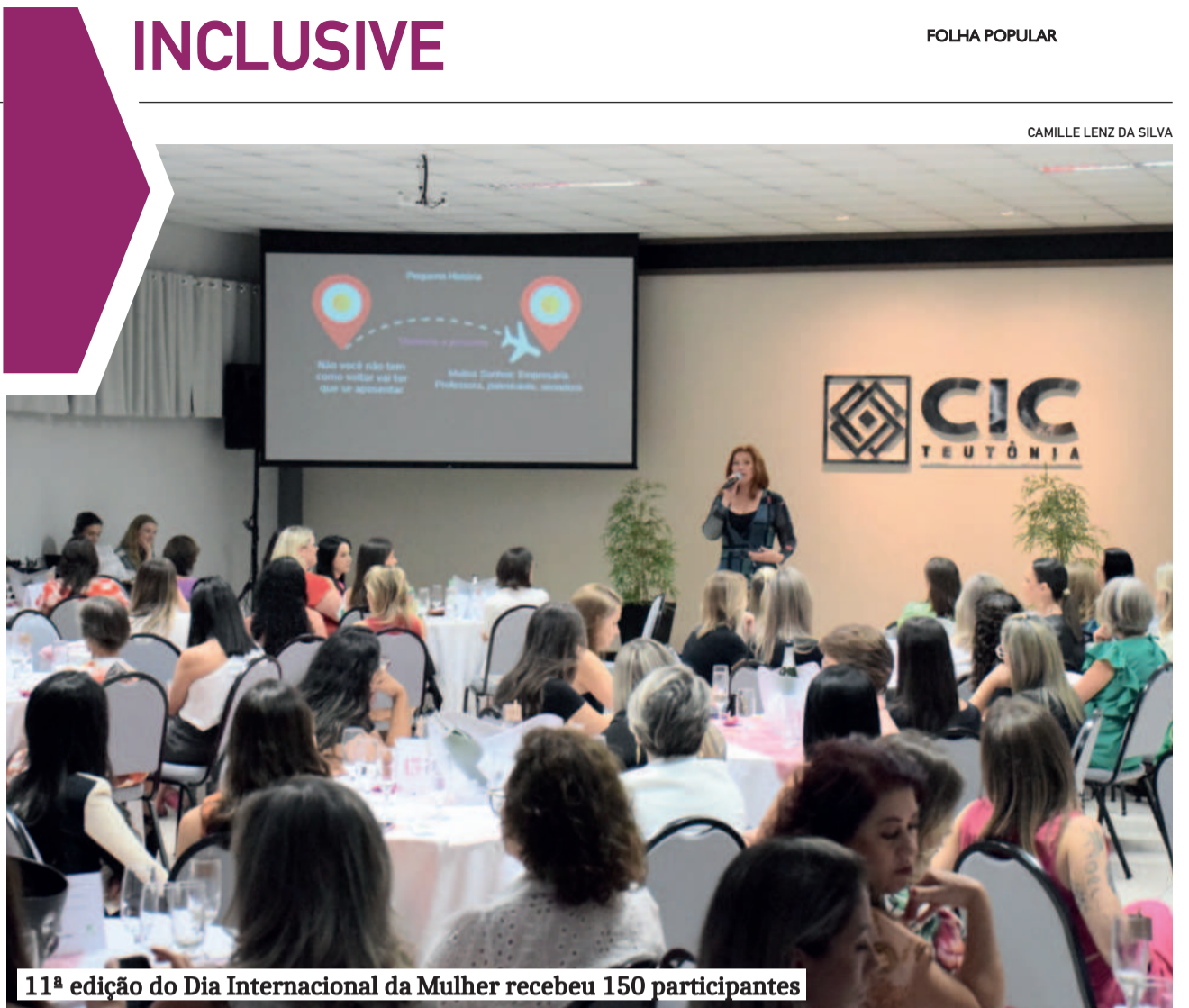
11ª edição do Dia Internacional da Mulher recebeu 150 participantes

Músicas (ainda que não tenha curtido o artigo, não deixe de ouvi-las) e autores: 1 Paisagem da Janela, Lô Borges; 2 Aquarela, Vinícius de Moraes e Toquinho; 3 Bola de Meia, Bola de Gude, 4 Milton Nascimento; Abri a Porta, A Cor do Som; 5 Como nossos Pais, Belchior (na voz de Elis Regina); 6 Sinal Fechado, Paulinho da Viola; 7 Envelhecer é uma Arte, Adoniran Barbosa; 8 Deixe a Vida me Levar, Seginho Meriti e Eri do Cais (cantada por Zeca Pagodinho)