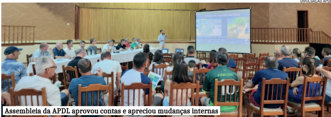
Assembleia da APDL aprovou contas e apreciou mudanças internas