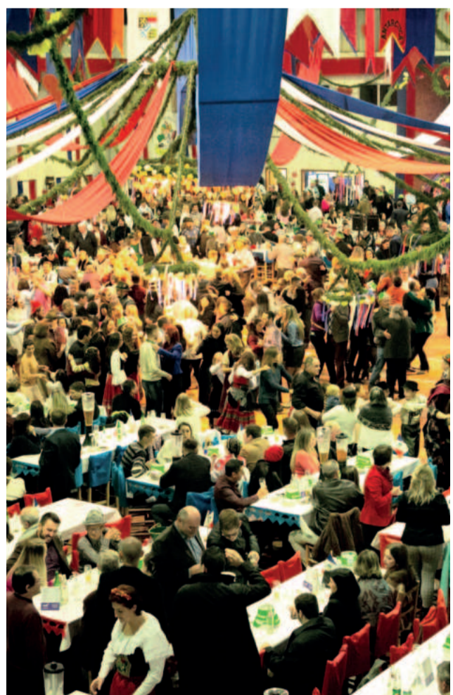
30ª Blumentanzfest e lançamento do 57º Festival do Chucrute ocorrem nesta noite

A programação do Festival do Chucrute conta com o tradicional Desfile Típico dos Grupos Folclóricos de Danças Alemãs pelas principais ruas da cidade, a ser realizado no dia 4 de maio, às 15h.