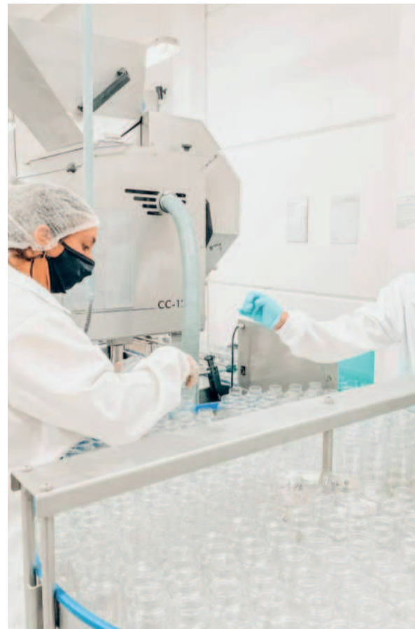
Empresa mantém alto investimento em Pesquisa e Desenvolvimento

Calheirana vai introduzir uma extensa lista de softwares, processos e produtos inovadores com o objetivo de diferenciar sua empresa ainda mais e fortalecer os relacionamentos com clientes, fornecedores e parceiros. "Estamos entusiasmados com a expansão do software de controladoria e compliance, que serão integrados para melhorar a segurança cibernética, promovendo uma gestão mais eficiente e segura das responsabilidades fiscais, jurídicas e de dados da empresa." Dentre as novidades, uma solução inovadora integrando os processos industriais, relatórios e tecnologias avançadas de linguagem de inteligência artificial (IA) por meio de uma BigTech.