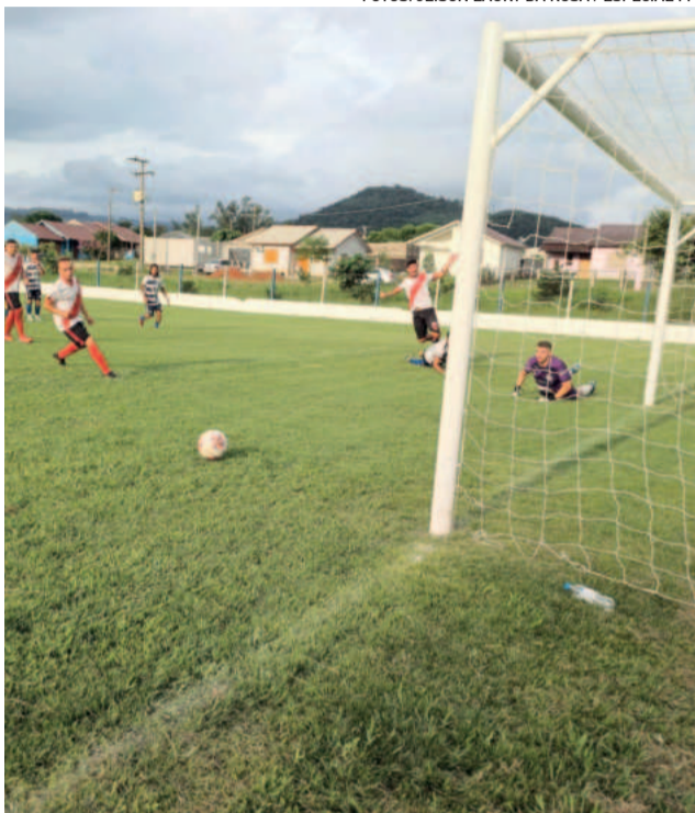
Juventude da Frank e União da Germano voltam a se enfrentar neste domingo