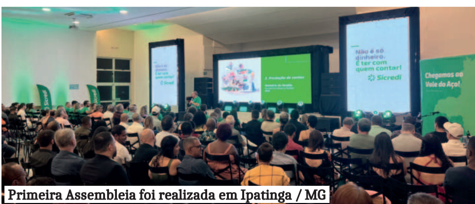
Primeira Assembleia foi realizada em Ipatinga / MG

A direção apresentou o desempenho da cooperativa em Minas Gerais na semana passada, durante a assembleia realizada em Teutônia/RS, sede da cooperativa. E há uma nova oportunidade, com outra região de 37 municípios e 384 mil habitantes. “O projeto foi aprovado [pela Central] e será levado para a assembleia de delegados, para avançar nesta área limítrofe em Minas Gerais”, salienta o presidente.