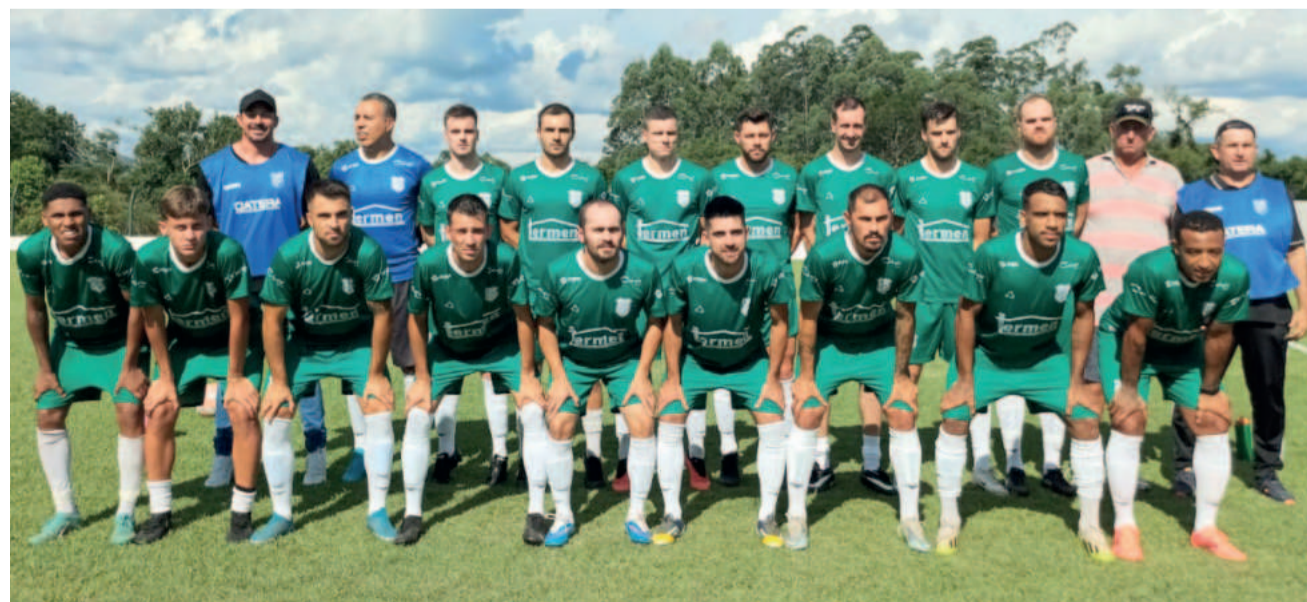
Esperança pode confirmar a classificação com duas rodadas de antecedência