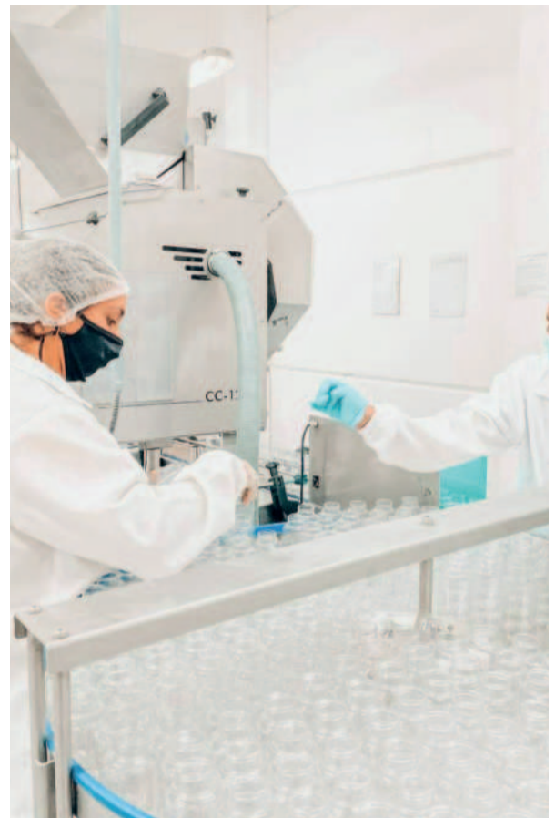
Empresa mantém alto investimento em Pesquisa e Desenvolvimento

Calheirana vai introduzir uma extensa lista de softwares, processos e produtos inovadores com o objetivo de diferenciar sua empresa ainda mais e fortalecer os relacionamentos com clientes, fornecedores e parceiros. "Estamos entusiasmados com a expansão do software de controladoria e compliance, que serão integrados para melhorar a segurança cibernética, promovendo uma gestão mais eficiente e segura das responsabilidades fiscais, jurídicas e de dados da empresa." Dentre as novidades, uma solução inovadora integrando os processos industriais, relatórios e tecnologias avançadas de linguagem de inteligência artificial (IA) por meio de uma BigTech.