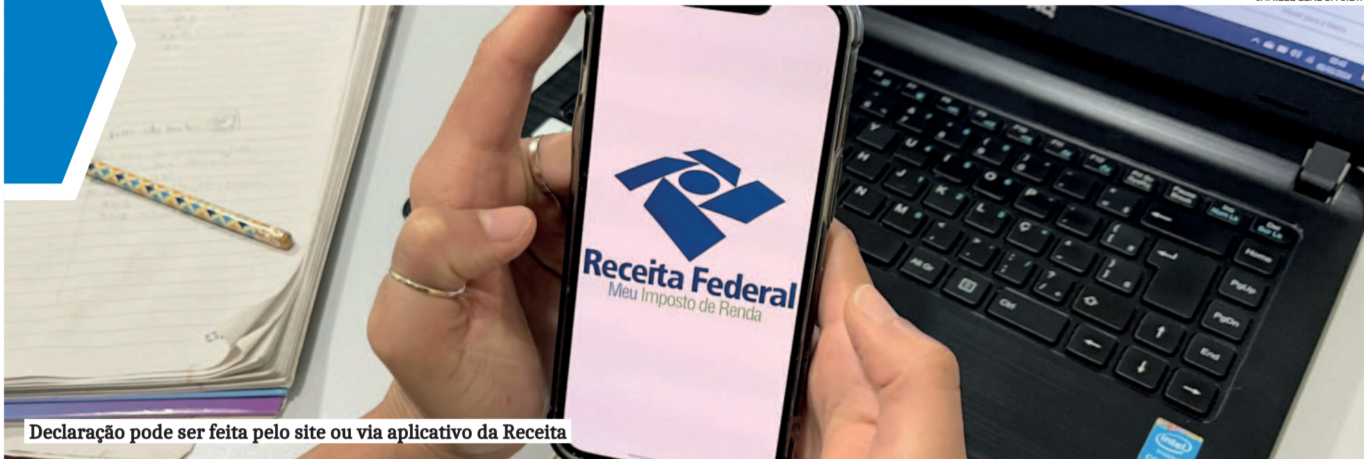
Declaração pode ser feita pelo site ou via aplicativo da Receita