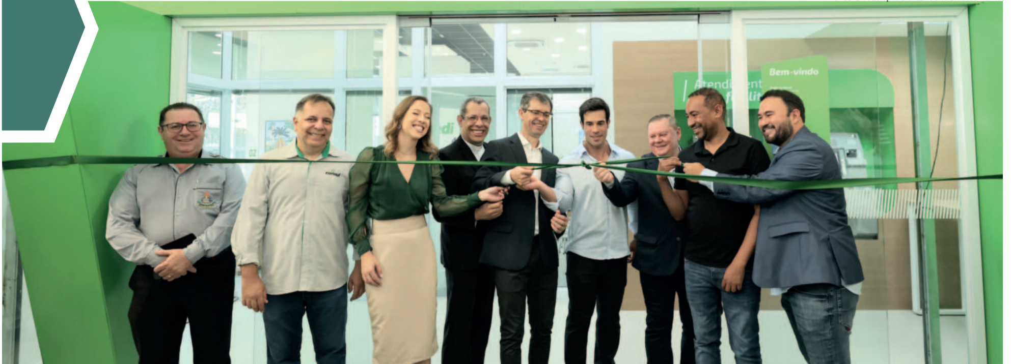
Sicredi inaugurou agência no Horto, em Ipatinga na quinta-feira (7/3)