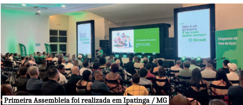
Primeira Assembleia foi realizada em Ipatinga / MG

A direção apresentou o desempenho da cooperativa em Minas Gerais na semana passada, durante a assembleia realizada em Teutônia/RS, sede da cooperativa. E há uma nova oportunidade, com outra região de 37 municípios e 384 mil habitantes. “O projeto foi aprovado [pela Central] e será levado para a assembleia de delegados, para avançar nesta área limítrofe em Minas Gerais”, salienta o presidente.