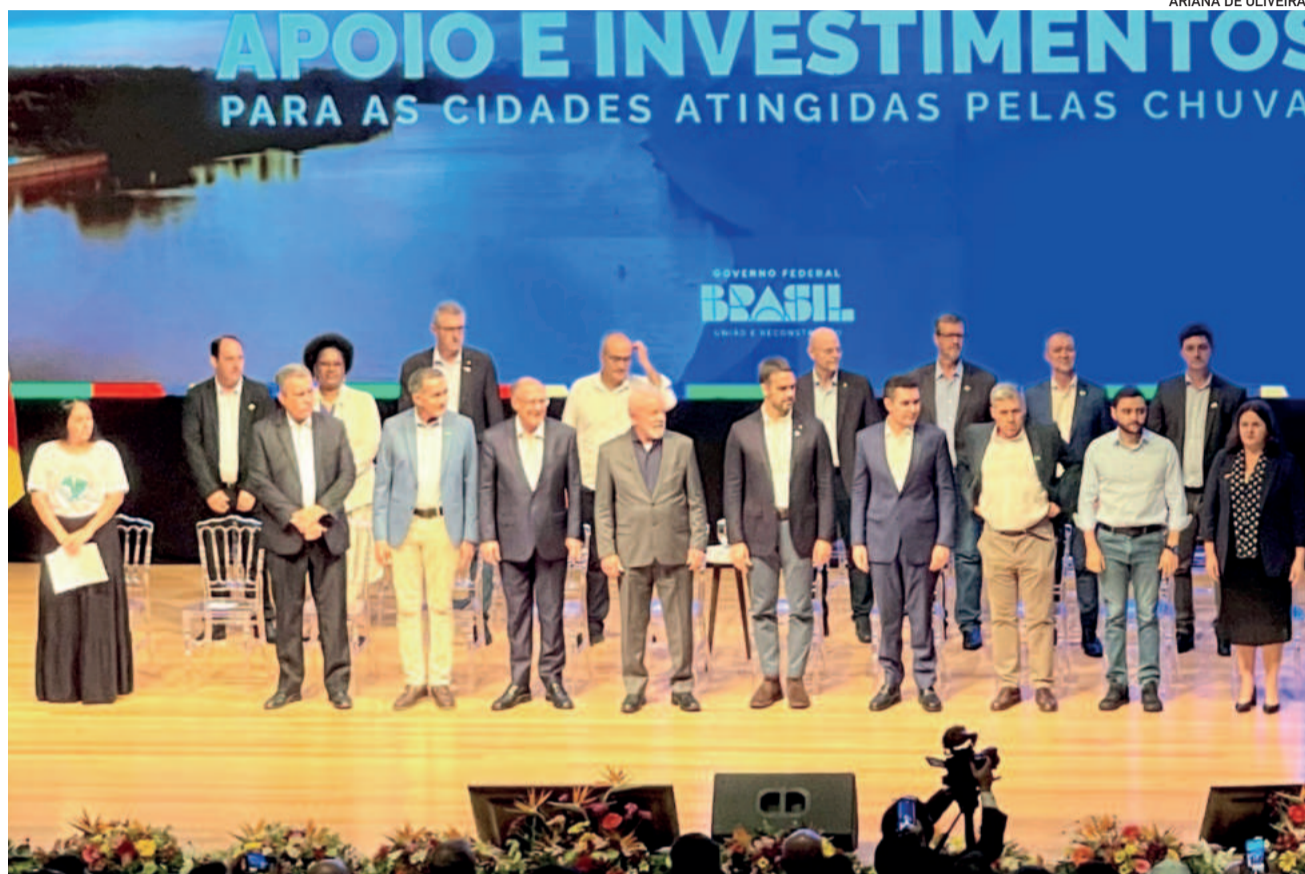
Comitiva presidencial esteve em Lajeado na tarde de ontem, no Teatro da Univates

Em pronunciamento breve, o presidente Lula cumprimenta o governador e prefeitos, reconhecendo o esforço coletivo. E diz: "A gente vê a beleza e a capacidade produtiva da região e como uma enchente levou tanta