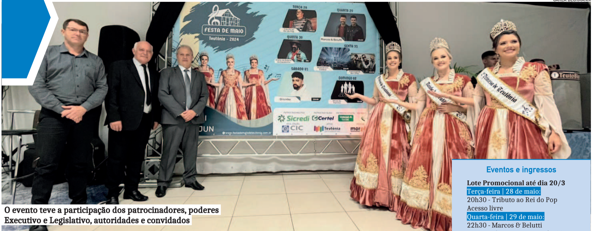
O evento teve a participação dos patrocinadores, poderes Executivo e Legislativo, autoridades e convidados