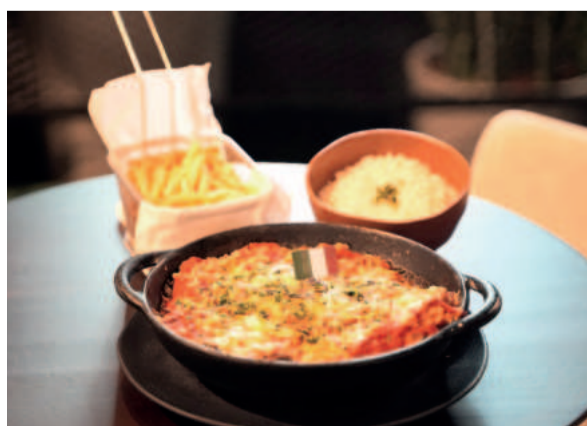
Pratos típicos homenageiam países pelo mundo