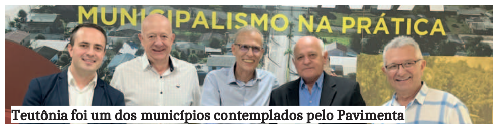
Teutônia foi um dos municípios contemplados pelo Pavimenta