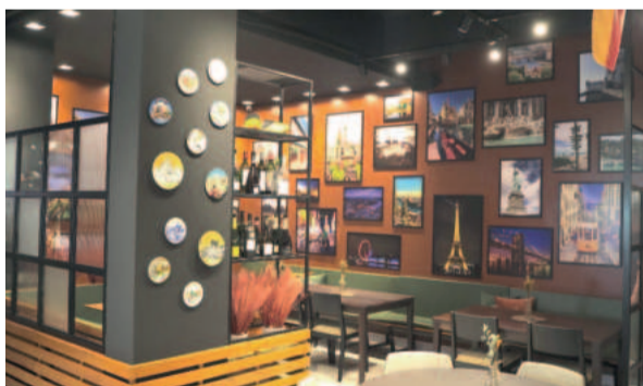
Decoração interna te leva a viajar no imaginário

O Folk Gastropub tem espaço confortável para todas as idades e momentos. Você pode almoçar, fazer seu happy hour e também jantar. A casa aceita reservas para confraternizações, reuniões e até mesmo encontro de amigos e familiares. É o local ideal para curtir bons momentos.