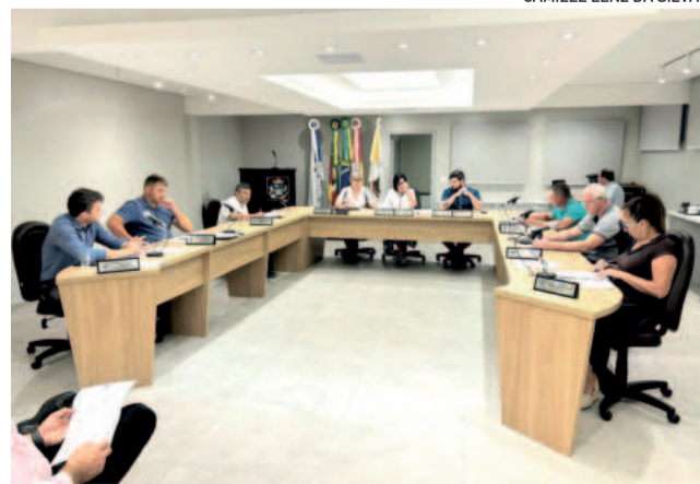
Oito projetos de Lei foram aprovados e um ficou baixado