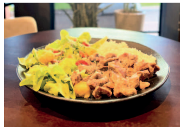
Almoço ao meio-dia é novidade com cardápios especiais