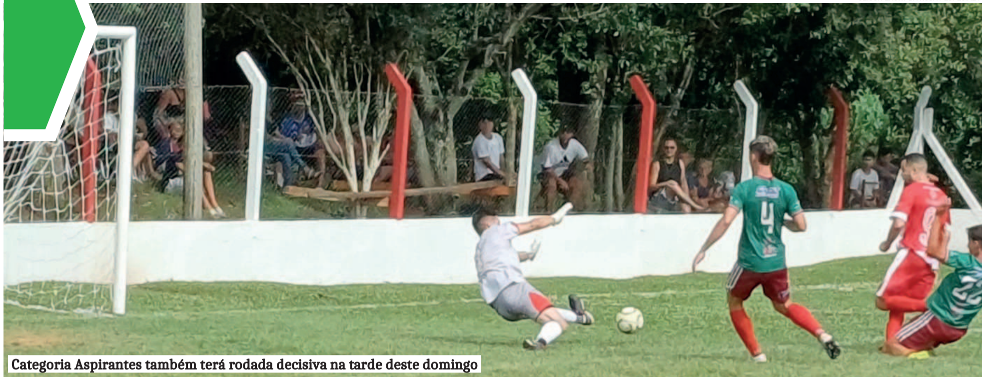
Categoria Aspirantes também terá rodada decisiva na tarde deste domingo