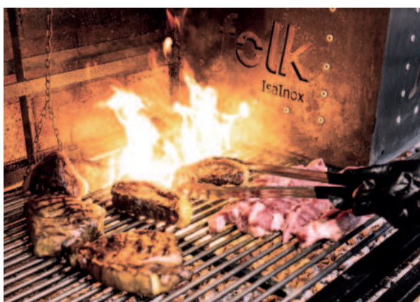
A grelha prepara carnes de qualidade para os pratos escolhidos