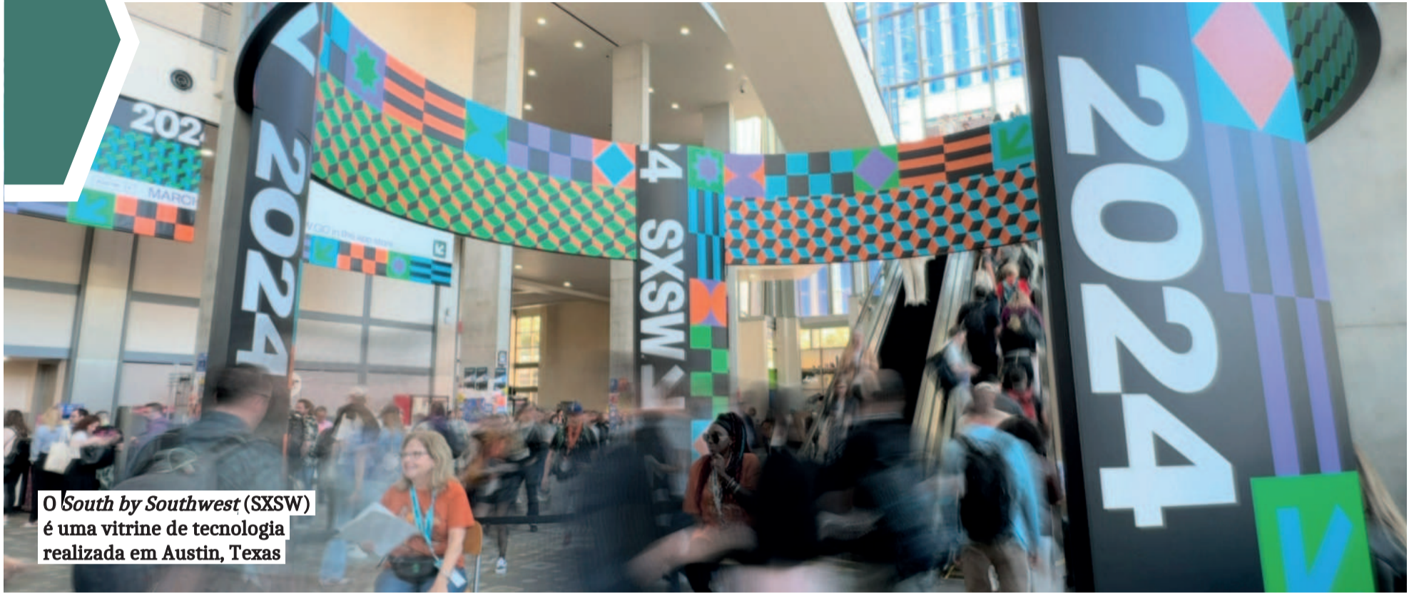
O South by Southwest (SXSW) é uma vitrine de tecnologia realizada em Austin, Texas