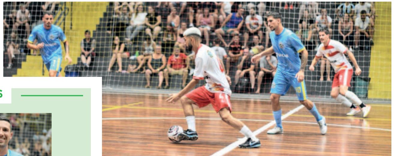
Imigrante (branco) perdeu em casa e caiu duas posições