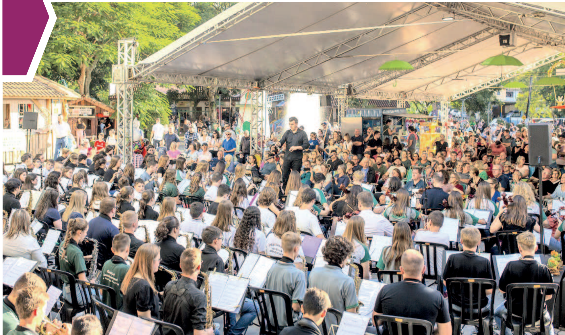
Em 2023, cerca de 200 músicos participaram da primeira edição