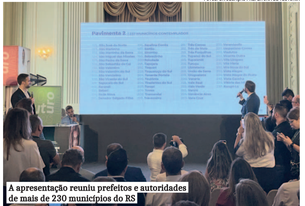
A apresentação reuniu prefeitos e autoridades de mais de 230 municípios do RS