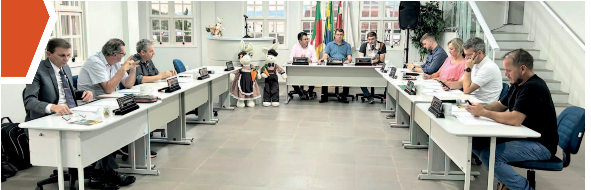
Vereadores aprovaram seis projetos de Lei de autoria do Executivo