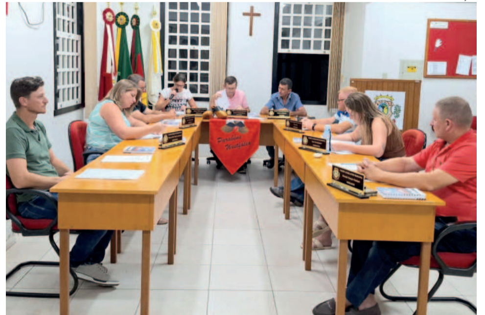
Sessão ocorreu excepcionalmente na terça-feira (12/3)