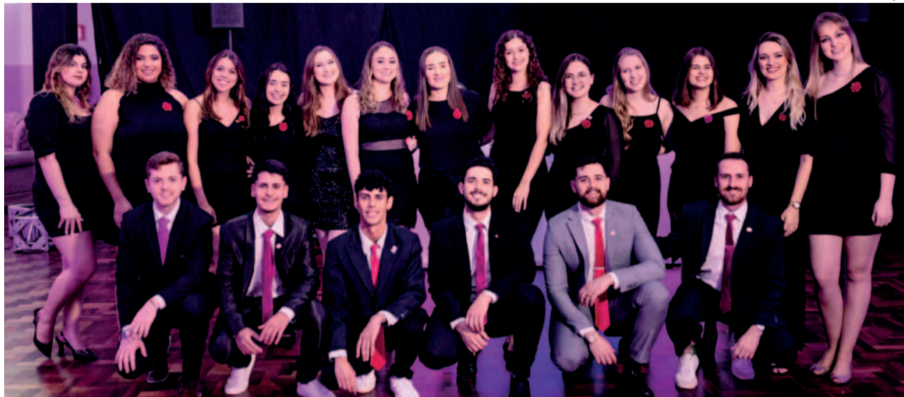
Grupo já realizou mais de 50 projetos envolvendo a comunidade

“A Codirc marca o encerramento de um ano rotário e o início de outro. Realizamos concursos de oratória e projetos. Os clubes e os voluntários recebem prêmios e reconhecimentos pelos seus trabalhos prestados ao longo do ano. Além de muita