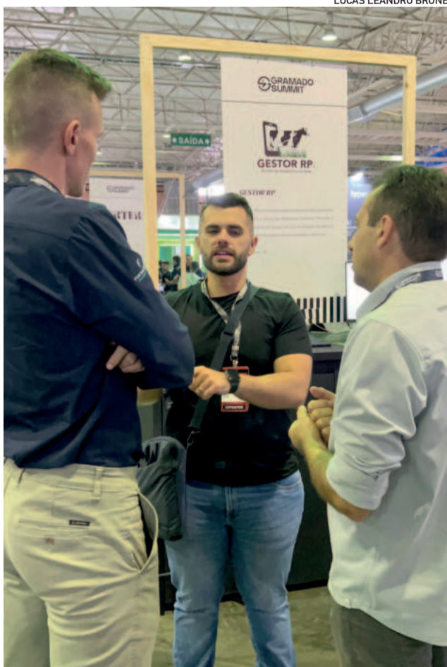
Gestor RP de Teutônia também expôs sua solução