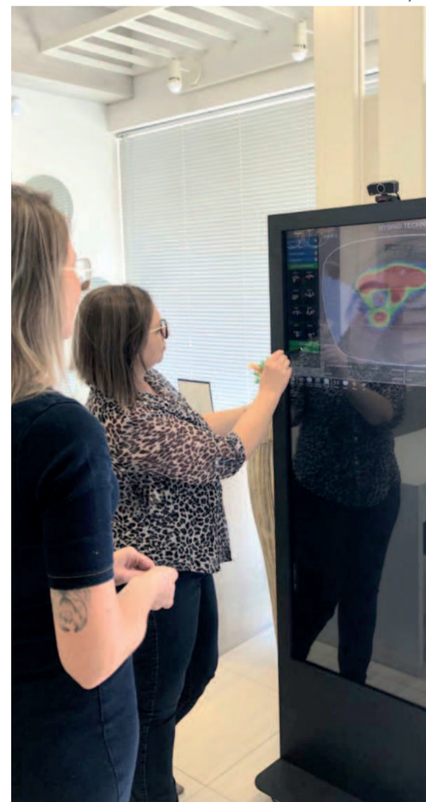
Clientes conheceram a nova forma de escolha da lente multifocal