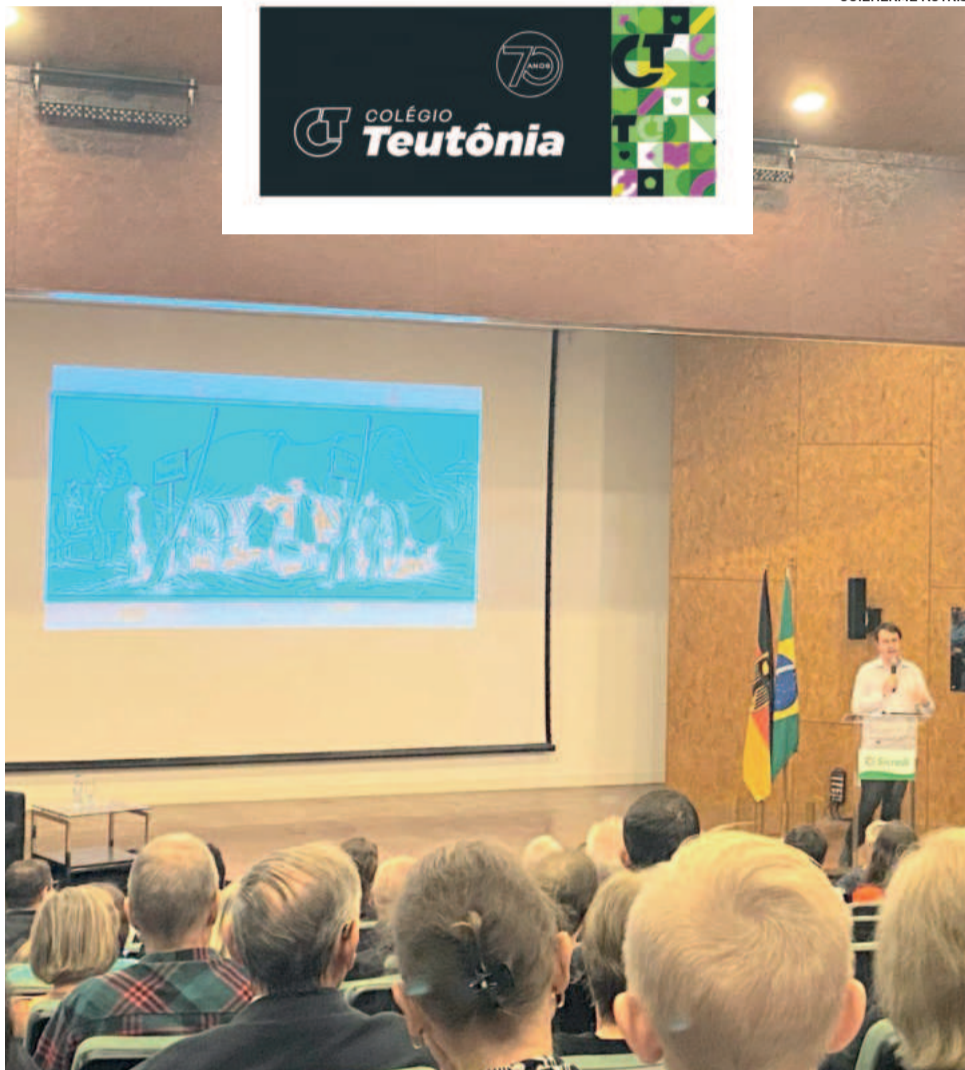
Palestra dos 200 anos de Imigração alemã