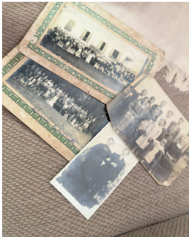
Recordações em fotos