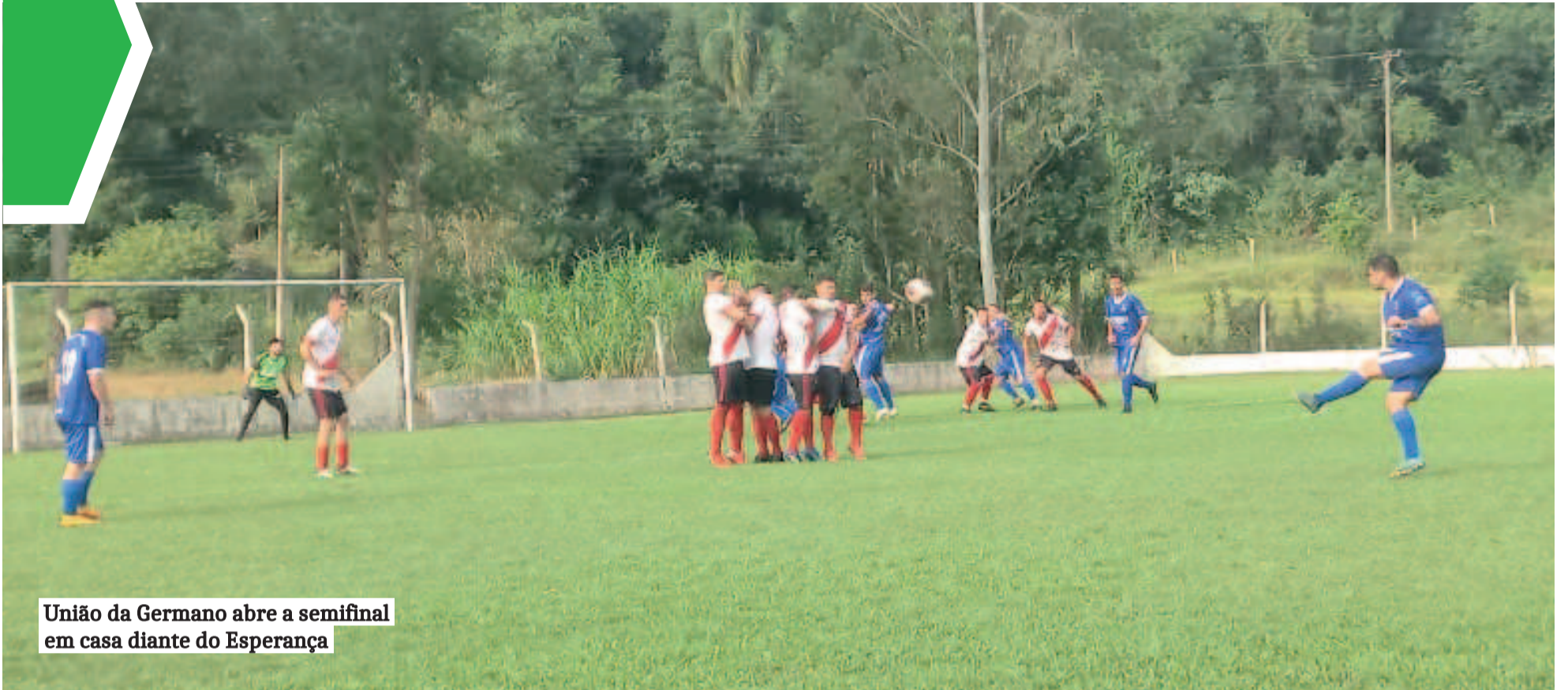
União da Germano abre a semifinal em casa diante do Esperança

REGIÃO ► INTERMUNICIPAL SICREDI DE FUTEBOL AMADOR