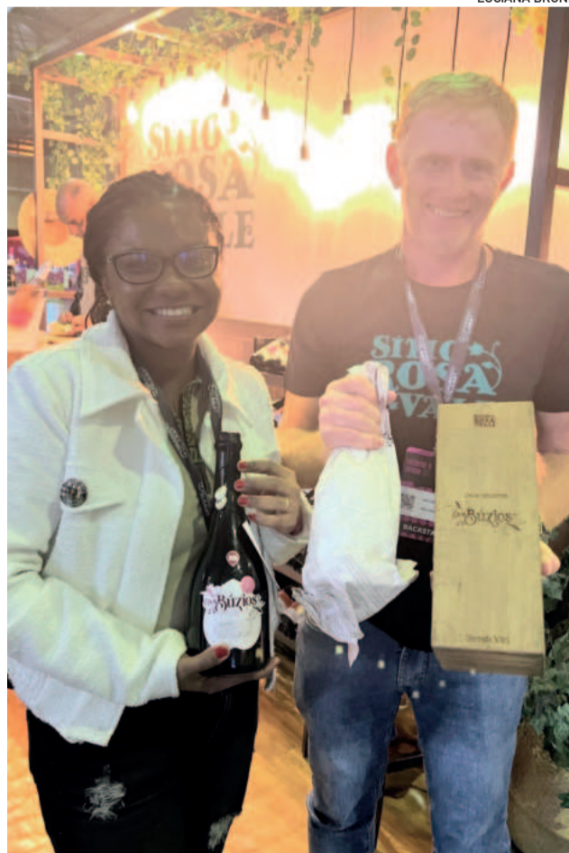
Sítio Rosa dos Vales foi a vinícola oficial do evento