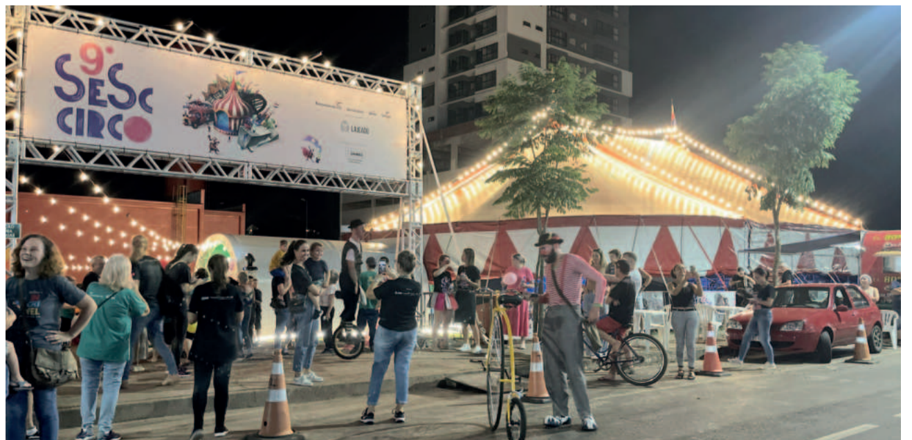
Lona Sesc Circo Av. Pirai

O cortejo de abertura seguiu até a Lona Sesc Circo para a abertura da programação que segue até este domingo (14/4). Pela primeira vez no município de Lajeado, o evento contará com 20 espetáculos, em um total de 31 sessões disponibilizadas gratuitamente para a comunidade. Conta com o talento de artistas de várias partes do Estado, do País e do exterior, referências na área. A programação é realizada na Lona Sesc Circo, instalada na Avenida Pirai, além de ginásios de escolas de diferentes bairros lajeadenses.