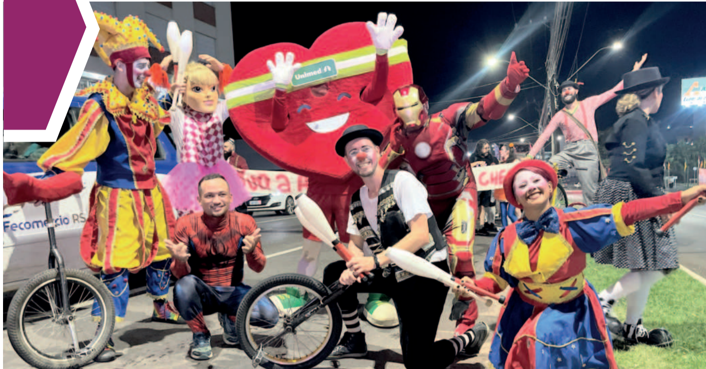
Cortejo pelo centro de Lajeado