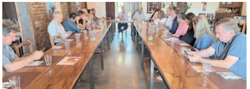
Representantes dos 7 municípios se reuniram pela primeira vez em 2024