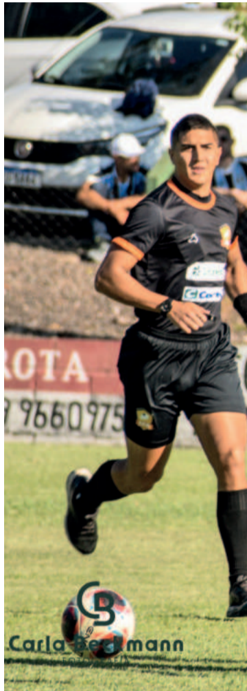
Canabarense e Juventude da Berlim fizeram a final do ano passado. Neste ano apenas um dos clubes ficará com uma das vagas da decisão