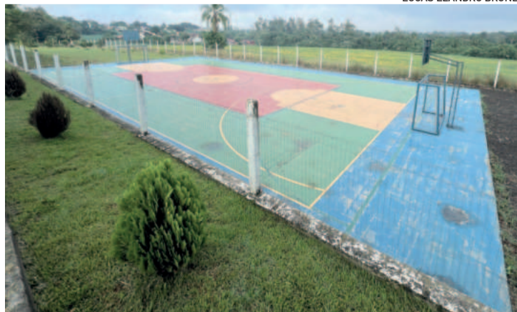
Quadra de esportes está disponível no novo espaço