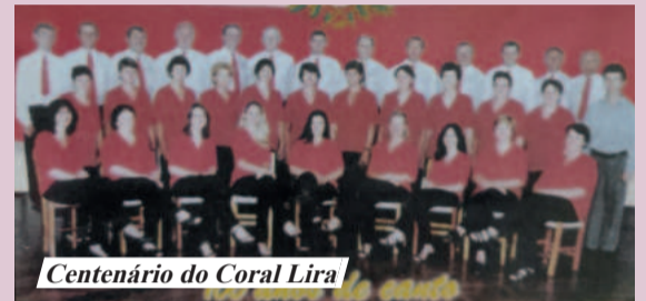
Centenário do Coral Lira