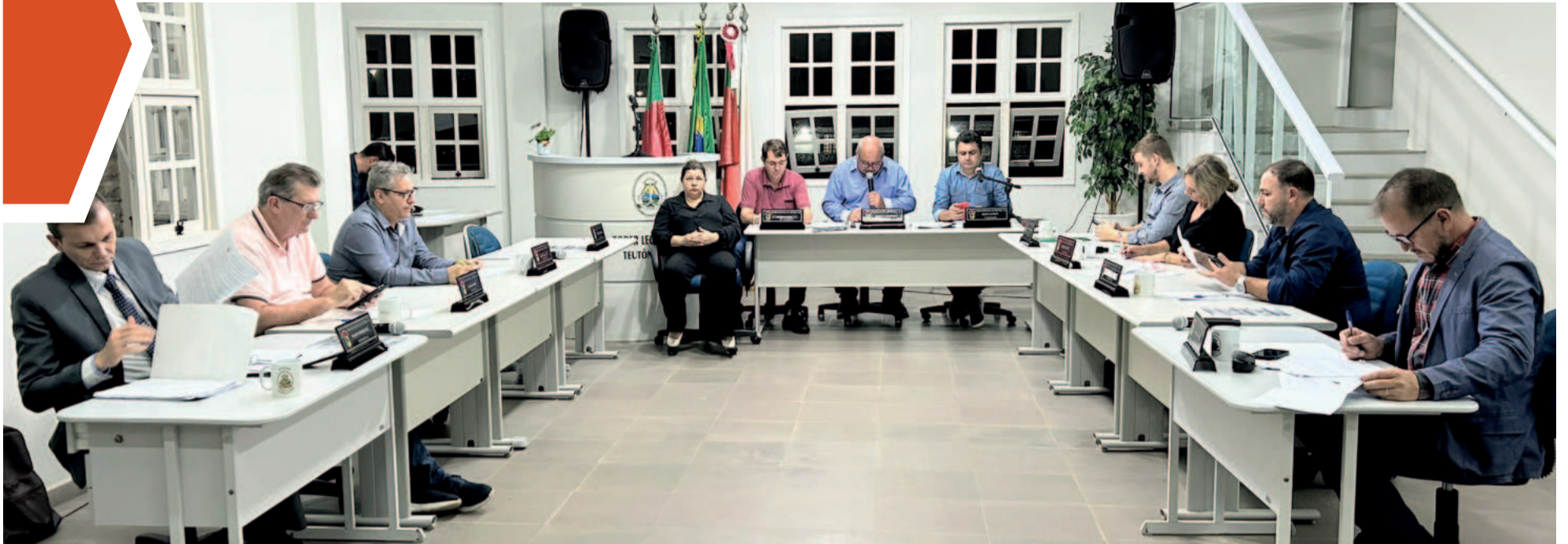
Vereadores trouxeram à pauta temas diversos