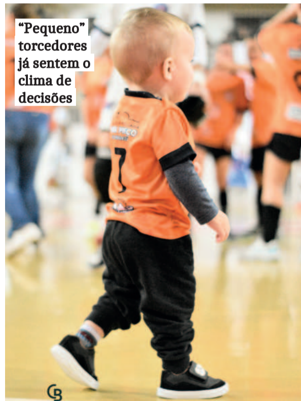
"Pequeno" torcedores já sentem o clima de decisões