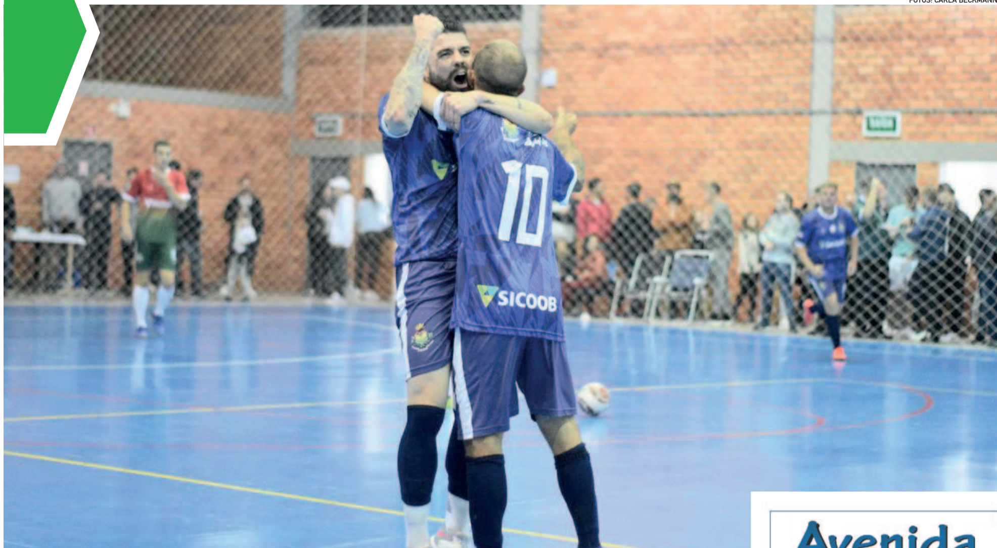
Barão vibrou nas duas vitórias da noite: tempo normal e pênaltis. A seleção busca o bicampeonato