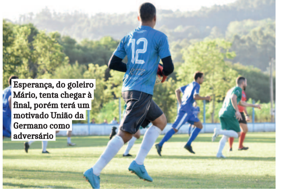
Esperança, do goleiro Mário, tenta chegar à final, porém terá um motivado União da Germano como adversário

No Bairro Canabarro, o Canabarense reedita a final com o Juventude da Berlim na categoria Titulares. Em Linha Germano, União e Esperança também se encontram em jogo eliminatório; e nos Aspirantes, os dois clubes fizeram a final do ano passado. Quem somar 4 pontos – uma vitória e um empate – assegura presença na final. Caso ocorra uma vitória de cada clube ou dois empates, a vaga será decidida nos pênaltis.