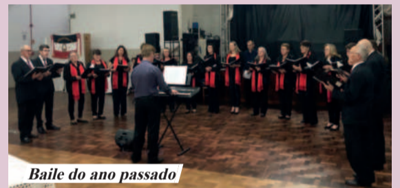
Baile do ano passado