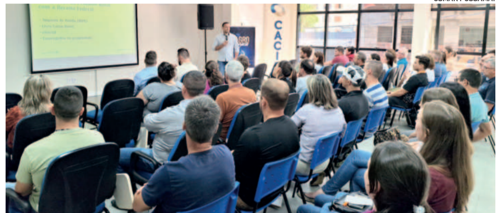
Auditório da Cacis foi preenchido por produtores

O livro-caixa é uma ferramenta contábil essencial para o produtor rural. Ele registra todas as entradas e saídas de dinheiro relacionadas à atividade agrícola. Man-