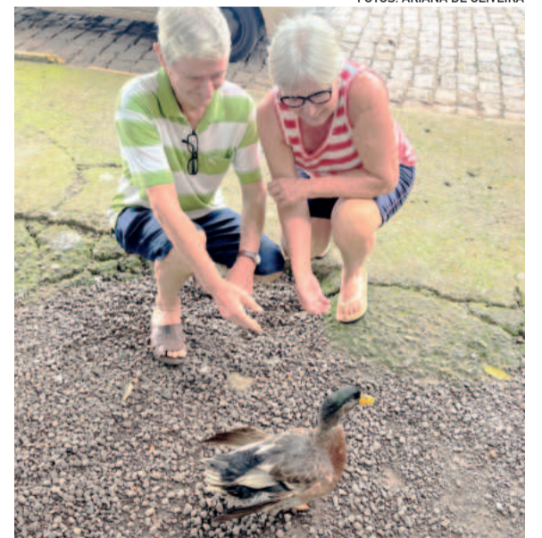
Casal Jora tem no “filho” pato uma companhia diária