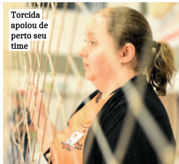
Torcida apoiou de perto seu time