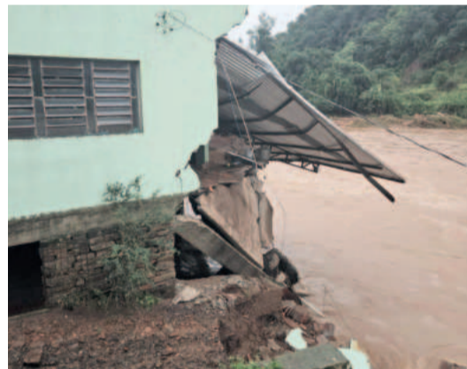
Sede social do Minuano de Canudos do Vale