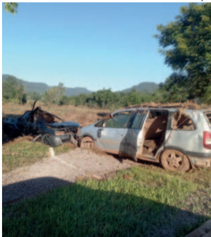
Montana e Zafira foram localizadas