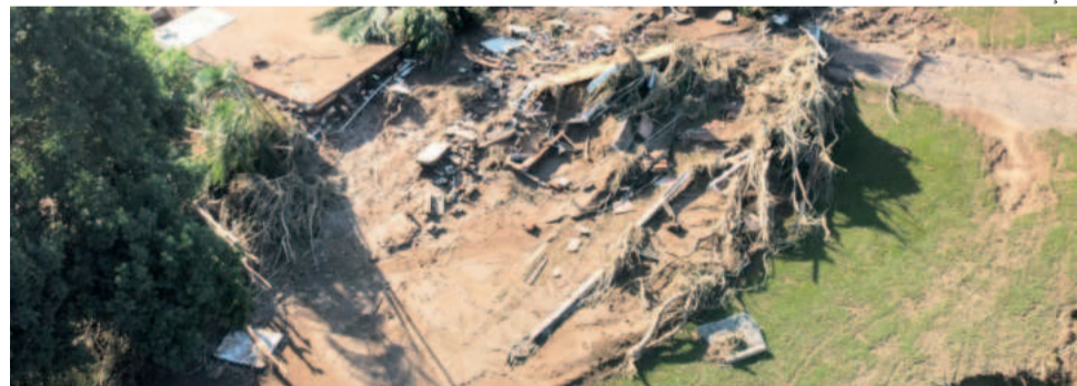
Destrução do Camping da Pedra soma prejuízo de R$ 2 milhões