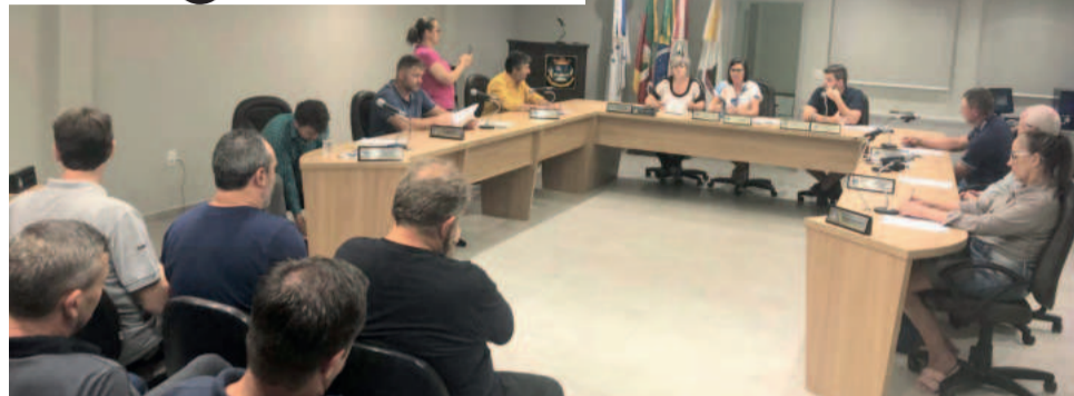
Sessão teve presença de prefeito, vice e secretários

Na ordem do dia, aprovado por unanimidade o projeto de Lei nº 030/2024, que autoriza a prorrogar contrato temporário de psicólogo até 6 de maio de 2025.