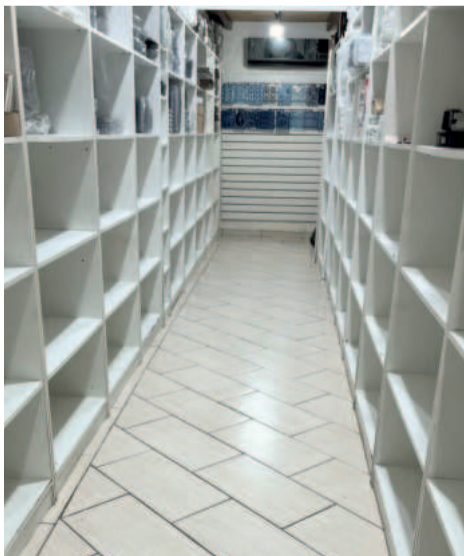
Registro das prateleiras durante a retirada de parte das mercadorias