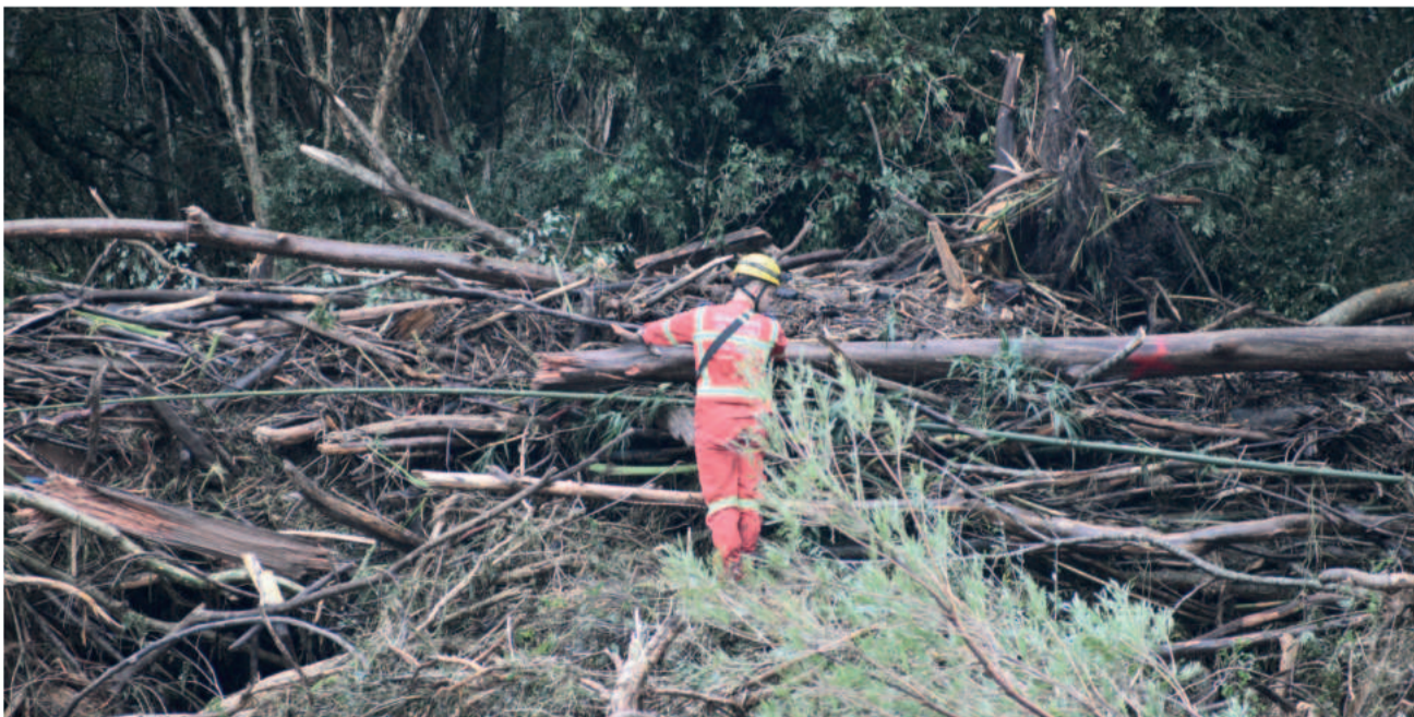
BVT segue nas buscas com reforço dos Bombeiros Militares de Estrela e cães farejadores