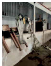
Como se encontra a sede social do Arroio do Ouro