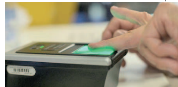
Biometria confere mais segurança na identificação dos eleitores