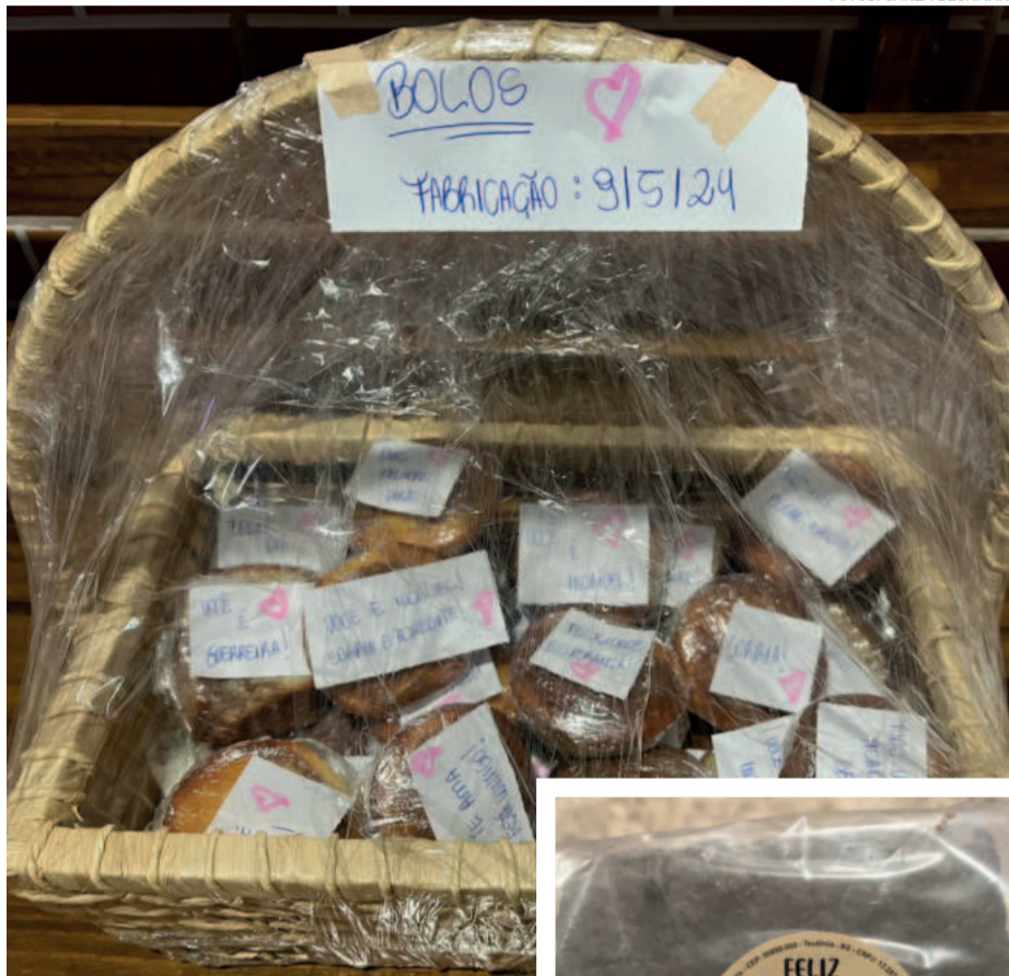
Bolos com mensagens para o dia das mães

Uma ideia foi alimentando outras e elas decidiram envolver os próprios filhos para fazer cartões para estas mães. Ao compartilhar com os amigos, a rede foi aumentando e também surgiu a ideia de envolver as escolas. Já são mais de 450 cartões confeccionados pelas crianças.