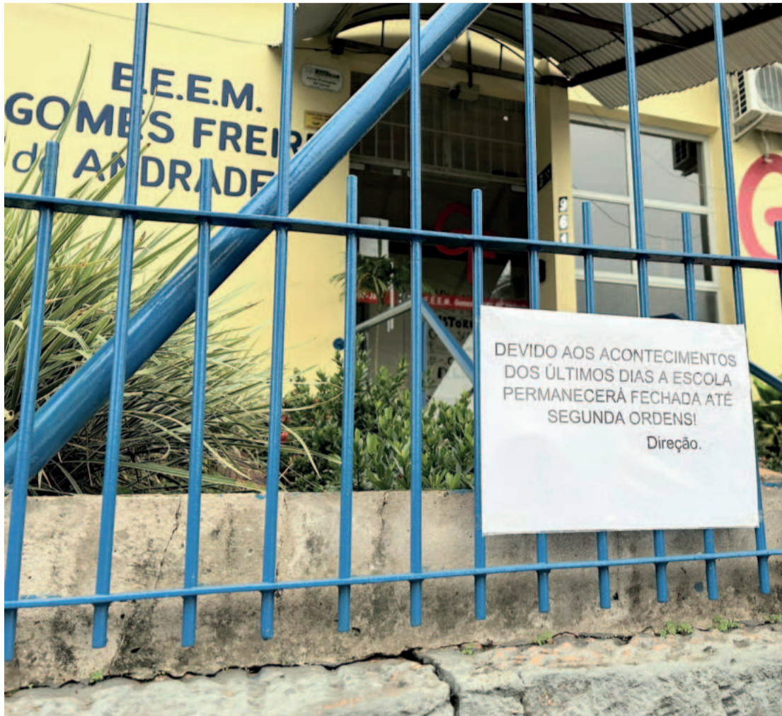
Escola Estadual Gomes Freire de Andrade permanece fechada por tempo indeterminado