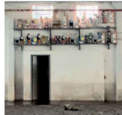
Estante de troféus do Arroio do Ouro é uma das únicas coisas que restaram após a enchente