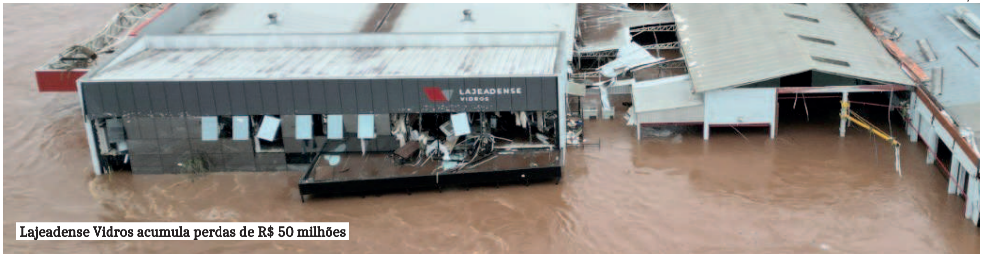
Lajeadense Vidros acumula perdas de R$ 50 milhões

REGIÃO ► COMO SEGUIR DIANTE DO CENÁRIO INSTÁVEL?