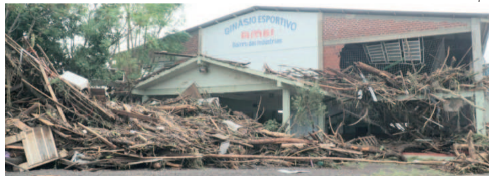
Ginásio Esportivo da AMBI no Bairro das Indústrias