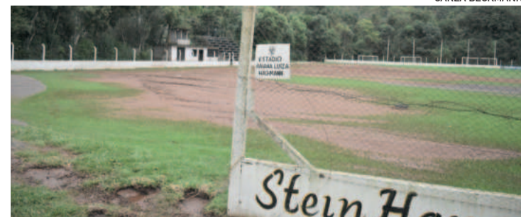
Estádio Raiana Luiza Hackmann (Ecas)