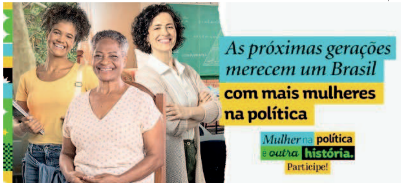
Campanha do TSE quer incentivar mulheres a concorrerem na eleição de 2024