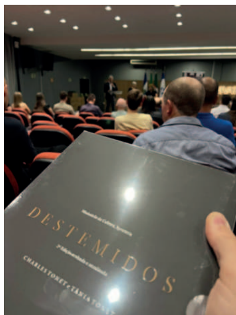
Segunda edição do livro estará disponível em bibliotecas pela região