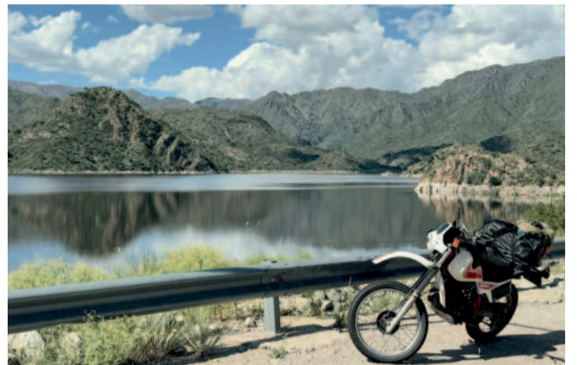
Paisagens exuberantes no trajeto percorrido