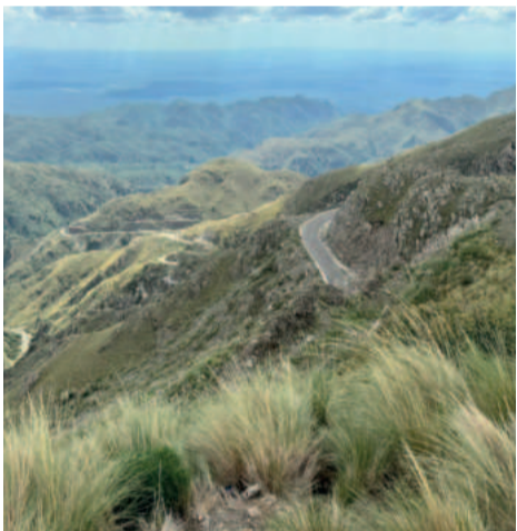
Maravilhosa e linda cadeia de montanhas do circuito Los Caracoles