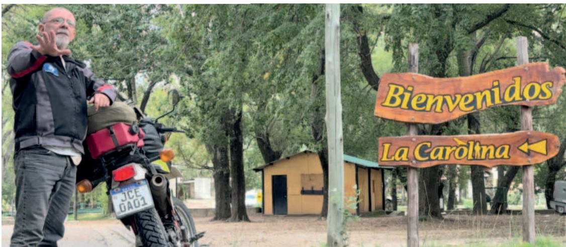
Município de La Carolina

O Governo do Estado do Rio Grande do Sul, por meio do Gabinete de Apoio ao Empreendedor em parceria com o Serviço Brasileiro de Apoio às Micro e Pequenas Empresas, Sebrae, lançaram a iniciativa SOS Juntos Pelo RS. A Associação dos Municípios de Turismo da Região dos Vales, Amturvaes, é apoiadora desta iniciativa. O objetivo é fazer acontecer a reconstrução do RS e dos negócios locais. A ação visa realizar um levantamento de dados e informações sobre os empreendimentos afetados pela tragédia no RS, para que o auxílio seja direcionado da melhor forma possível. Para isso, basta acessar o link ou escanear o Qr-code acima e participar da pesquisa de Avaliação do Impacto das Enchentes nos Negócios do RS. Acesse e participe da Pesquisa https://bit.ly/juntospelors .