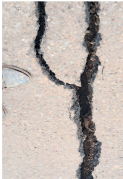
Linha Harmonia, em Teutônia, tem mais de 65 famílias notificadas