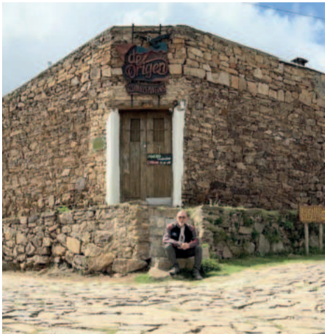
Muitas construções antigas são preservadas