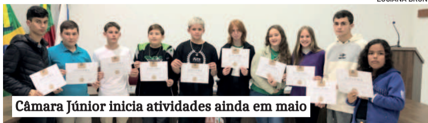
Câmara Júnior inicia atividades ainda em maio