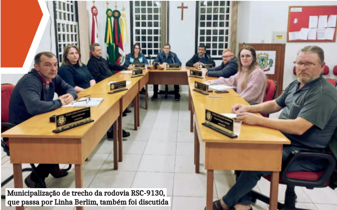
Municipalização de trecho da rodovia RSC-9130, que passa por Linha Berlim, também foi discutida