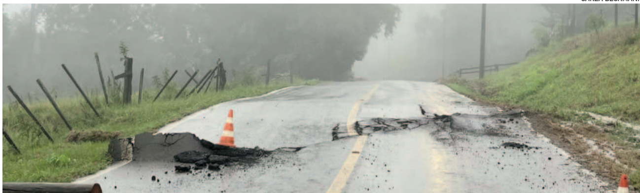
Linha Paissandu, em Westfália, com interdição por conta de rachaduras no asfalto e risco de deslizamento