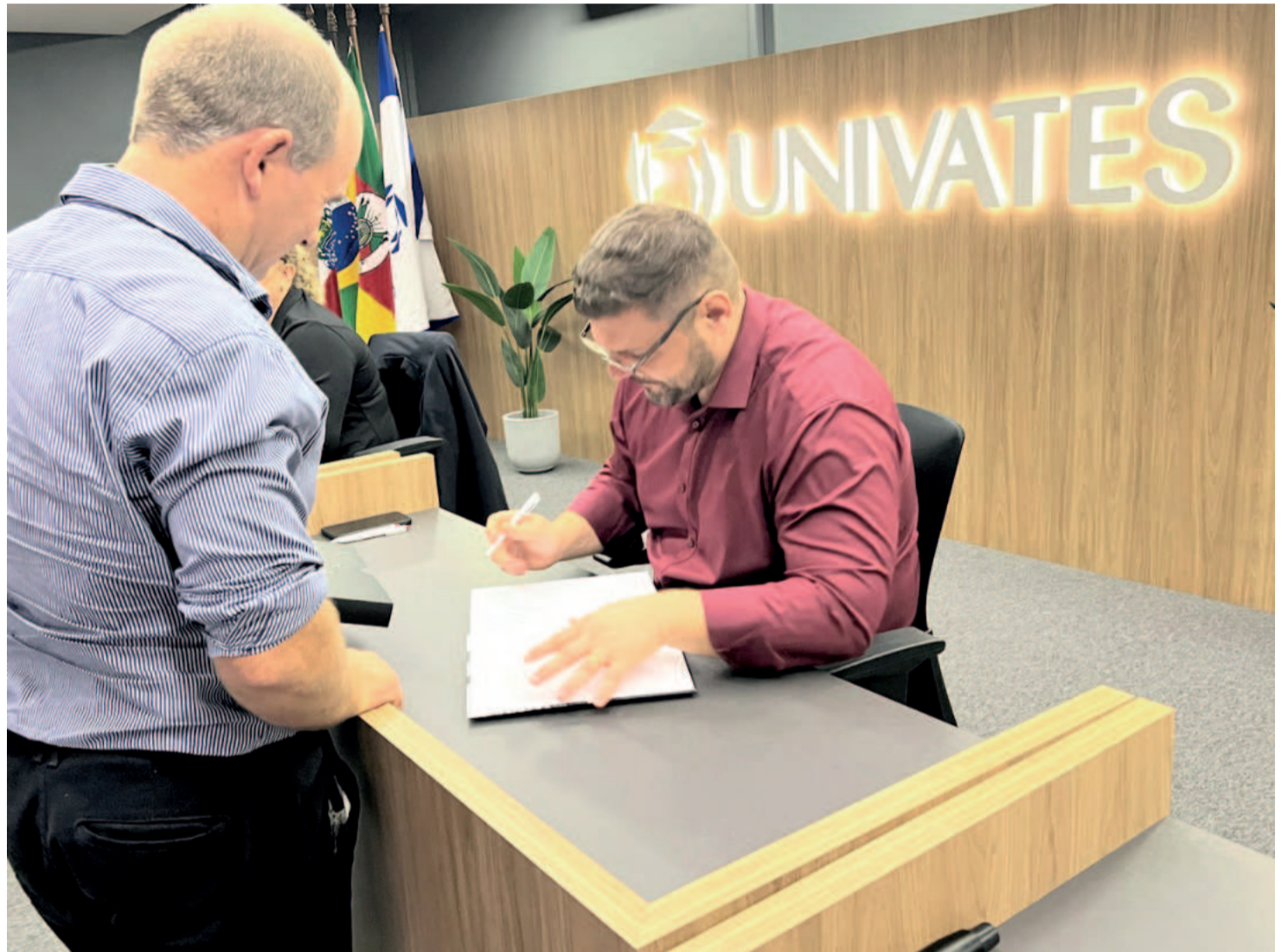
Autor autografou livros distribuídos durante o evento de lançamento na Univates

O título do livro também inspira para o atual momento, após novas enchentes que afetaram os sistemas produtivos da Dália. O destemor dos pioneiros servirá de farol para a retomada.