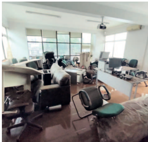
Eletrônicos e mobiliário no segundo piso foram afetados