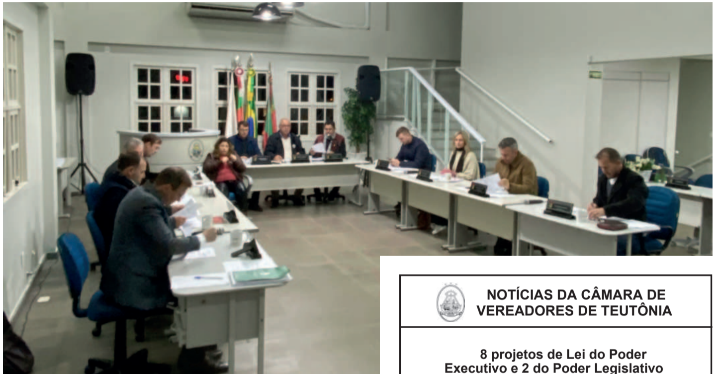
Sessão debateu ainda isenção de IPTU e conta de água a afetados pelas cheias