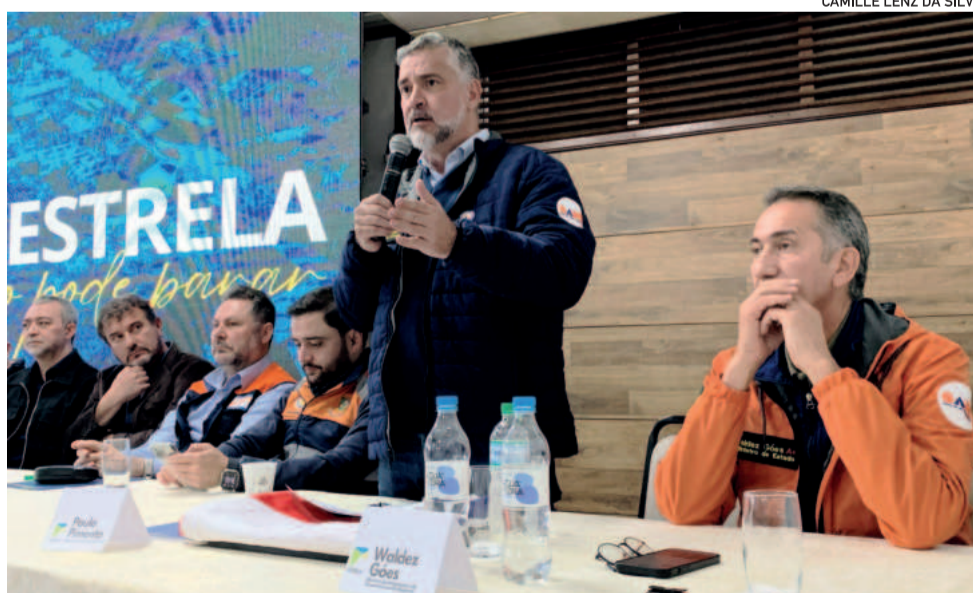
Ministros estiveram junto a prefeitos e ao vice-governador do Estado