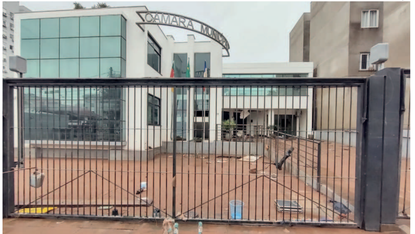
Sede, localizada no Centro, ficou embaixo d'água