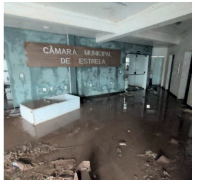
Primeiro andar, onde fica o plenário, ficou totalmente submerso