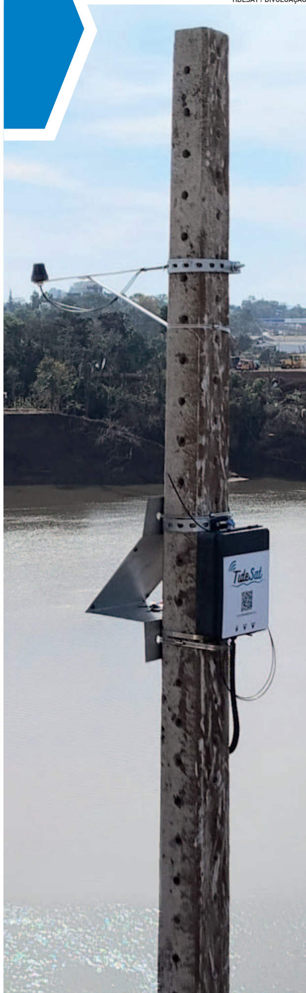
Régua digital instalada no Porto de Estrela é simples e economicamente viável