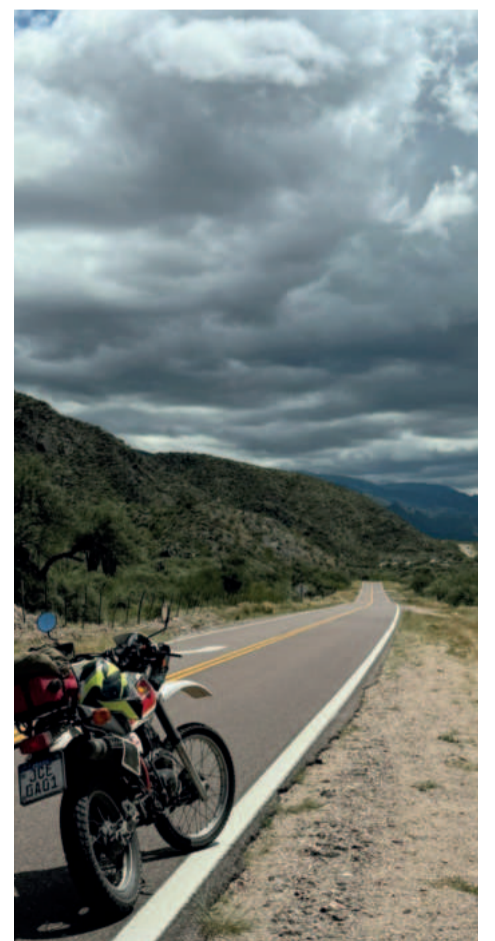
Rotas nacionais interligam diferentes regiões argentinas

Não sou um amante do vinho, mas também sei que não posso deixar de conhecer algumas vinícolas já que estou no meio delas. Sempre que passo por lá escolho uma e visito, provo um vinho e formo minha opinião. Desta vez não foi diferente: peguei a Vovozinha e rodei de um lado para o outro na missão de conhecer vinícolas e tirar fotos da viagem. Dia excelente.