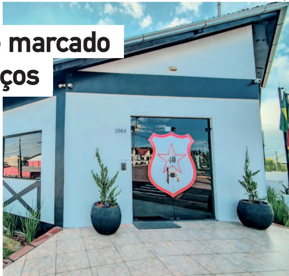
Sede foi transferida para Teutônia em 2023

O tenente-coronel comemora a possibilidade de construir um novo quartel para Estrela, além da inauguração do serviço de videomonitoramento em Fazenda Vilanova, realizado na sexta-feira passada (14/6). “Por se tratar de um local de grande circulação, é um ponto estratégico não só para a segurança do Vale do Taquari, mas do estado como um todo. Quem cometeu delitos, até mesmo em outras localidades, pode acabar sendo descoberto e monitorado”, aponta.