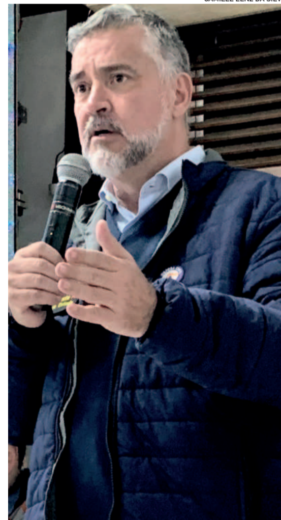
Ministério é chefiado por Paulo Pimenta