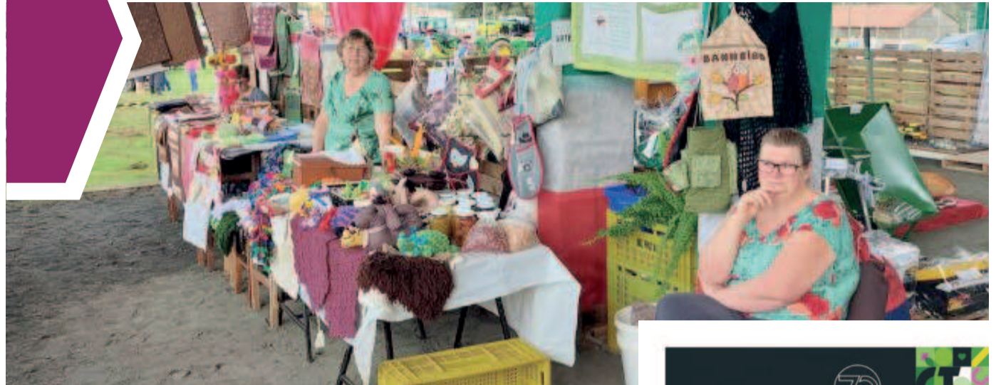
Serão 5 dias de programação envolvendo gastronomia e atrações musicais