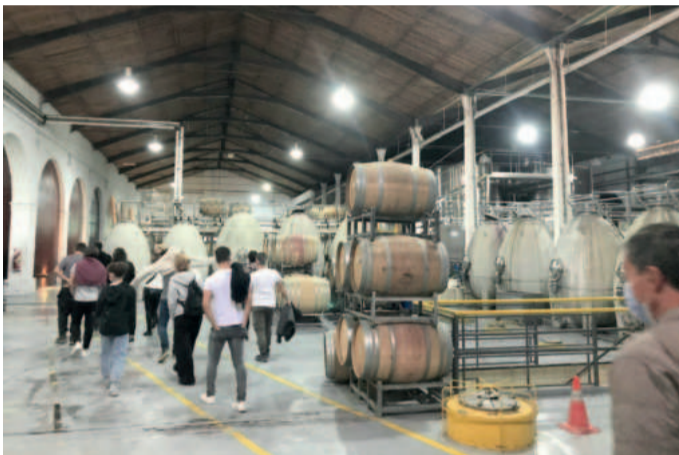
Visita à vinícola permite conhecer estes segredos de Cafayate