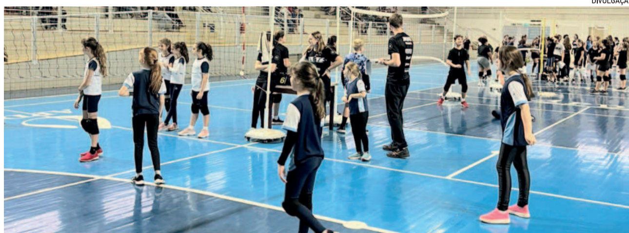
Cerca de 300 atletas participaram do evento beneficente

A solidariedade também se fez presente no evento, e o público que prestigiou os jogos contribuiu com a doação de itens de higiene pessoal e materiais escolares como ingresso. Foram arrecadados muitos donativos, que serão destinados nos próximos dias.