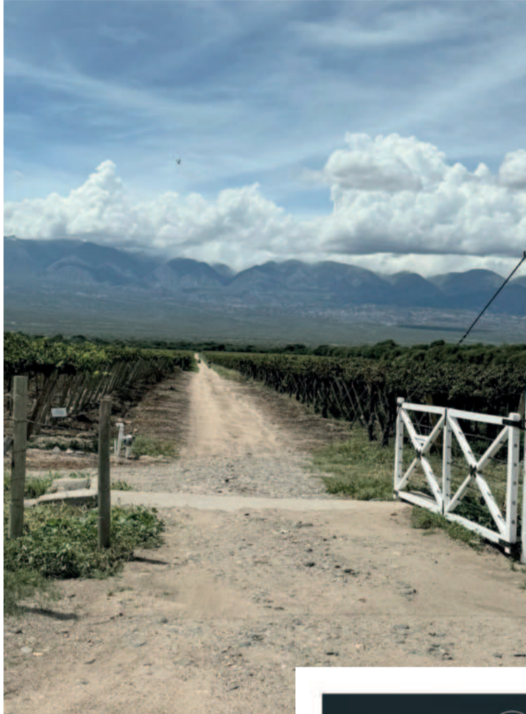
Parreirais contrastam com as paisagens desérticas