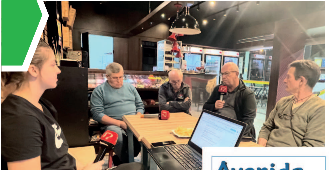
Terceiro Tempo e Confraria Brune foram apresentados direto do Posto Brune