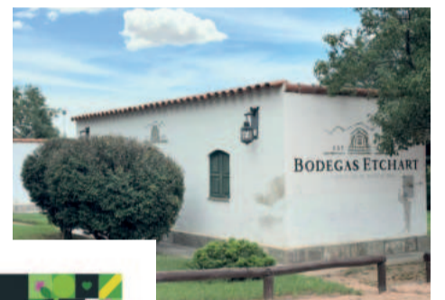
Muitas vinícolas ficam na região e escondem belas histórias e saborosos vinhos