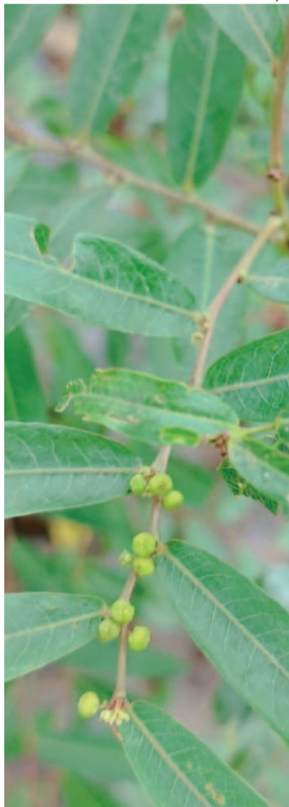
Mata-olho ( Pouteria salicifolia ) é uma das alternativas no restauro das margens