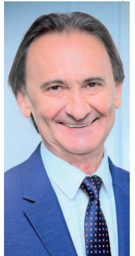
Juvir Costella, secretário de Logística e Transportes

do tamanho da responsabilidade de estar no governo. Seria mais fácil ficar na Assembleia Legislativa do que no governo. Meu desafio é contribuir com o povo", comenta.