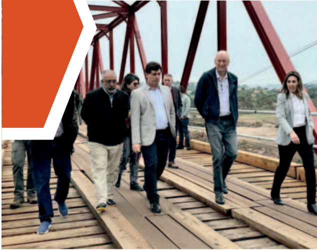
Em Lajeado, comissão do Senado foi até a ponte de ferro e o Parque Ney Santos Arruda