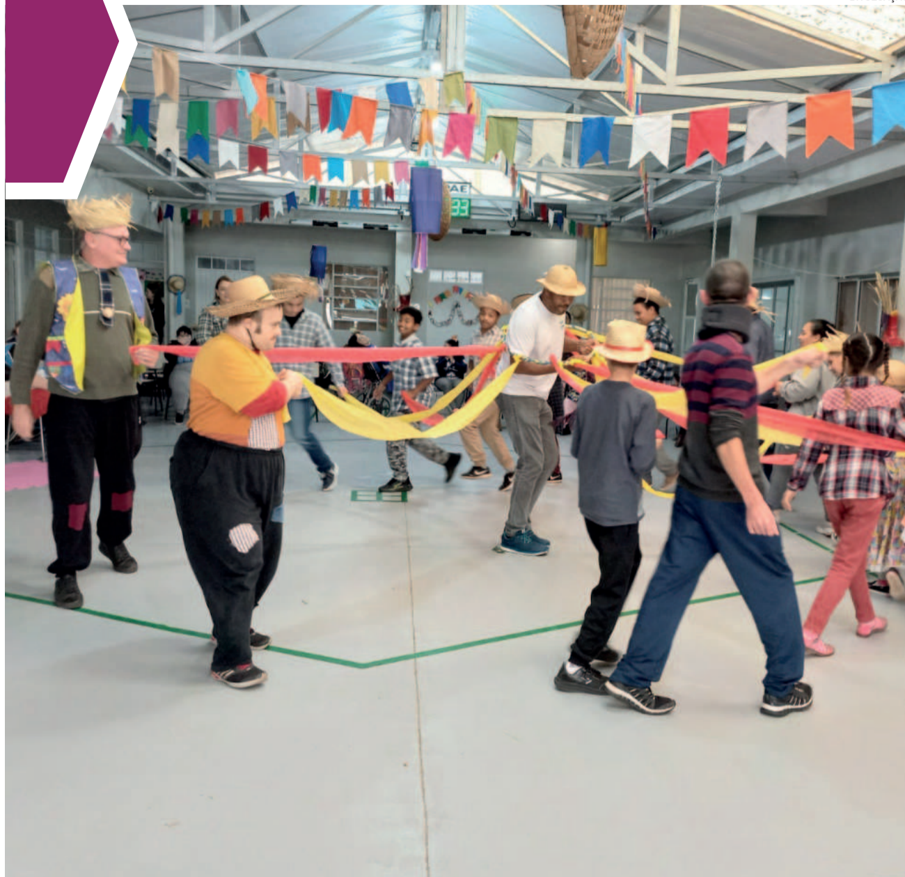
Celebração entre os alunos faz parte do calendário escolar