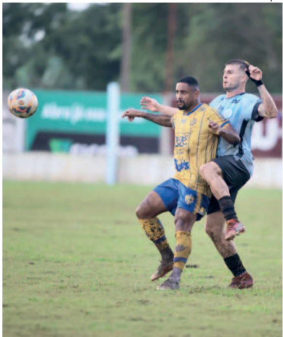
Elenco lajeadense venceu em casa por 2 a 1