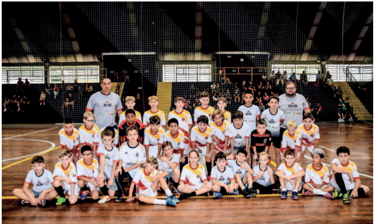
Escolinha de Imigrante

2017 - Imigrante 6x2 Teutônia 2016 - Imigrante 2x6 Teutônia 2015 - Imigrante 3x2 Teutônia 2014 - Imigrante 3x3 Teutônia 2013 - Imigrante 2x3 Teutônia 2012 - Imigrante 1x6 Teutônia 2011/2010 - Imigrante 4x2 Teutônia