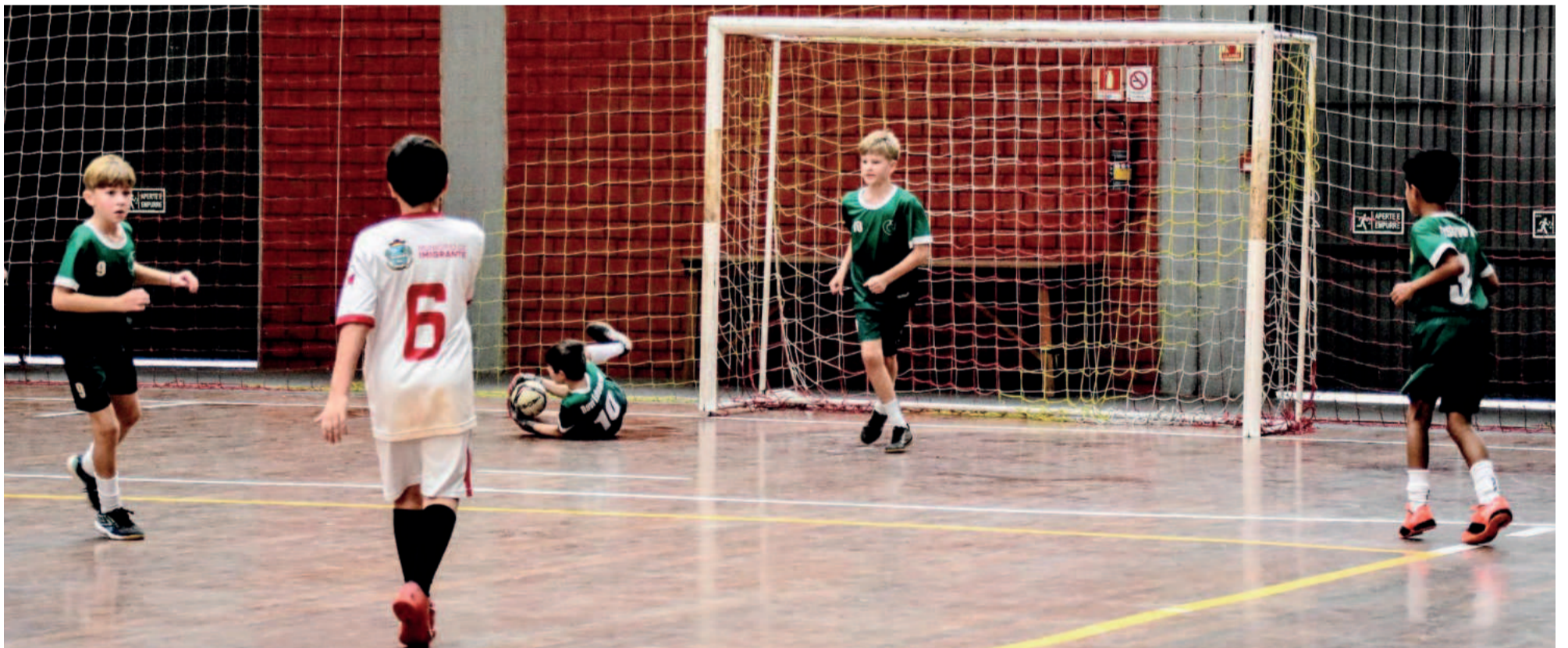
Segunda etapa da competição foi sediada e Imigrante