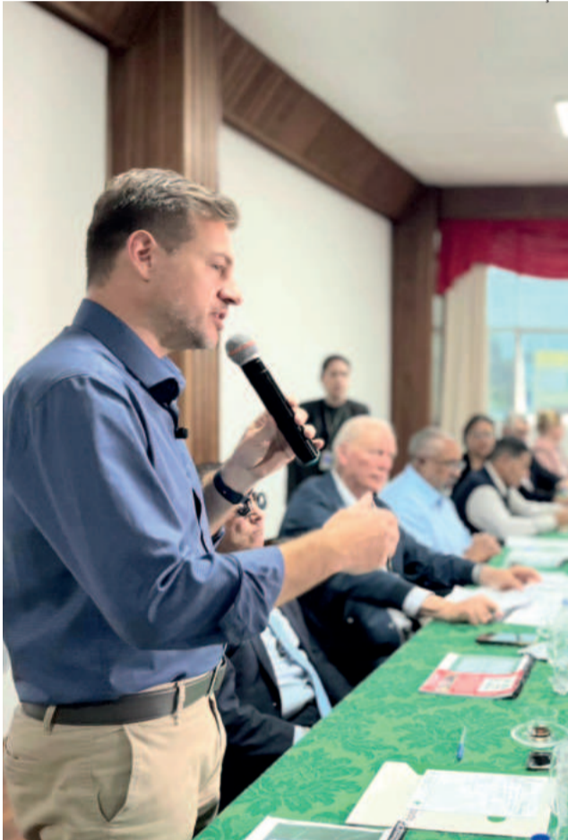
Visita culminou com audiência pública em Encantado. Prefeito pediu olhar atento à classe produtiva