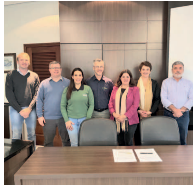
Representantes da Univates e do Colégio Teutônia formalizaram a cooperação na quarta-feira (19/6)