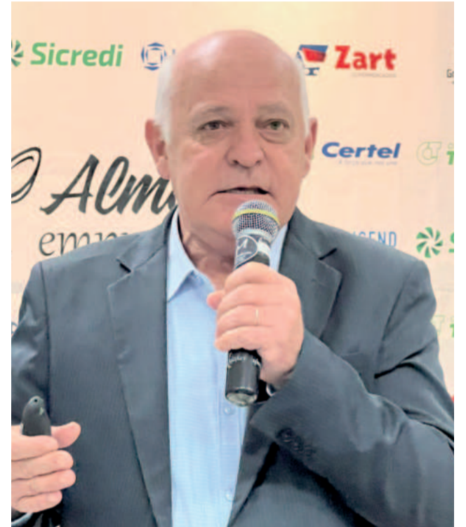
Forneck pede trabalho conjunto para construir novas oportunidades