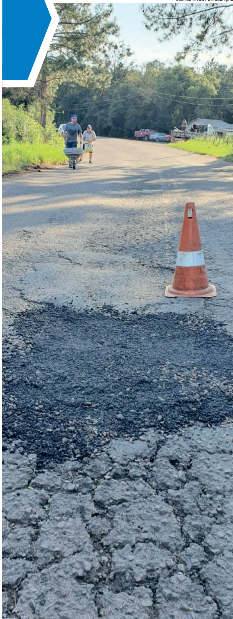
Voluntários realizaram a operação no sábado passado (22/6)

Os municípios da região, no entanto, não esquecem que os reiterados pedidos de solução para a situação da via são anteriores às enchentes, bem como a promessa de R$ 3 milhões em investimentos anunciada em 2021, que até hoje não se cumpriu.