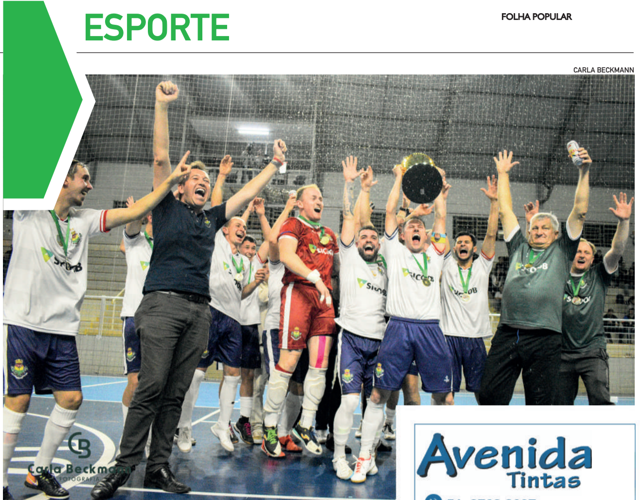
Barão conquistou a dobradinha em 2024