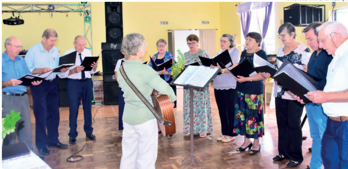
Coral Concórdia será o gestor dos recursos para as entidades de canto coral