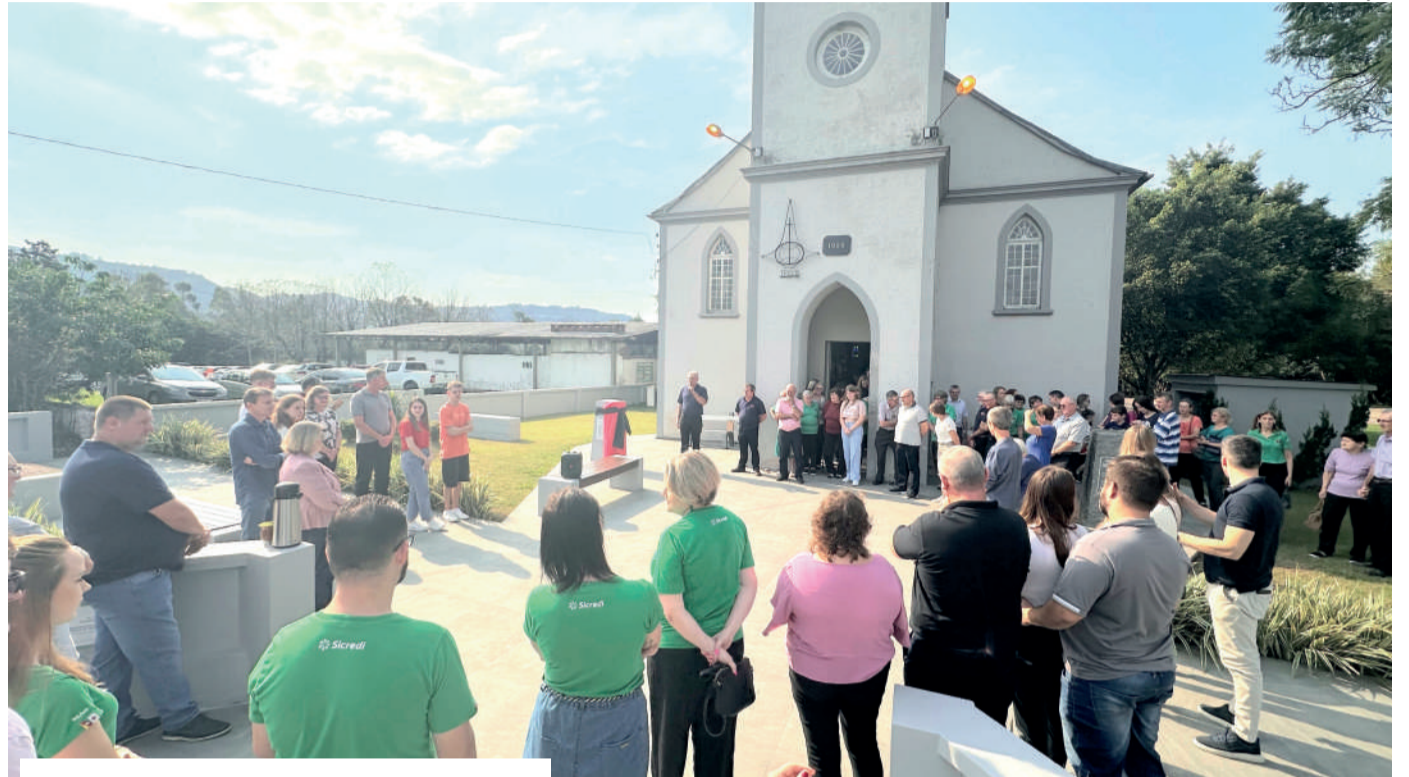
O Culto de Ação de Graças destacou a solidariedade e a reconstrução

O momento realizado no domingo ainda teve a inauguração de parte da revitalização da Praça Central frente à Igreja, que recebeu recursos do Fundo Social do Sicredi.