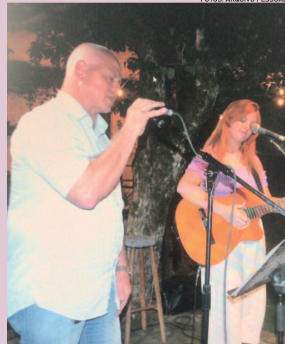
Parceria entre os dois vem de anos