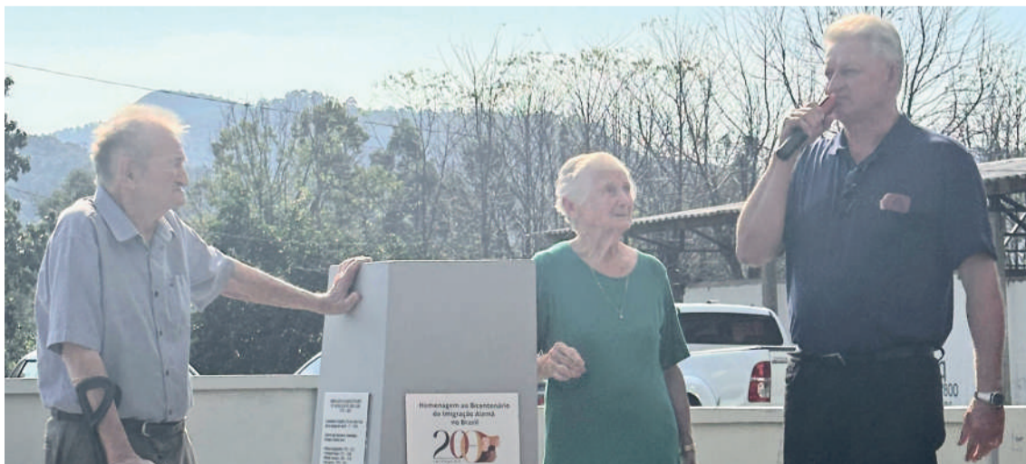
Houve o descerramento da placa em homenagem ao bicentenário da imigração alemã

O evento vem para agradecer e perpetuar a cultura de Linha Clara. O seu nome se deve à "clara visão" de grande parte de Teutônia. Linha Clara carrega consigo o orgulho da colonização alemã, pautada em três pilares: trabalho, cultura e fé.