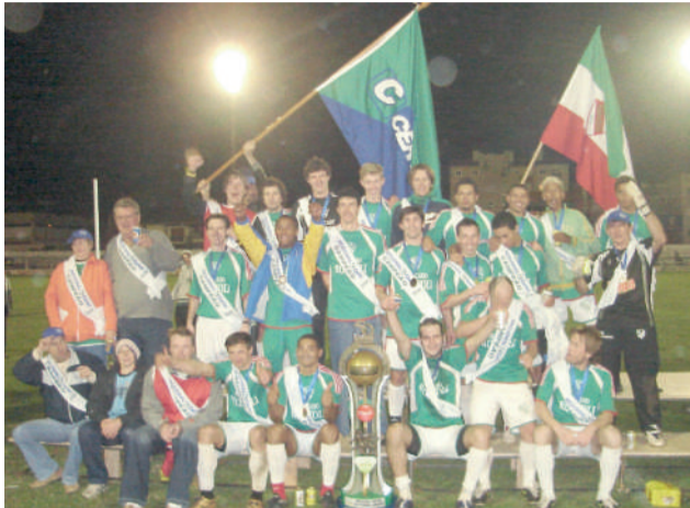
Riograndense campeão regional em 2006

Agora, o clube aguarda a realização dos jogos de volta da final da competição para defender a taça.