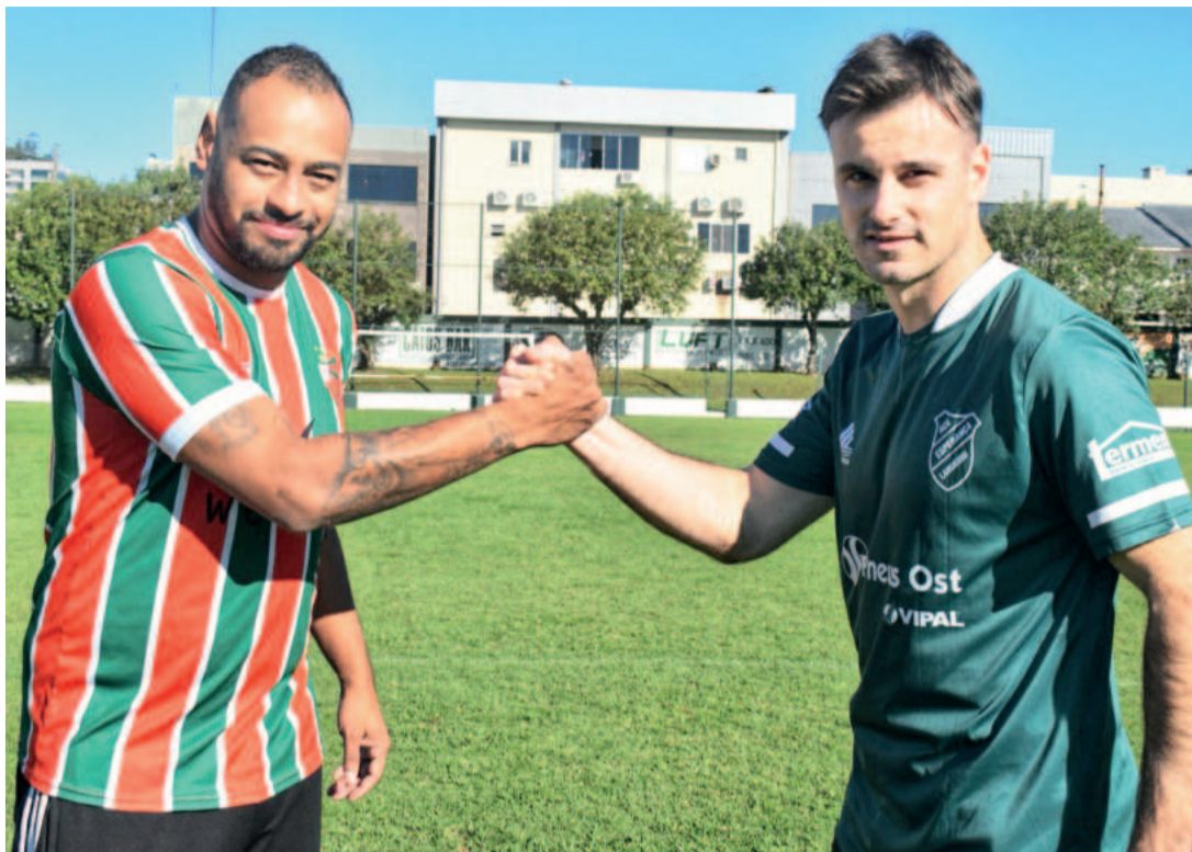
Negretti e Régis estarão em campo na decisão dos Titulares deste domingo