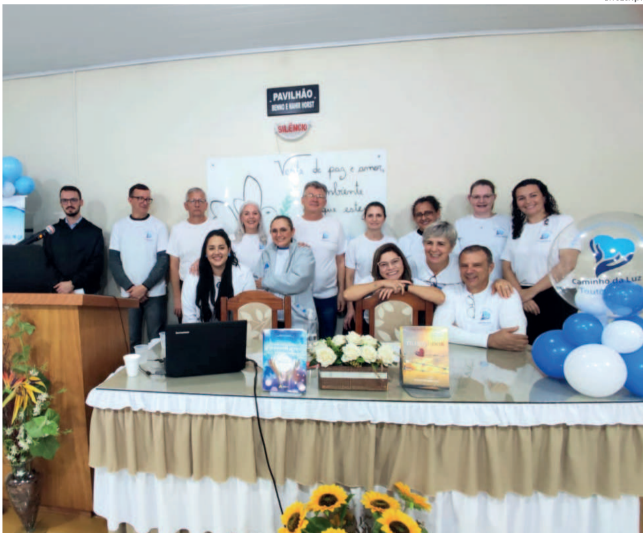
Nomes da diretoria e conselho fiscal foram definidos em assembleia