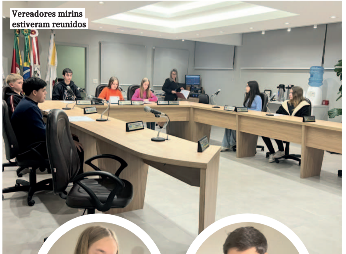
Vereadores mirins estiveram reunidos

A sessão de posse e eleição da mesa diretora da Câmara Mirim de Imigrante foi no dia 27 de março. A segunda sessão ocorreu dia 26 de junho e a próxima está agendada para o dia 28 de setembro, logo após a sessão ordinária do Legislativo.