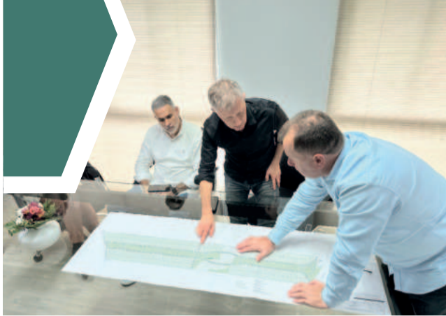
Grupo apresentou o empreendimento ao Executivo de Fazenda Vilanova