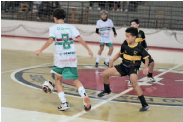
Fênix e Juventus abriram a noite de jogo