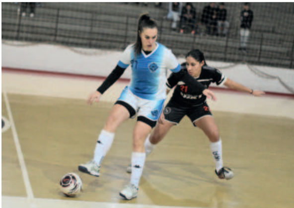
Categoria Feminino estreou na competição