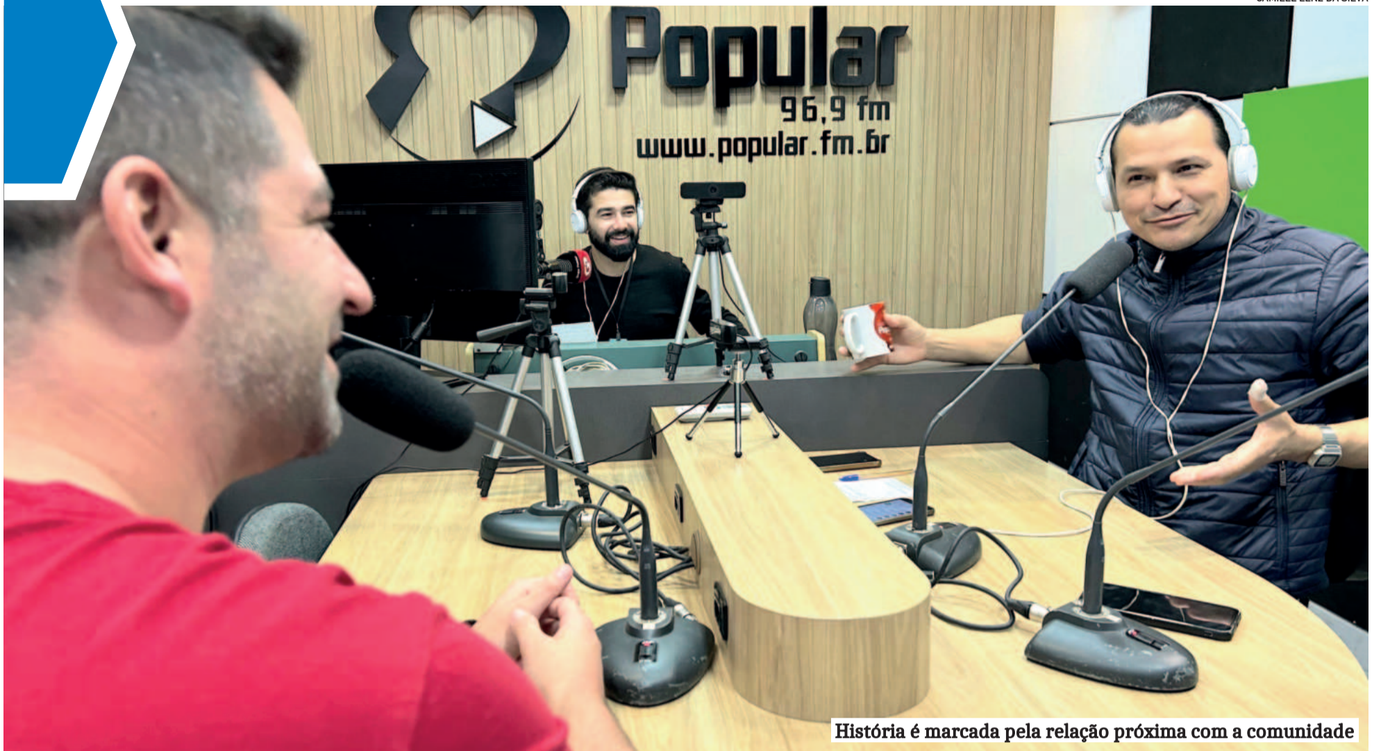
História é marcada pela relação próxima com a comunidade