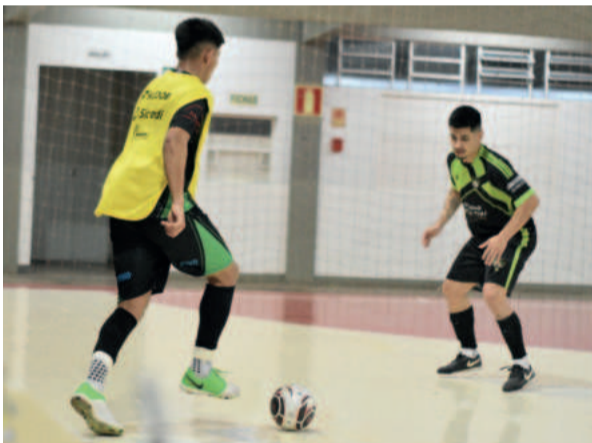
Confrontos do Força Livre terminaram em goleadas