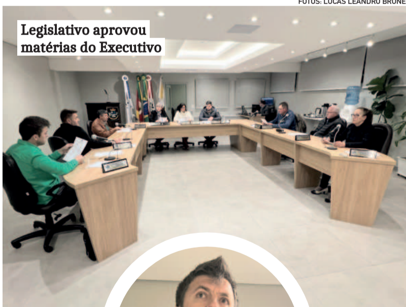
Legislativo aprovou matérias do Executivo