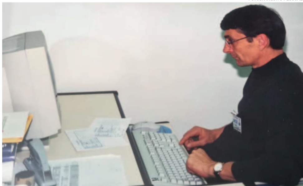
Dahmer em 1990 com os primeiros computadores da Certel