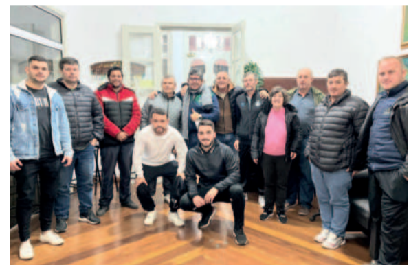
Organização e clubes acordaram pela retomada de forma completa

Com a Certel Artefatos , você tem EFICIÊNCIA E DURABILIDADE nas suas obras.