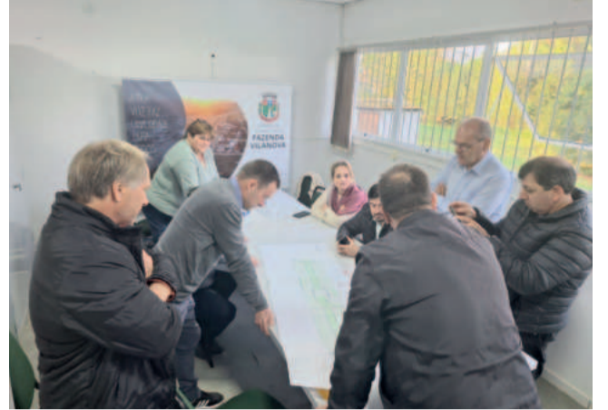
Prefeito apresentou projeto aos vereadores na segunda-feira