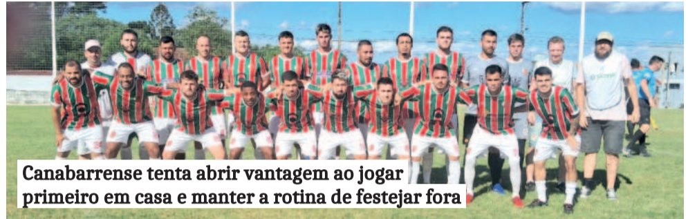
Canabarrense tenta abrir vantagem ao jogar primeiro em casa e manter a rotina de festejar fora