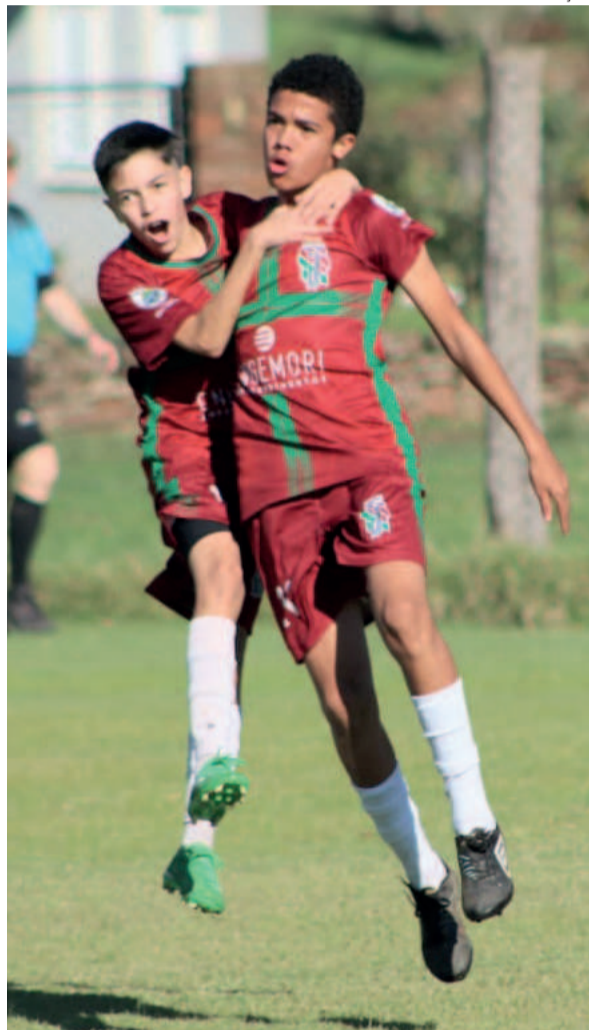
Elenco Sub-14 da Juventus