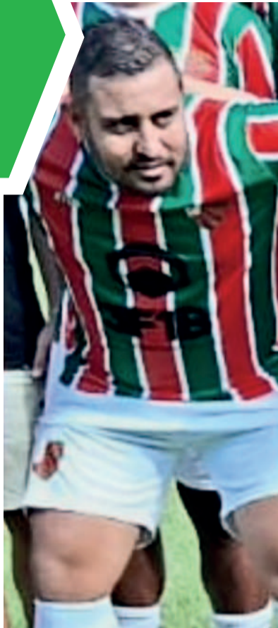
Índio veste a camisa do Canabarense