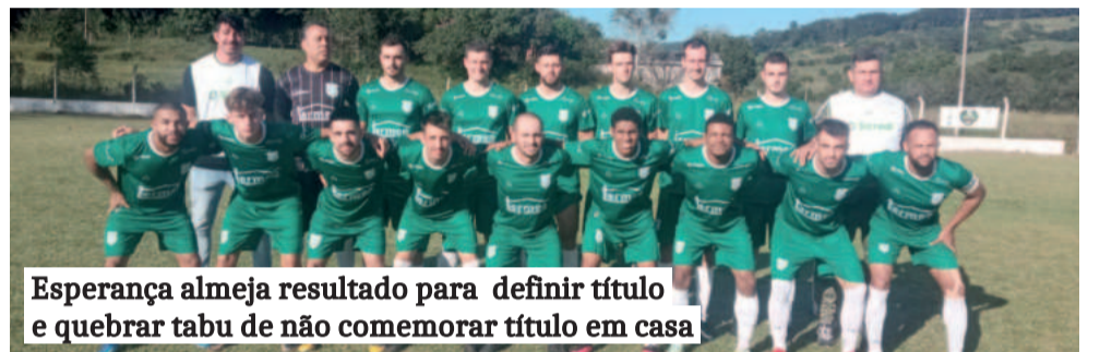
Esperança almeja resultado para definir título e quebrar tabu de não comemorar título em casa