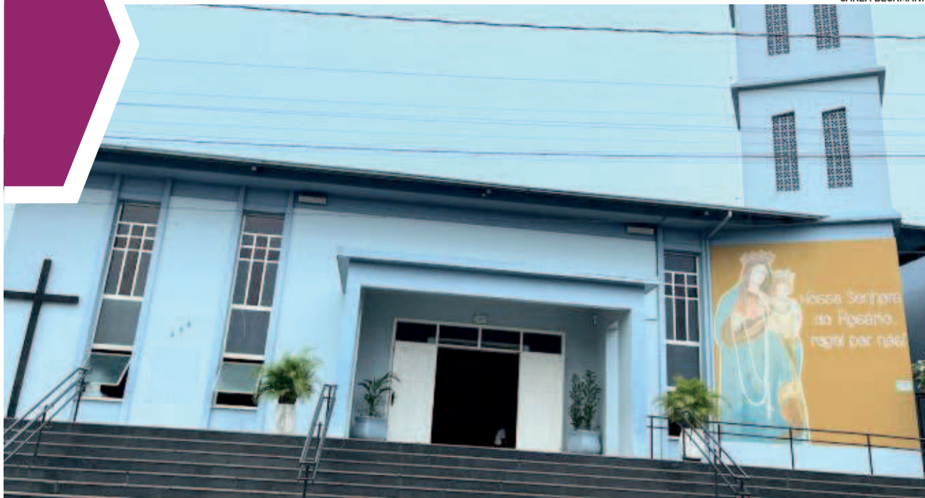
Evento ocorreu na Igreja Nossa Senhora do Rosário