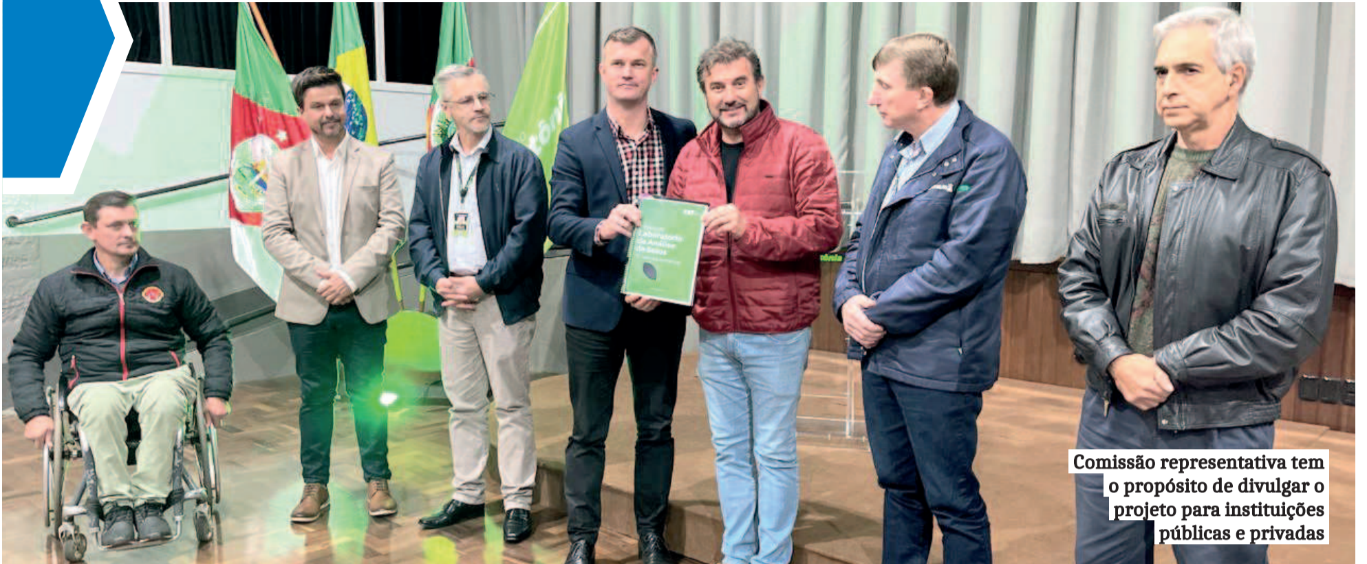
Comissão representativa tem o propósito de divulgar o projeto para instituições públicas e privadas