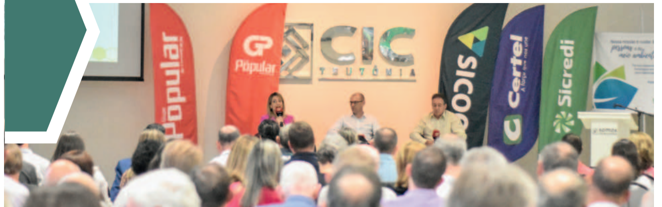
CARLA BECKMANN / ARQUIVO FP