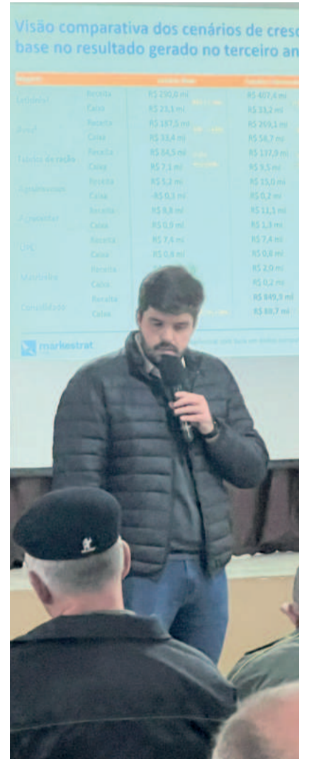
Markestrat apresentou cenários viáveis para salvar a Languiru