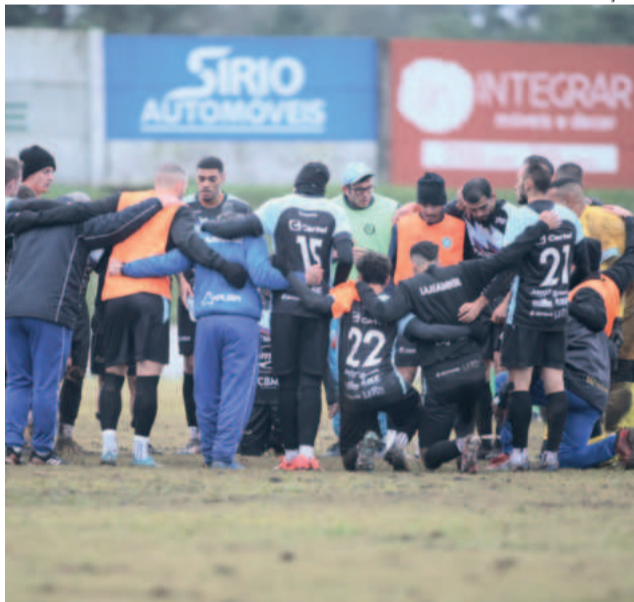
Atletas, comissão técnica e torcedores comemoraram a classificação à próxima fase