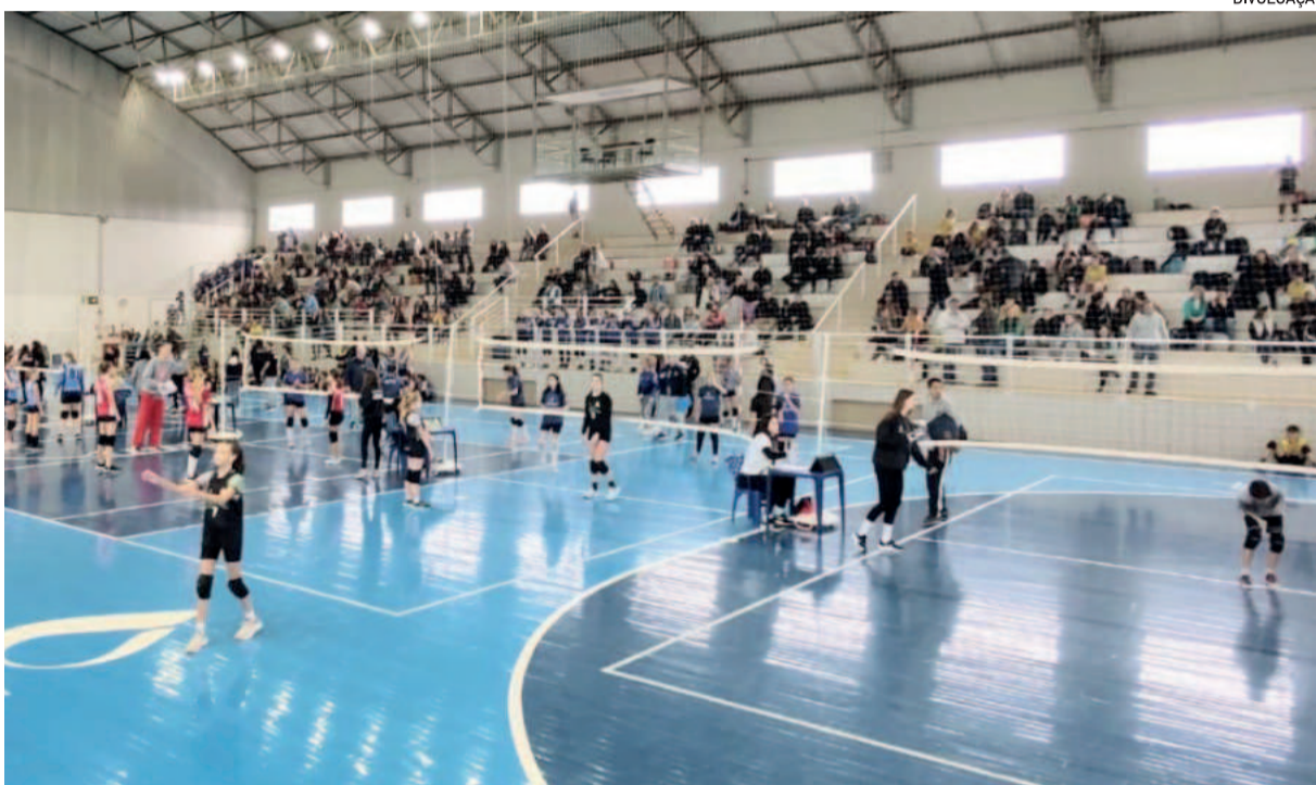
Juventus já sediou em outras oportunidades a Copa RS de Mini Vôlei e virou referência no estado

Santa Clara do Sul Lajeado Gravatá Nova Petrópolis Guaíba Encantado Santa Cruz do Sul Porto Alegre Estrela Novo Hamburgo Brochier Teutônia