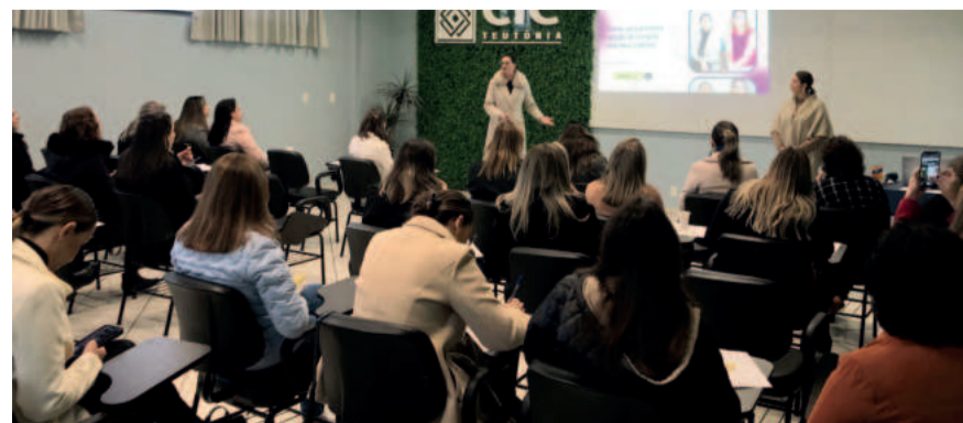
Núcleo de Mulheres realiza atividades mensais, na CIC

O grupo de coordenação também apresentou os resultados da pesquisa realizada com as associadas, trazendo um levantamento sobre os impactos da enchente nos negócios das participantes e um levantamento sobre as expectativas em relação aos trabalhos do Núcleo. Além de apresentar o calendário das próximas atividades, foi anunciada a iniciativa do Networking Delas, um evento que acontecerá no dia 15 de outubro, com objetivo de fomentar os negócios. Durante o evento também foi servido o café da manhã e foi realizada uma dinâmica de conversação entre as presentes.