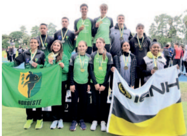
Equipe teutoniense do revezamento 4x400m Misto foi campeã estadual