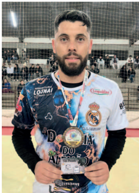
Suelo, do NA Limitados (Livres)