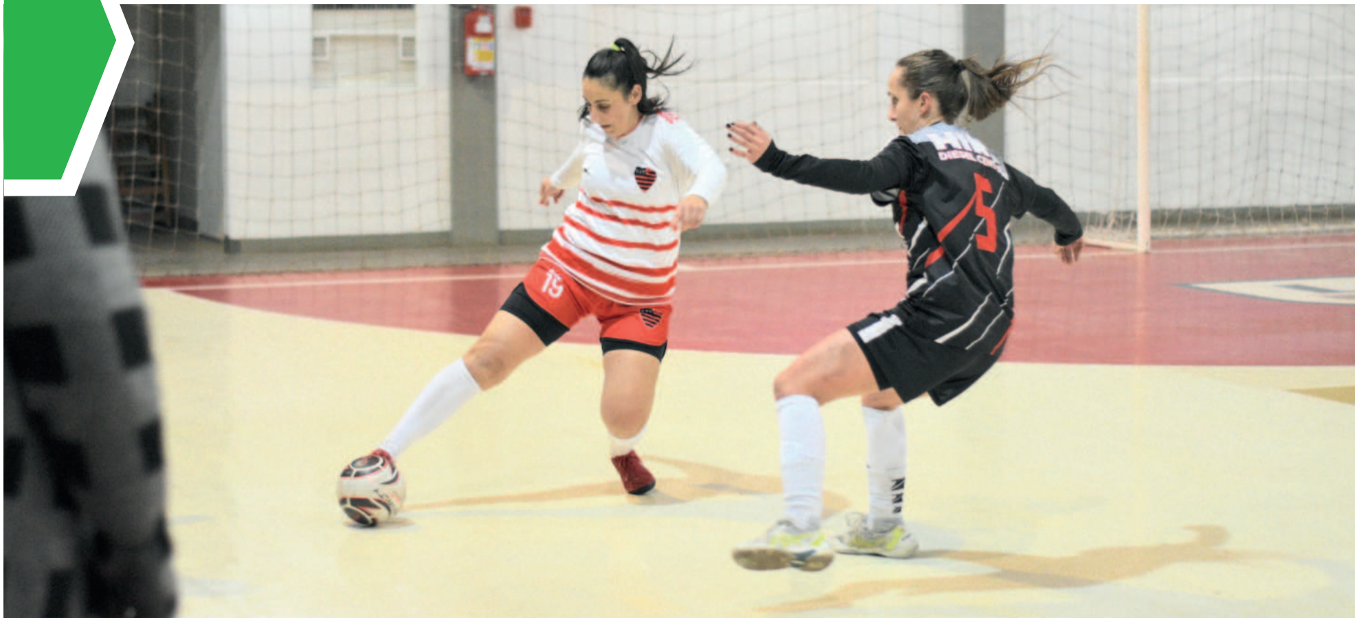
Flamengo (vermelho e branco) bateu a forte equipe do Kipoder e conquistou os primeiros 3 pontos