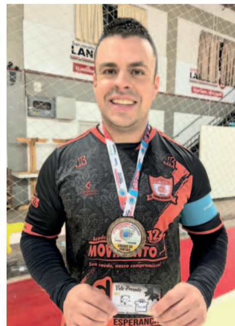
Beirão, do Laranja Mecânica (Livres)