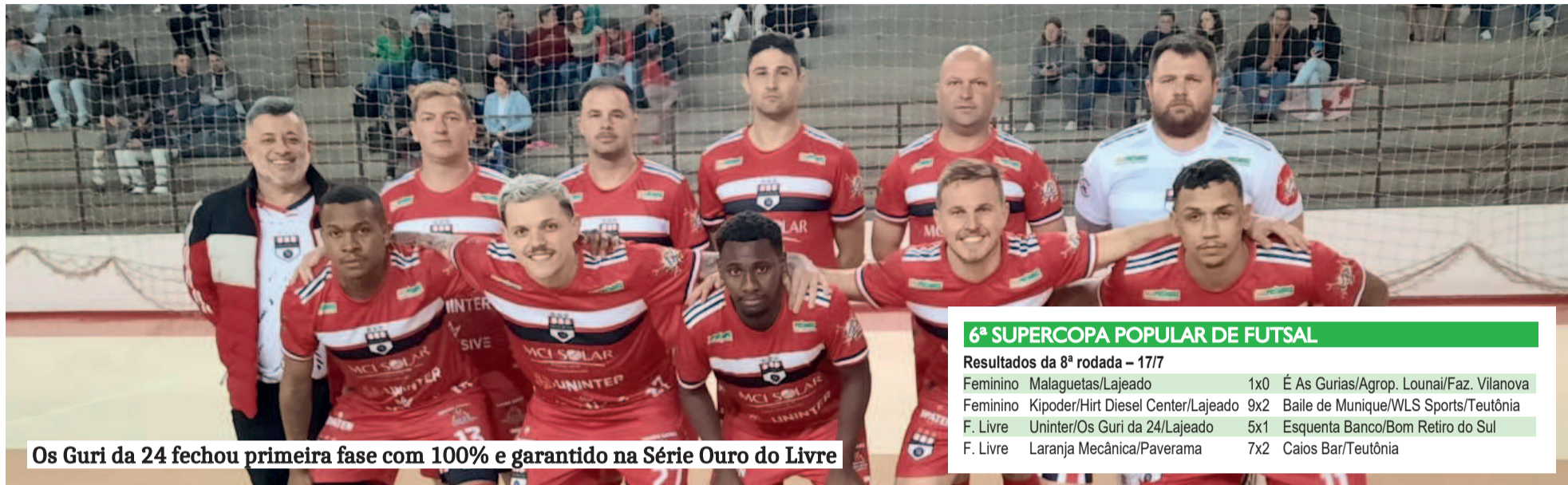
Os Guri da 24 fechou primeira fase com 100% e garantido na Série Ouro do Livre