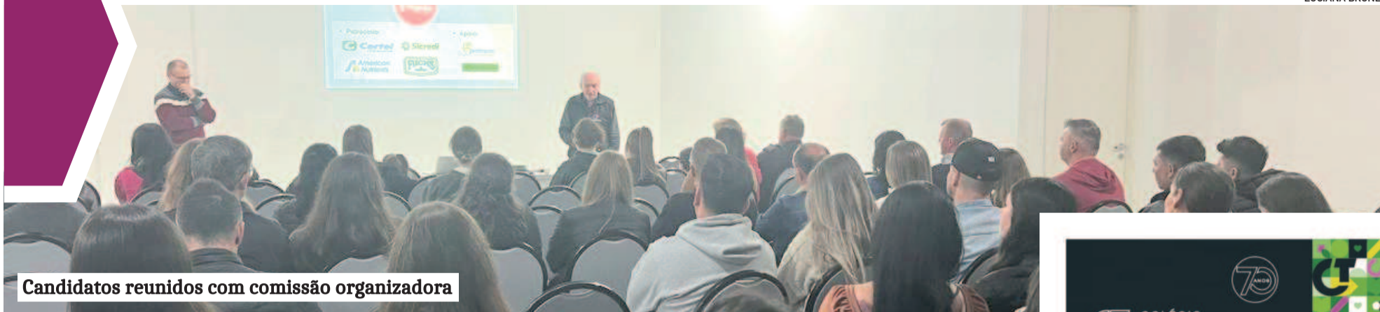
Candidatos reunidos com comissão organizadora