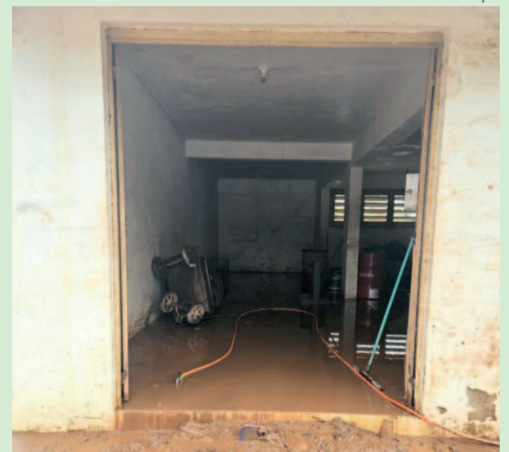
Dependências do clube foram inundadas pela cheia de maio; perdas beiram os R$ 20 mil