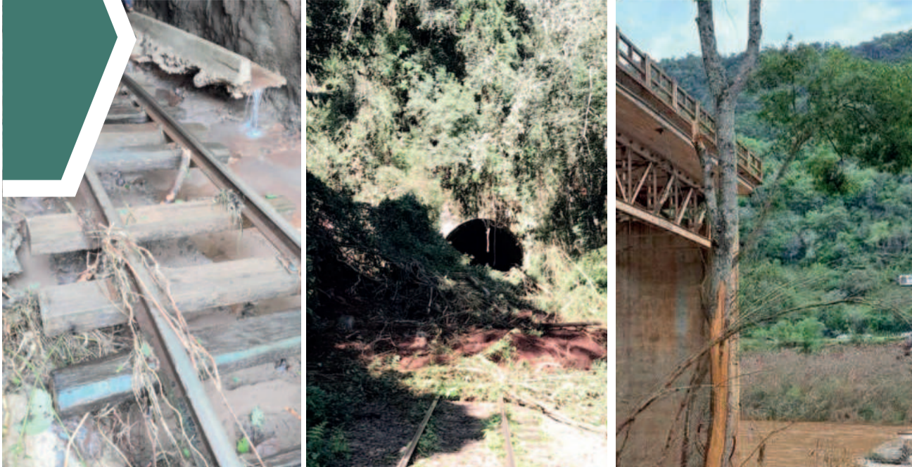
Ferrovia do Trigo e Santa Bárbara são dois exemplos do colapso rodoferroviário no estado