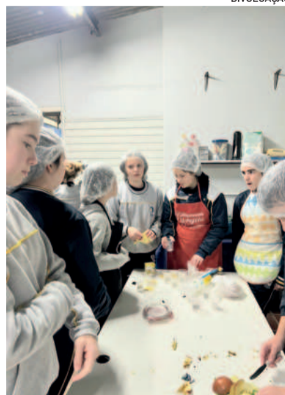
Oficina de culinária envolveu os estudantes