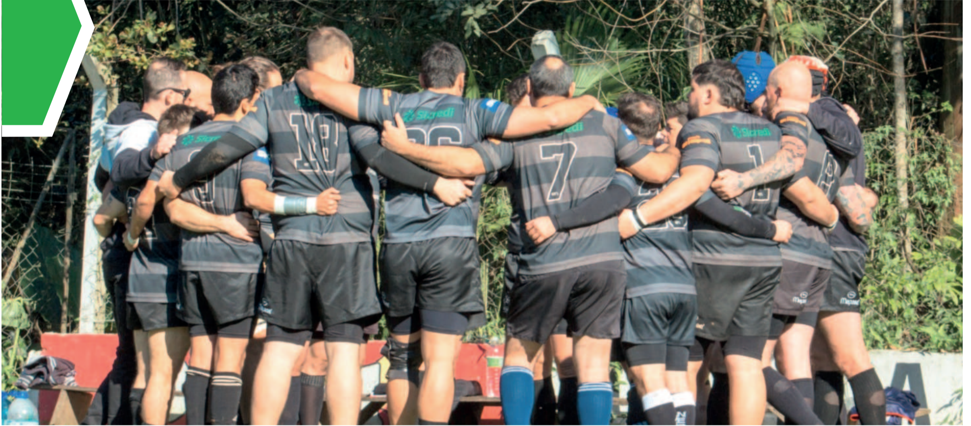
Time permanece unido e focado em representar o Vale do Taquari nas competições