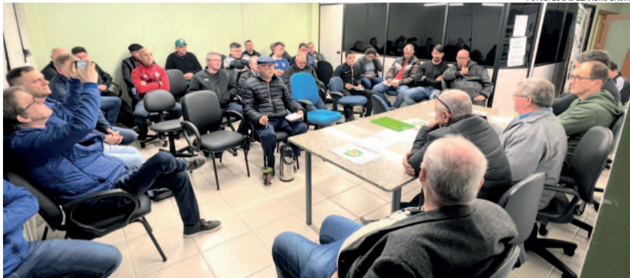
Clubes vão se reunir neste sábado pela manhã