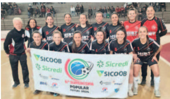
Kipoder Hirt Diesel Center é um dos líderes da competição Feminina