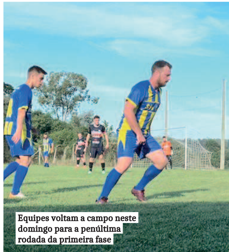
Equipes voltam a campo neste domingo para a penúltima rodada da primeira fase