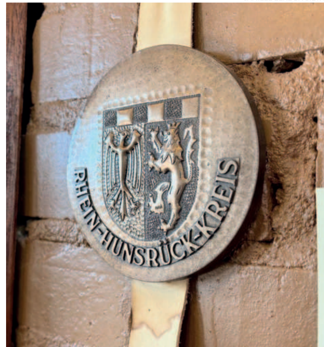
Bandeira do distrito alemão do Reno-Hunsrück, no estado da Renânia-Palatinado, é um dos símbolos da troca de culturas estampado em associações como o Grupo de Danças Folclóricas de Estrela

Conforme citado no início, as comemorações do bicentenário da imigração alemã se estendem por todo 2024 e além - não precisa e não deve ser uma história finalizada. Portanto, na próxima edição da Folha Popular, a ser publicada no sábado (27/7), você confere a continuidade deste texto.