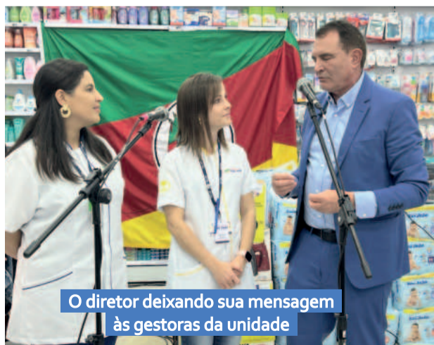
O diretor deixando sua mensagem às gestoras da unidade