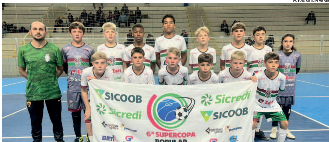
Teutônia Juventus venceu e lidera a categoria Sub-13