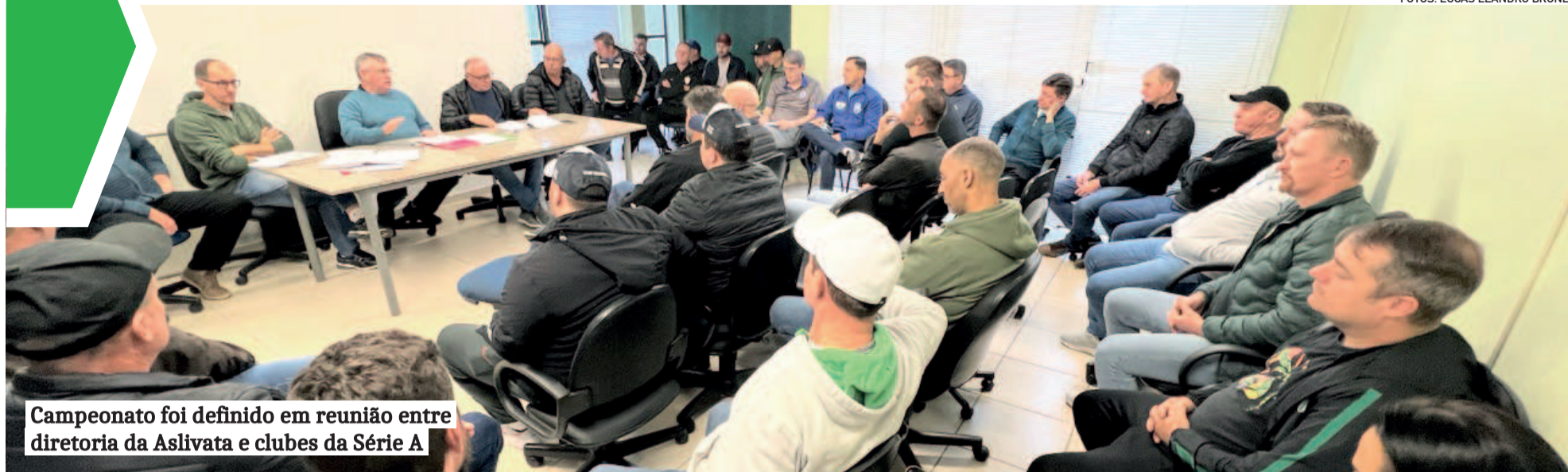
Campeonato foi definido em reunião entre diretoria da Aslivata e clubes da Série A