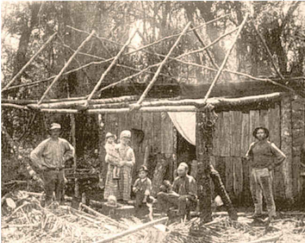
Colonos alemães abriram picadas e constituíram suas moradias em meio à mata