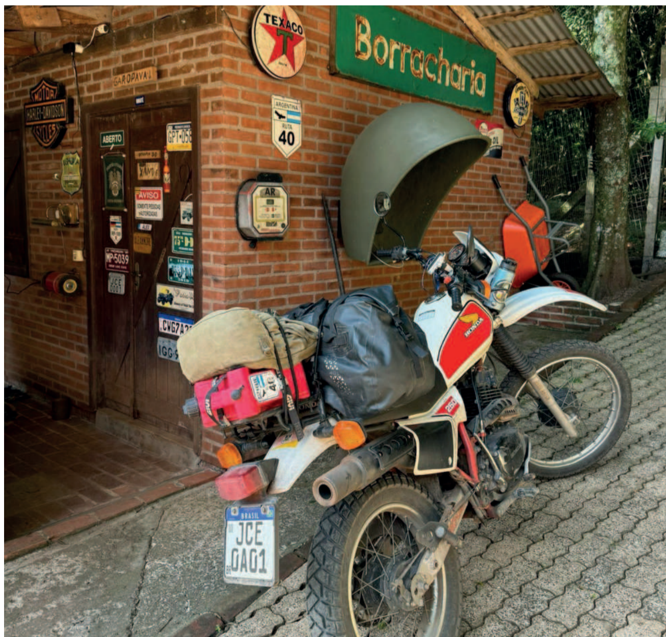
Vovozinha de volta ao mesmo lugar da partida