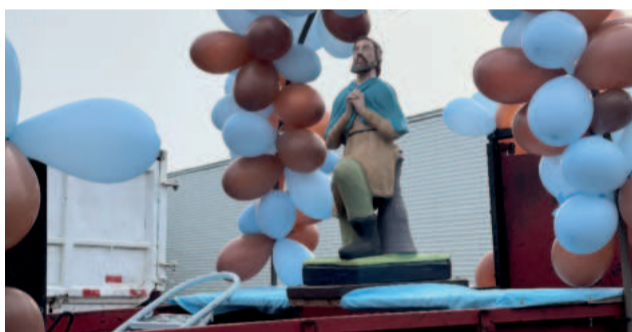
Posto Canteiros venceu o leilão e carregará Santo em 2025

Na sequência, os motoristas participaram da carreta pelas ruas do município, um momento de fé e bênçãos aos presentes. A programação seguiu às 12h com a realização do almoço e, durante a tarde, a animação da festa ficou por conta da Banda Kneuc's.