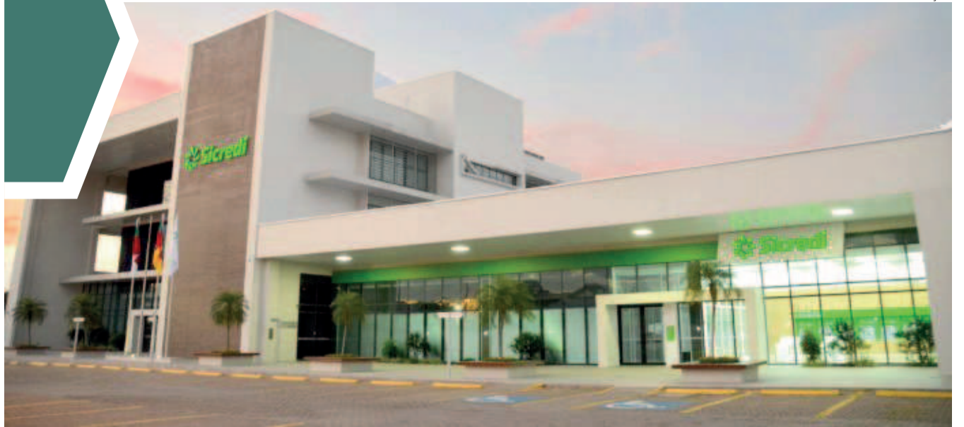
Ciclo também marca a celebração de um ano de Sicredi Ouro Branco no Vale do Aço, em Minas Gerais