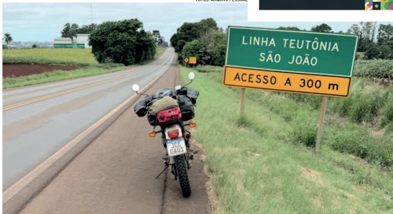
A Vovozinha encontrou até a Linha Teutônia no caminho de volta

Rodei sob chuva forte cruzando as localidades de Cerro Azul e Leandro N. Alem até chegar em Porto Xavier, onde tomaria a balsa para cruzar o Rio Uruguai e faria os trâmites alfandegários de saída da Argentina e entrada no Brasil. A fiscal do lado argentino se mostrou interessada na Vovozinha e queria detalhes da viagem. Como tinha tempo até a próxima balsa sair dei a devida atenção a ela e na contrapartida nem inspecionaram minhas bagagens e meu passaporte foi carimbado imediatamente sem ter que enfrentar a fila de espera repleta de caminhoneiros.