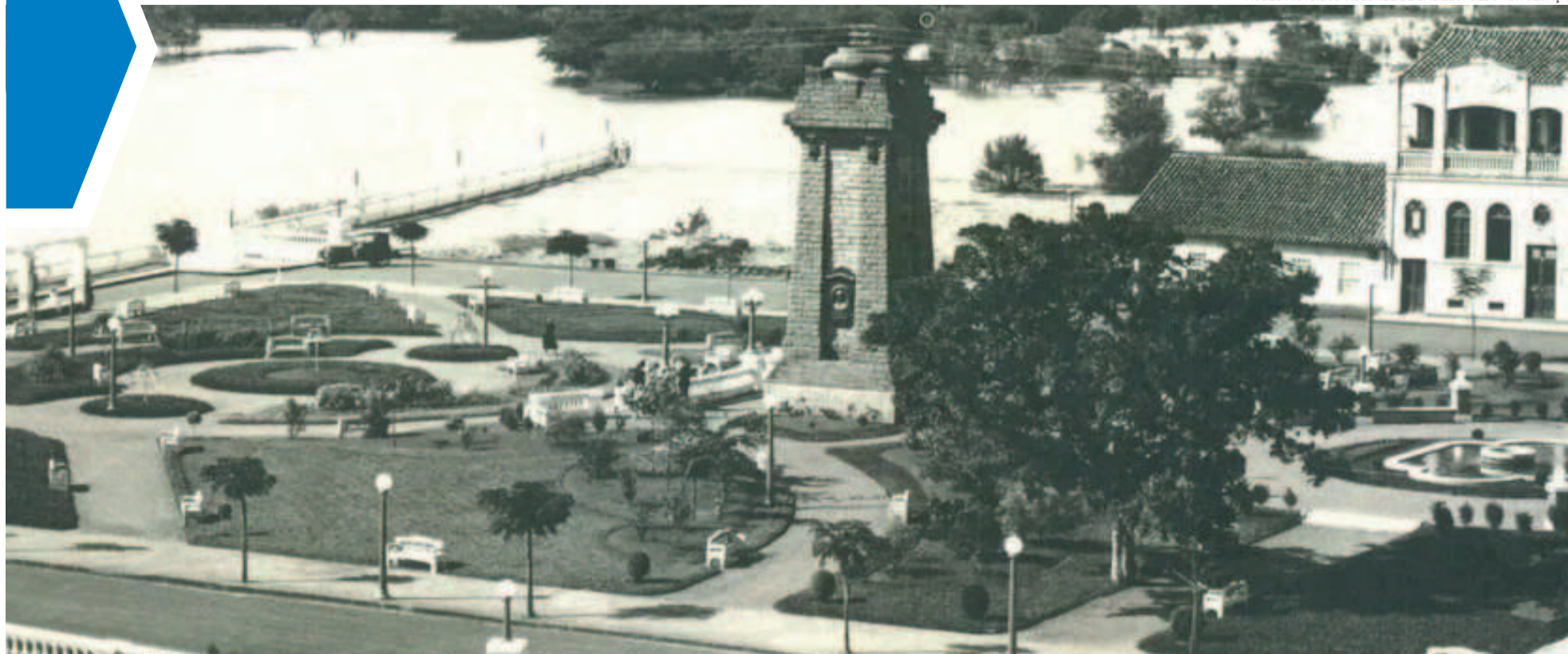
Praça do Imigrante de São Leopoldo, em 1934. Este é considerado o local de desembarque dos primeiros imigrantes

ESTADO ▶ BICENTENÁRIO DA IMIGRAÇÃO - PARTE 1