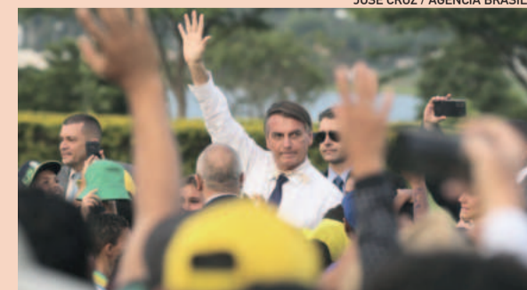
Bolsonaro é aguardado a partir de hoje para roteiro no Estado