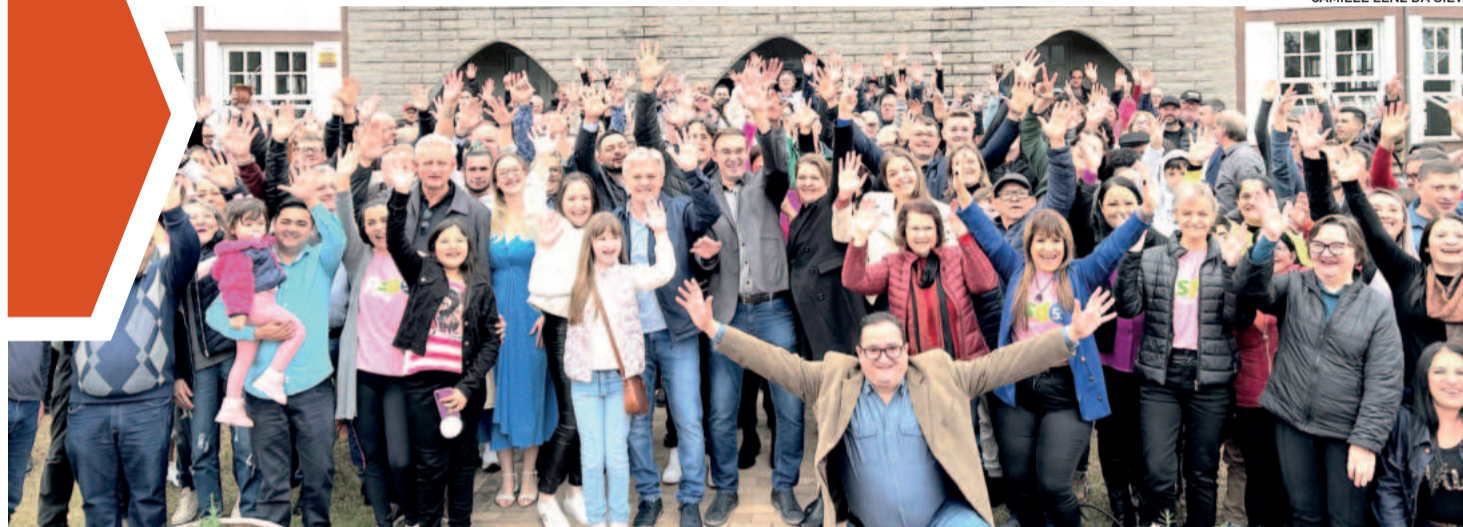
Com o slogan “Teutônia, um novo tempo”, candidatos disputarão as eleições com o número 55

TEUTÔNIA ▶ PSD, MDB, PP, PRD E REPUBLICANOS