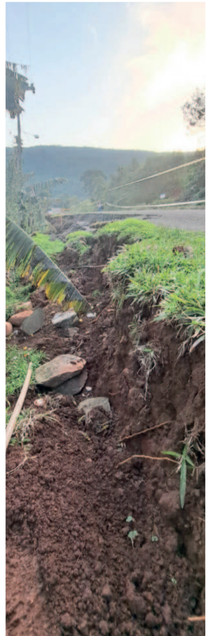
Desmoronamento em Harmonia Alta lembra dias de terror