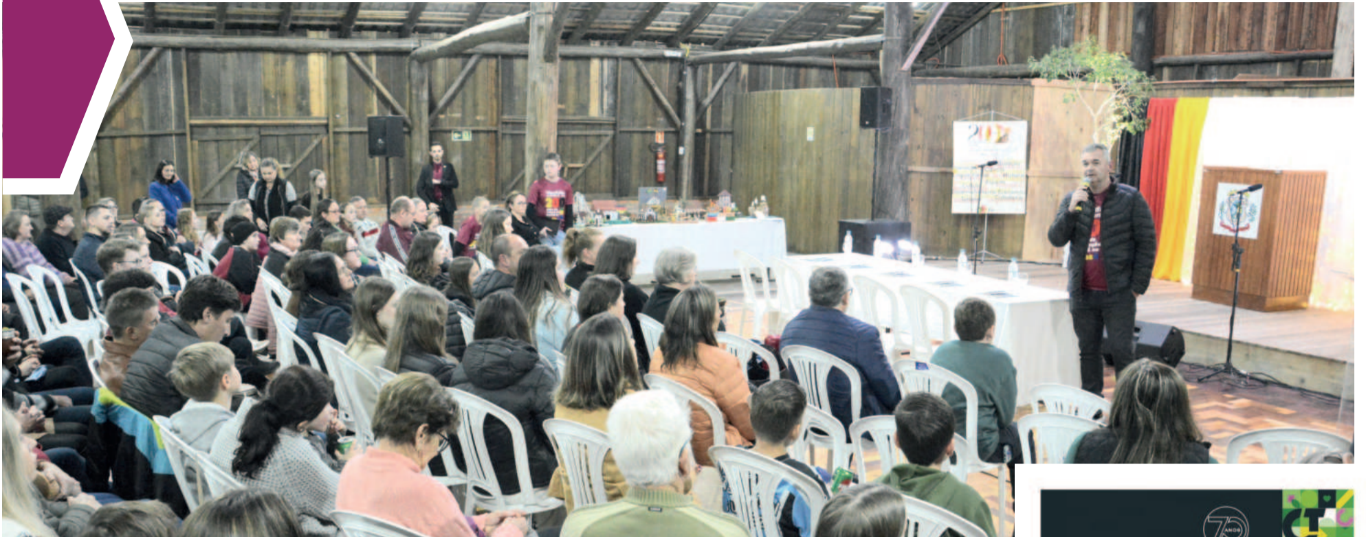
Comunidade acompanhou a cerimônia no Galpão Municipal do Parque de Eventos de Westfália