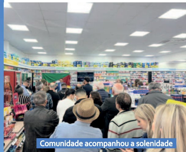
Comunidade acompanhou a solenidade