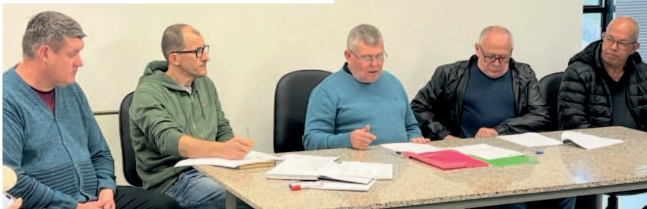
Diretoria da Aslivata conduziu o encontro no sábado

A Aslivata definiu o valor de R$ 1.000,00 de prêmio participação para cada clube por campeonato inscrito: Série A, Série B, Veterano, Master e Feminino.