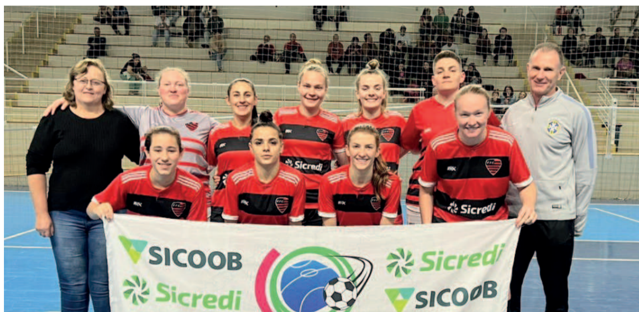
Flamengo de Westfália assegurou presença na semifinal do Feminino