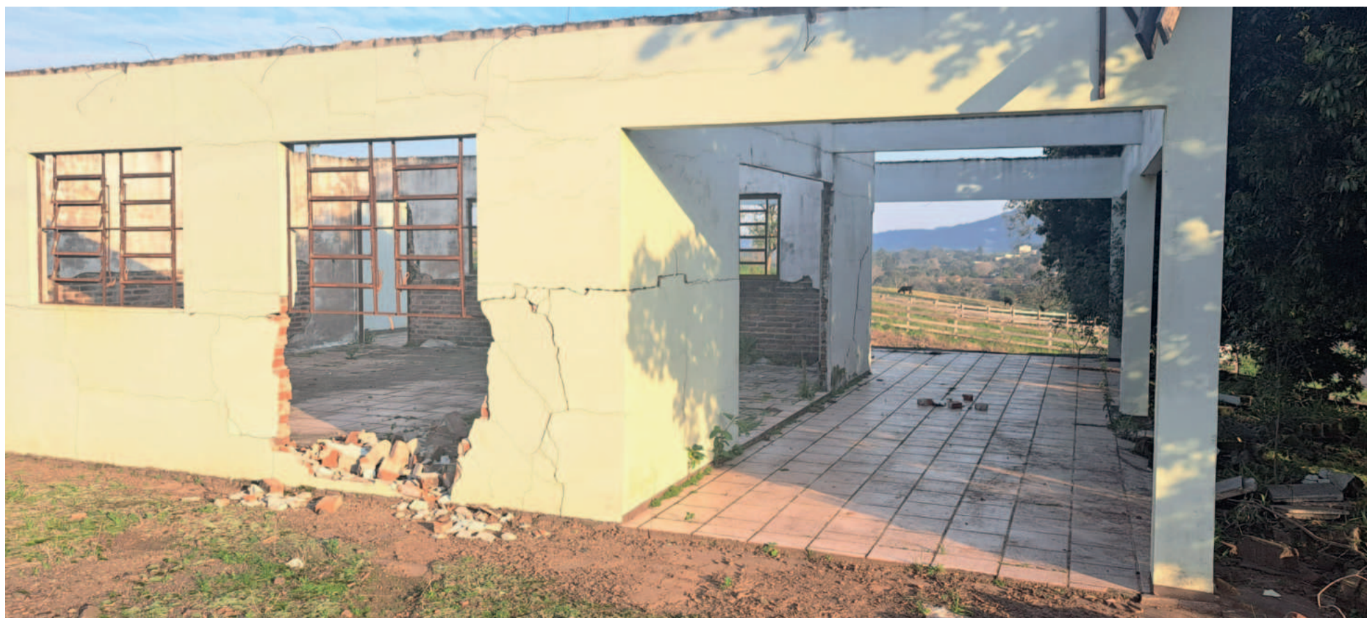
Para moradores, ruínas das Câmaras Mortuárias são péssimo cartão de visita

Concluindo, é essencial que estejamos atentos às tendências para ajustar nosso planejamento e obter melhores resultados. Vamos juntos nessa? Boa semana!