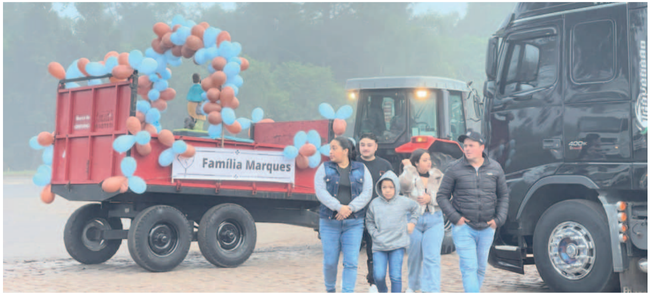
Público chegou com antecedência para desfrutar no momento entre família e amigos

“É um domingo especial. Mesmo com a neblina, temos um dia abençoado. Os motoristas estão aqui desde as 3h buzinando e animados para a sequência da festividade”, afirmou. Segundo o pároco, foram vendidos 1.150 cartões para o almoço e mais de 350 juntaram-se na tarde no Ginásio da Comunidade Católica de Canabarro para celebrar com muita música e diversão.