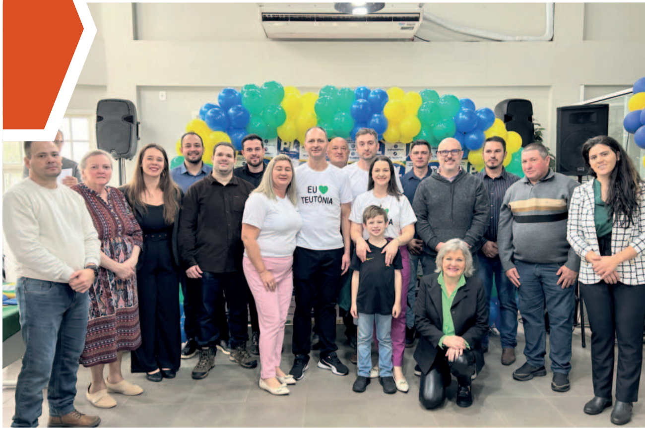
Convenção ocorreu na Câmara de Vereadores