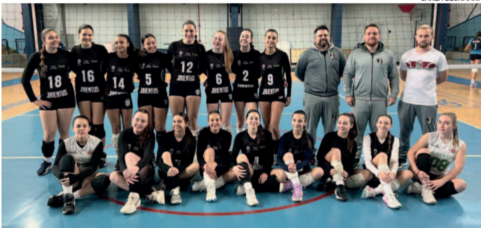
Voleibol iniciou na fundação, parou e foi retomado com grande sucesso