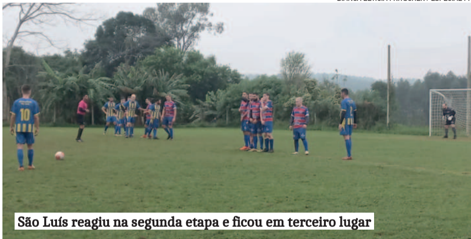
São Luís reagiu na segunda etapa e ficou em terceiro lugar