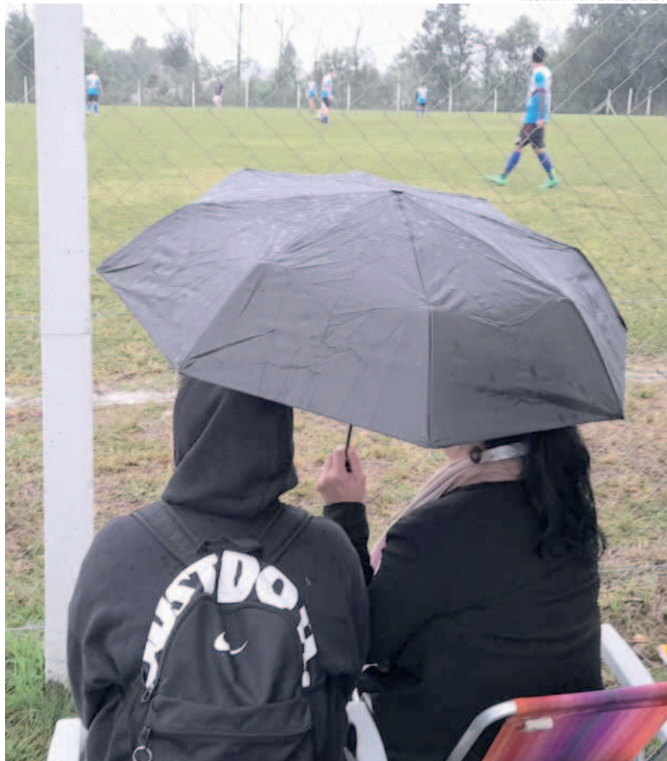
Torcedores foram de guarda-chuva para assistir jogos na Linha São José