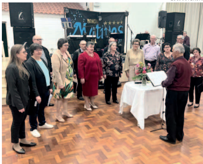
Evento ocorreu no sábado (27/7)

Após, os coralistas e a comunidade participaram confraternizaram em um jantar, seguido de baile e sorteio de vários prêmios.