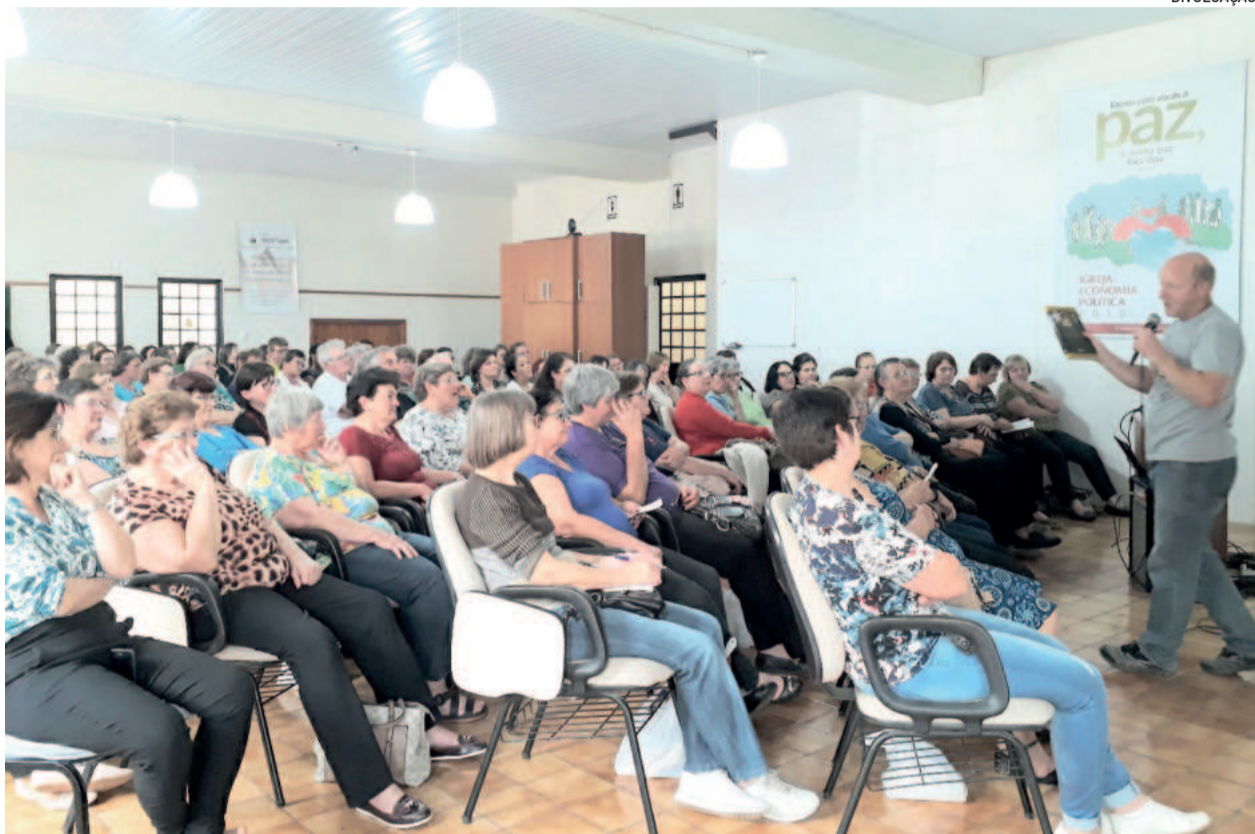
O evento ocorre no dia 8 de agosto, na parte da tarde, e deve reunir de 100 a 150 pessoas