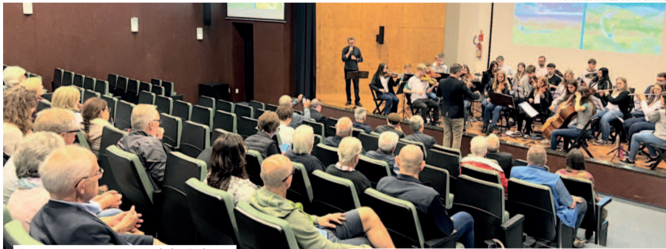
Conjunto Instrumental do Colégio Teutônia surpreendeu os alemães

Rheinböllen fica no distrito de Rhein-Hunsrück, estado da Renânia-Palatinado, na Alemanha. A ligação com Teutônia vem do fim da década de 1990, quando o Sr. Lauer solicitou se havia alguma forma de contribuir e recebeu a informação da necessidade de um caminhão de bombeiros. Alguns meses depois, o primeiro caminhão do Corpo de Bombeiros Voluntários de Teutônia era enviado. Conhecido como "alemão", o veículo é utilizado até hoje.