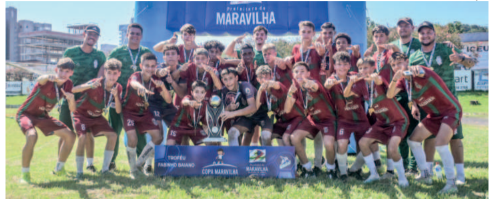
Equipes da Juventus participam de competições no estado e fora dele