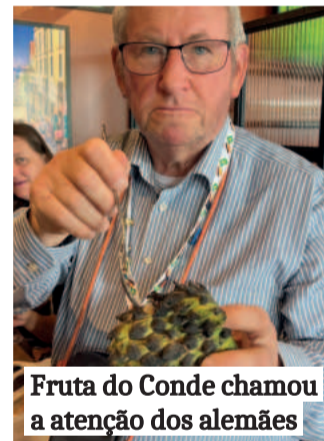
Fruta do Conde chamou a atenção dos alemães