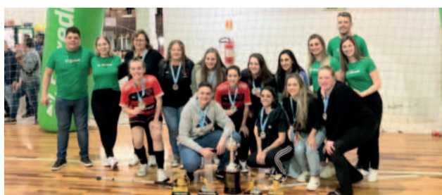
Equipe feminina de Westfália comemorou mais uma taça para a sua coleção

Na noite de sexta-feira (26/7), o Abertão Fazenda Vilanova de Futsal conheceu os campeões de mais uma edição. Na categoria Feminino, o Flamengo de Westfália conquistou o bicampeonato diante do Chelsea por 3 a 1. No Veterano, a equipe AJP faturou o título com uma vitória por 3 a 1 contra o Reis da Copa. Pelo Sub-21, o Chelsea goleou a equipe Alpha F.C por 4 a 2. E no Força Livre, o N.A. Limitados levantou a taça após uma vitória por 2 a 1 diante do Amigos do Barça.