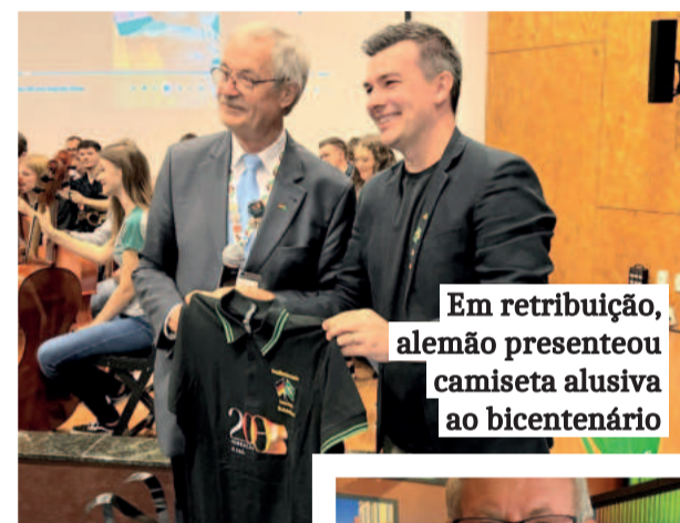
Em retribuição, alemão presenteou camiseta alusiva ao bicentenário