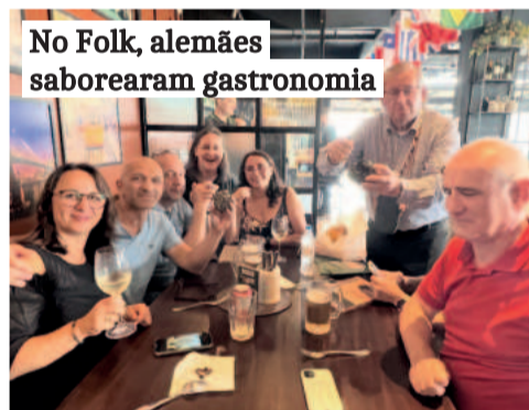
No Folk, alemães saborearam gastronomia