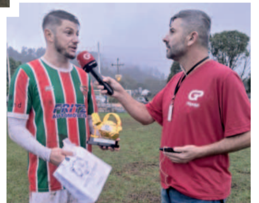
Ilocir ao longo de 30 anos de Família Popular