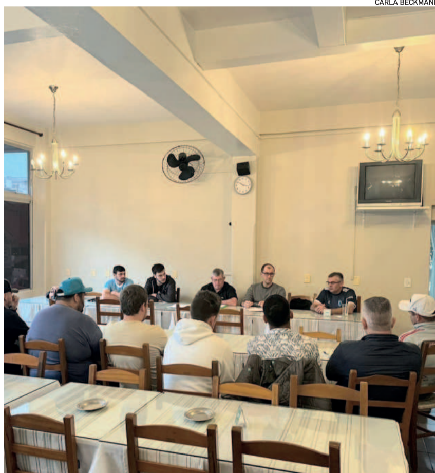
Aslivata, Pivi Arbitragem e representantes de clubes estiveram reunidos na manhã de sábado (27/7) no Hotel e Restaurante União