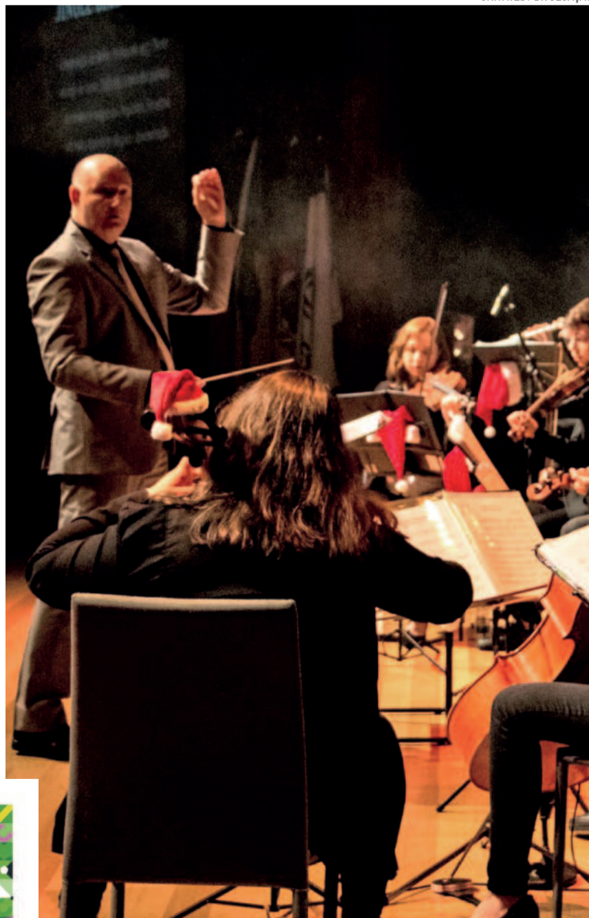
Espetáculo trará repertório de clássicos da música alemã