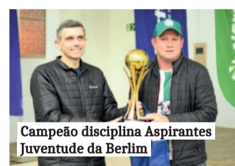
Campeão disciplina Aspirantes Juventude da Berlim