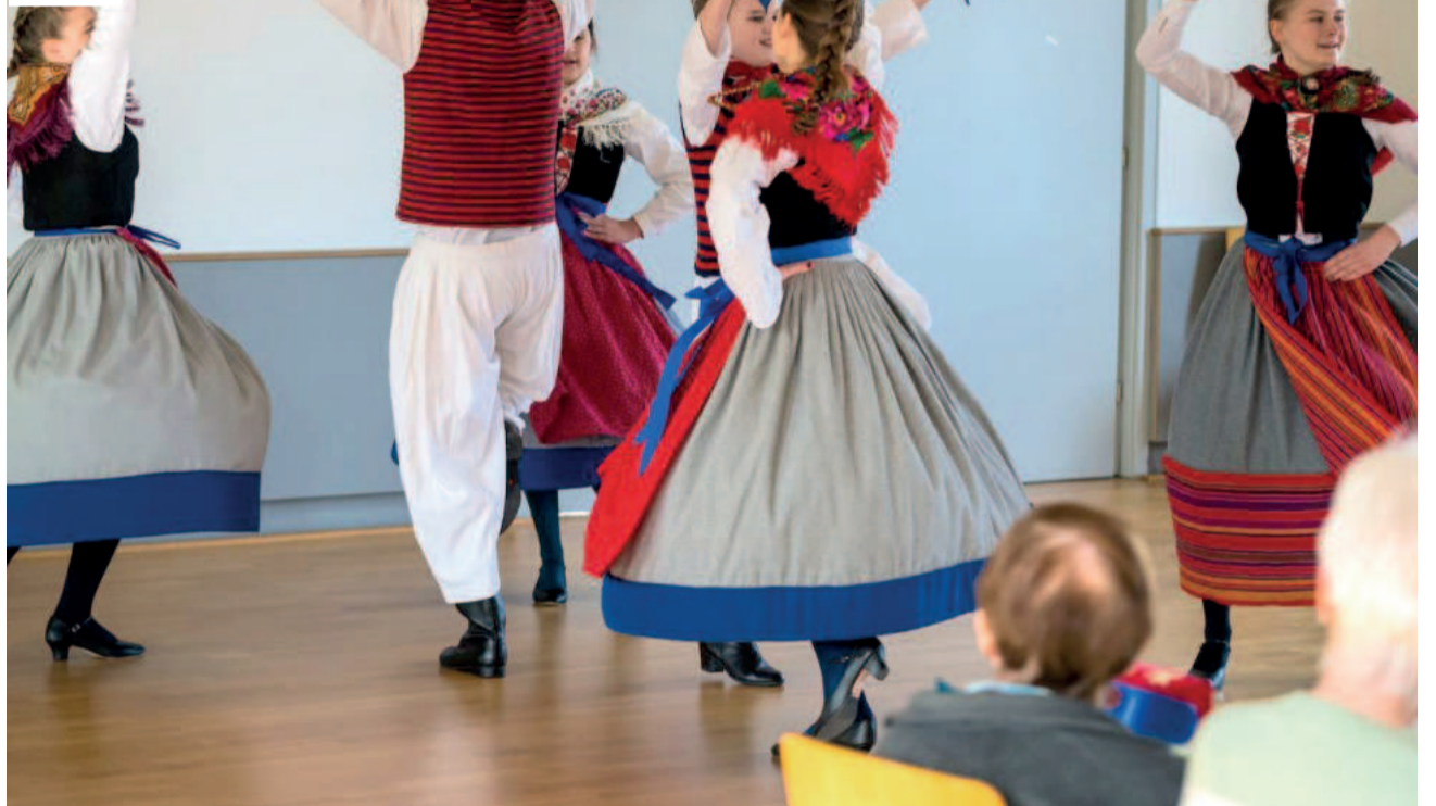
Apresentação do grupo alemão Folkloreensemble Ihna Erlangen marcará retomada as atividades