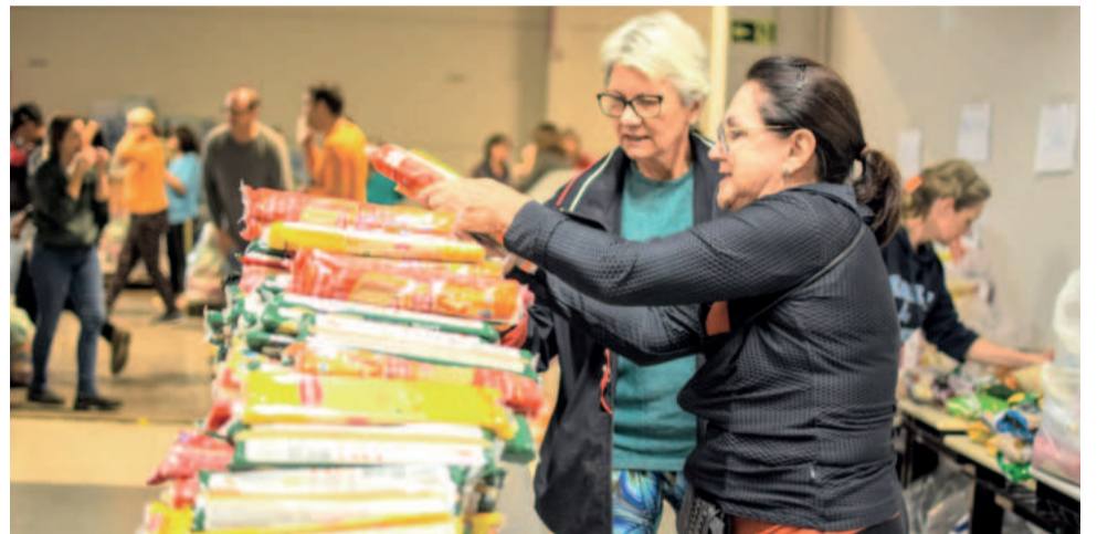
Ao longo de mais de um mês, centenas de voluntários passaram pelos pontos de coleta e distribuição