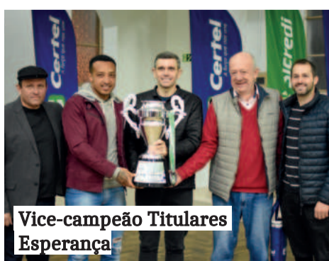
Vice-campeão Titulares Esperança