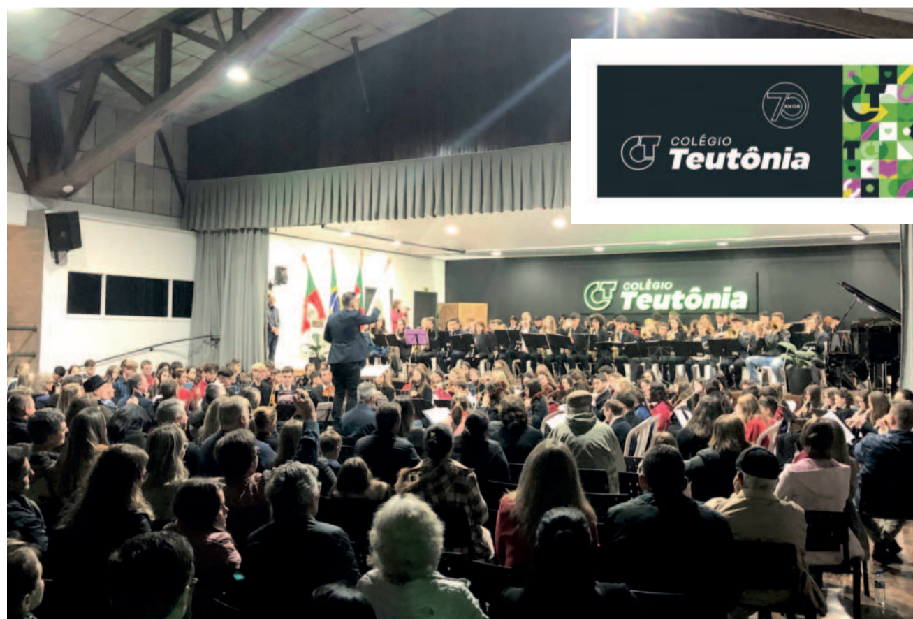
Público lotou dependências do auditório para o Encore

Ao fim, todos estudantes se uniram em uma grande orquestra e apresentaram três músicas para o público presente, encerrando a noite com muita vibração.