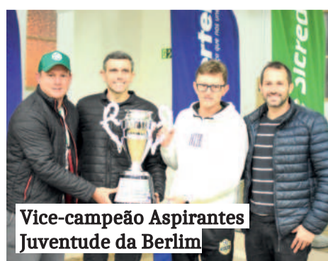
Vice-campeão Aspirantes Juventude da Berlim