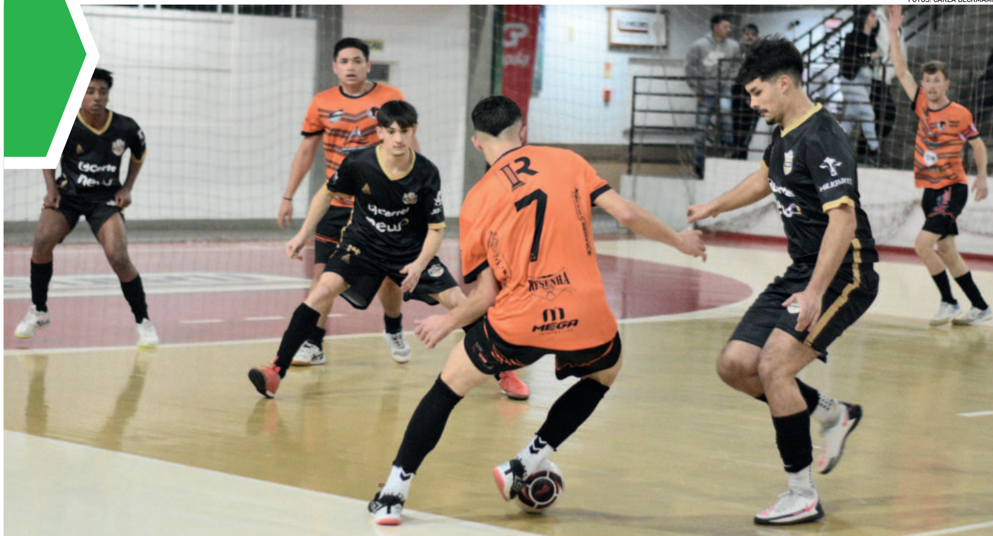
ACFC de Fazenda Vilanova (laranja) venceu os jovens de 17 anos da Teutônia Futsal