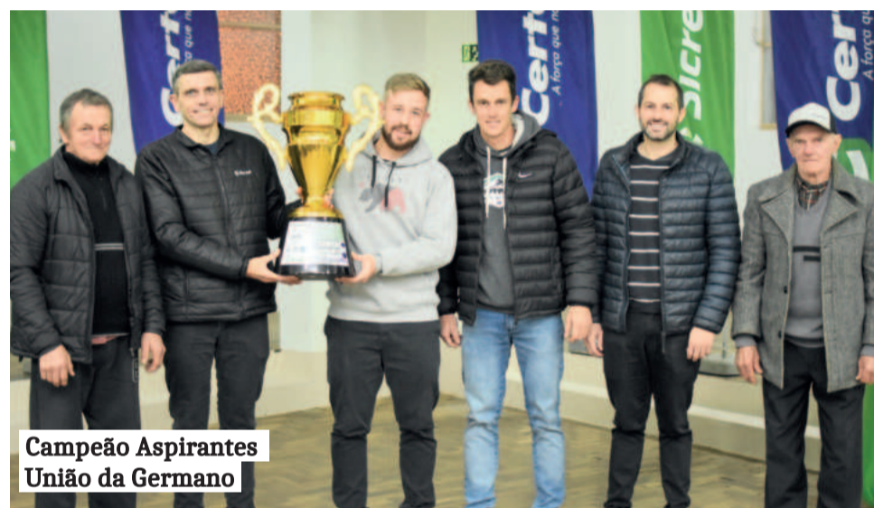
Campeão Aspirantes União da Germano