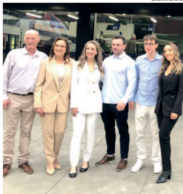
Família Zart celebra 35 anos de Zart Supermercados