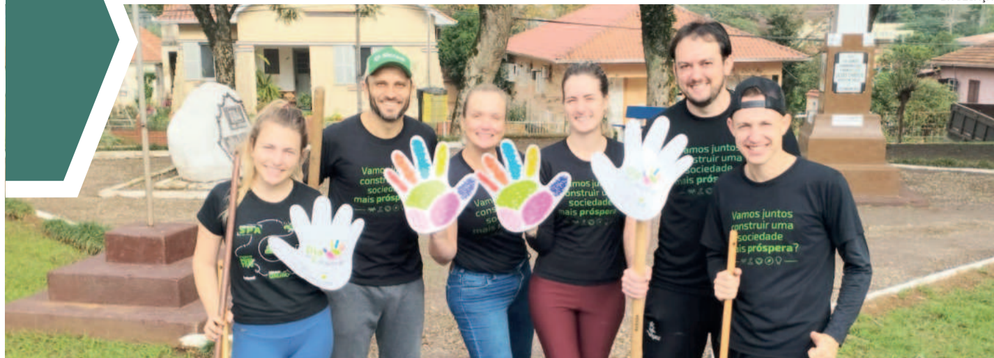
Em 2024, o tema é “Juntos fazemos mais pelas pessoas e por comunidades inteiras”

Esperamos você em nossas reuniões: Nas segundas-feiras, em Languiru. Nas terças-feiras, em Canabarro, junto às Igrejas Católicas. Informações pelo (51) 9 9894-4745.