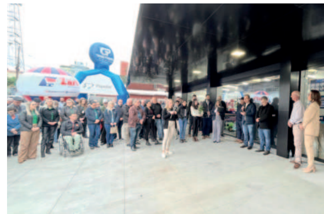
Comunidade acompanhou a solenidade

Mesmo depois do período de inauguração, os clientes podem ter acesso a promoções especiais baixando o aplicativo do Zart e visitando uma das