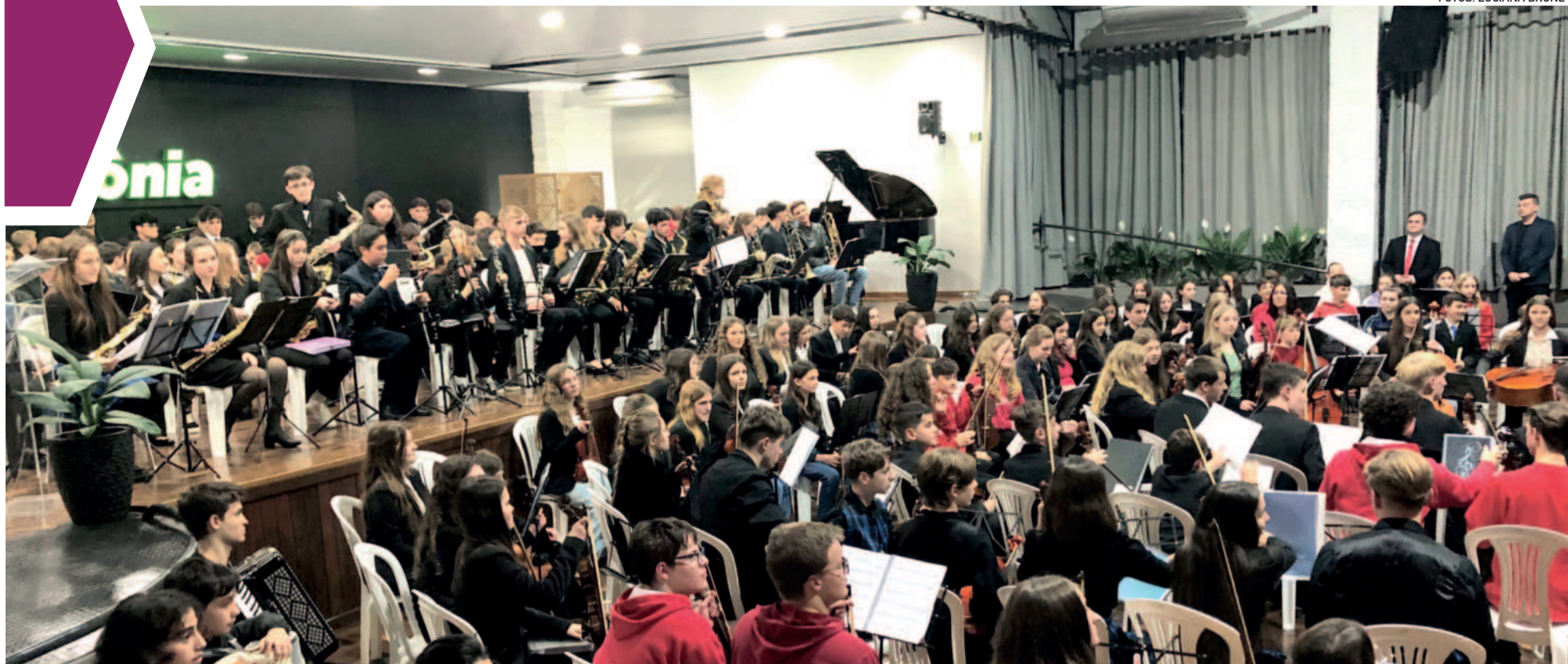
Grande Orquestra encerrou a noite com três apresentações