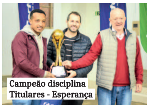
Campeão disciplina Titulares - Esperança