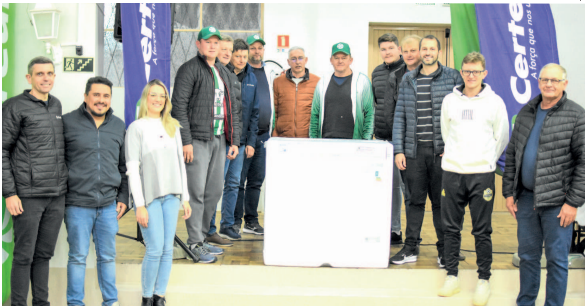
Campeão melhor disciplina geral - Juventude da Berlim