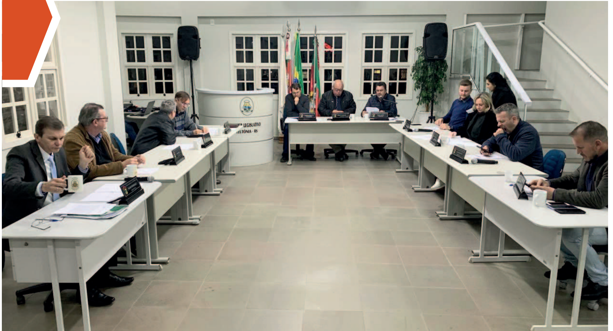
Esta deve ser a última sessão em que os vereadores fazem uso da tribuna, como é de praxe durante o período eleitoral