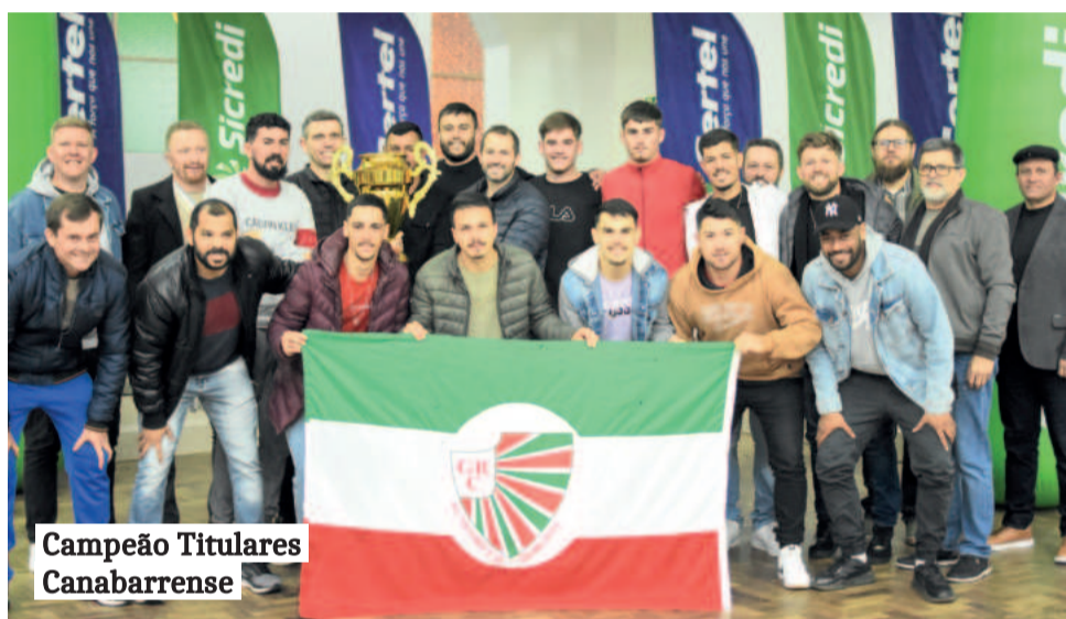
Campeão Titulares Canabarense