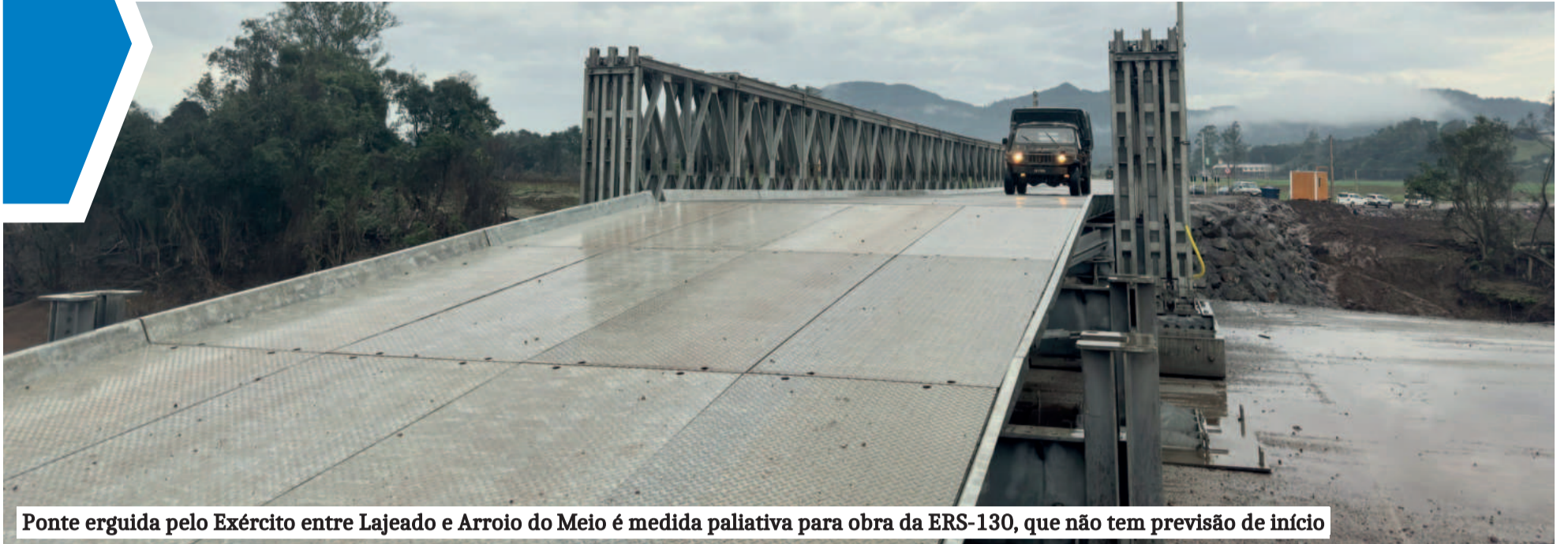
Ponte erguida pelo Exército entre Lajeado e Arroio do Meio é medida paliativa para obra da ERS-130, que não tem previsão de início

VALE DO TAQUARI ▶ 90 DIAS APÓS A ENCHENTE