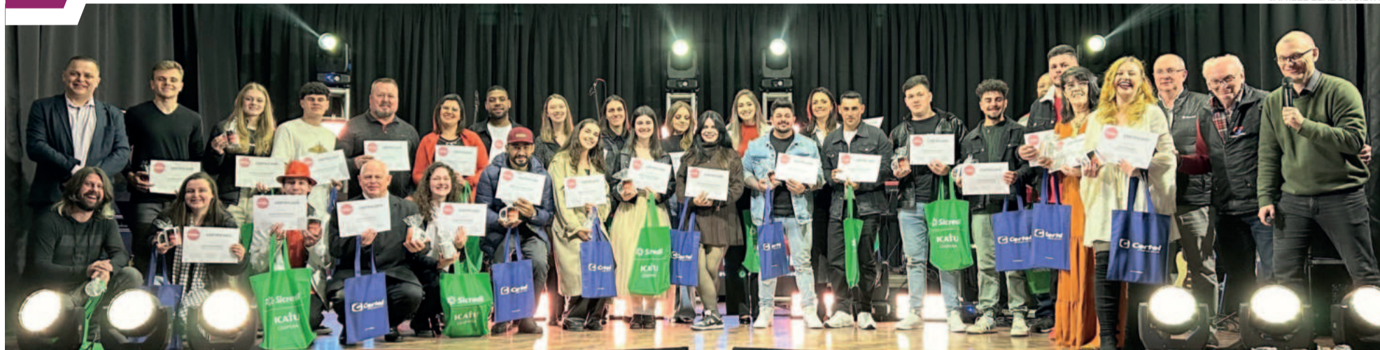
Os 29 participantes da categoria Livre receberam certificados após as apresentações