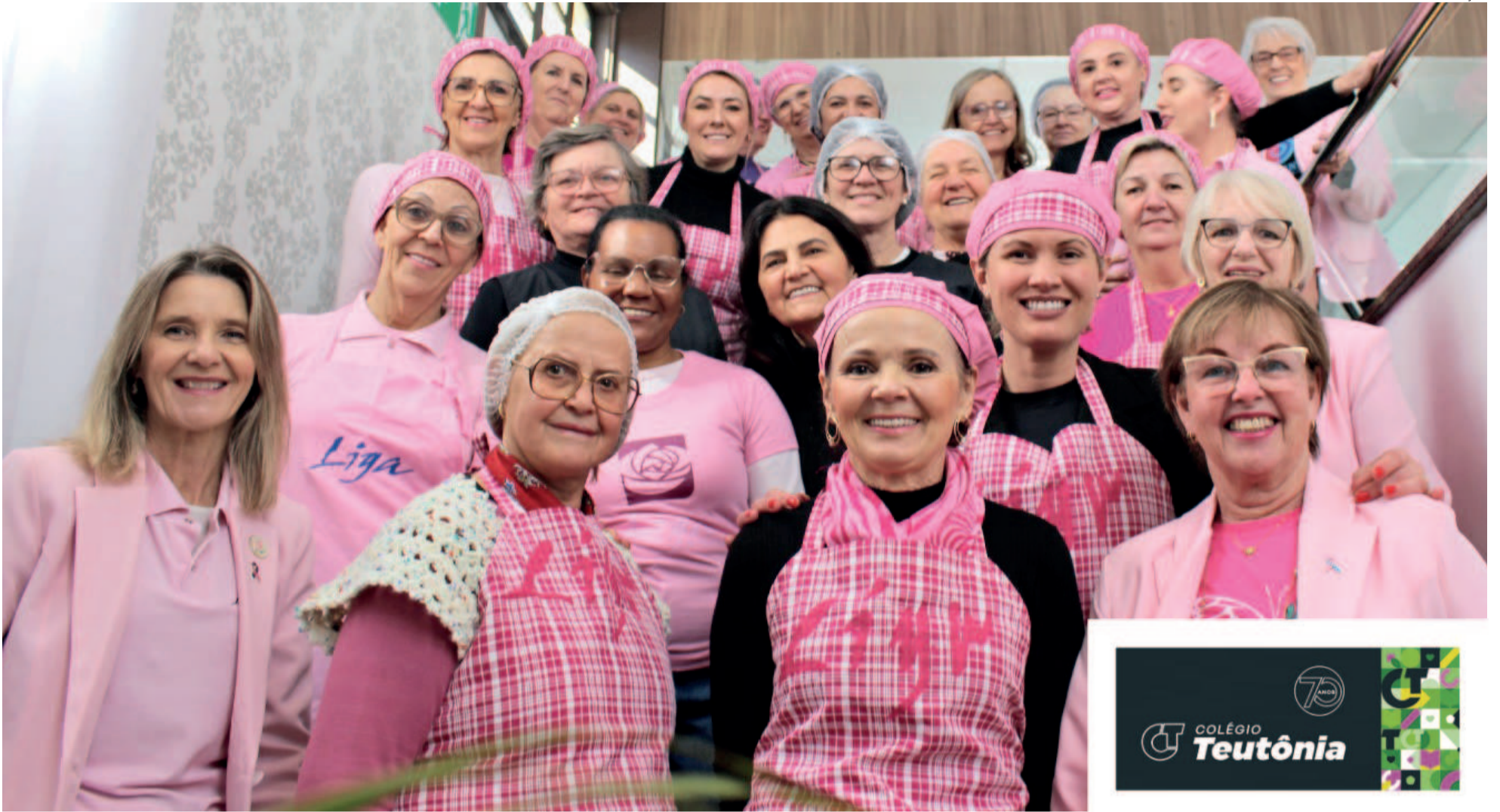
Café colonial é realizado há mais de 20 anos pela entidade