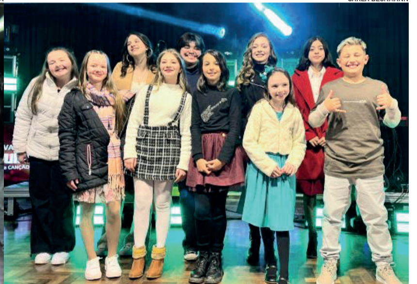
Classificados da categoria Juvenil

As noites de sexta-feira e sábado marcaram as etapas classificatórias do 4º Festival Popular da Canção. Os 21 candidatos da categoria Juvenil subiram ao palco do auditório do Colégio Teutônia na noite de sexta-feira (9/8), e os jurados escolheram os 10 finalistas. Os 29 candidatos da categoria Livre apresentaram-se no sábado (10/8), e os jurados também elegeram os 10 melhores para a etapa final, marcada para dia 14 de setembro.