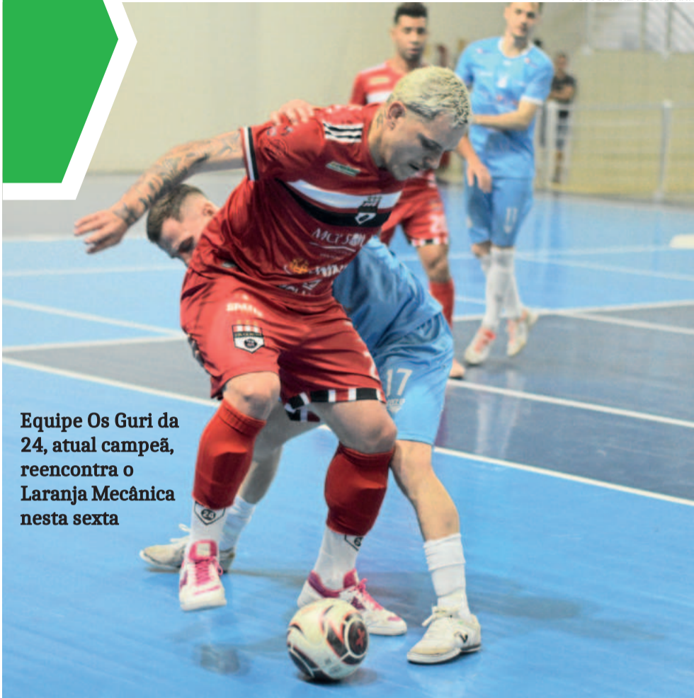
Equipe Os Guri da 24, atual campeã, reencontra o Laranja Mecânica nesta sexta