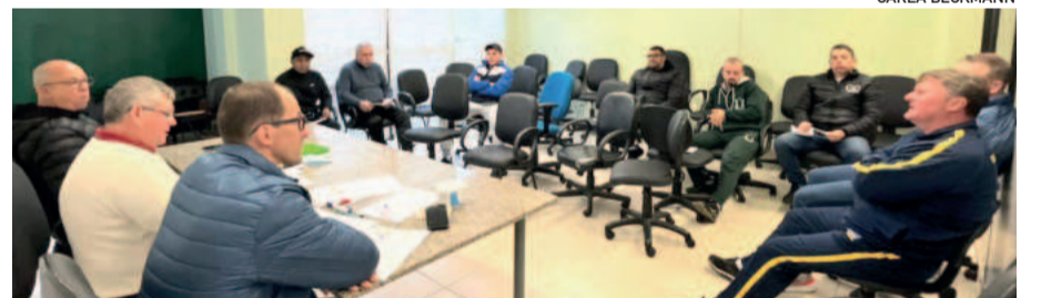
Reunião aconteceu na sede da Aslivata, em Lajeado