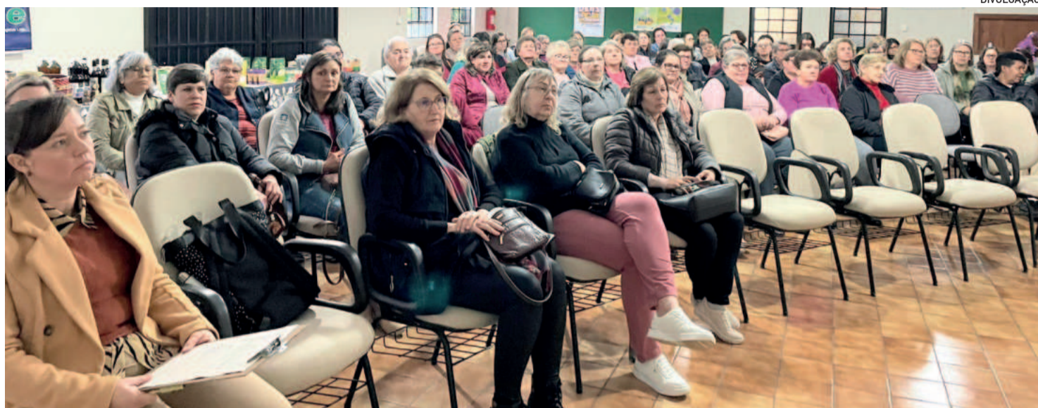
Integrantes de Teutônia, Paverama, Westfália e Cruzeiro do Sul participaram do evento

O lixo comum é um termo geralmente usado para descrever resíduos ou materiais que não são mais dese-