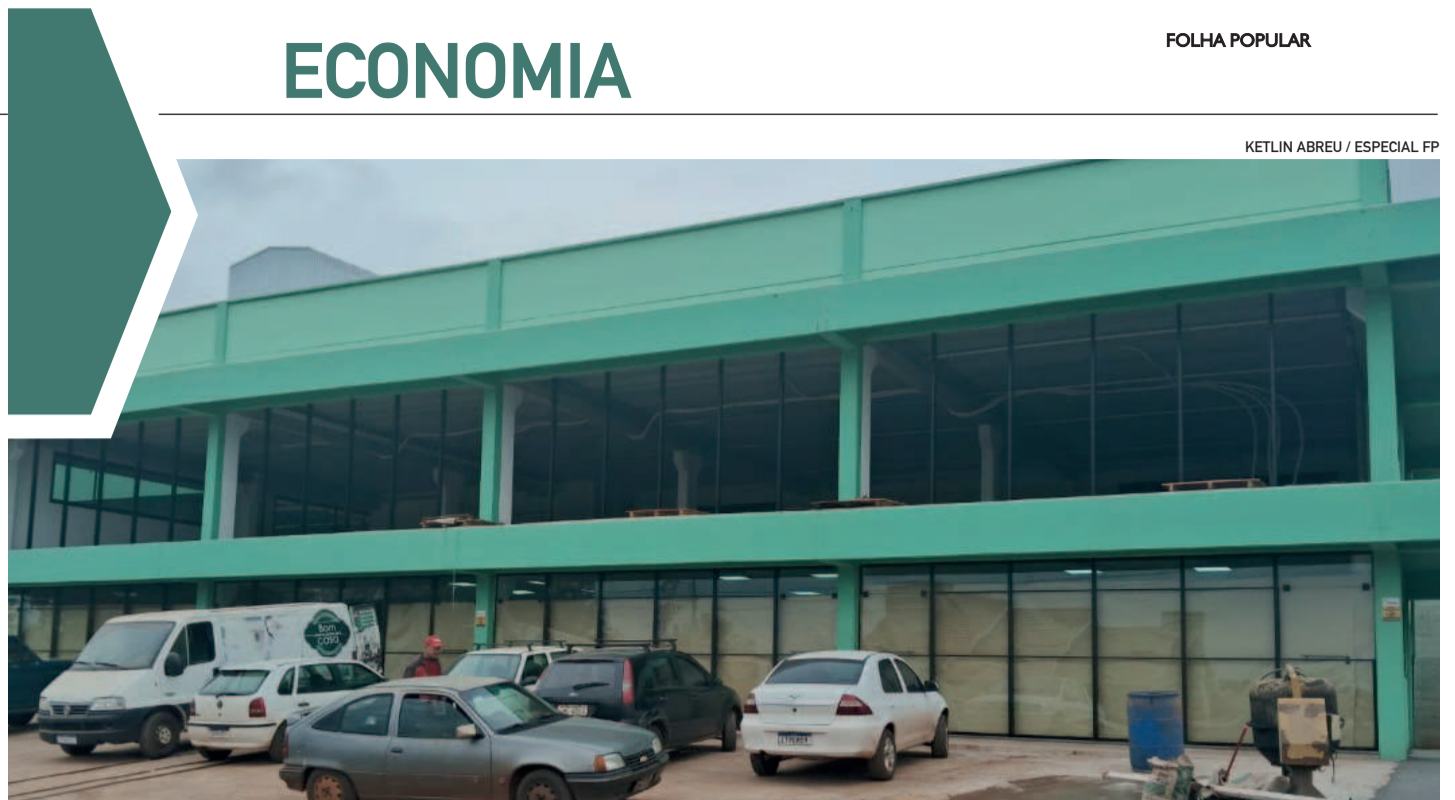
Prédio que abrigará o Agro Cooperagri ainda precisava ser finalizado

Portanto, quando bem administrado, o tempo é um aliado. Pouco diariamente é melhor que muito uma vez por mês. Sempre que você escovar os dentes, lembre-se e discipline também a sua saúde financeira.