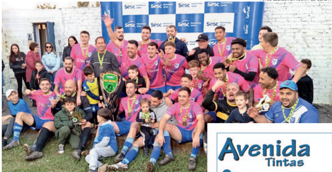
Taquariense é bicampeão nos Titulares