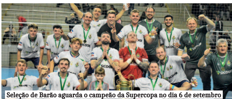
Seleção de Barão aguarda o campeão da Supercopa no dia 6 de setembro