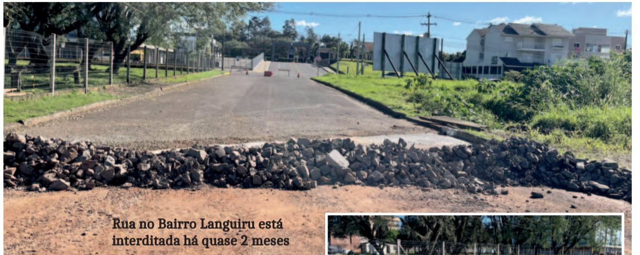
Rua no Bairro Languiru está interditada há quase 2 meses