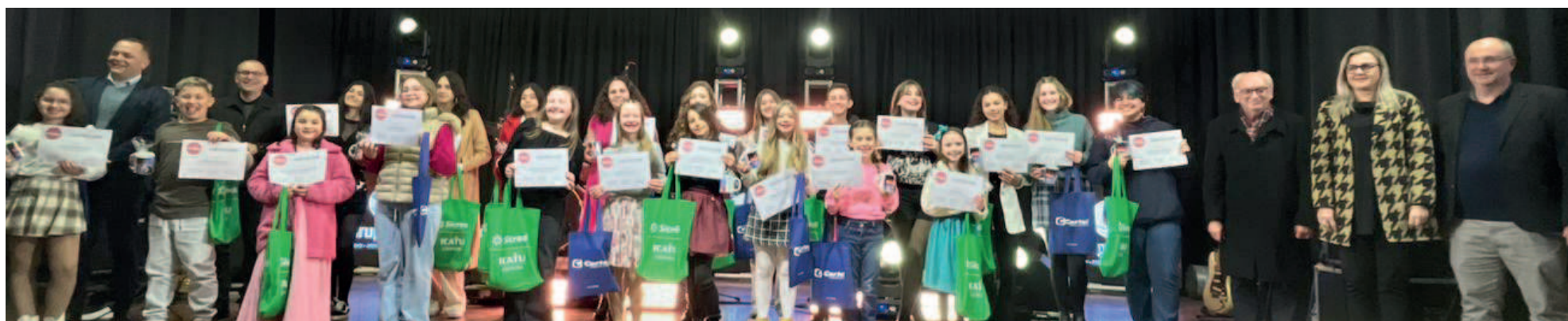
Os 21 participantes da categoria Juvenil receberam certificados após as apresentações