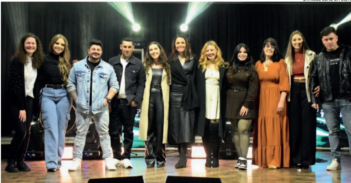
Classificados da categoria Livre