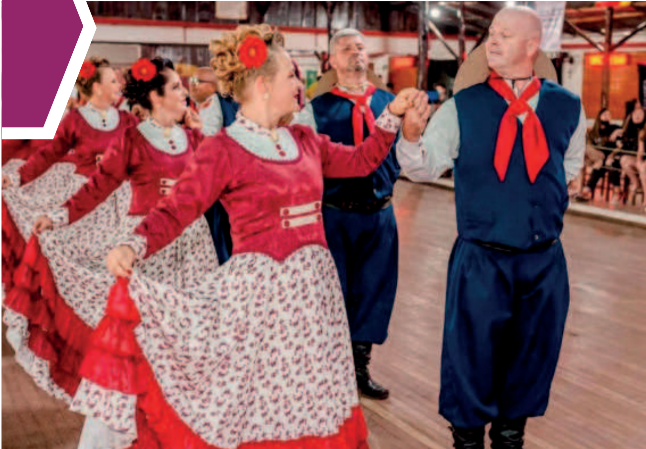
Atividades iniciam às 8h e se estendem por todo o domingo