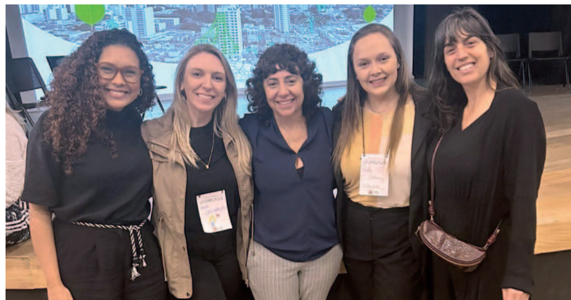
Entre os eventos, profissionais da educação participaram de seminários