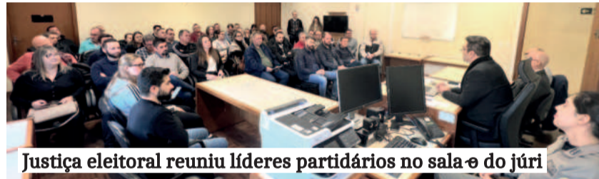
Justiça eleitoral reuniu líderes partidários no salão do júri