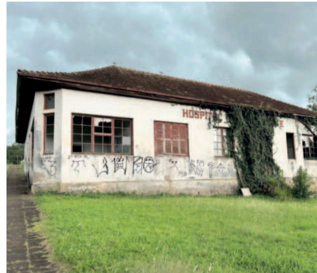
Área foi leiloada pela segunda vez no início de julho, mas não houve interessados