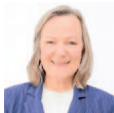
Candidata concorre a vereadora