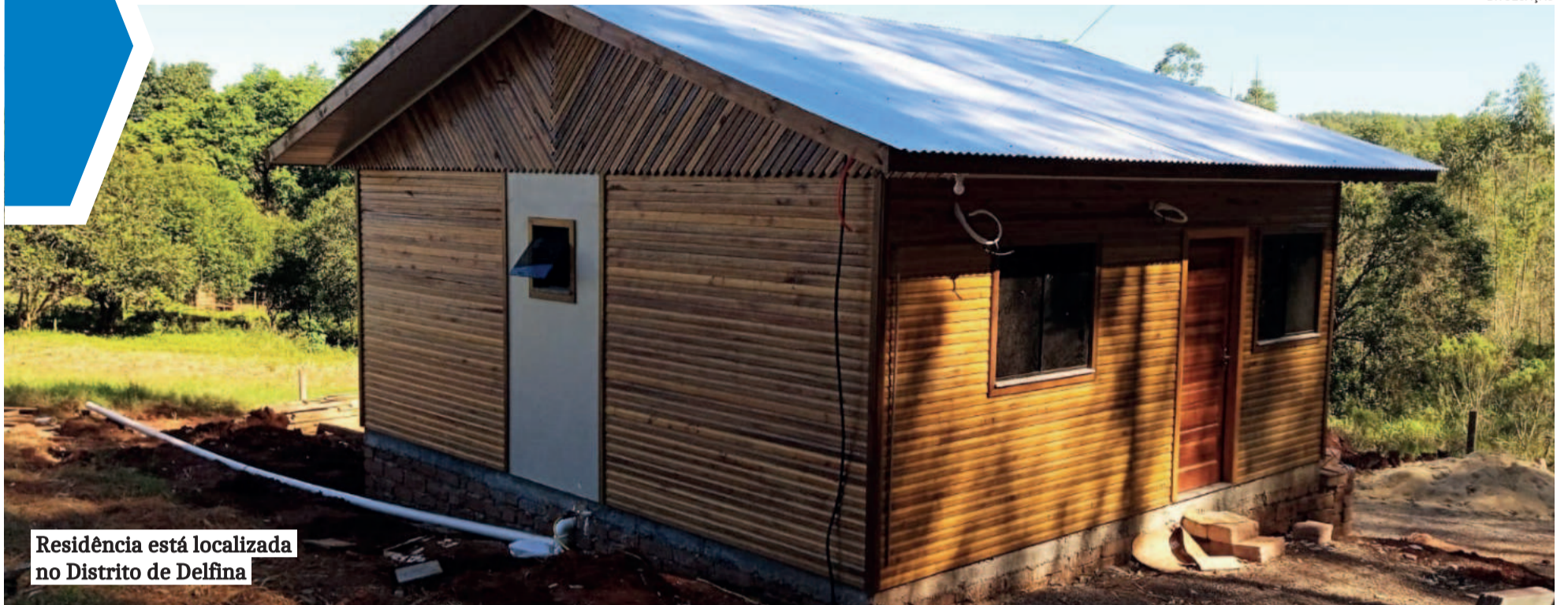
Residência está localizada no Distrito de Delfina