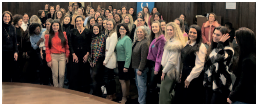
Próxima edição ocorre em 26 de novembro