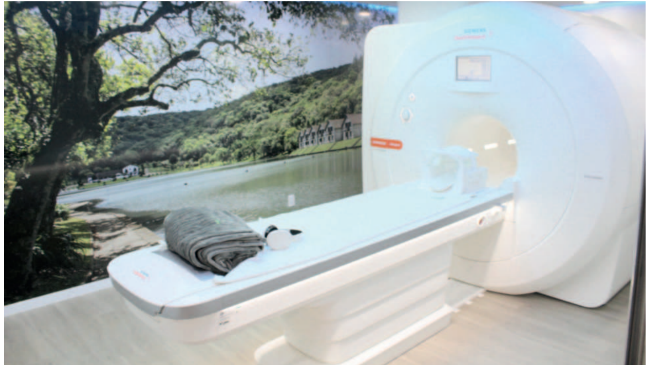
Equipamento de ressonância magnética garante alta definição em imagens e diagnóstico preciso